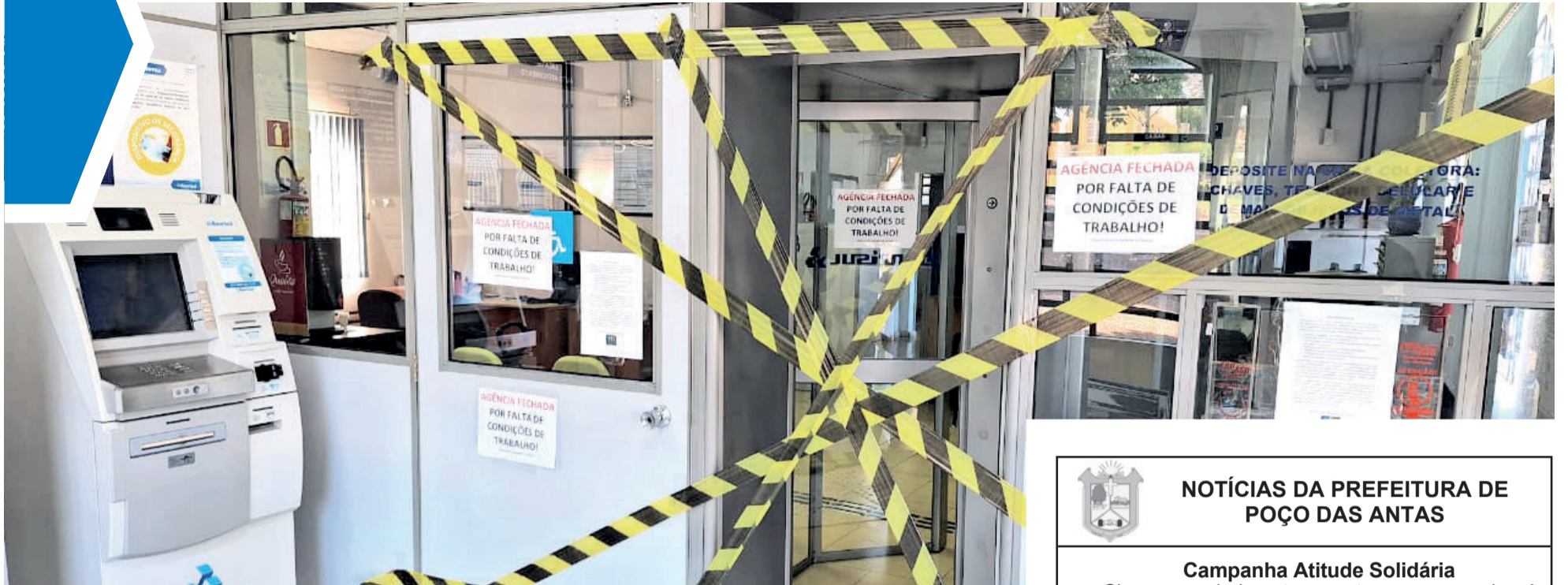
Espaço foi interditado pelo Sindicato, e Banrisul confirmou fechamento temporário

TEUTÔNIA ▶ QUESTÕES SANITÁRIAS E ESTRUTURAIS