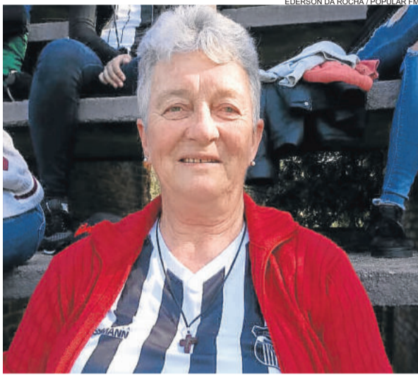
ÉDERSON DA ROCHA / POPULAR FM