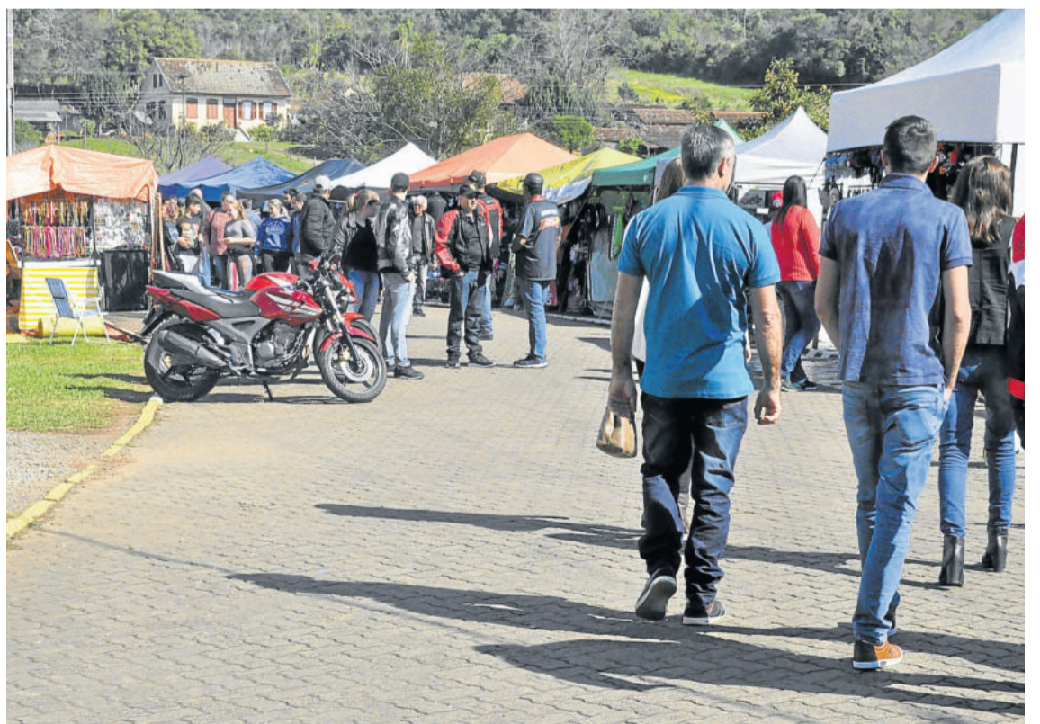
O visitantes prestigiou a feira do motociclista com diversos produtos