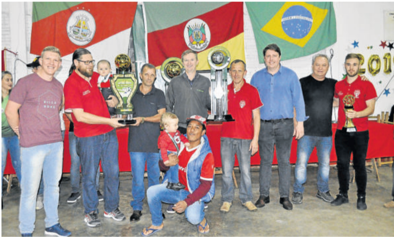
Atlético Gaúcho foi vice-campeão nos Titulares, mas campeão geral da disciplina