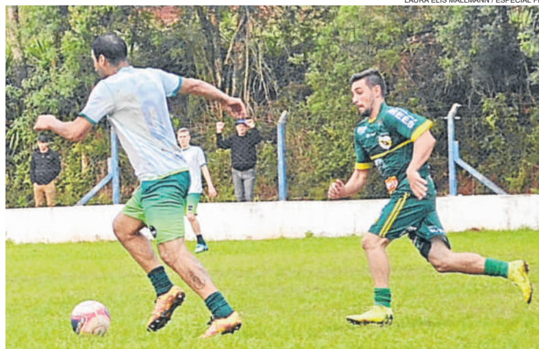
Rudibar até tentou buscar o resultado, mas Palanque se sobressaiu na partida

O primeiro gol saiu aos 40 minutos de jogo. Também em um lance de bola parada. A falta, na intermediária, foi cobrada por Jones, a bola