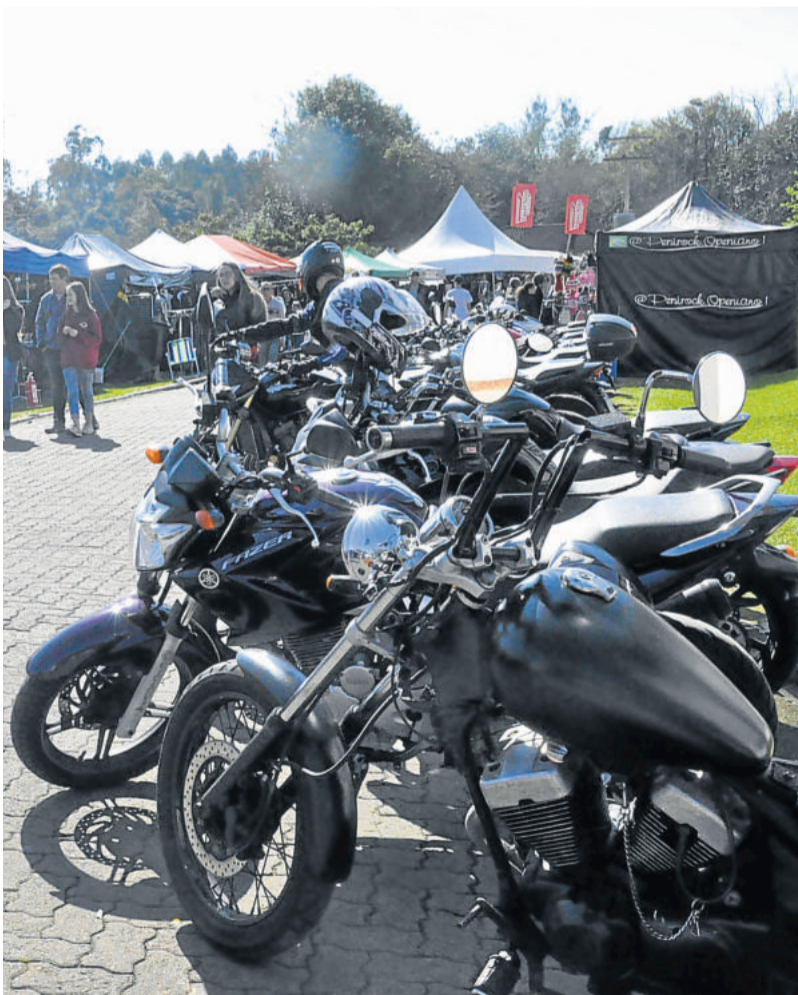
Motos, shows e feira fizeram parte do evento

O organizador considera ainda que a infraestrutura da MiMi é um ponto essencial e muito importante. “Não existe no Rio Grande do Sul encontro de motos com um parque assim”, pontua. Com a avaliação positiva, Martins afirma que a próxima edição já está sendo pensada. “Para 2020 vamos lançar a data até dezembro deste ano, e aí vem o terceiro Teutônia Moto Fest”, conclui.