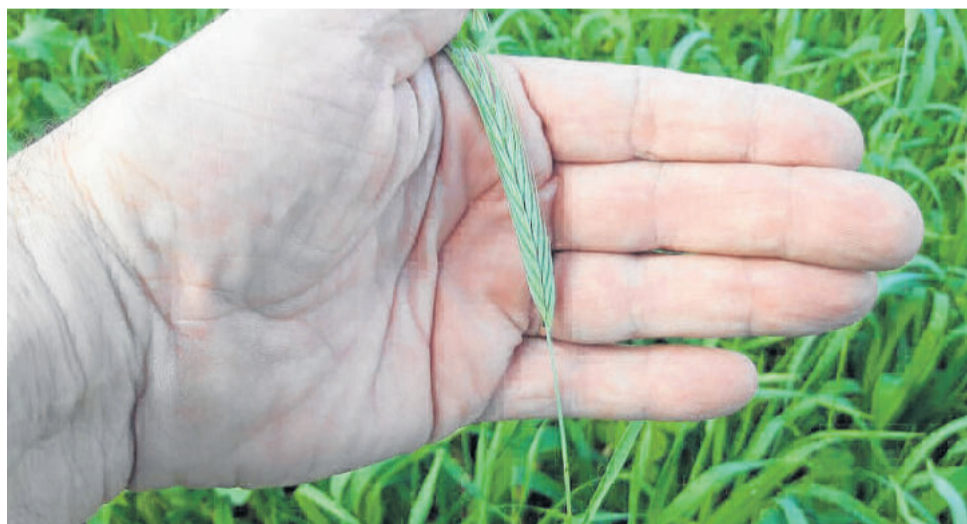
Produto das lavouras de integrante do Clube Amigos da Terra