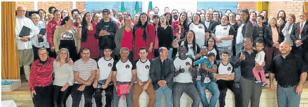
Seis corais se apresentaram na 8ª Noite dos Corais