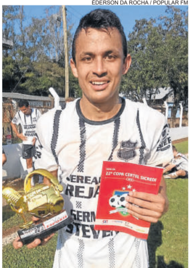
ÉDERSON DA ROCHA / POPULAR FM

Nome completo: Vinicius Padilha Apelido: Padilha Equipe: Palanque (Titulares) Posição em campo: Atacante Data de Nascimento: 16/03/1992 Cidade ou localidade onde mora: Venâncio Aires Faz o que na semana? Trabalha como vigilante Família: busca estar sempre perto da família.