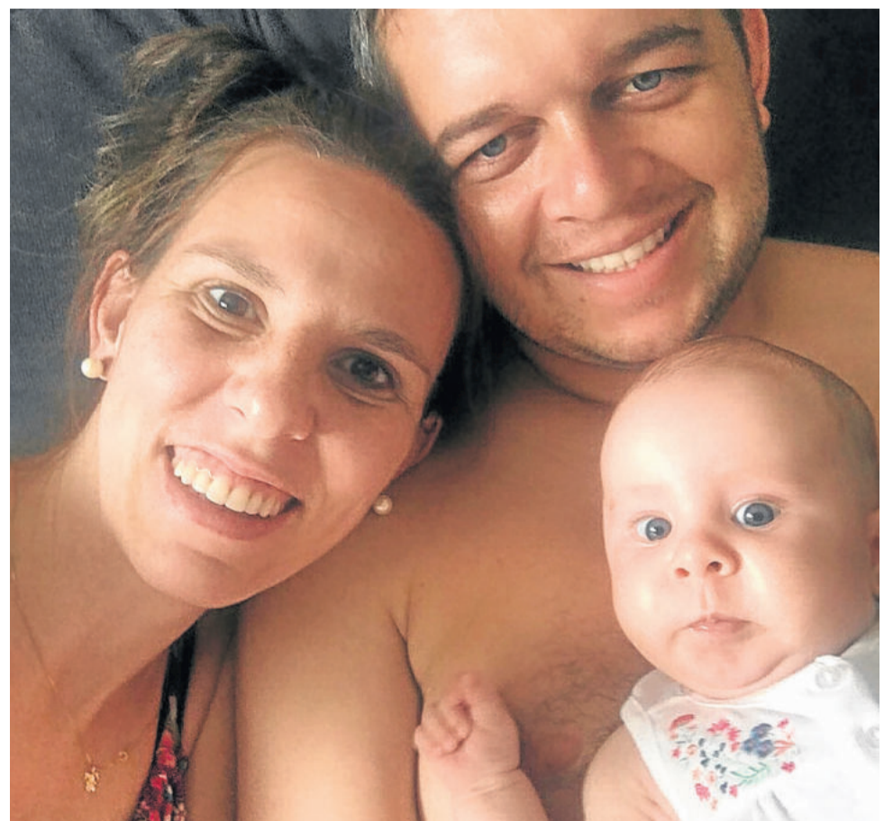
“Ter o apoio que estamos recebendo, e a chance de ver nossa filha vencendo a doença, é surreal”