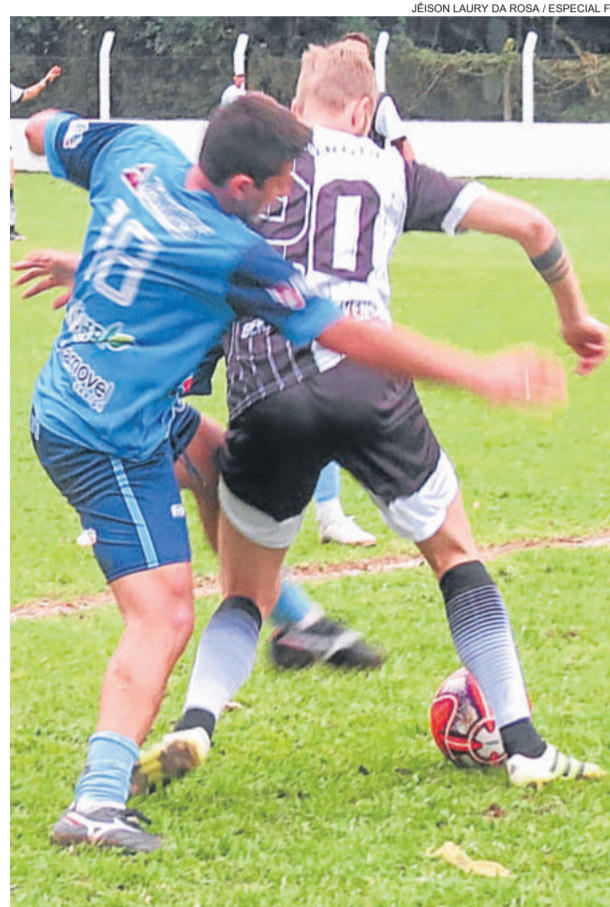
ECAS até criou oportunidades, mas não converteu em gols