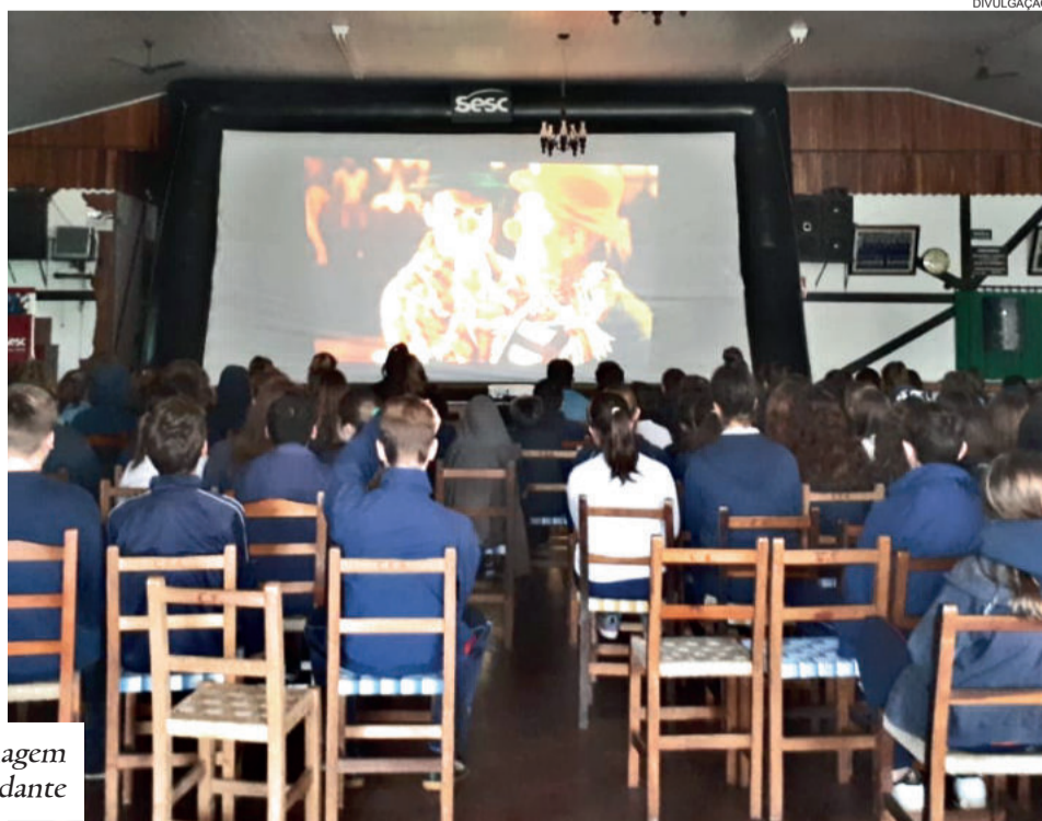
Programação foi homenagem ao Dia do Estudante

Na parte da manhã, os alunos de 5º ao 9º ano assistiram ao filme “O Palhaço” e na tarde, as turmas de 1º ao 4º ano, assistiram “Eu e Meu Guarda-Chuva”.