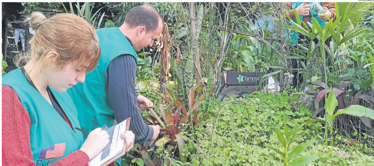
Será o terceiro Lira, dos quatro programados para o ano

Nos dois primeiros Liras do ano, situações distintas foram encontradas. Em fevereiro, das amostras coletadas, 68 foram encaminhadas ao laboratório da 16ª Coordenadoria Regional de Saúde (CRS) do Estado para análise das larvas e identificação da espécie. Destas, seis deram resultado positivo ao Aedes aegypti . Em maio, das 66 amostras encaminhadas, trinta e cinco foram identificadas, mas apenas para o mosquito Aedes albopictus , uma espécie muito parecida a do Aedes , que se cria em condições e ambientes muito parecidos ao do aegypti . Em Estrela, houve apenas um caso da doença registrado no ano, mas considerada “importada”, ou seja, não contraída no município. Tratou-se de um morador que visitou a Paraíba a trabalho, onde começou a ter os sintomas.