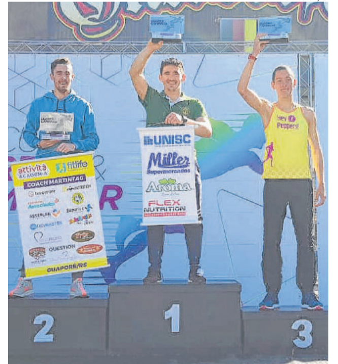
Kommer venceu a prova em Santa Cruz