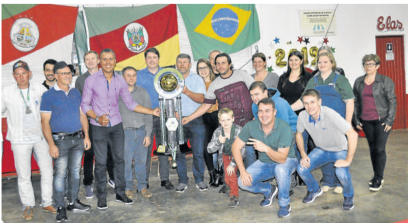
Juventude de Linha Frank comemorou o título nos Titulares e outras premiações individuais