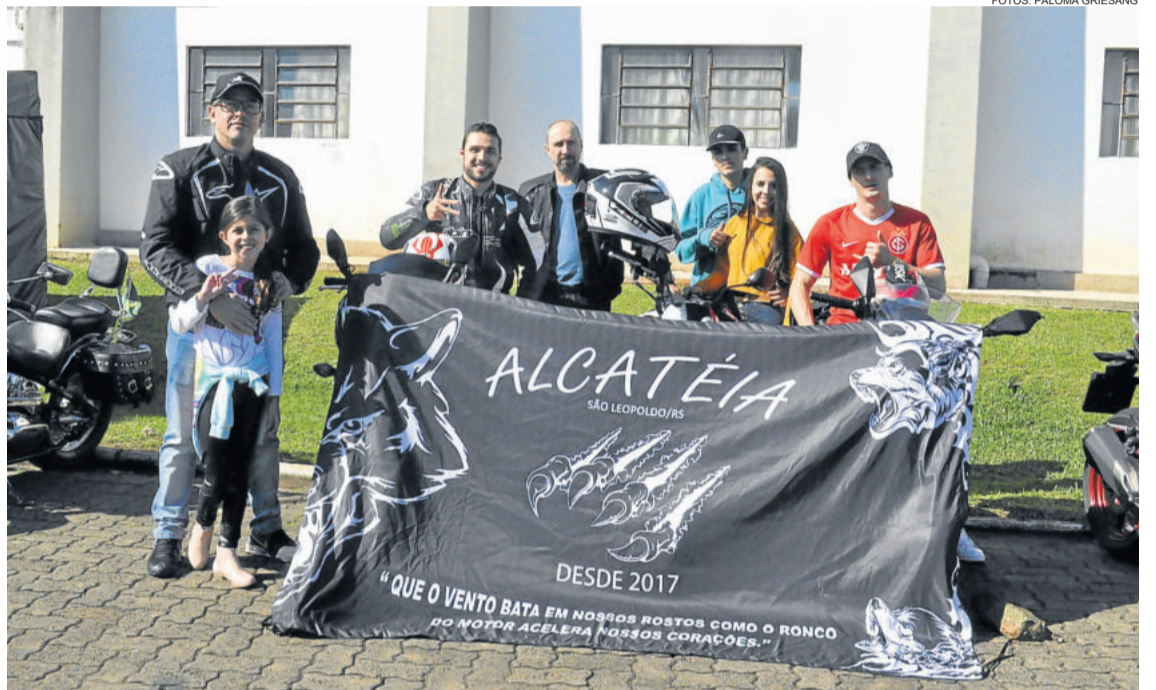
Motogrupo Alcateia veio de São Leopoldo para o Teutônia Moto Fest

A organização do evento também avaliou com positividade a segunda edição do Teutônia Moto Fest. Mesmo com a previsão de chuva, reuniu um bom grupo de motociclistas que acamparam no local. “Este ano, na nossa área de