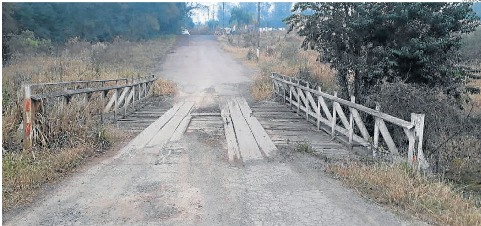
Início das obras devem alterar o trânsito

A medida é válida tanto para pedestres quanto para motoristas. Esta obra faz parte do Programa Avançar Cidades, em que o Município de Paverama investirá R$ 4,8 milhões na pavimentação de 13 ruas e uma ponte. Deste valor, 5% é contrapartida do Município.