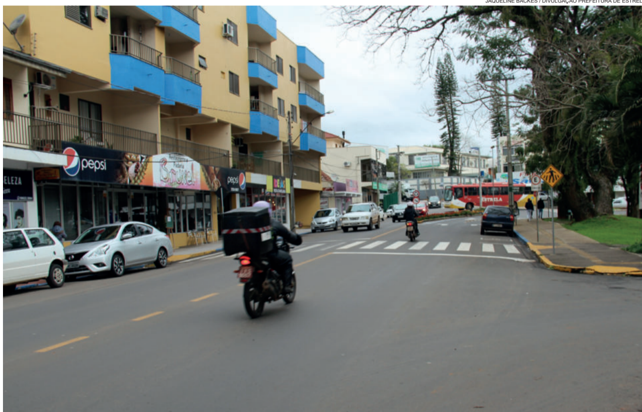
Ocorrências com motocicletas caíram nos últimos três meses: apenas três casos

Campeãs em ocorrências até dias atrás, motocicletas têm significativa redução no número de ocorrências