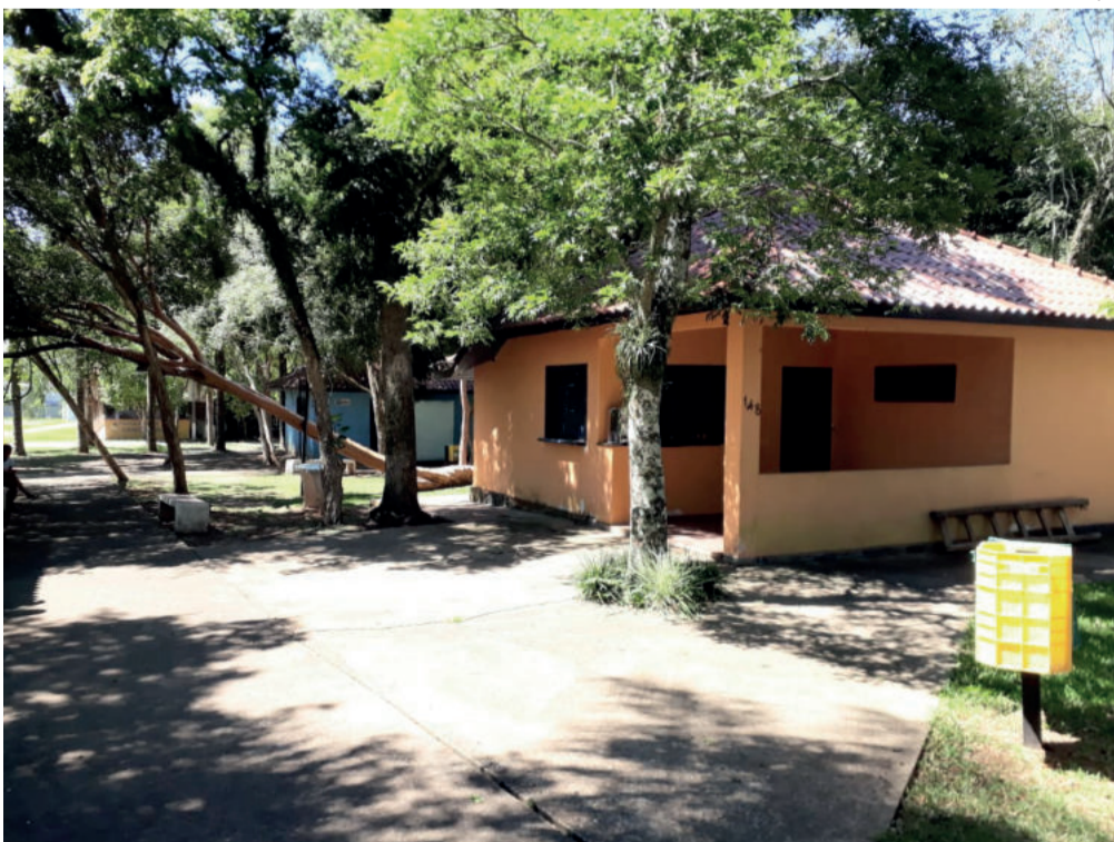
Quiosque está localizado no Parque 13 de abril