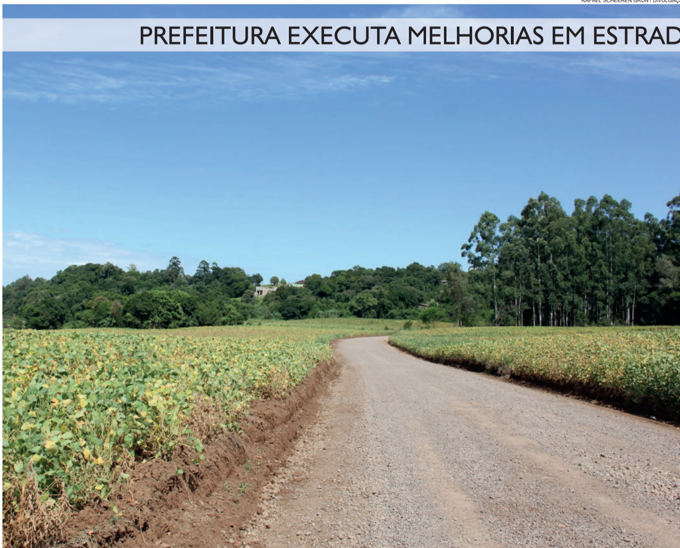
Estradas do Bairro Carneiros foram patroladas pela prefeitura, como é o caso da Rua Lindolfo Labres

Outra frente de trabalho se dá no Bairro Carneiros, onde a Seosp executa um trabalho que deve levar alguns meses. Conforme o secretário, dois trechos da Rua Pedro Ruschel Sobrinho terão o nível da estrada elevado em cerca de dois metros, a fim de evitar que os moradores fiquem ilhados durante enchentes maiores. Para realizar o serviço, serão utilizadas grandes pedras como base para a estrada ter seu nível elevado, motivo pelo qual o trabalho será realizado conforme a disponibilidade desse tipo de material. “Vamos fazer aos poucos, elevando o nível da estrada nas laterais para não interromper a passagem de veículos”, destaca o secretário. Ele salienta, também, que as estradas do bairro Carneiros foram patroladas, com depósito de saibro e limpeza de valetas, a fim de melhorar as condições de trafegabilidade.