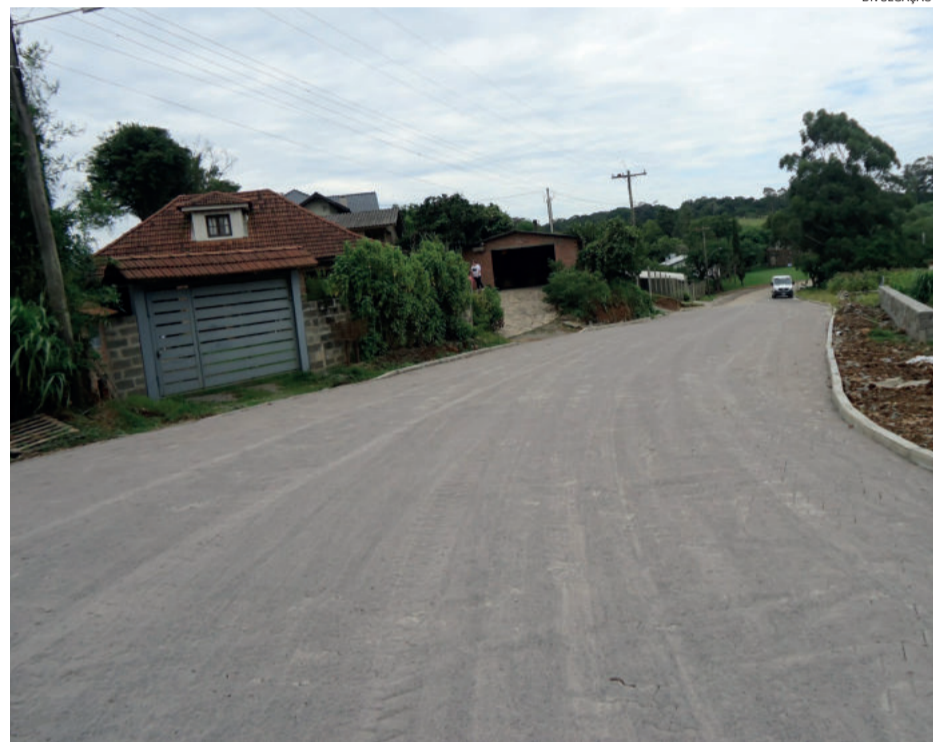
Estrada Borghetto à Linha Baú

Também segue em andamento a maior obra de infraestrutura realizada nos últimos anos em Garibaldi: o asfaltamento da avenida Perimetral Oeste. A via de quase 2,4 km liga a área urbana do município ao distrito industrial, e está recebendo um investimento de mais de R$ 4 milhões. Atualmente, estão sendo realizados os serviços de terraplanagem e detonações de rocha no local.