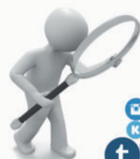
Univates abre inscrições para novas exposições

Seu anúncio está escondido em meio a milhares de postagens das redes sociais?