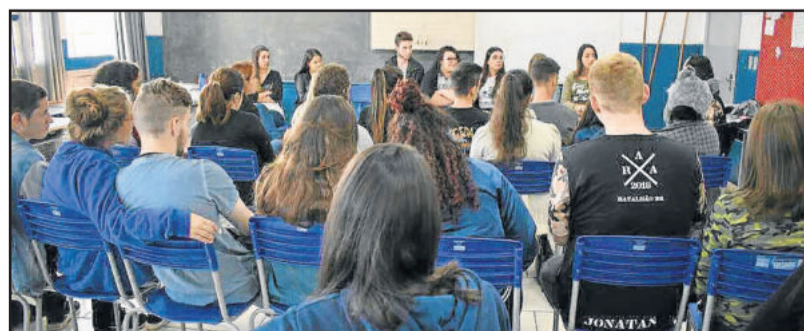
Atividades físicas foram uma das opções oferecidas para a comunidade