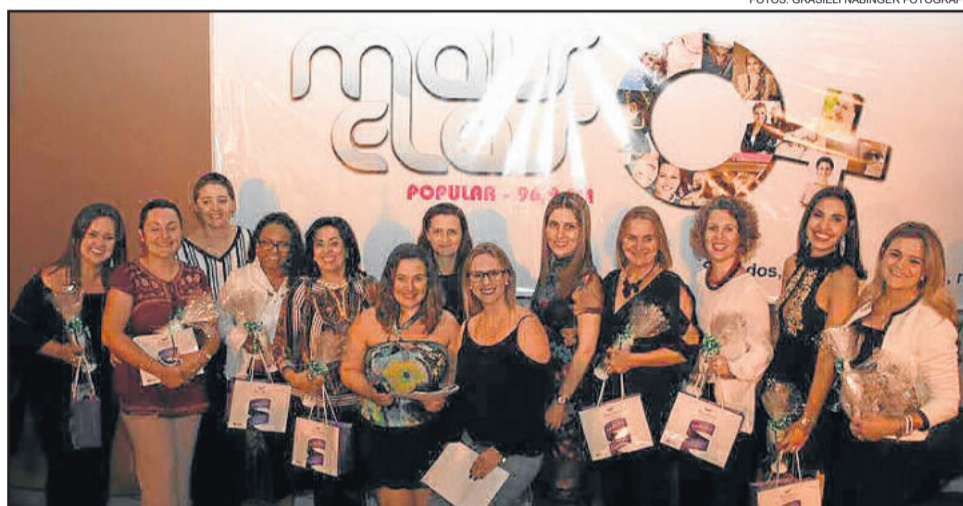
Mulheres inspiradoras opinaram durante o evento

A programação ainda contou com a participação de 10 mulheres que inspiram, cada uma opinando sobre dois temas diferentes, num momento de muita interação e troca de experiências entre as convidadas e o público que prestigiou o evento. Carreira, negócios, participação feminina na política, educação como meio de transformação da sociedade e das relações, liderança feminina em espaços predominantemente masculinos, transição de carreira, empregabilidade, inclusão, voluntariado, formação profissional, conciliação de carreira e outras escolhas da vida, machismo,