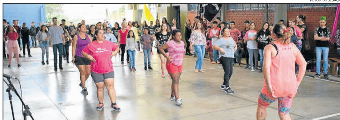
Conversa com ex-alunos fez parte da programação