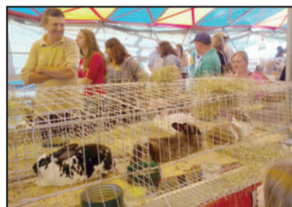
Exposição de animais