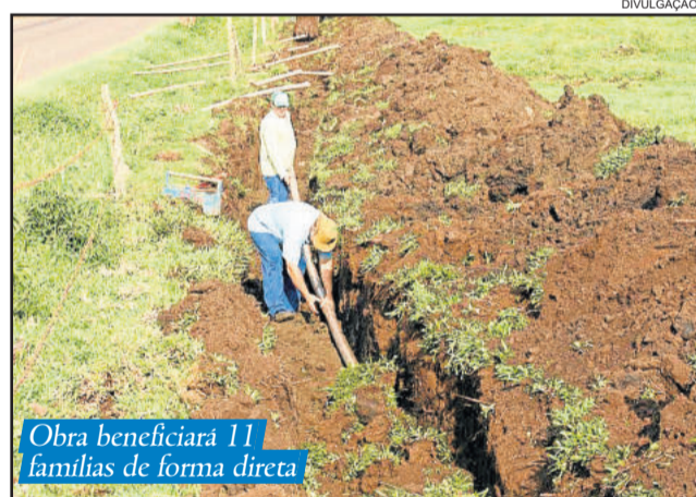
Obra beneficiará 11 famílias de forma direta