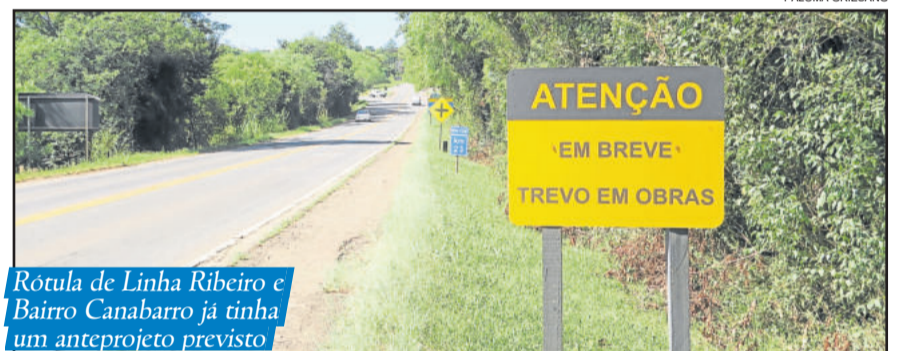
Rótula de Linha Ribeiro e Bairro Canabarro já tinha um anteprojeto previsto

çalves Engenharia, o valor final para elaborar o projeto ficou em R$ 19,8 mil. Ou seja, uma redução de 48,6%. O prazo para recurso encerrou ontem (05/03) ao meio-dia e nenhum participante apresentou contestação ao resultado.