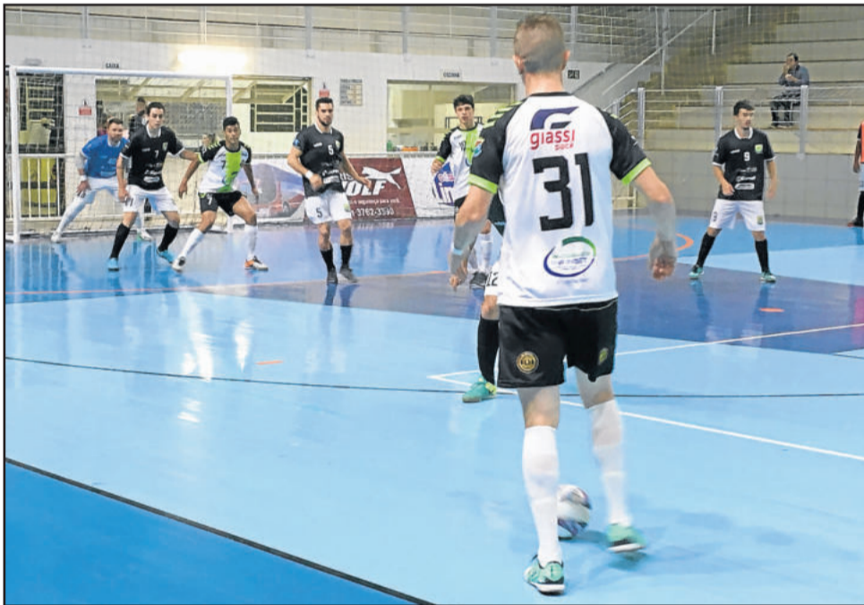
Teutônia Futsal conquistou importante vitória na noite de sábado