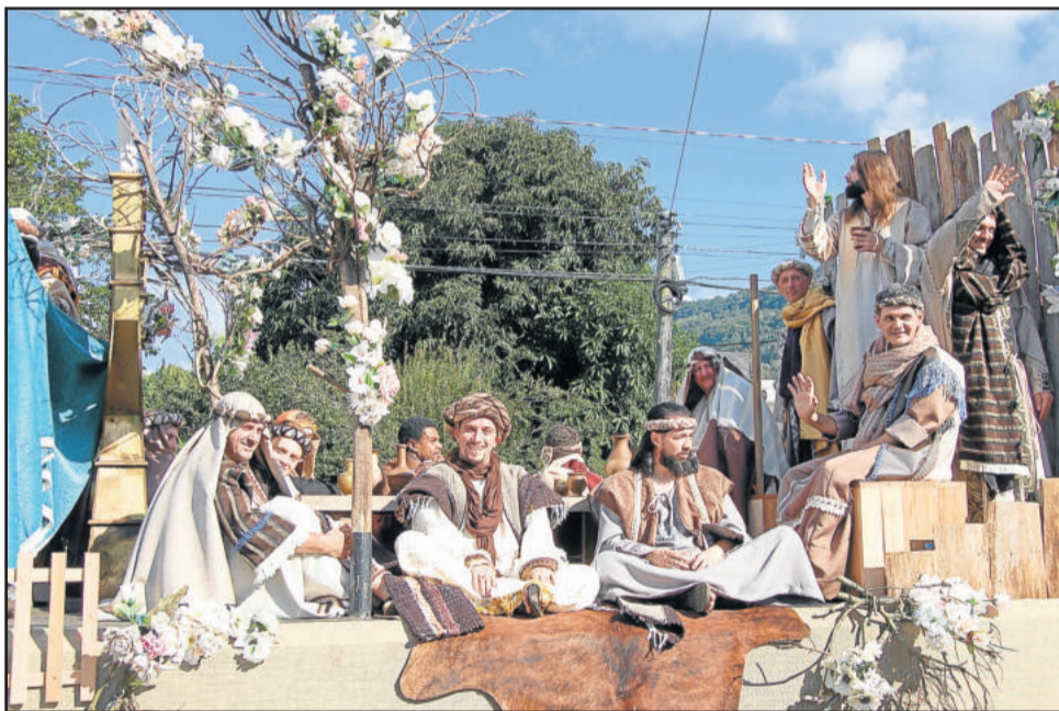
Atores da Paixão de Cristo divulgaram o evento

empresas de luminárias e utilidades domésticas, ainda confecções, calçados e produtos de higiene e limpeza, mostrando tudo que é produzido no Município.