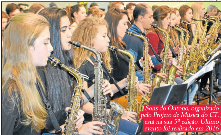
Sons do Outono, organizado pelo Projeto de Música do CT, está na sua 5ª edição. Último evento foi realizado em 2016

M ais de 200 instrumentistas, de dez orquestras, são esperados para o Sons do Outono 2018, evento promovido pelo Colégio Teutônia e que está em sua 5ª edição. O encontro ocorre no sábado, dia 19 de maio, no pátio do educandário, com início às 16h30min.