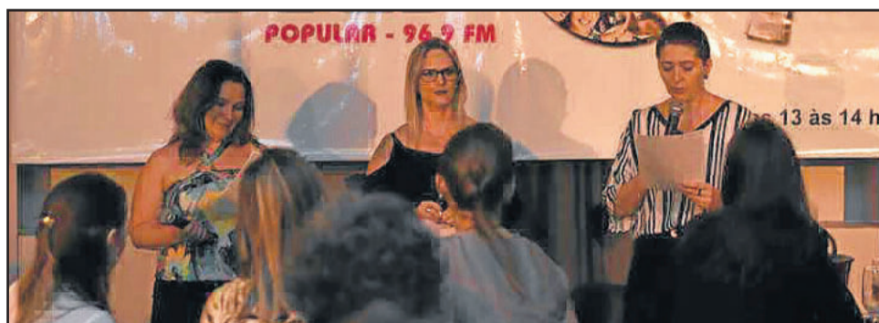
Mediadoras do Programa Mais Elas

desigualdade de gênero, serapação no relacionamento, educação dos filhos, qualidade de vida, cirurgia plástica, estilo de vida estiveram entre os temas debatidos.