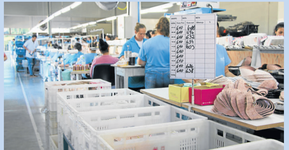
Incentivos às empresas calçadistas de grande porte têm impacto nos ateliers