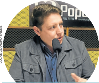
Prefeito de Teutônia, Jonatan Brönstrup

“Os prefeitos e os municípios tendo mais autonomia e acesso aos recursos, e não centralizando tudo no governo federal, quem irá ganhar é a população. É possível fazer mais pelo município, desde que tenhamos condições para isso.”