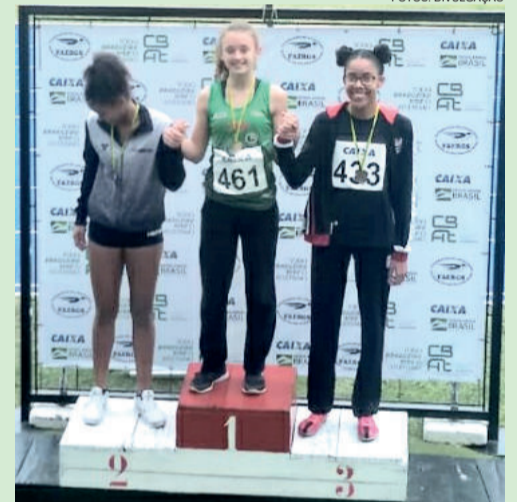
Atletas teutonienses subiram ao lugar mais alto do pódio: desempenho garantiu 4º lugar geral entre equipes