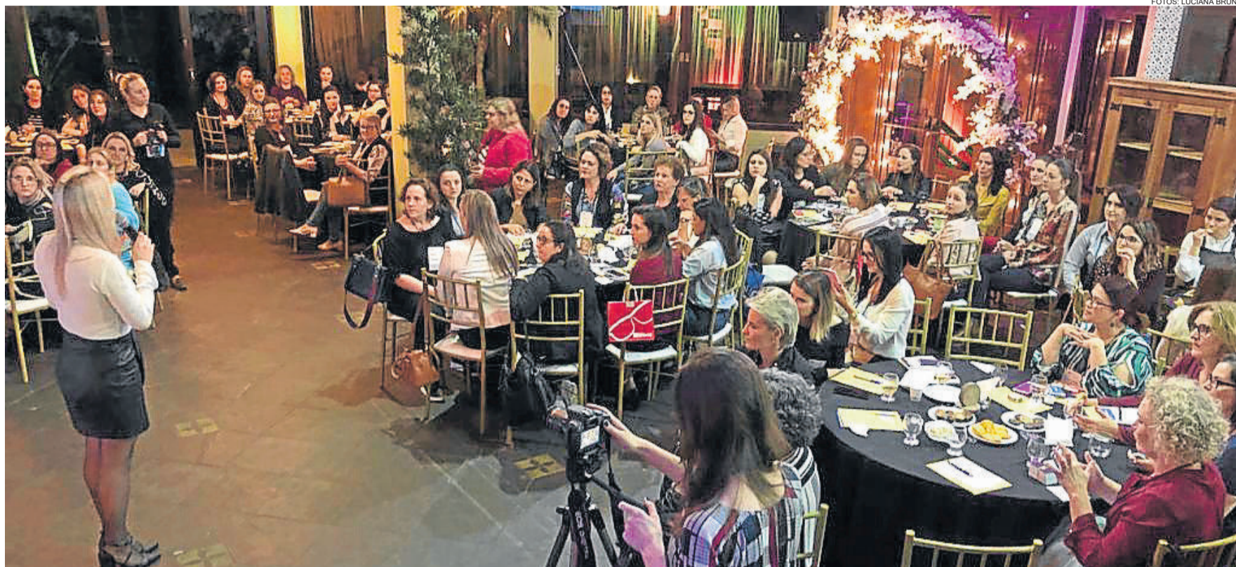
Dois palestras fizeram parte da programação