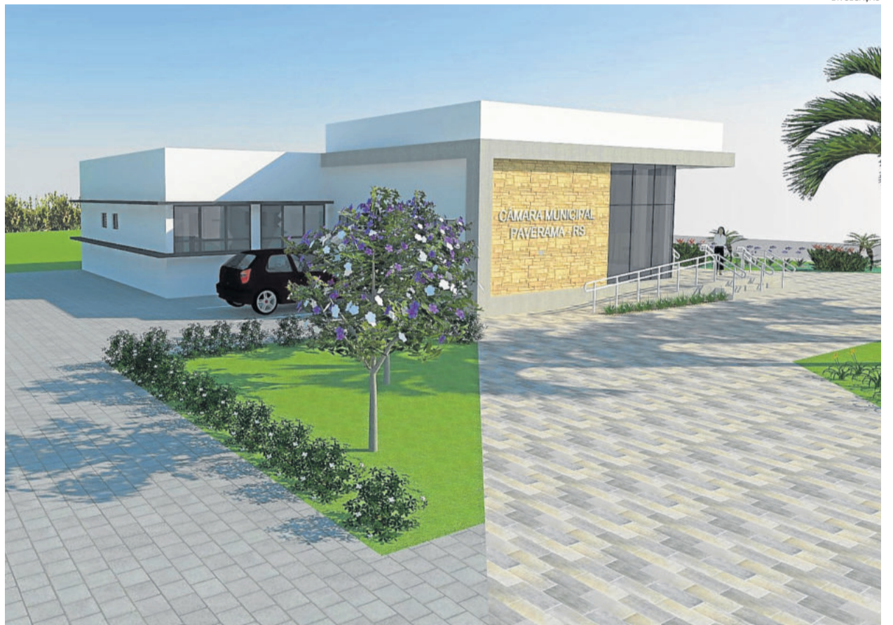
Projeto da Câmara de Vereadores, que deve ser finalizada em cinco anos