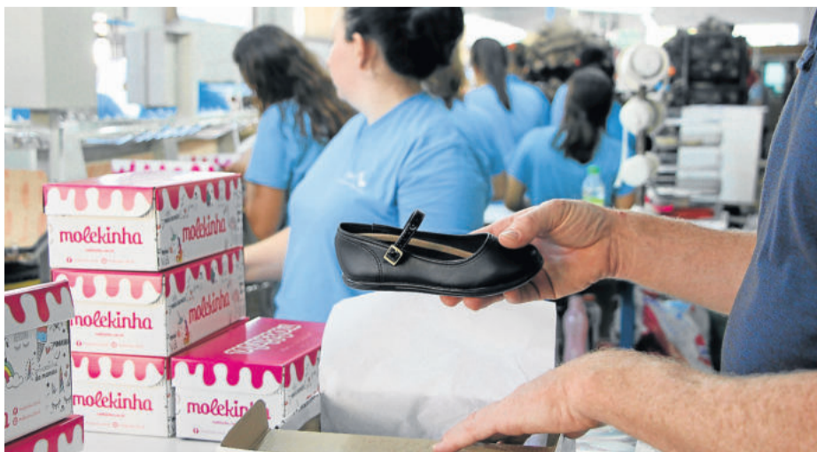
Setor calçadista é um dos que mais emprega em Teutônia