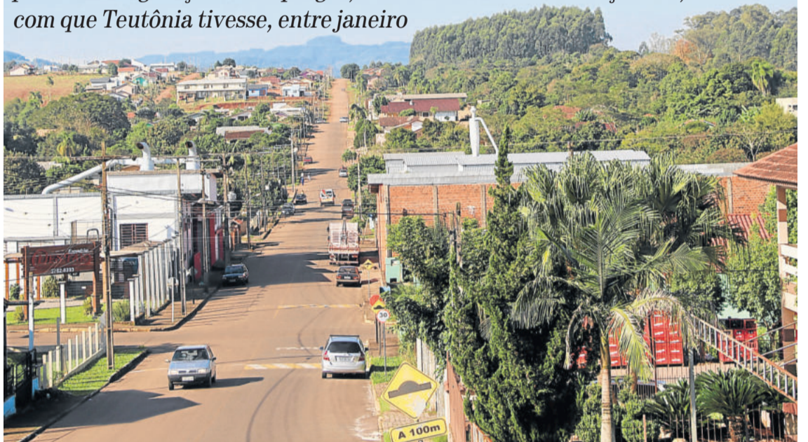
Região próxima à Calçados Beira Rio se desenvolveu após a instalação da empresa

Calçados Beira Rio e Piccadilly já receberam, em 2019, mais de R$ 990 mil em incentivos, o que impacta na geração de renda e desenvolvimento nos entornos das empresas, bem como beneficia os ateliers. Consequentemente, possibilita a geração de empregos, não somente no setor calçadista, fazendo com que Teutônia tivesse, entre janeiro