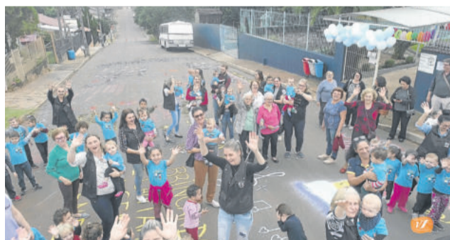
Homenagem dos alunos da escola

Há 40 anos, ao final do primeiro ano de atividades, a escola já contava com 50 crianças, hoje a escola atende 170 crianças de 0 a 5 anos e possui uma equipe de 33 funcionários e educadores.