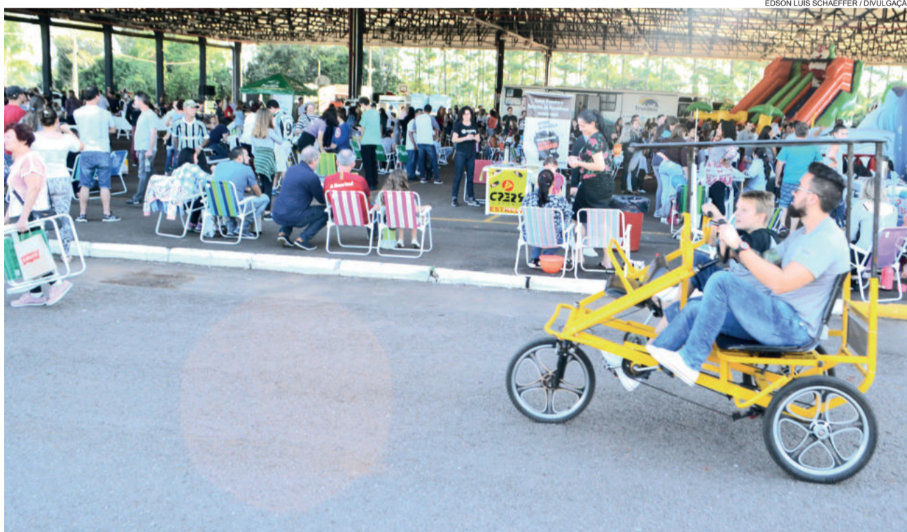
Evento contará com diversas atrações