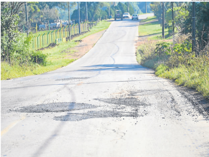
Melhorias foram realizadas na segunda-feira