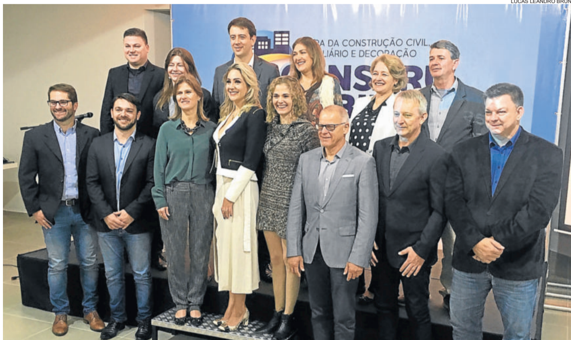
Comissão organizadora da Construmóbil 2019

O prefeito Marcelo Caumo, por sua vez, destaca os números de projetos protocolados no Município. São cerca de 1 mil por ano, o que equivale a 240 mil metros quadrados de construções. “Se dividirmos pelos dias úteis do ano, são entre quatro e cinco projetos protocolados todos os dias na Prefeitura”, aponta. Caumo aproveitou para agradecer o envolvimento da comunidade e das entidades na proposta de modernização do Plano Diretor.