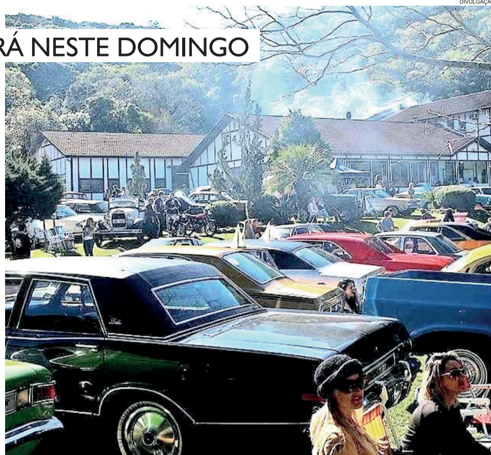
Evento prevê até 400 veículos sendo expostos