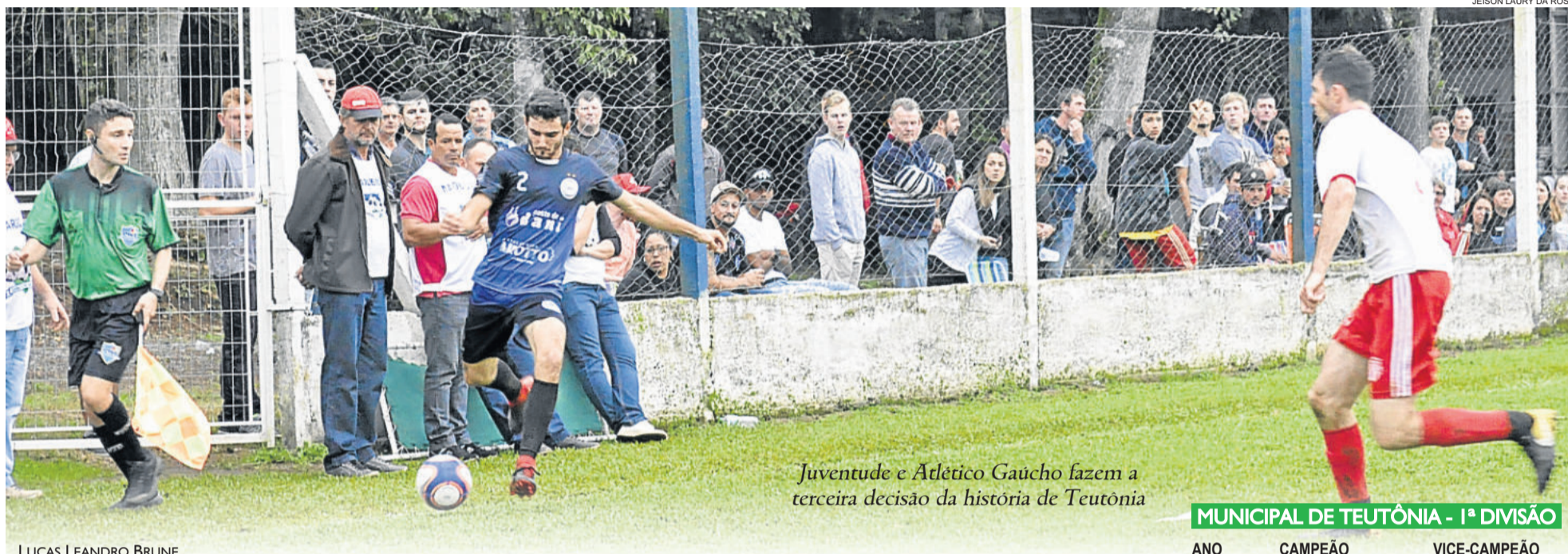
Juventude e Atlético Gaúcho fazem a terceira decisão da história de Teutônia