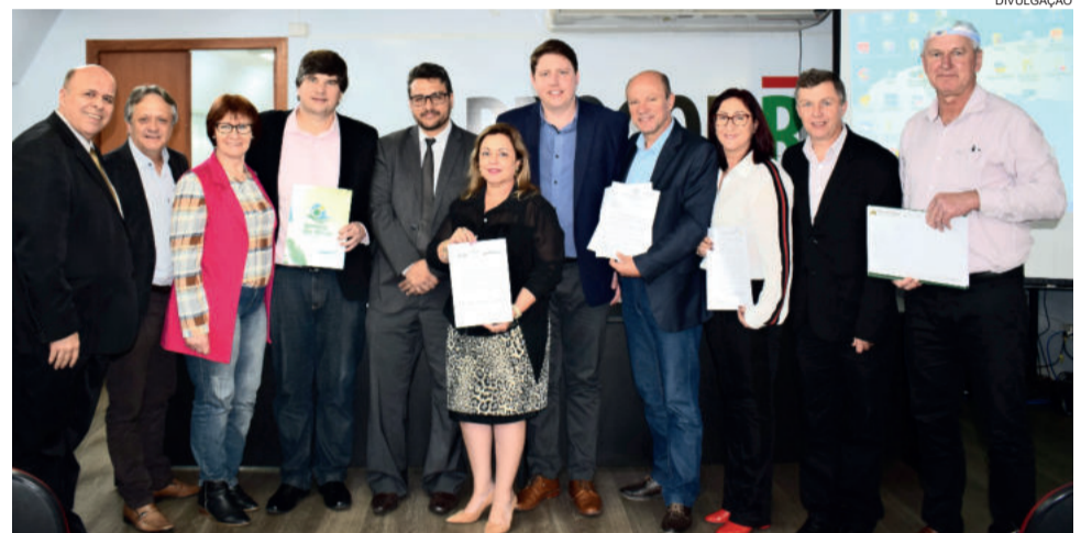
Deficiências na telefonia e no sinal de internet são levadas ao Procon/RS por comitiva de prefeitos do Vale do Taquari em audiência em Porto Alegre

Agora, após a audiência, os municípios do Vale do Taquari aguardam por medidas emergenciais para a melhoria do sinal de telefone, tanto fixo quanto móvel, e de internet.