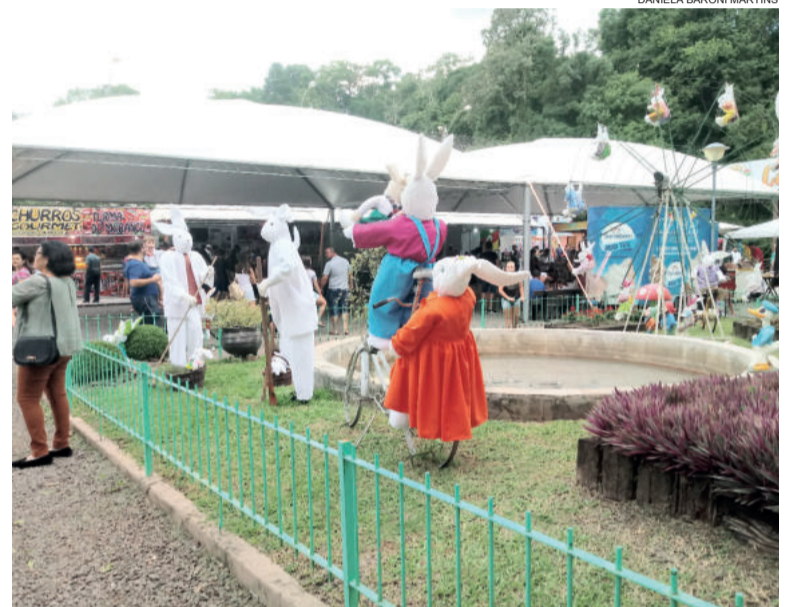
Programação principal ocorre na Praça dos Pássaros

18 de abril – Feira do Peixe das 9h30min às 13h 19 de abril - Caça ao Ninho das 14h às 18h; Trenzinho das 14h às 19h 20 de abril - Caça ao Ninho das 14h às 18h; Trenzinho das 14h às 19h; Apresentação do Conjunto Instrumental de Colinas das 15h às 16h