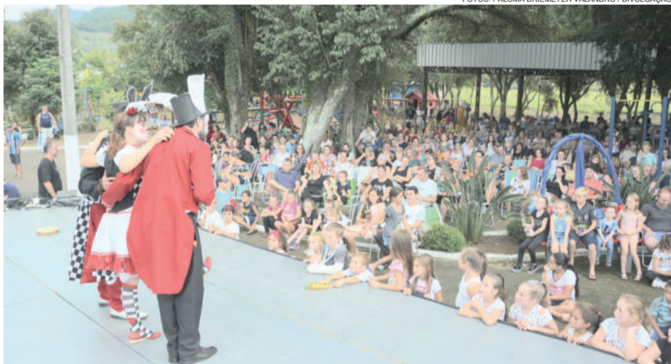
Bom público prestigiou a Páscoa na Praça