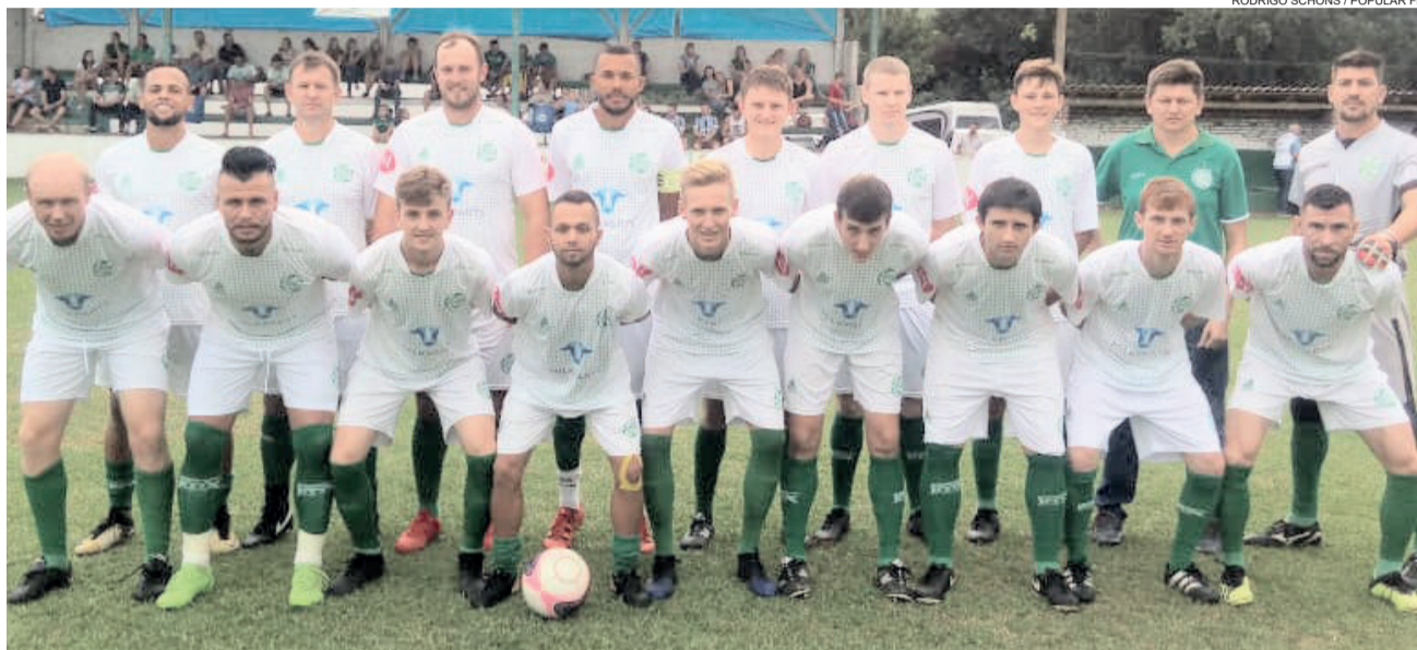
Juventude de Westfália conquistou a vaga com empate em casa