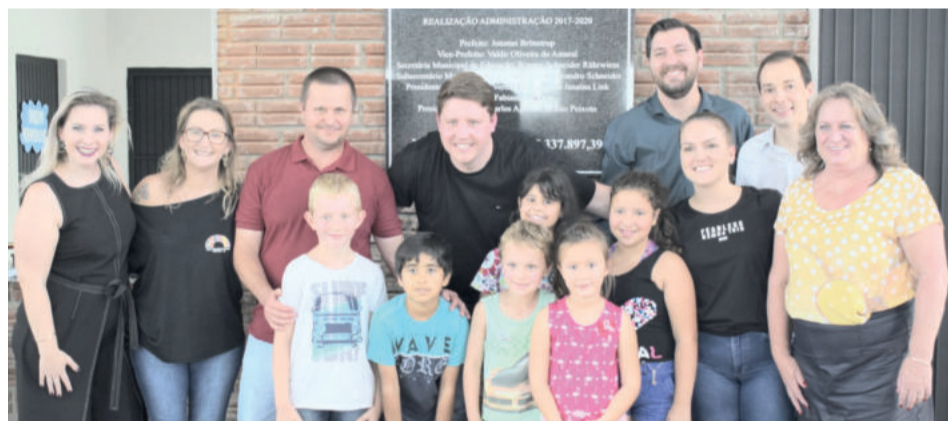
A solenidade contou com autoridades escolares, municipais, pais e estudantes

A edificação receberá reforma completa no andar térreo, de 354,67 metros quadrados, e receberá uma ampliação de 326,87 metros quadrados, contemplando cinco salas de aula, laboratório de aprendizagem, sala de reforço, sanitários masculino, feminino e adaptado, lavanderia e depósito. A capacidade de atendimento no prédio será ampliada de 180 para 280 alunos. “A gente está muito feliz com isso, nossa comunidade escolar merece. Há muitos anos, a escola não recebia melhorias. Nos sentimos bastante agradecidos e reconhecemos o empenho da administração.