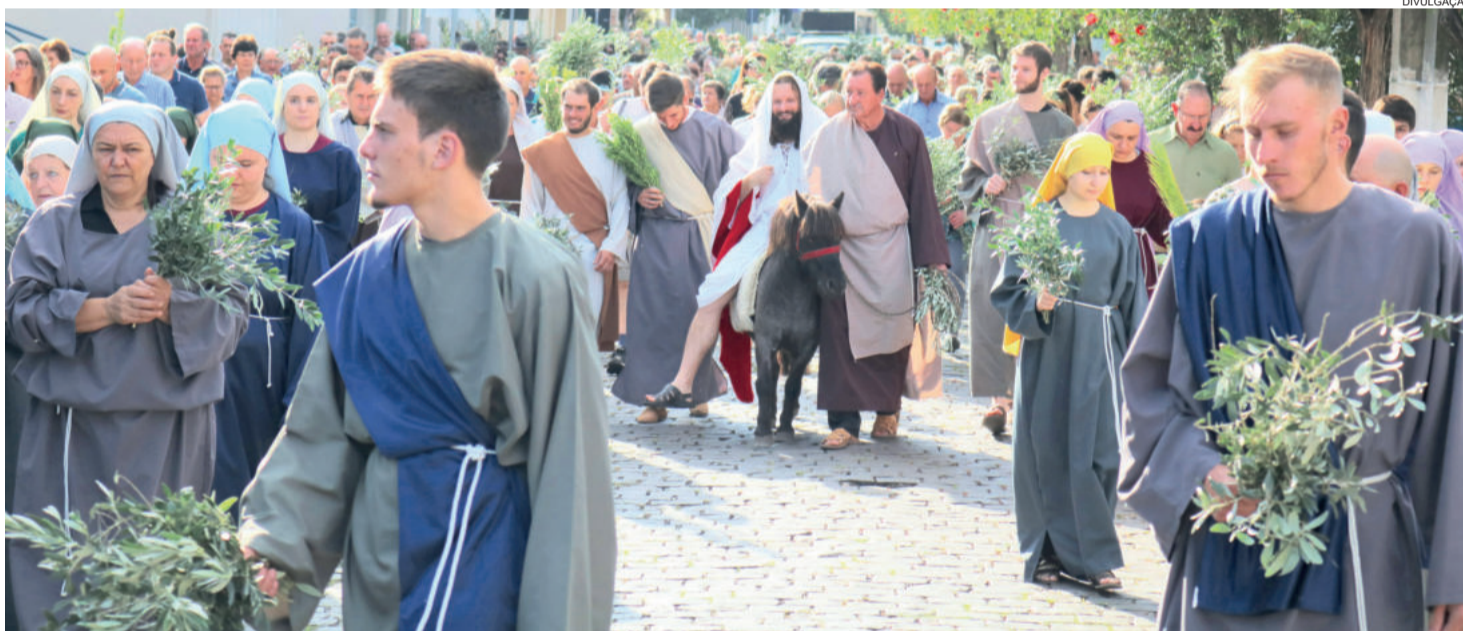
Movimento Emaús encenou a entrada triunfal de Jesus em Jerusalém