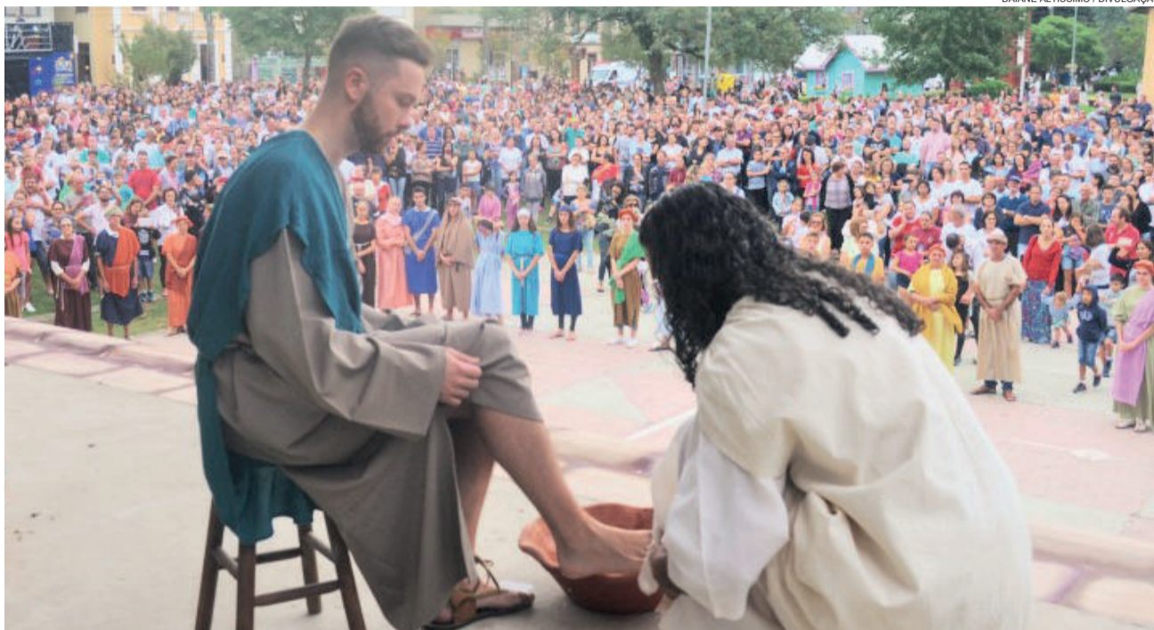
No ano passado, 5 mil pessoas acompanharam a encenação