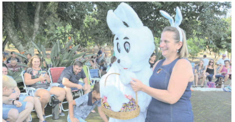
Na chegada, coelhinho da Páscoa distribuiu balas aos presentes

POÇO DAS ANTAS/RS | 10 A 12 Espera por Você! DE MAIO DE 2019