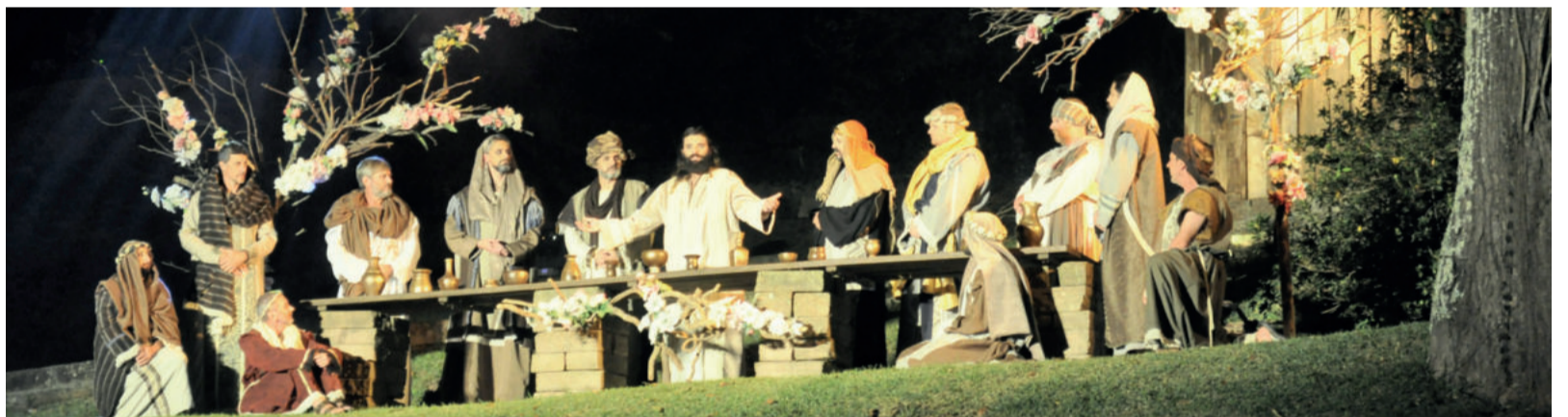
Cenas do espetáculo contaram as histórias de Jesus, como por exemplo, a Santa Ceia