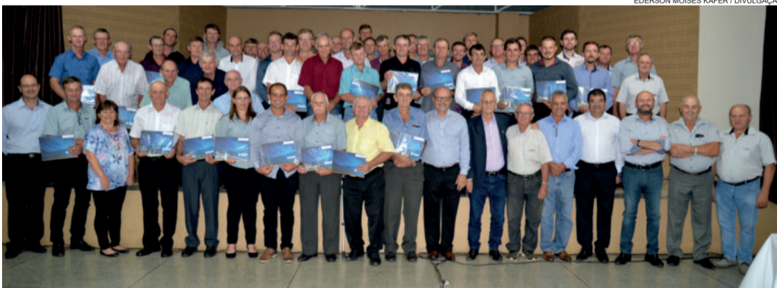
Formatura da primeira turma do curso ocorreu no mês de janeiro