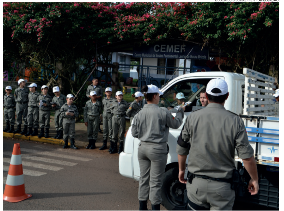
Blitz de conscientização integrou as ações do Maio Amarelo