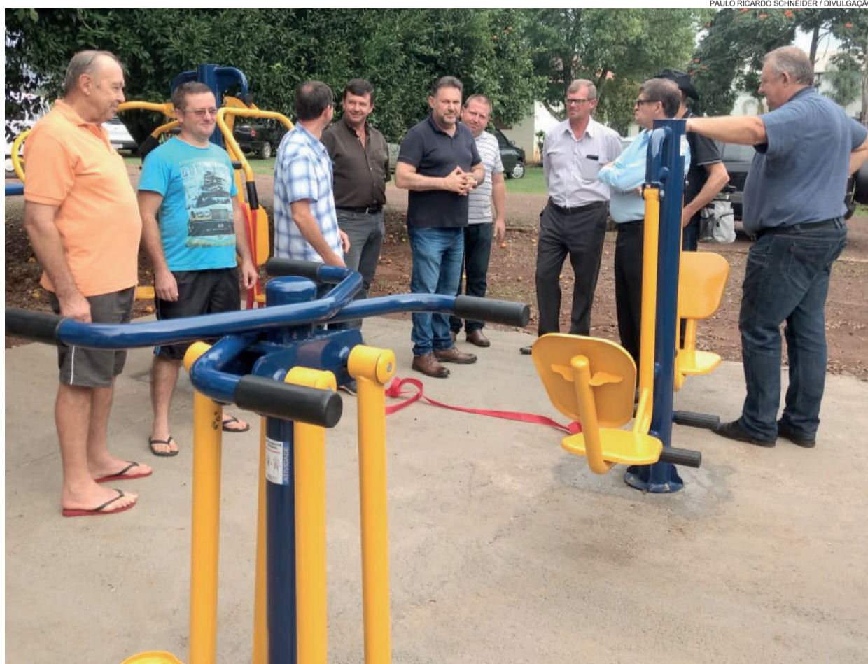
Academias contam com 11 equipamentos para a prática de exercícios

Foi a terceira das seis instaladas pela Secretaria da Saúde no interior do município