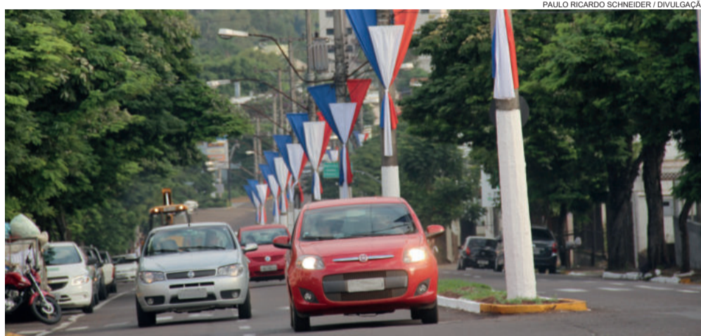
Avenida Rio Branco (foto) e Cel. Müssnich registraram queda brusca no número de acidentes

Segundo o DT e a Brigada Militar, nos quatro primeiros meses de 2019 foram registrados 51 acidentes, com 21 vítimas, nenhuma fatal. No mesmo período de 2018 foram 78 casos, com 34 vítimas, uma fatal. Respectivas quedas de 35% e 39%. Sugestões e reclamações quanto ao trânsito de Estrela podem ser feitas na Seplade, pelos telefones 3981-1075 e 3981-1032.