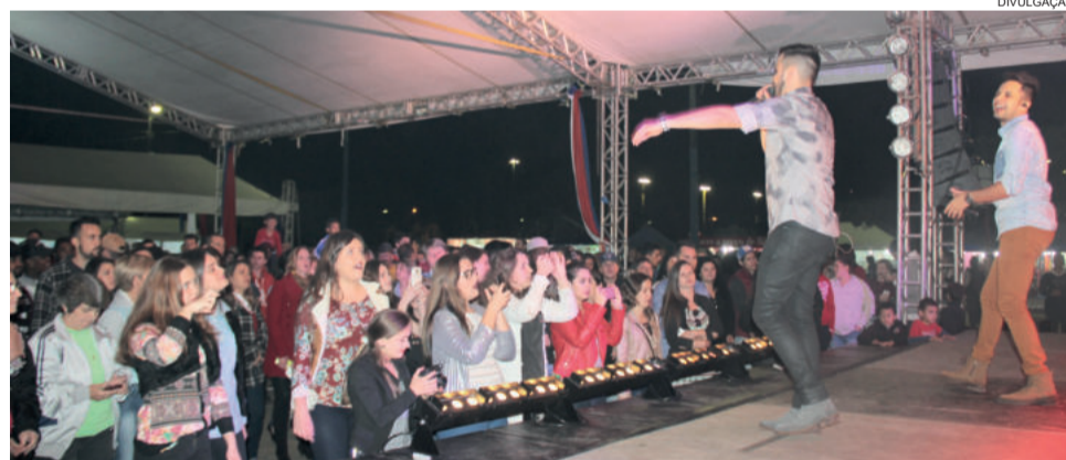
Parque terá mais de dez shows e apresentações com entrada franca

No domingo será a vez dos Clássicos Grenais. Serão seis partidas de futebol, pelas categorias infantil, sênior (pela manhã, das 9h às 12h); veteranos, feminino, peso pesado e força livre (à tarde, das 13h30min às 18h), em times montados pelos consulados municipais dos clubes. Ainda um Gre-Nal de rugby, às 13h. Puxar a carroça com os vencedores, além de aguentar a zoeira dos torcedores rivais, segue sendo o castigo dos perdedores nos clássicos. As duas torcidas já se mobili-