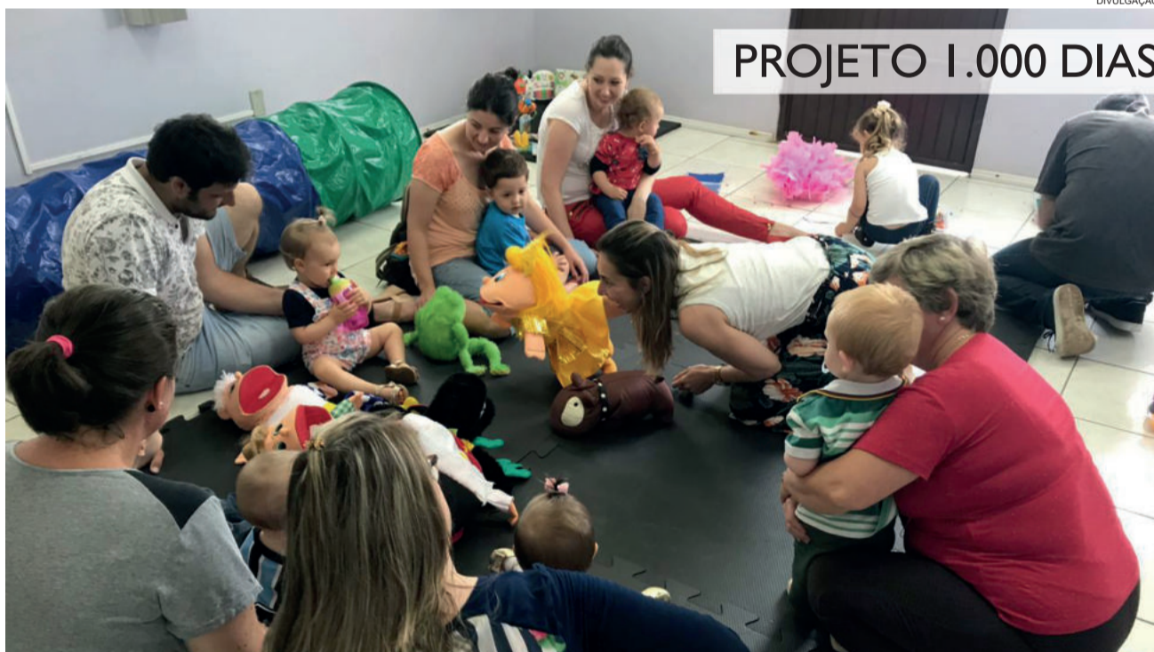
Papais e mães interagem com bebês durante o encontro