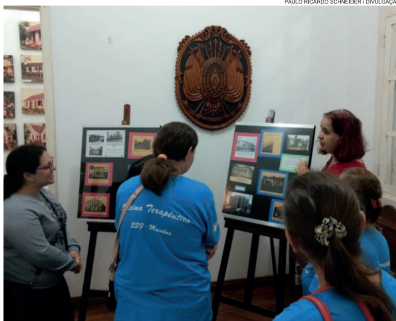
Profissionais e integrantes das oficinas terapêuticas do ESF Moinhos visitaram exposição nesta segunda-feira