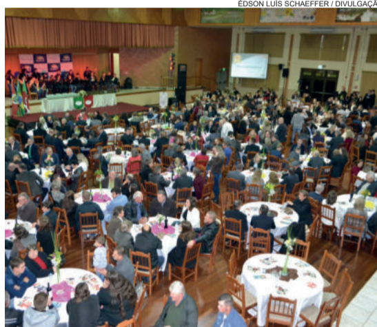
Prêmio reconhece as melhores economias de Teutônia

Ao todo, 151 empreendedores serão laureados. O objetivo é reconhecer o desempenho de todos que se comprometem com o crescimento econômico do município. O Prêmio Destaque é uma realização da Administração Municipal de Teutônia.