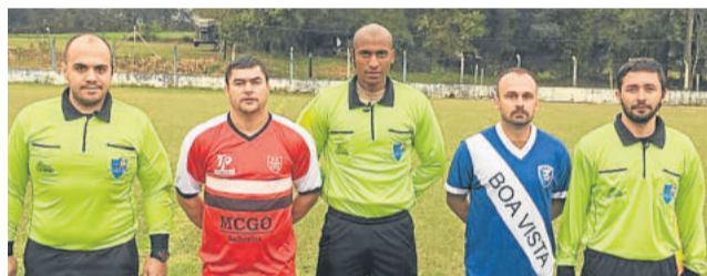
União-G e Boa Vista se enfrentaram neste domingo