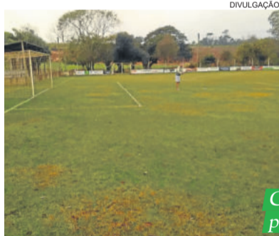
Campo do Palanque estava em perfeitas condições na manhã de domingo

O domingo (14/07) também previa as partidas de volta das semifinais no Campeonato Municipal de Venâncio Aires. Todavia, algumas equipes preferiram adiar os jogos para o próximo domingo (21/07). E caso Flor de Maio e Palanque avancem para as finais, haverá conflito de datas com o início do Regional, marcado para o dia 04 de agosto.