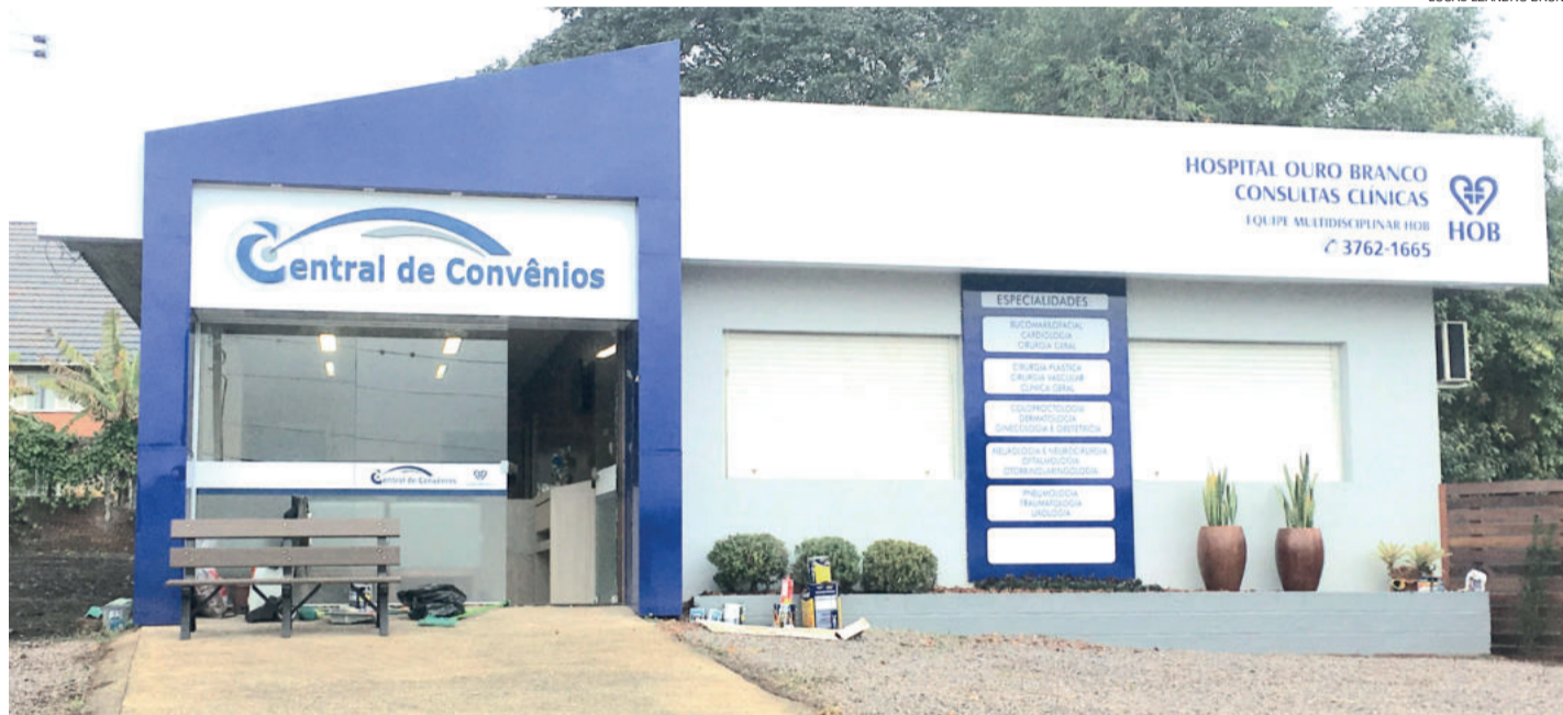
Novo espaço físico está localizado em prédio específico, na Rua Fernando Ferrari, 481, defronte ao acesso do Pronto Atendimento do HOB

O funcionamento, junto à Central de Convênios, é de segunda a sexta-feira, das 8h30min às 17h30min, sem fechar ao meio-dia, com a possibilidade de ampliação futura desse horário conforme a demanda. Mais informações podem ser obtidas pelo fone (51) 3762-1665.