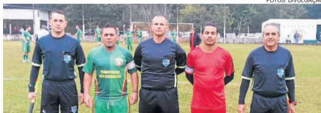
Ribeirense venceu o Flamengo e confirmou vaga na final