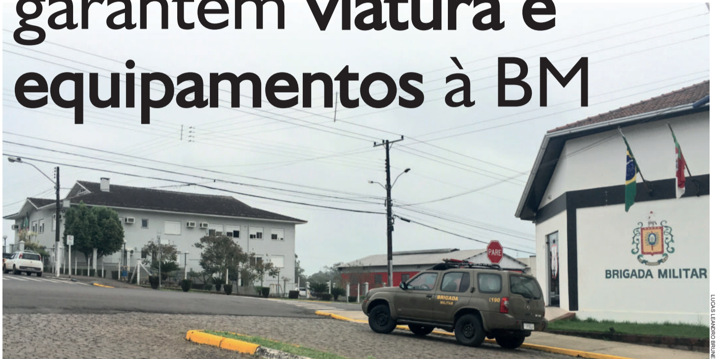
Viatura nova deverá ser uma caminhoneta Mitsubishi L-200 4x4. Equipamentos virão para instrução; tablets e celulares, para o BM Mobi