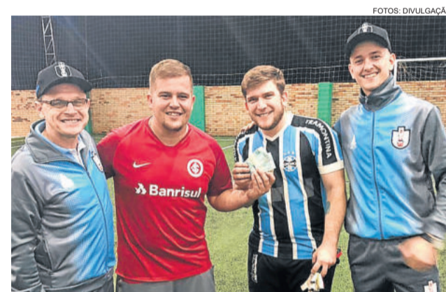
Dupla Gre-Nal, campeã do Torneio de Pênaltis do Saidera