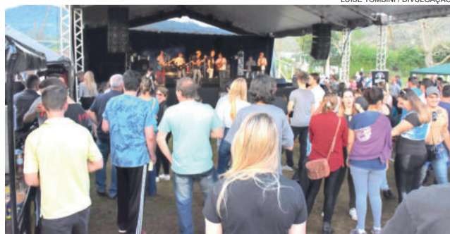
Palco vai receber 15 bandas nos dois dias de programação