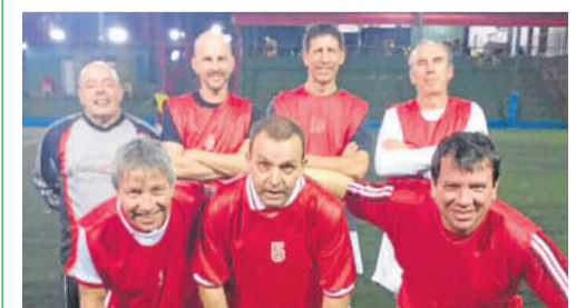
Vermelho, terceiro colocado