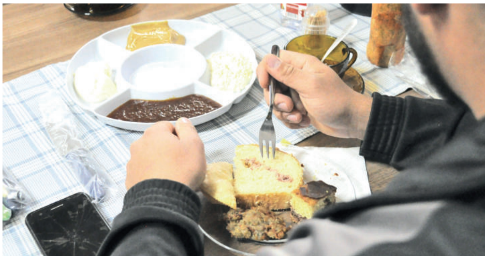
Os sabores da colônia buscam resgatar a tradição