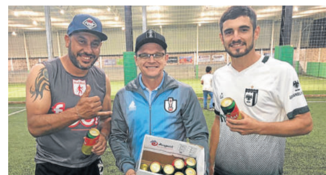
Quarto lugar coube à NC Construções