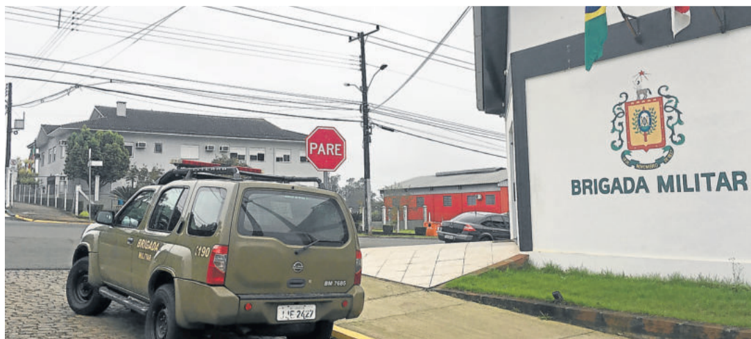
Brigada Militar receberá recursos do Fórum para compra de nova viatura