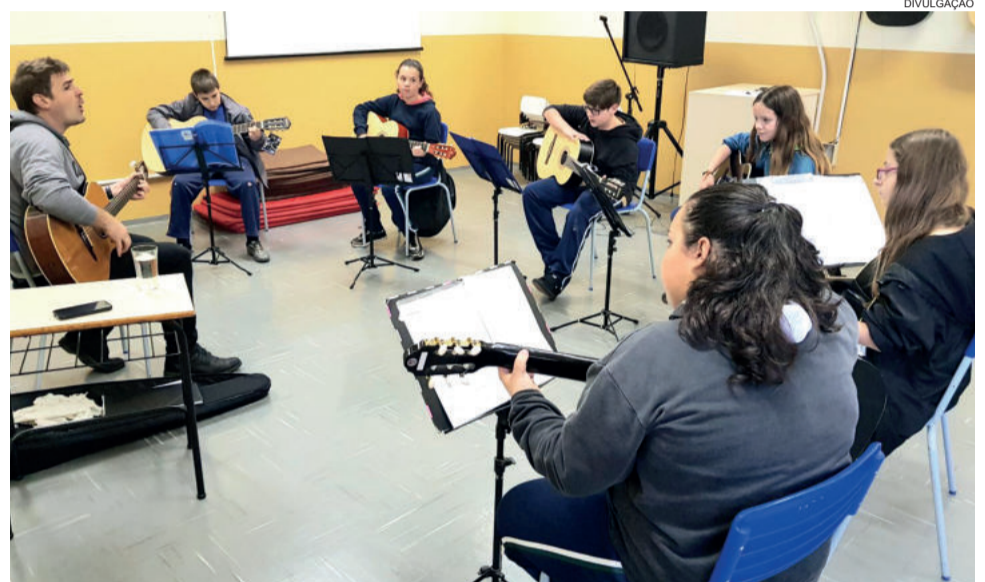
Oficinas de violão são uma das opções