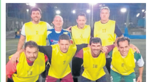
Amarelo, Quarto colocado