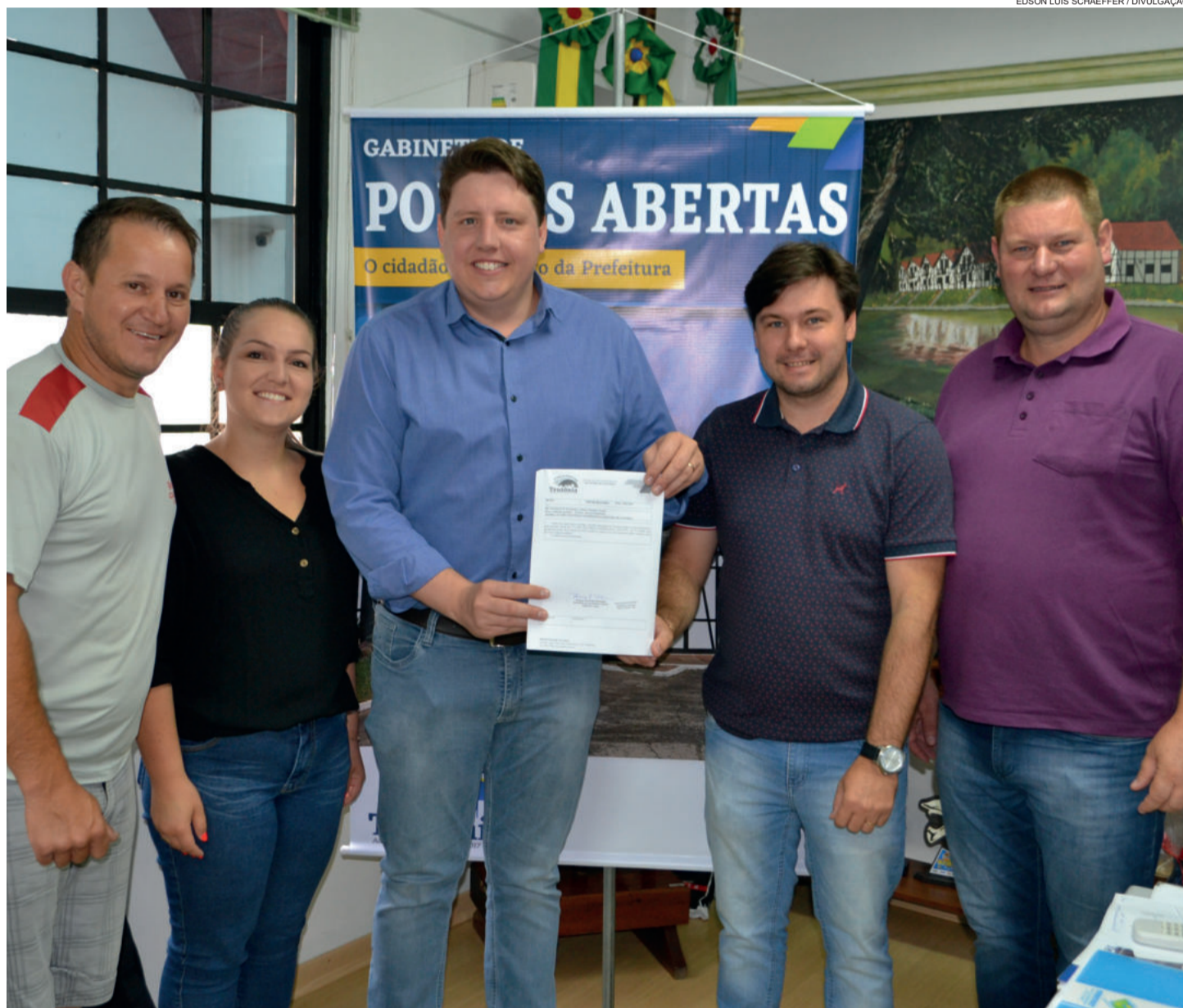
Devolução do recurso foi oficializada nesta quinta-feira