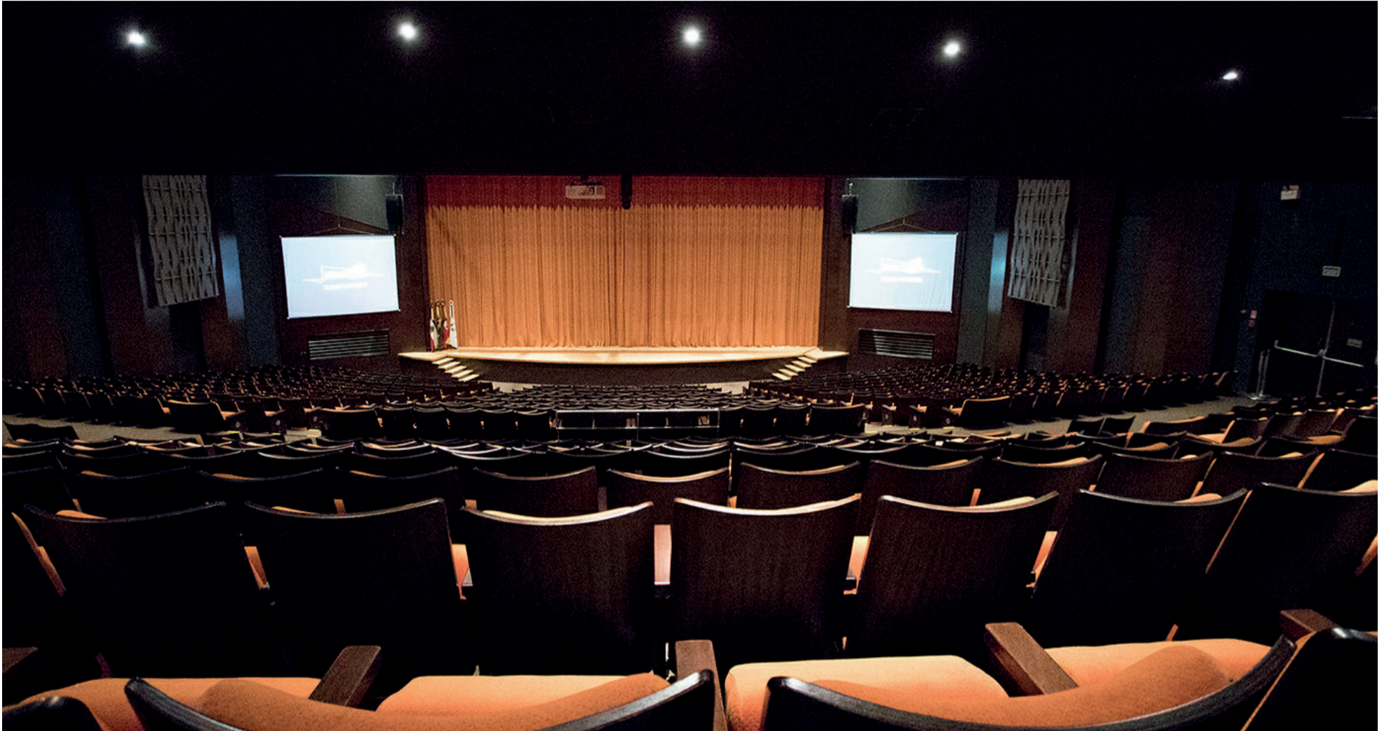
Palco do Teatro Univates recebe audição para novos atores