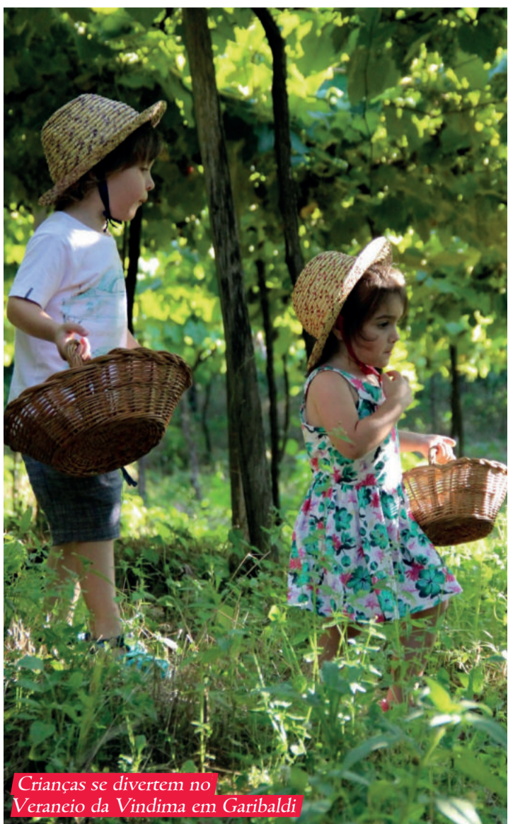
Crianças se divertem no Veraneio da Vindima em Garibaldi