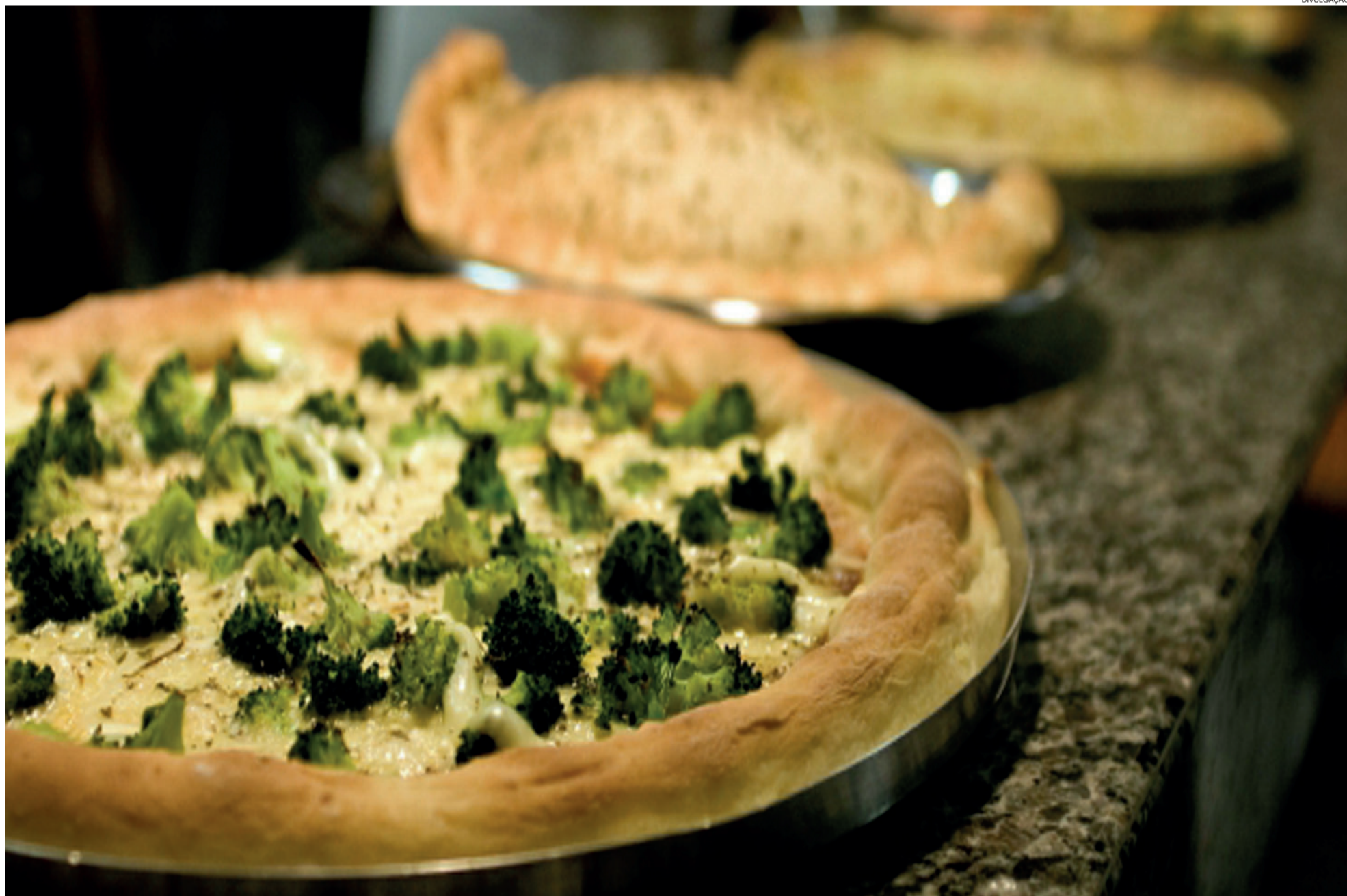
Curso de preparo de pizzas é uma das opções oferecidas