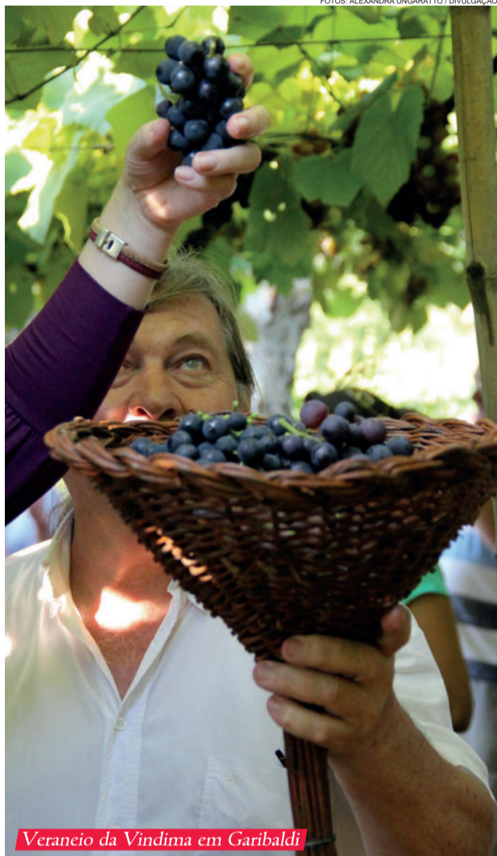
Veraneio da Vindima em Garibaldi