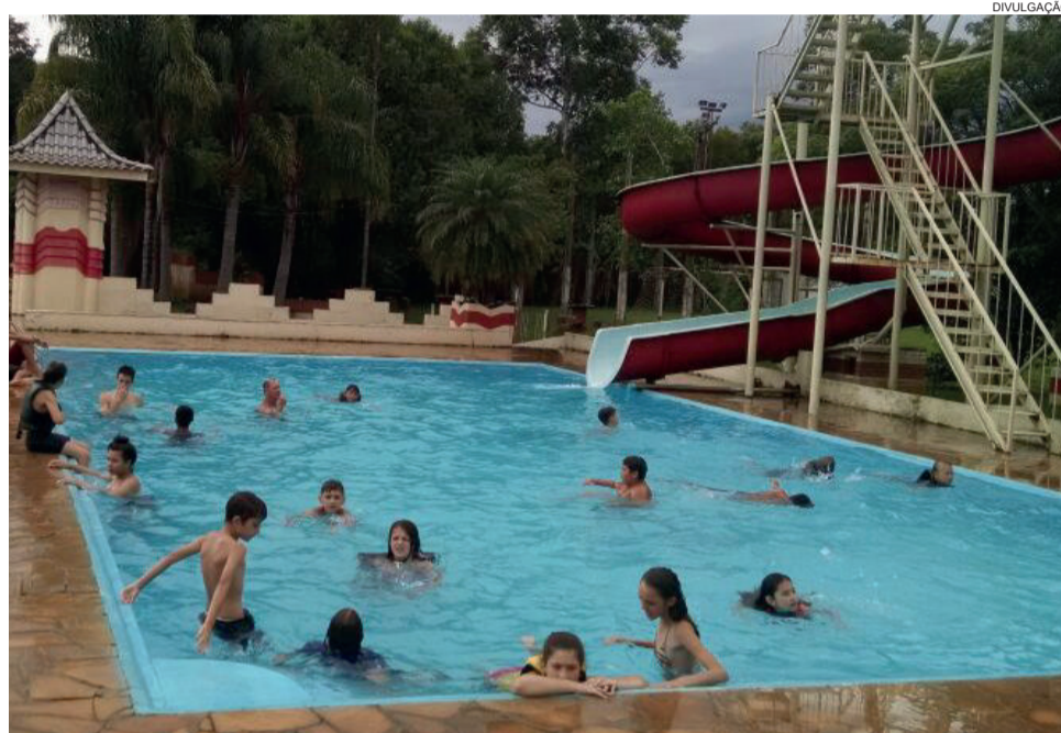
Dia da Piscina, um dos mais aguardados a cada temporada, ocorrerá dia 28

O programa teve seu encerramento coletivo em 2018 realizado no sítio Moinhos do Campo, no Distrito da Delfina, interior do município. O local da festa de encerramento da atual edição, dia 1º de fevereiro, ainda está sendo acertado. Informações sobre o Colônia de Férias podem ser obtidas na Smel, que se localiza na Rua Ernesto Alves, 597/2º andar, Centro, ou pelo telefone (51) 3981-1067.