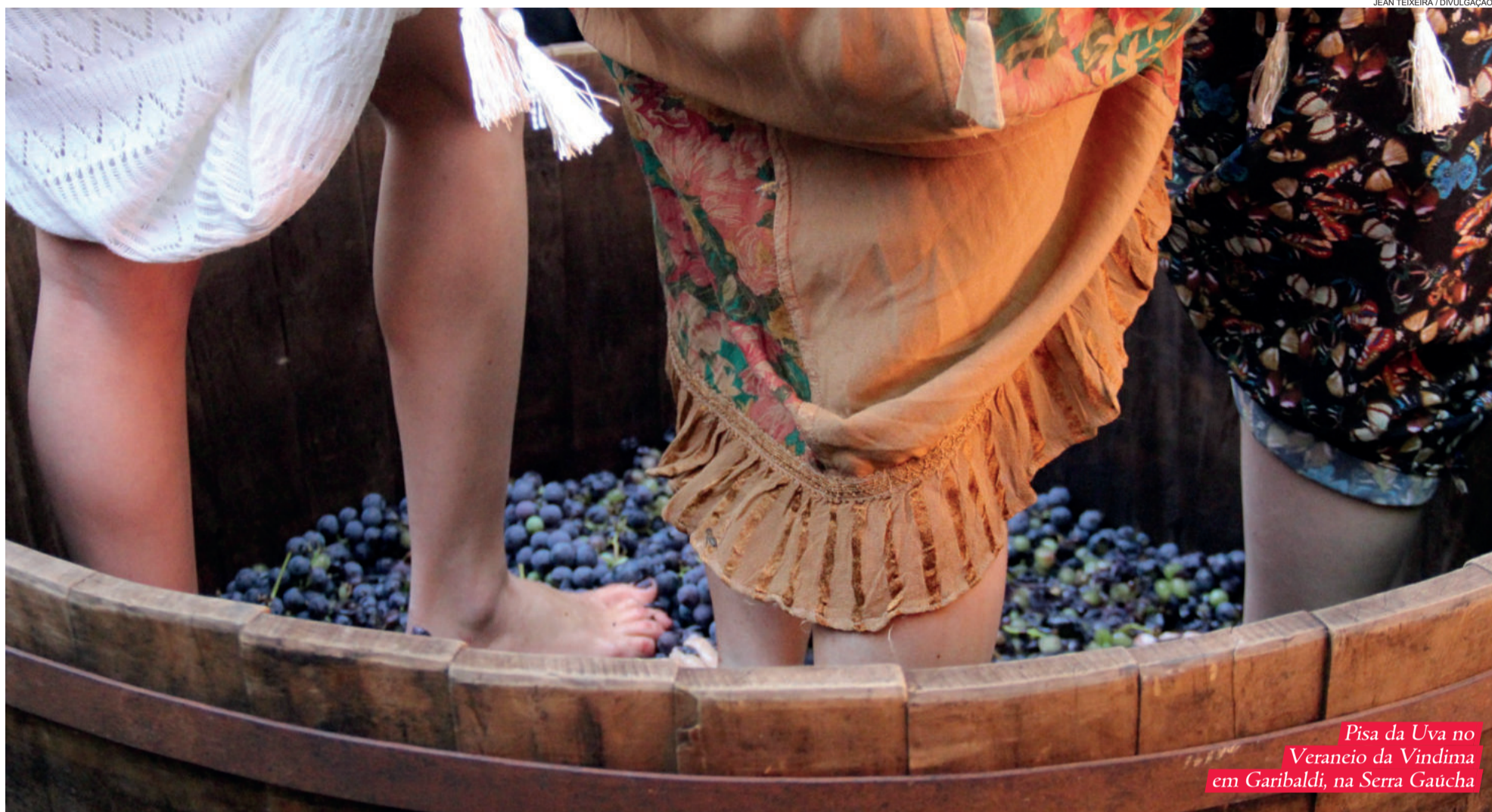
Pisa da Uva no Veraneio da Vindima em Garibaldi, na Serra Gaúcha