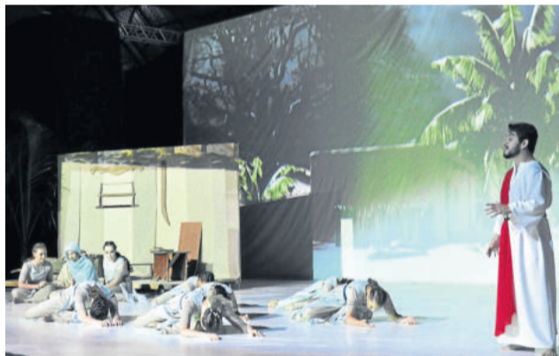
Espetáculo reuniu música, dança e teatro

Atores locais e voluntários representaram os personagens