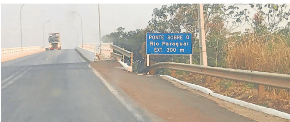
Ponte Rio Paraguai

Paraguai. Se eu tivesse prestado mais atenção na aula do professor Schlabititz, lá nos anos 80, nem teria me surpreendido tanto. Sugiro que o amigo leitor dedique uns minutos à sua internet e dê uma olhada por onde esse famoso rio passa... vai se admirar também.