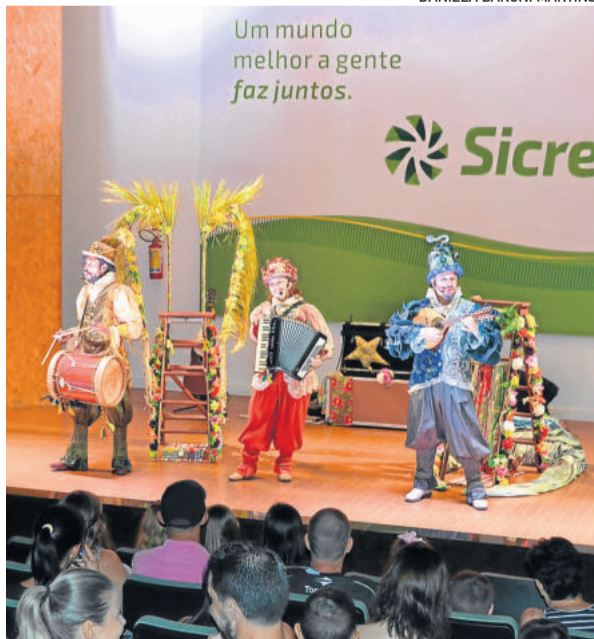
Espectáculo foi permeado por muitas canções