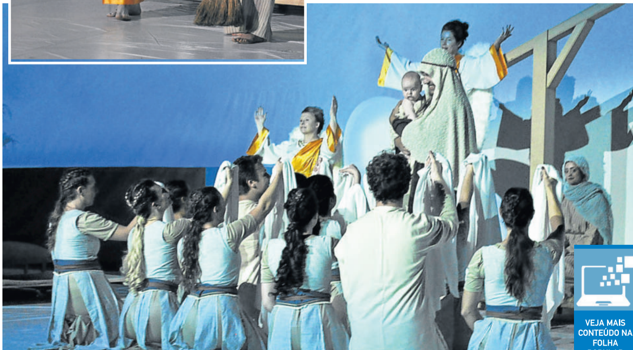
Espetáculo contou a história do nascimento de Jesus

Atores locais e voluntários representaram os personagens