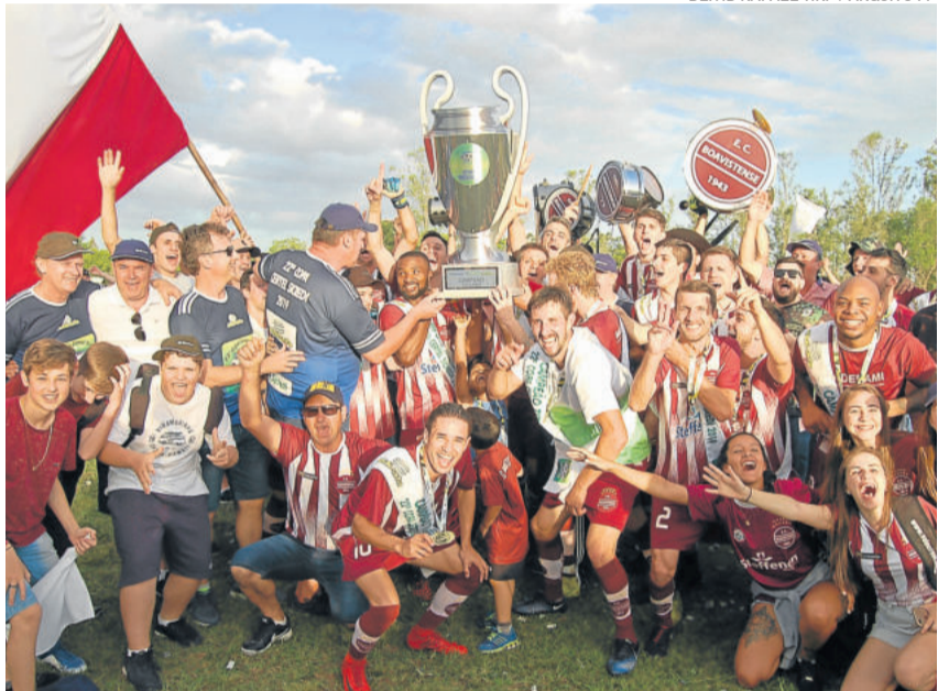
Boavistense é o campeão da categoria Titulares da Série A do Regional 2019