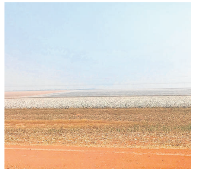
Fazendas de algodão