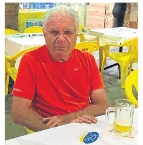
Amigo paulista que foi ao Alaska

Em 10 minutos de bate papo já havíamos combinado de irmos jantar juntos no centro histórico da cidade. Nada como pode sentar na rua, tomar uma cerveja gelada e conversar sobre amenidades. Esse foi nosso fim de noite em Cáceres, compartilhando histórias com nosso novo amigo, escutando dele os planos de viagem pela Transamazônica e aprendendo muito sobre a viagem dele com esse carro para o Alaska. Isso mesmo, esse jovem senhor foi ao Alaska rodando, tem muita história pra contar. Pessoa do bem, um dos nossos novos amigos de viagem.