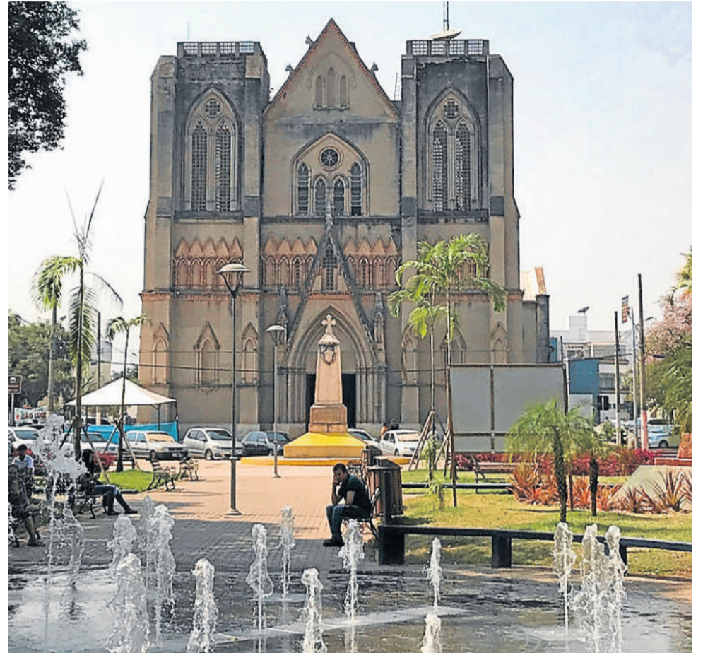
Igreja Matriz em Cáceres