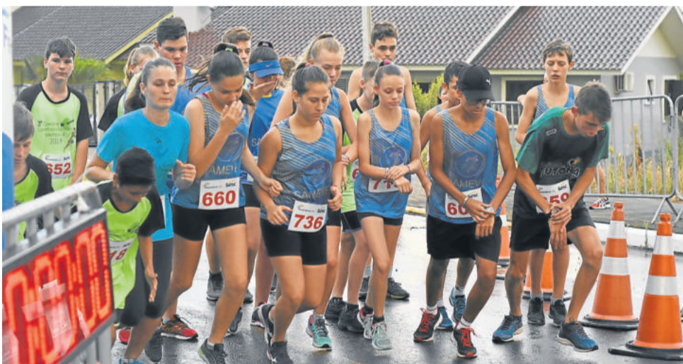
Crianças e adolescentes de 10 a 15 anos percorreram trajetos de 1km ou 2,5km