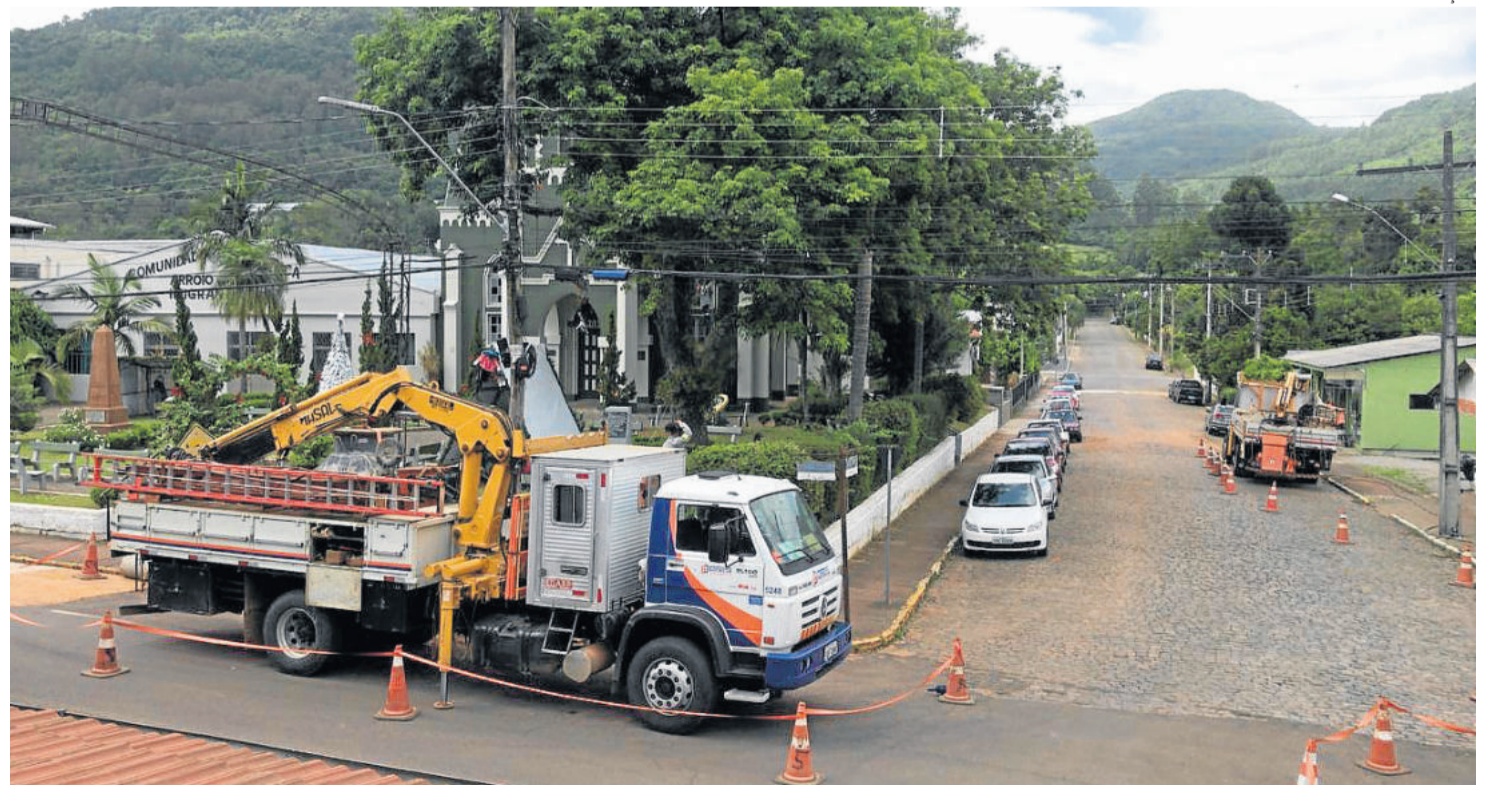
Troca de postes foi realizada pela RGE