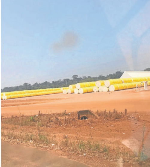
Algodão em fardos