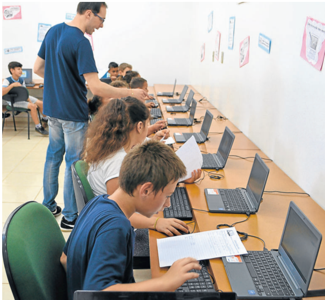
Após um ano, os Chromebooks já beneficiaram centenas de crianças