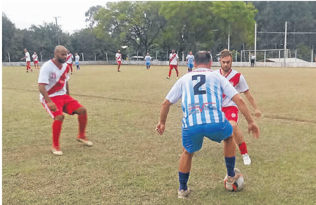
Boa Vista (azul) acabou eliminado com a derrota em casa para o Atlético