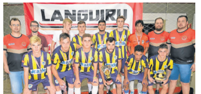
Invictos - Vice-campeão do futsal masculino