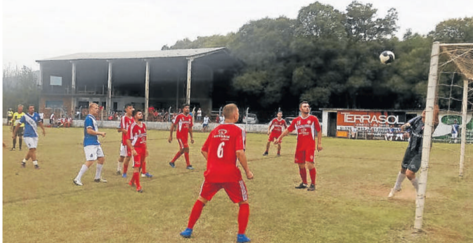
Nos Aspirantes, Boa Vista (azul) reagiu, mas não conseguiu evitar a eliminação

A Associação dos Clubes Amadores de Teutônia (Acat) deve apresentar hoje uma nota confirmando a transferência. Ainda não há data para definir a realização dos jogos ou retomada da competição.