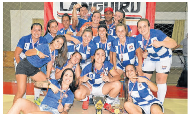
Xequê Mate - Vice-campeão do futsal feminino