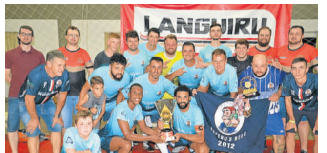
Kopperus Beer - Campeão do futsal masculino