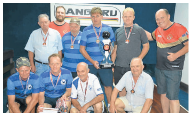
Juventude - Vice-campeão do bolão