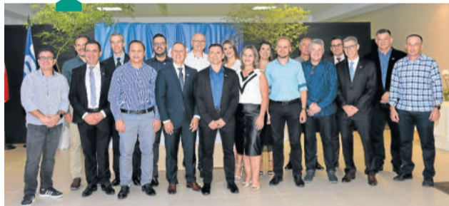
Nova diretoria da CDL Lajeado