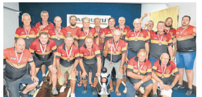
Languiru - Campeão do bolão