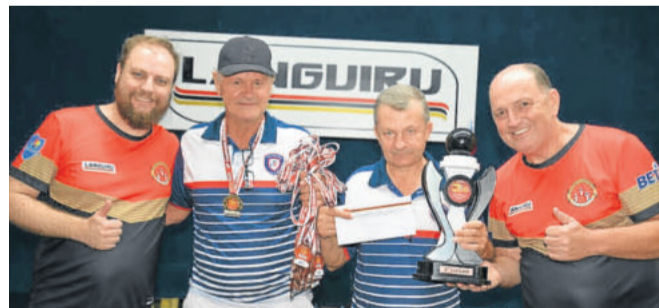
3º colocado do bolão Elite