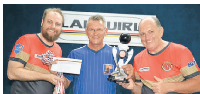
4º colocado do bolão Pillar