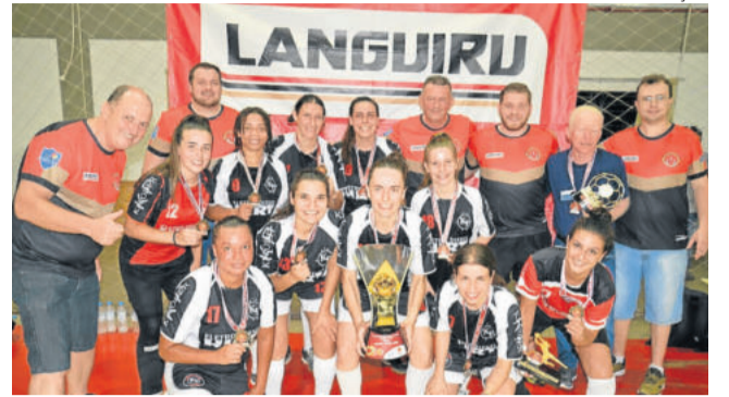
Ki Poder - Campeão do futsal feminino