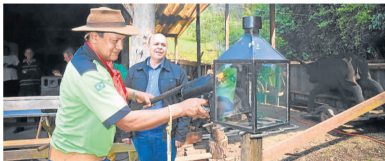
Prefeito acompanhando o acendimento da chama