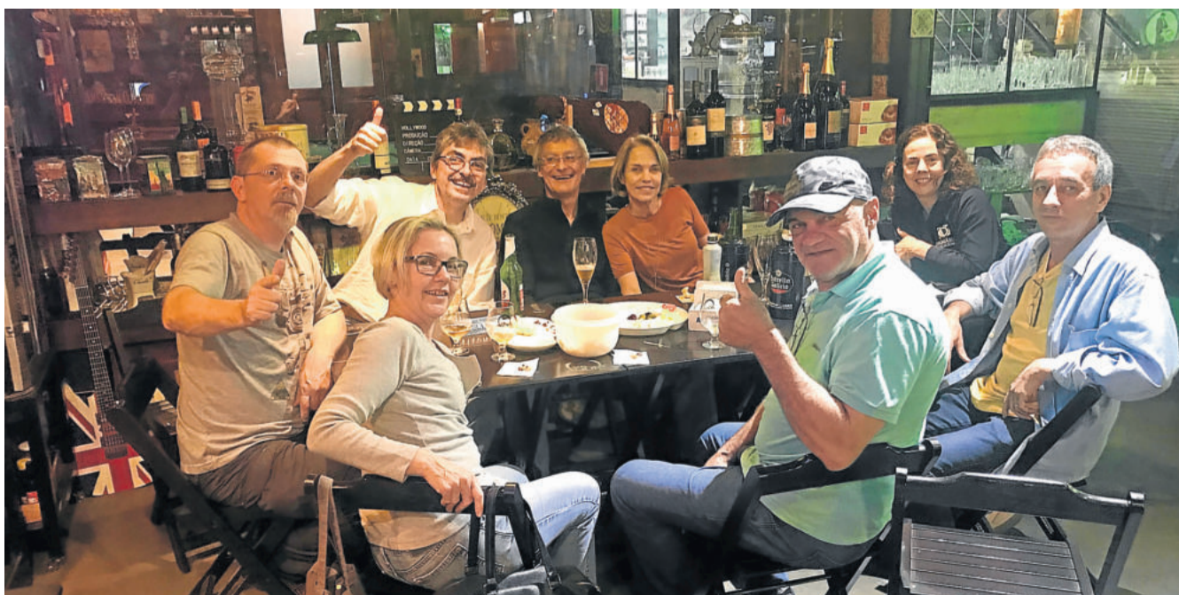
Confraternização até o bar fechar