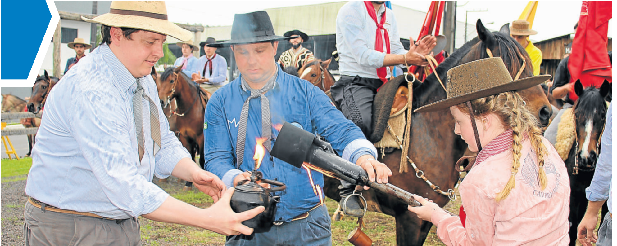
Chegada da Chama Crioula no Acampamento abriu o evento oficialmente