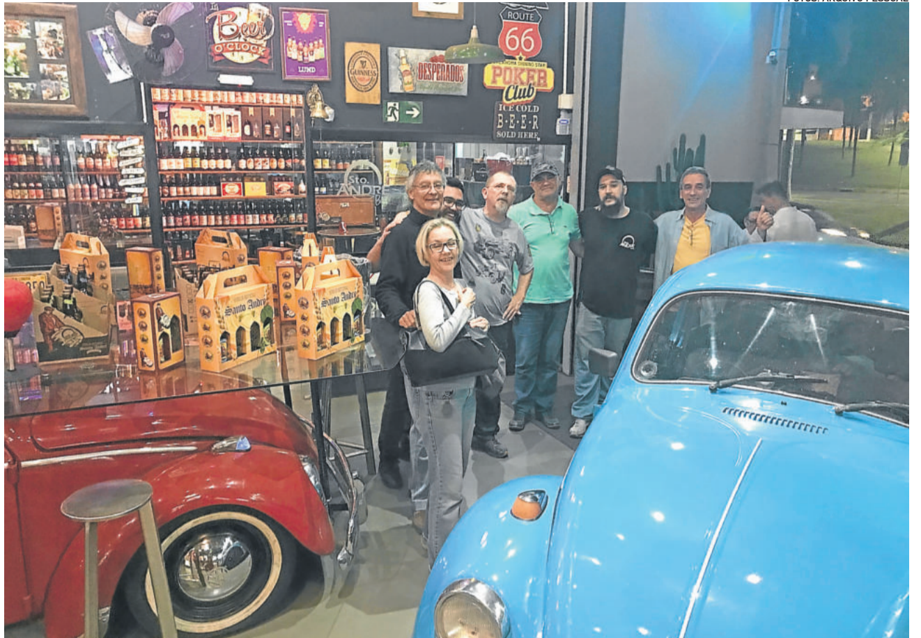
Pub temático Santo André Store e o Fusca estacionou dentro do bar

O Salão de Artes Visuais contará com várias apresentações culturais e uma bela exposição de trabalhos artísticos. Participe!