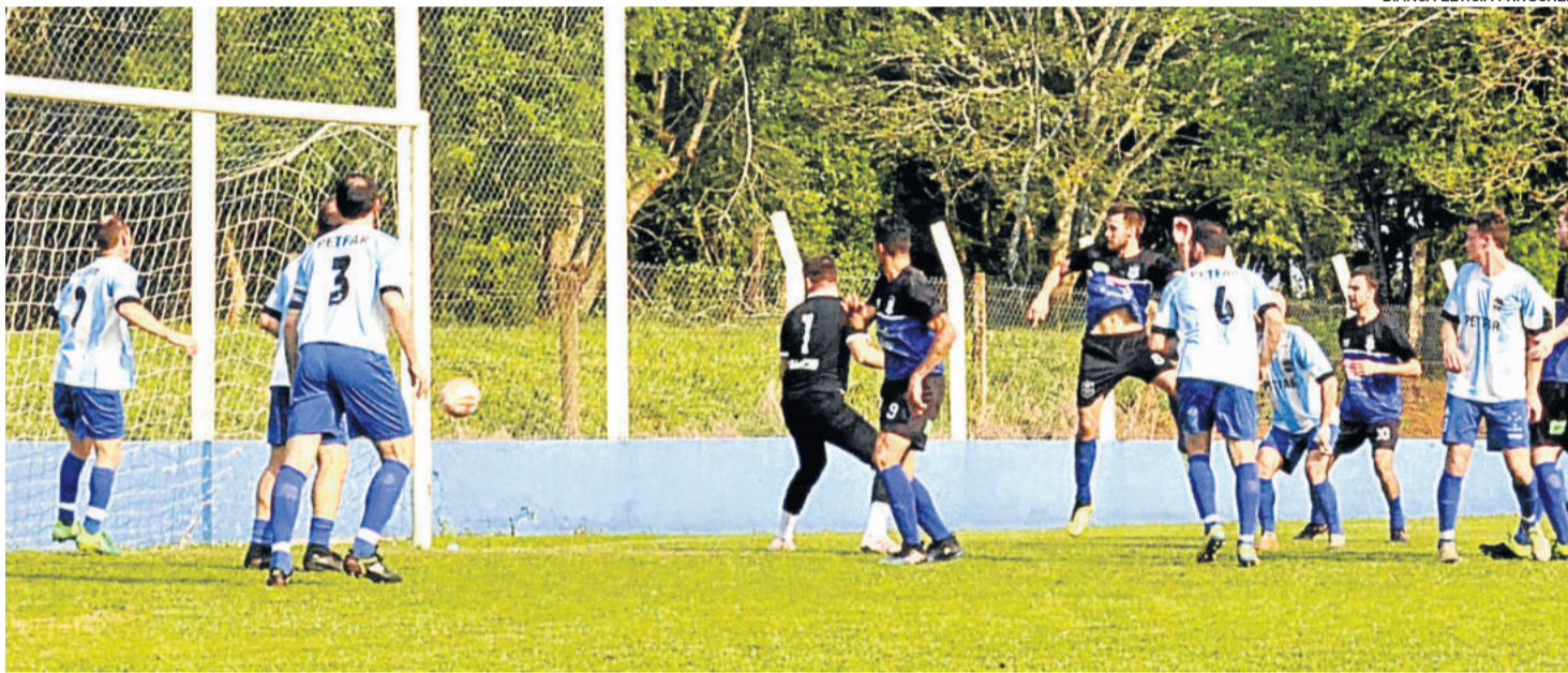
Atlântico derrubou o último invicto do Regional e tem uma das oito melhores campanhas