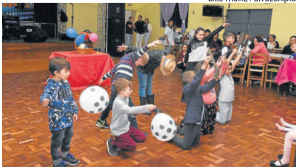
Apresentação dos alunos da Escola Ernesto Alves