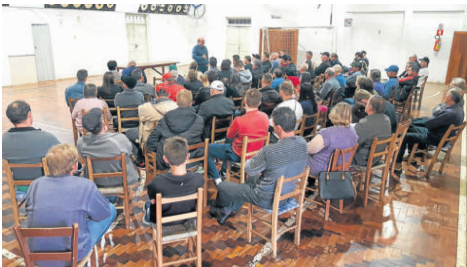
Reunião em Linha Clara contou com grande participação

Houve ênfase também ao fato de que a cooperativa é uma das poucas indústrias que ainda recolhe leite de pequenos produtores, fato que evidencia o papel social da Languiru. A constatação serviu de base para a divulgação do Programa de Inclusão Social e Produtiva no Campo, iniciativa da cooperativa e parceiros que tem como finalidade diversificar a renda da pequena propriedade rural. Com o programa, o associado pode cultivar hortifrutigranjeiros e vender essa produção à cooperativa, desde que possua o Cartão Azul ou o Cartão Verde. Nesse contexto foi lembrado que, como um dos resultados do programa que incentiva a produção local, os Supermercados Languiru ficaram abastecidos com verduras, legumes e frutas durante a greve dos caminhoneiros.