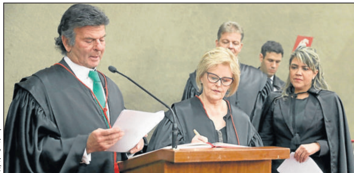
Rosa Weber tomou posse Como Presidente do TSE

Ainda como desembargadora, foi convocada para atuar no Tribunal Superior do Trabalho (TST) de 2004 a 2006, quando então foi nomeada ministra daquela Corte, onde atuou de fevereiro de 2006 a 2011. Em seguida, foi nomeada ministra do Supremo Tribunal Federal (STF), sendo empossada em 19 de dezembro de 2011.