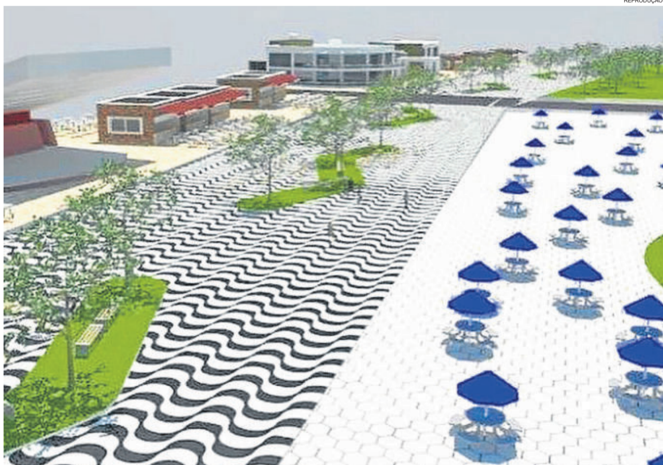
O projeto visa proporcionar melhor qualidade de vida aos teutonienses