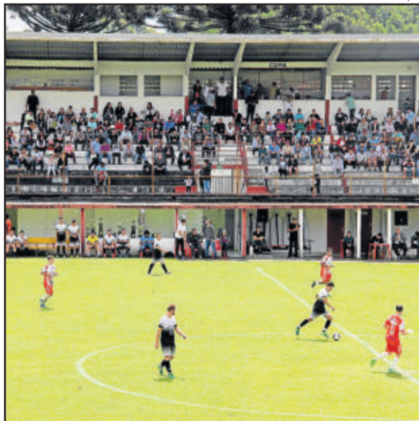
Campeonato Municipal movimentará as comunidades de Garibaldi