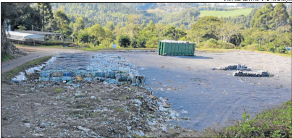
Todos os materiais somam 2.555,30 toneladas recolhidas em seis meses

No primeiro semestre de 2018, o município de Carlos Barbosa recolheu mais de 2.500 toneladas de lixo. Conforme dados levantados pela empresa PJS - Geologia, responsável técnica contratada, até junho deste ano 2.160,50 toneladas de resíduos orgânicos foram coletadas e encaminhadas para o Aterro Sanitário da CRVR, em São Leopoldo. Além disso, 394,80 toneladas de resíduos recicláveis. Destes foram separados o que é passível de reciclagem e o rejeito, material que não possui