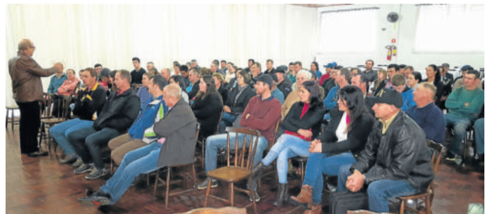
Encontro realizado em Santa Cruz do Sul reuniu grande número de associados do Vale do Rio Pardo