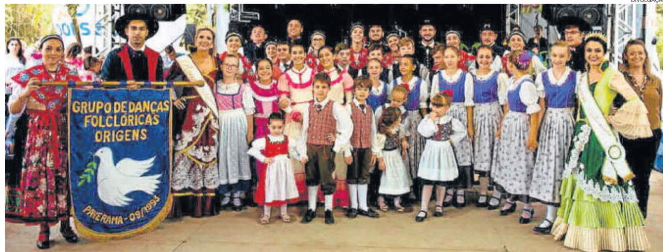
Origens também organizou e se apresentou na Paveramafest