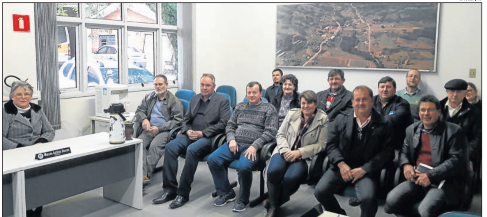
Audiência foi realizada na Câmara de Vereadores

No dia 09 deste mês de agosto, na Câmara de Vereadores de Poço das Antas, foi realizada a audiência pública para composição da Lei de Diretrizes e Orçamento (LDO) para o Exercício de 2019. Entre as metas prioritárias ficaram a instalação de telefone e internet para os moradores da Comunidade de Fritzenberg, Goelzenberg e Santa Inês; construção de ciclovia e pista de caminhada junto à ERS-419, com iluminação pública; reforma do telhado e rede elétrica/dados do prédio administrativo; e a instalação de cemitério público municipal, adquirindo área de terras e contratações necessárias para sua instalação.