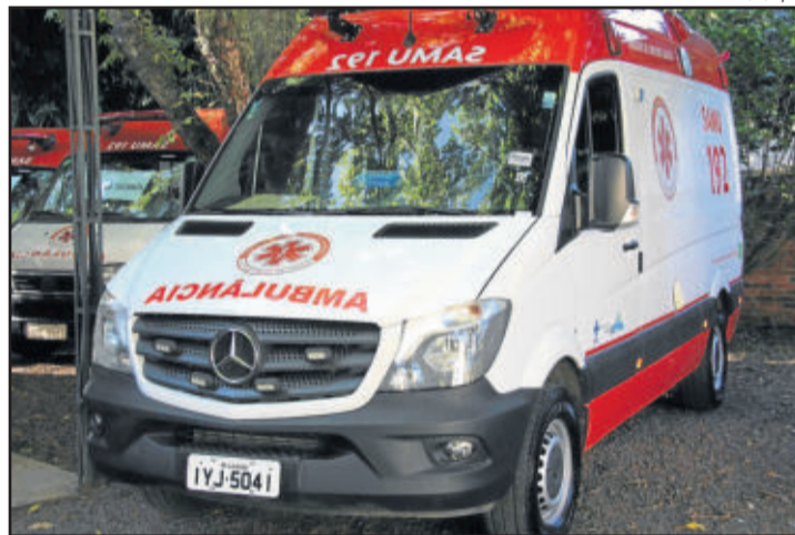
Região conta com seis suportes do Samu, cinco básicas e uma avançada