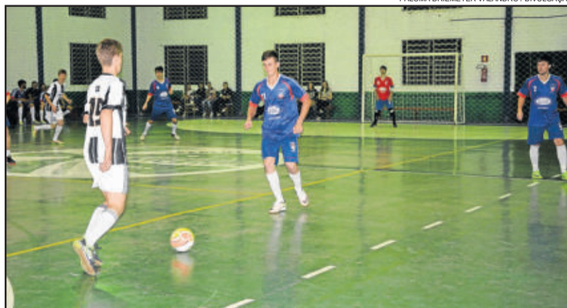
9º Campeonato Municipal de Futsal tem início previsto para o dia 07 de setembro

Inscrições para o 9º Campeonato Municipal de Futsal serão recebidas até o dia 24 de agosto e são gratuitas. Porém, para validar a inscrição, cada equipe terá que fazer a entrega de um cheque caução.