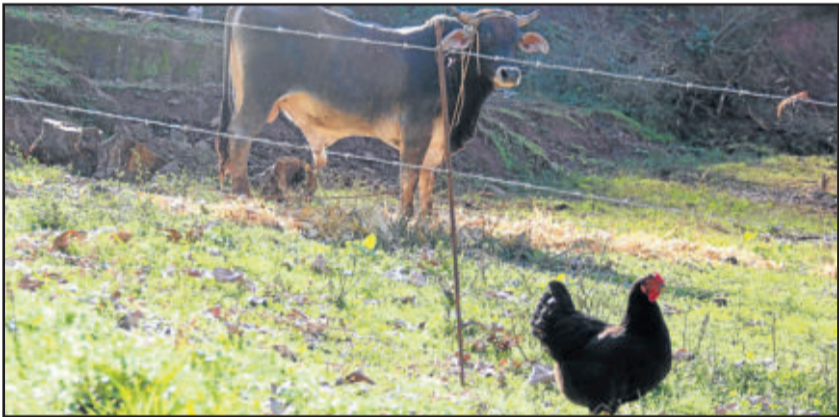
Coleta de dados em propriedades rurais ocorreu entre outubro de 2017 e fevereiro de 2018

Salsa – produzida em 30 estabelecimentos agropecuários