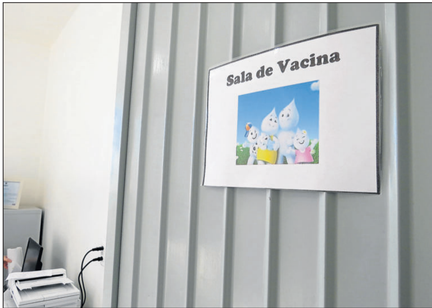
No Vale do Taquari 14.618 crianças devem ser vacinadas durante toda a campanha

Paverama, os dois postos de saúde estarão abertos no sábado, exclusivamente em função desta ação. No Posto De Saúde do Centro a vacinação será das 8h às 12h e das 13h às 17h. No Bairro Fazenda São José, a vacinação será das 8h30 às 12h e das 13 às 16h30. "O Dia D, neste sábado, é uma oportunidade de vacinar as crianças cujos pais e responsáveis não podem ir às unidades durante a semana",