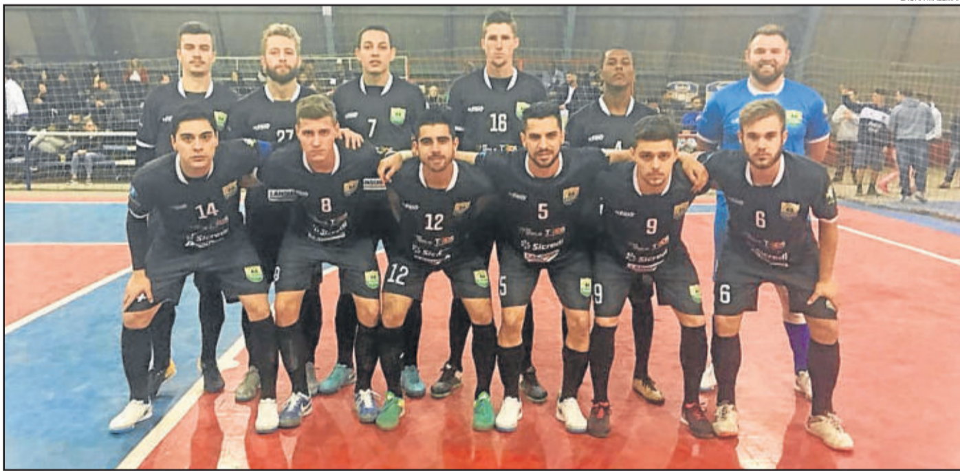
Equipe teutoniense joga em Candelária na noite de hoje