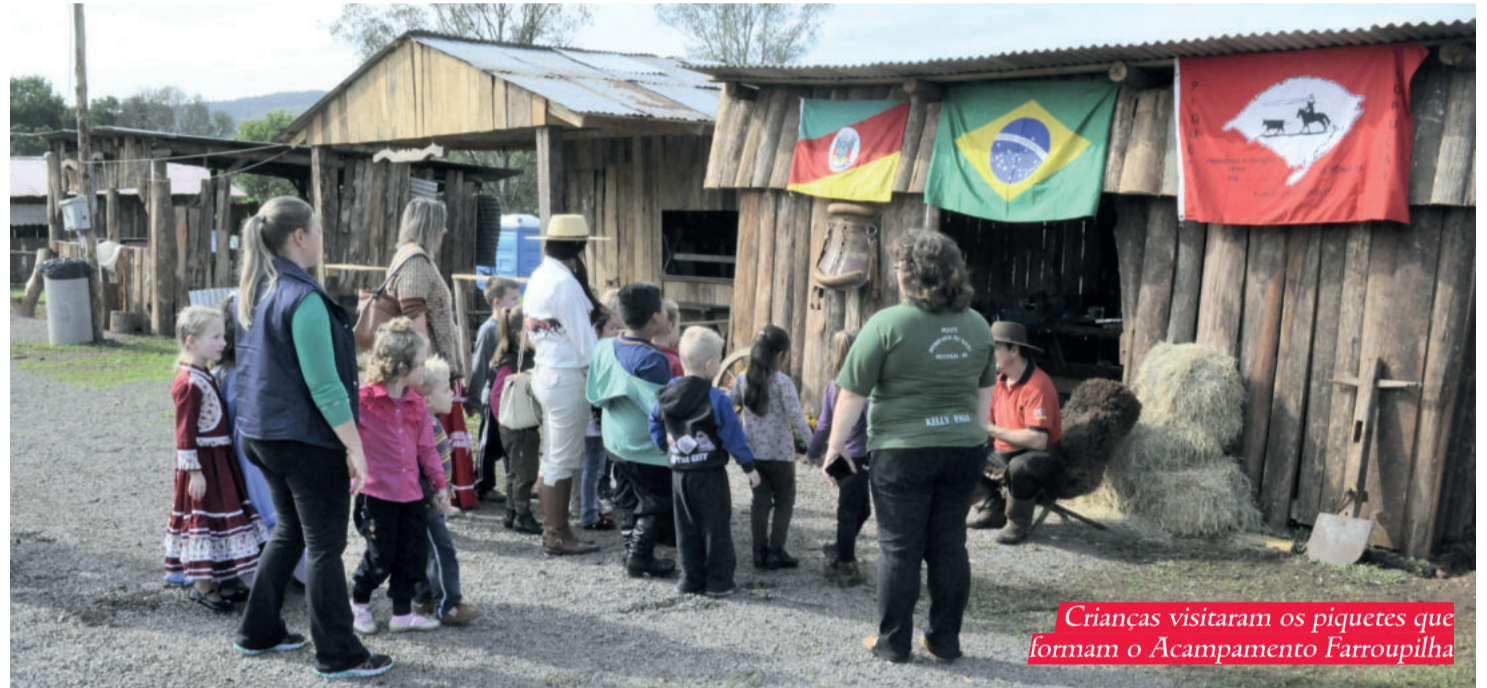
Crianças visitaram os piquetes que formam o Acampamento Farroupilha