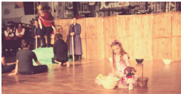
Encenação com a menina flor abriu os festejos