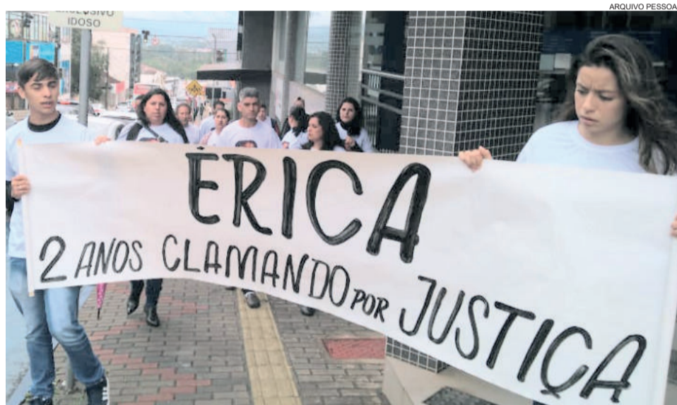
Familiares percorreram as principais ruas do Bairro Languiru