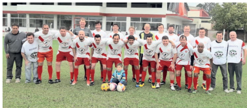
Concórdia de Roca Sales permanece na liderança do Veteranos