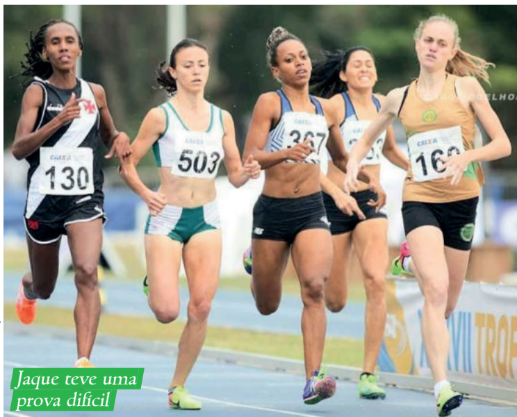
Jaque teve uma prova difícil