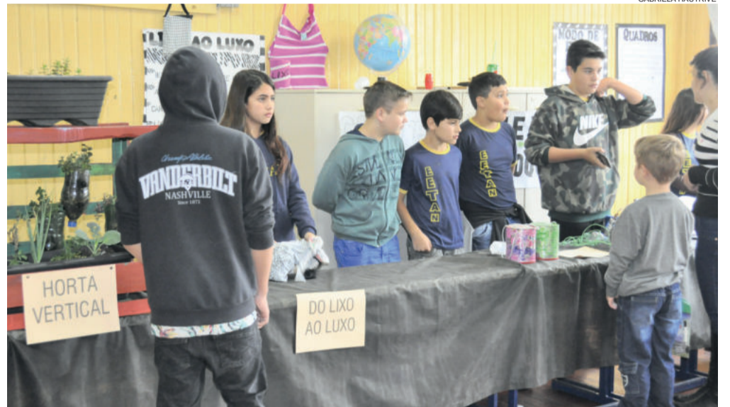
Trabalhos apresentado focaram a sustentabilidade