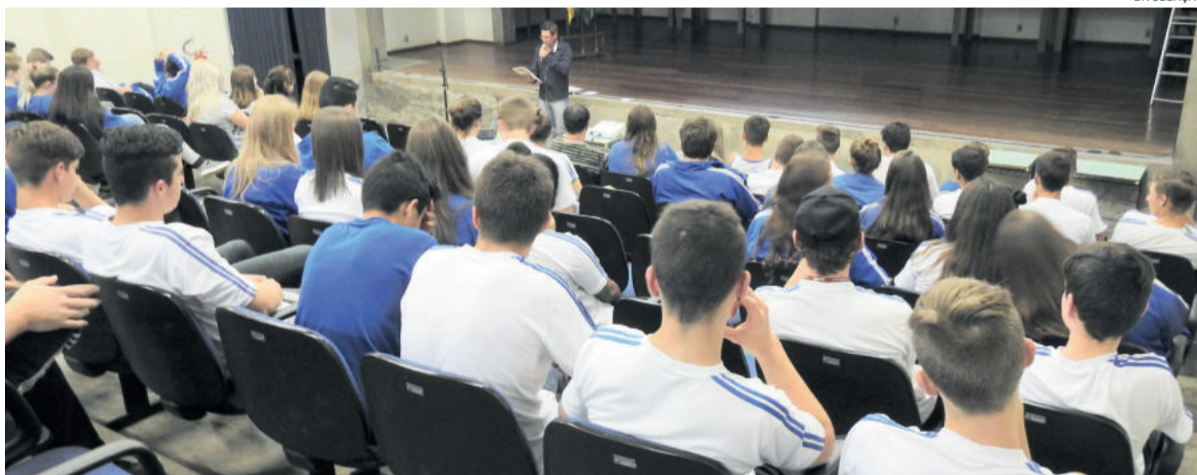
Mostra ocorreu no auditório da prefeitura