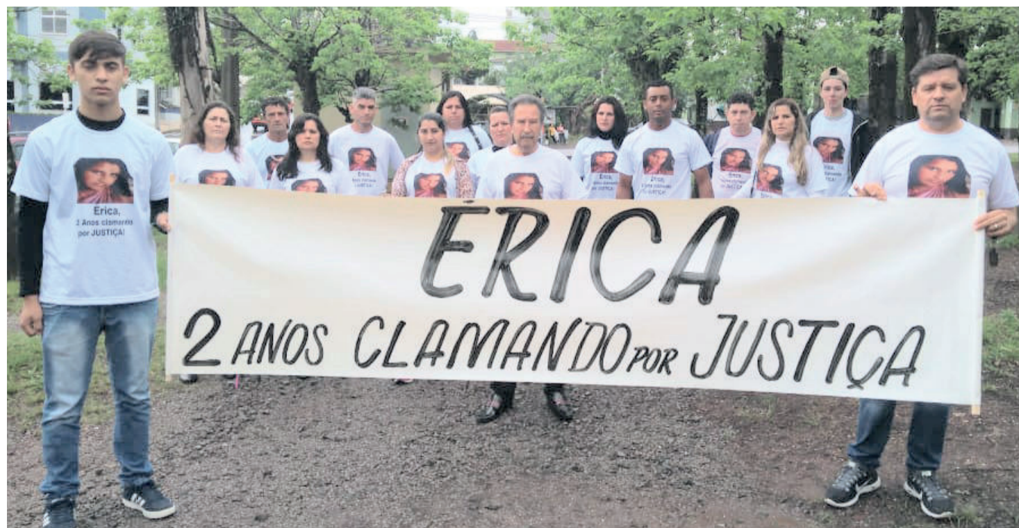
Com camisetas e faixa, família clama por justiça