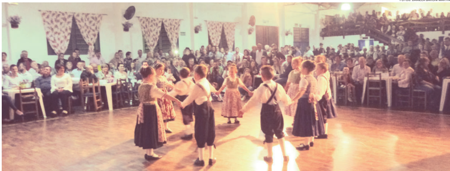
Grupo anfitrião fez apresentação de suas categorias

Depois das apresentações ocorreu o baile animado pela banda K'necus e o DJ Nathan.