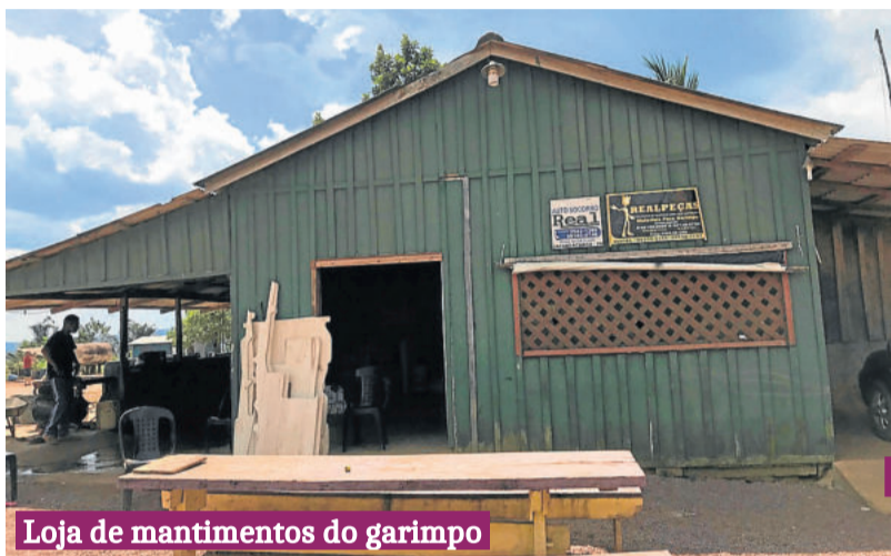
Loja de mantimentos do garimpo