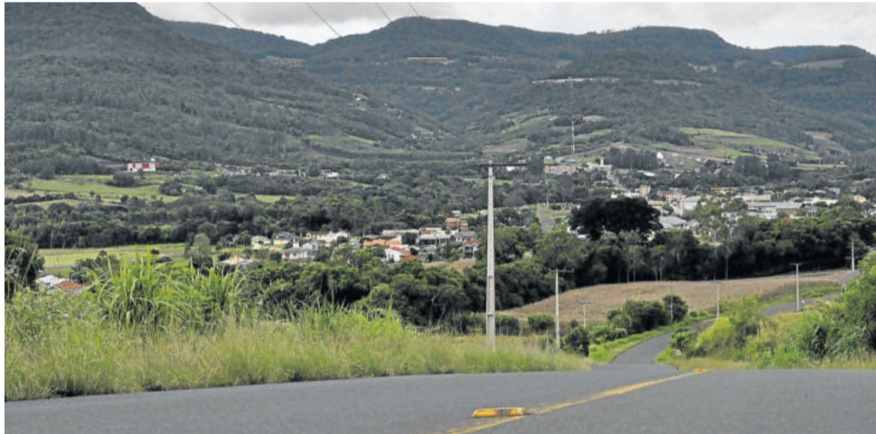
Westfália é um município com predominância da agricultura e focado na produção e não no consumo

A proposta do Governo Federal propõe somente a unificação do Programa de Integração Social (PIS) e a Contribuição para o Financiamento de Seguridade Social (Cofins), incidentes sobre produtos e serviços. Porém, a que preocupa alguns municípios do Estado é a proposta do deputado Baileia Rossi (MDB-SP). Ele sugere a unificação de cinco tributos (IPI, PIS, Cofins, ICMS e ISS) com a criação do Imposto sobre Bens e Serviços (IBS).