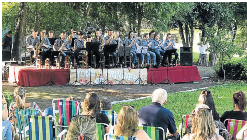
Orquestra Jovem foi uma das atrações