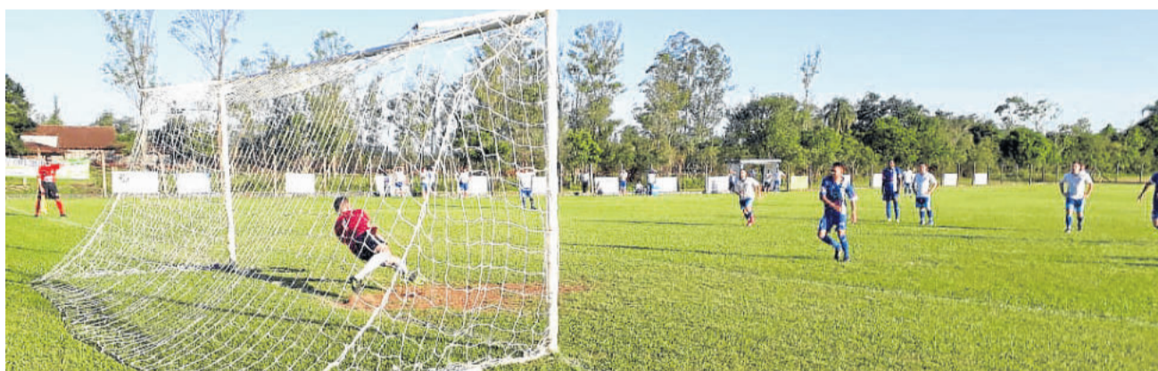
No segundo tempo, Duda defendeu pênalti de Pastel

Na decisão, o primeiro jogo será em Boa Vista do Sul; e a segunda final, em Venâncio Aires. O Boavistense joga com a vantagem de dois empates, por ter melhor campanha geral.