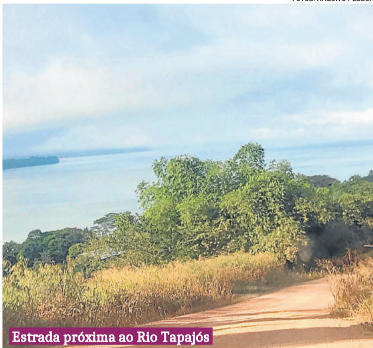
Estrada próxima ao Rio Tapajós