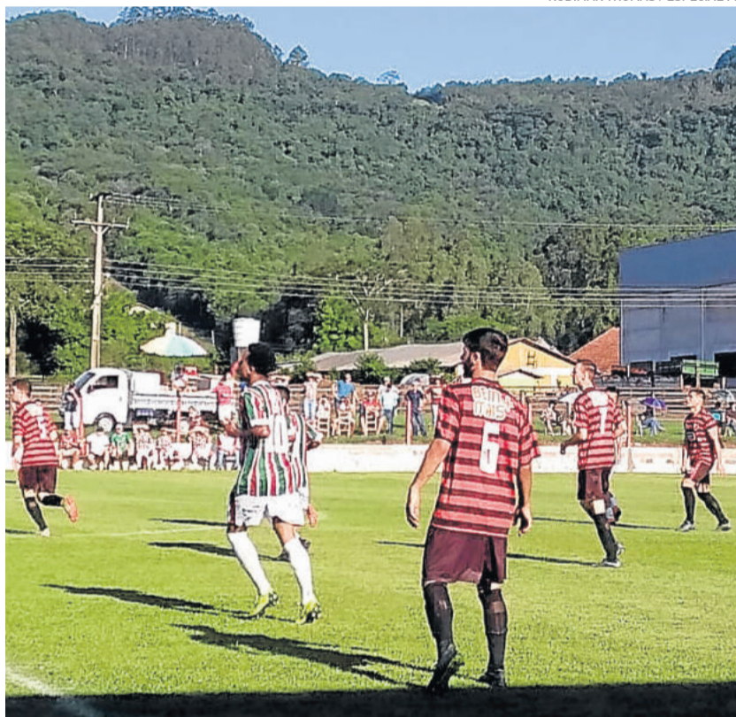
Flamengo conseguiu vencer o primeiro clássico em casa