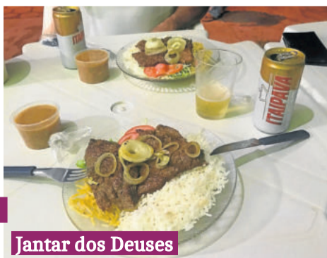
Jantar dos Deuses