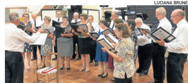
Coro Misto Ouro Branco