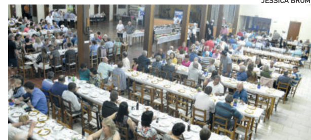
Mais de 300 pessoas participaram do baile

Para ser membro de AA, o único requisito é o desejo de parar de beber. O número de pessoas, em Teutônia, que venceram o vício e se recuperaram passa de 200.