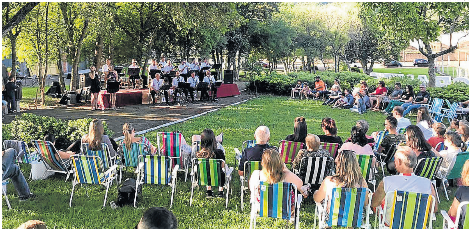
Evento reuniu famílias na praça