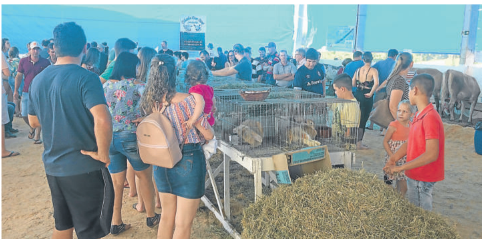
Exposição agropecuária mostrou os potenciais do campo