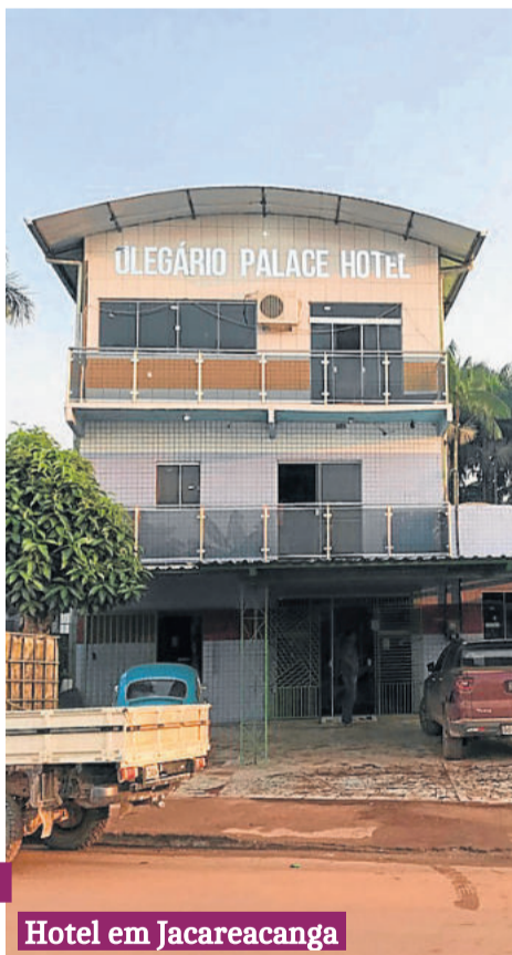
Hotel em Jacareacanga

Conversamos com o pessoal local, olhamos bem os dois aviões, que por sinal só tinham lugar para o piloto e o resto todo do espaço estava liberado para carregamento das cargas.