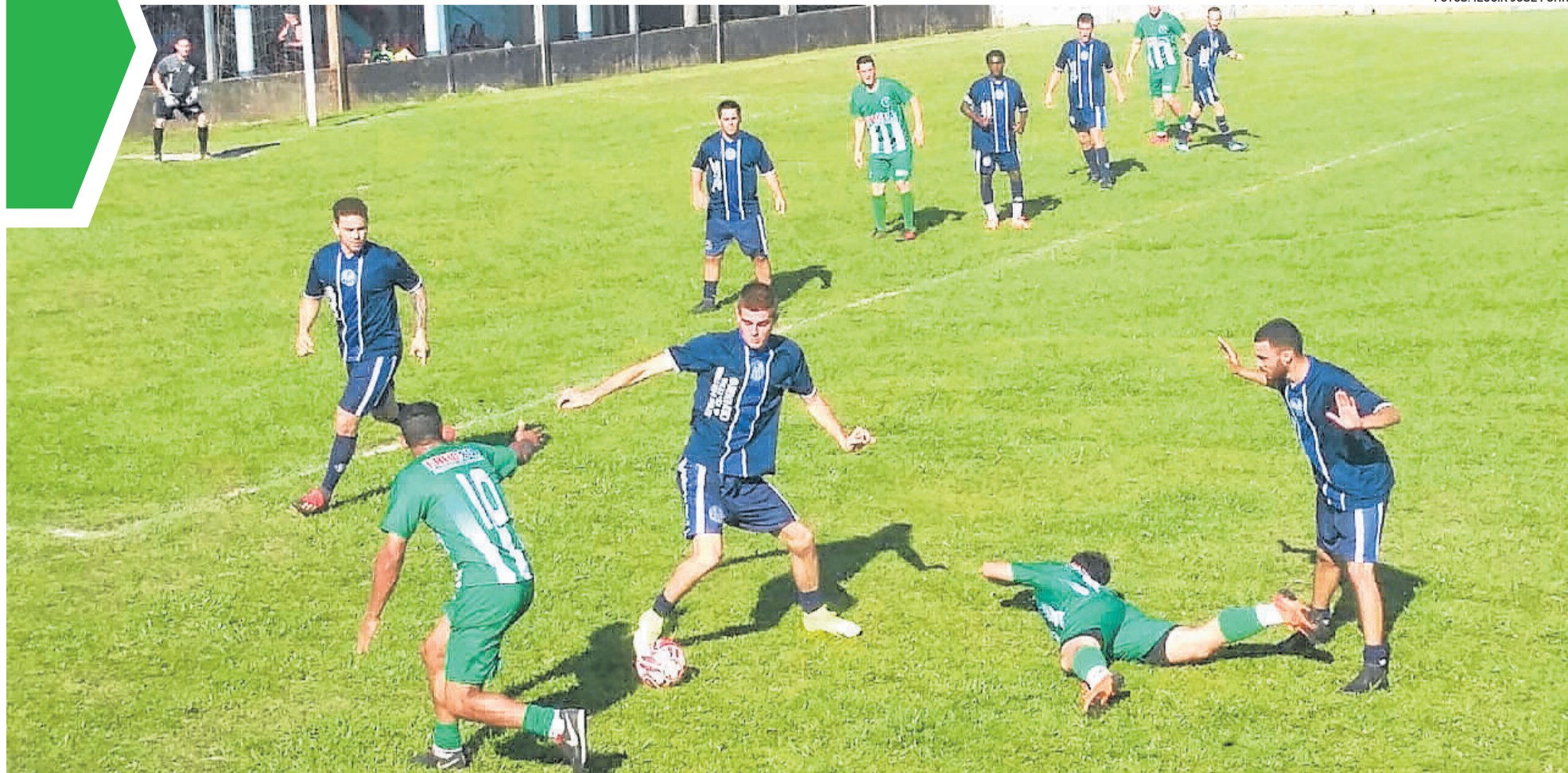
Minuano (verde) teve mais posse de bola, mas Alto Taquari foi eficaz e venceu por 1 a 0