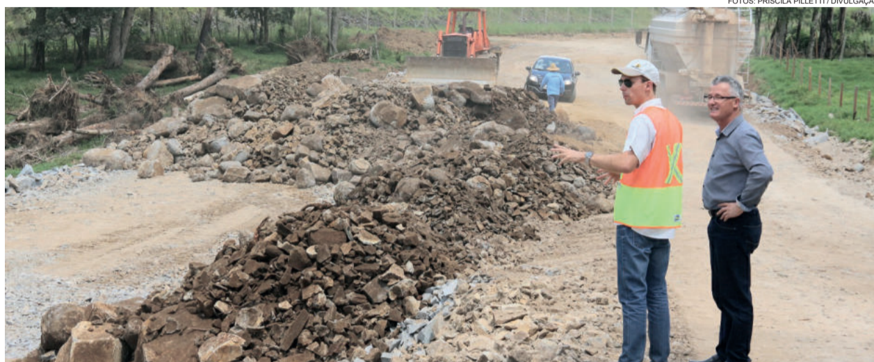
Pavimentação da Perimetral Oeste

As estradas da área rural do município ainda estão recebendo roçadas em seu entorno, limpeza realizada para melhorar a visibilidade nas vias principais.