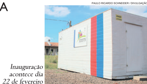
Inauguração acontece dia 22 de fevereiro

Também no dia 22 de fevereiro, das 9h às 15h, acontece a eleição da diretoria da Associação dos Moradores da Nova Morada, que possui uma chapa inscrita. A posse está agendada para o dia 27 de fevereiro, às 19h, na Câmara de Vereadores.