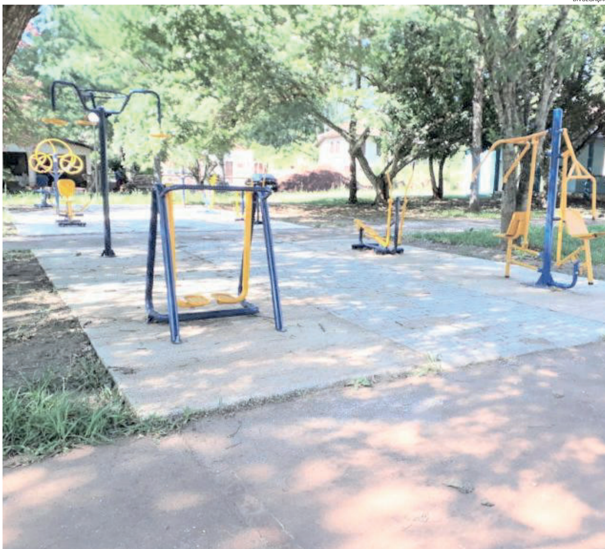
Academia ao ar livre na Cidade Baixa, em Paverama

As academias novas estão no Bairro Cidade Baixa, na praça Flor de Maio; no Bairro Morro Bonito, em frente a EMEF Prudêncio Franklin dos Reis; na Fazenda São José, em frente ao Campo de Futebol 7 e ao lado do Posto de Saúde da localidade; em Santa Manoela, ao lado da Quadra Coberta, junto ao campo do Internacional; em Linha Brasil, na praça de lazer da comunidade; na Boa Esperança, próximo a sede esportiva do União ou ao Ginásio de Esportes; e no Morro Azul, no Loteamento Morro Azul.