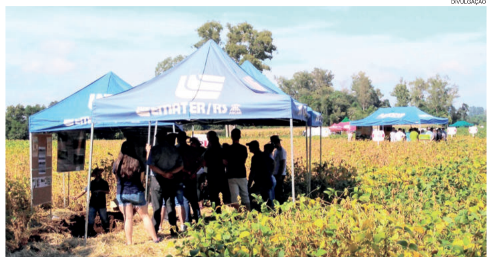
Diversas estações apresentarão as tecnologias disponíveis aos agricultores

Para interessados, haverá ônibus saindo de diversos municípios. Mais informações podem ser obtidas pelo telefone (51) 3760-1017.