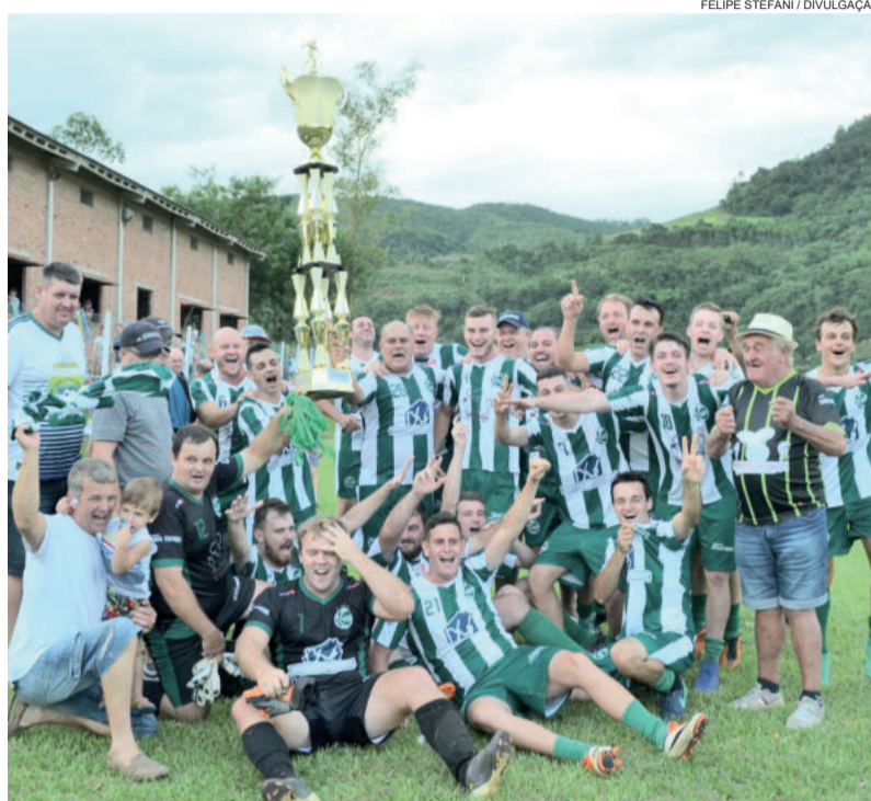
Juventude comemorou o título de Travesseiro

O campeonato ainda teve como melhor disciplina a equipe de São João e, em terceiro lugar, a SER Cultural Picada Felipe Essig.