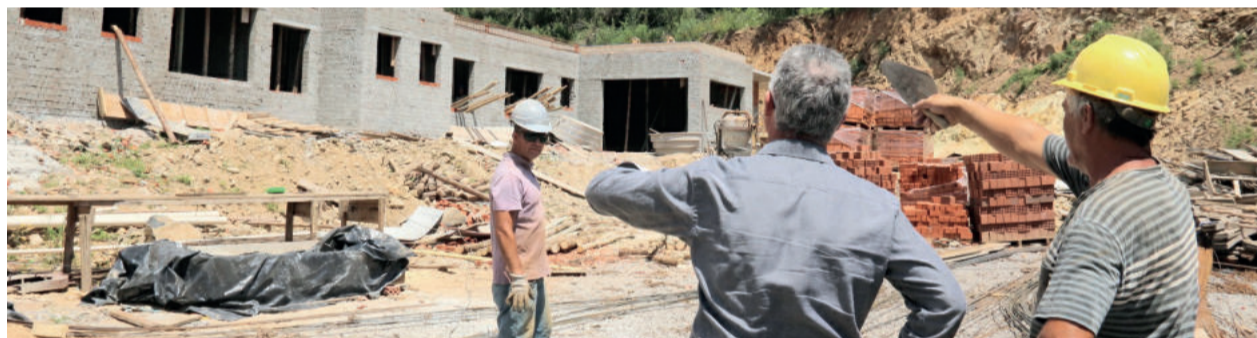
Construção da sede do 3º BRBM