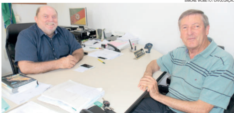
Delegado Regional recebeu o presidente da CIC Vale do Taquari na delegacia em Estrela