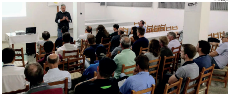
Encontro foi realizado no Restaurante Paladar, em Teutônia

Participaram do encontro, representantes dos municípios de Paverama, Forquethina, Cruzeiro do Sul, Bom Retiro do Sul, Colinas, Estrela e Poço das Antas, além de Teutônia. Em breve deverão ser realizados dias de campo em Paverama, Canudos do Vale e São Vendelino para divulgação do assunto. Além da Blue Sol, a Emater/RS-Ascar tem parceria com a empresa Sol Bras para a elaboração de projetos.