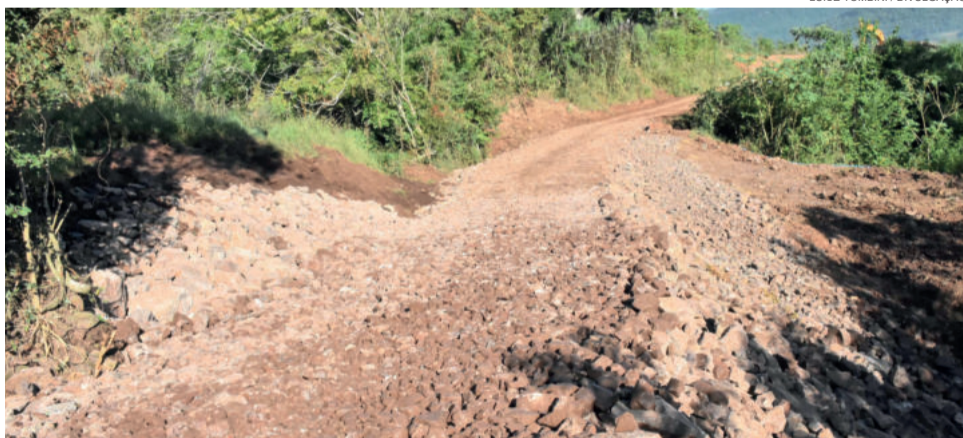
É necessário ter cautela ao transitar pela via, que ainda não foi concluída