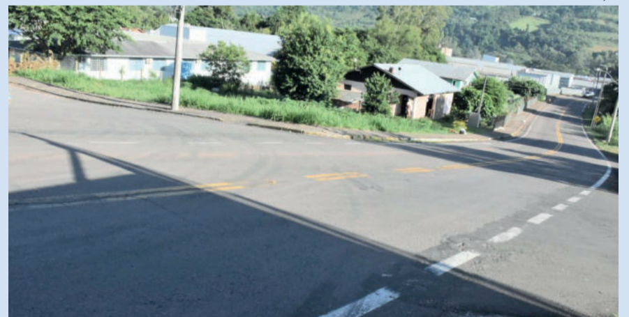
O trânsito será desviado para a Rua Pastor Heirich Brackemeier e Rua Getúlio Vargas até a Av. Dr. Ito João Snel