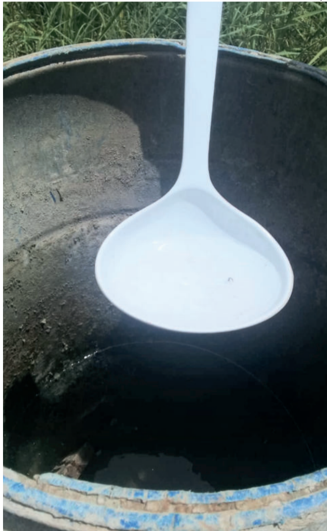
Criadouros de mosquitos podem ser evitados com medidas simples

Borba lembra que, além da presença do mosquito em Teutônia, há uma possibilidade do mesmo estar infectado com os vírus da dengue, zika e chikungunya. Por isso, se faz necessária a adoção de medidas preventivas para eliminar o mosquito, evitando assim a contaminação.