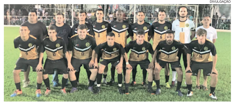
Danados entra em campo na próxima sexta e tenta permanecer na liderança da Chave C

Próxima rodada acontecerá na próxima sexta-feira (22) e terá jogos em todas as categorias.