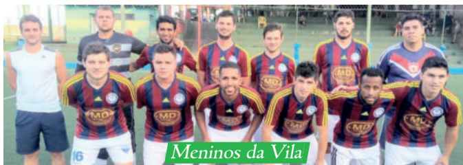
Meninos da Vila