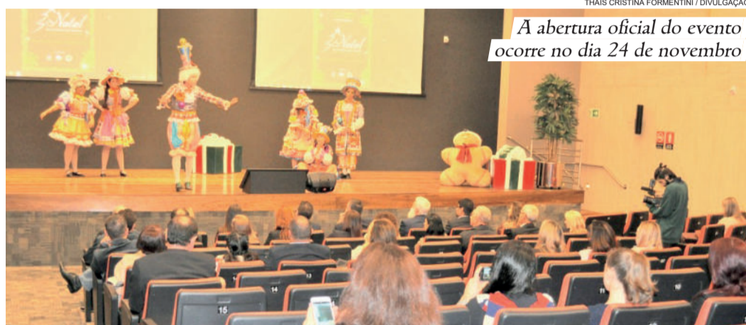
A abertura oficial do evento ocorre no dia 24 de novembro