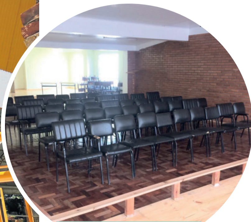
Sala de vídeo foi transformada em miniauditório