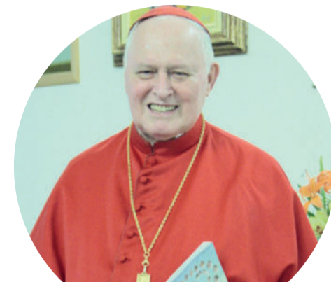
Dom Aloísio Lorscheider

O Papa polonês o transferiu para a Arquidiocese de Aparecida em 1995 até sua renúncia, pedida após atingir o limite canônico de idade, deixando a Arquidiocese em 2004. O religioso entregou o cargo para Dom Raymundo Damasceno Assis e retirou-se para o Convento dos Franciscanos, em Porto Alegre, onde passou os últimos anos de sua vida. Faleceu em 23 de dezembro de 2007.