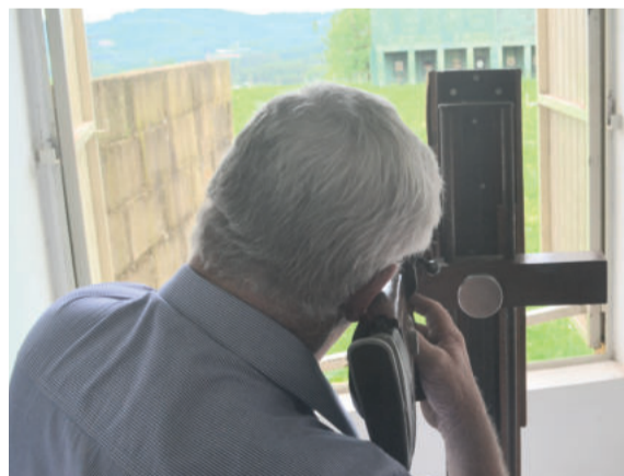
Cada atirador podia dar até 3 tiros, nos estandes de Linha Clara