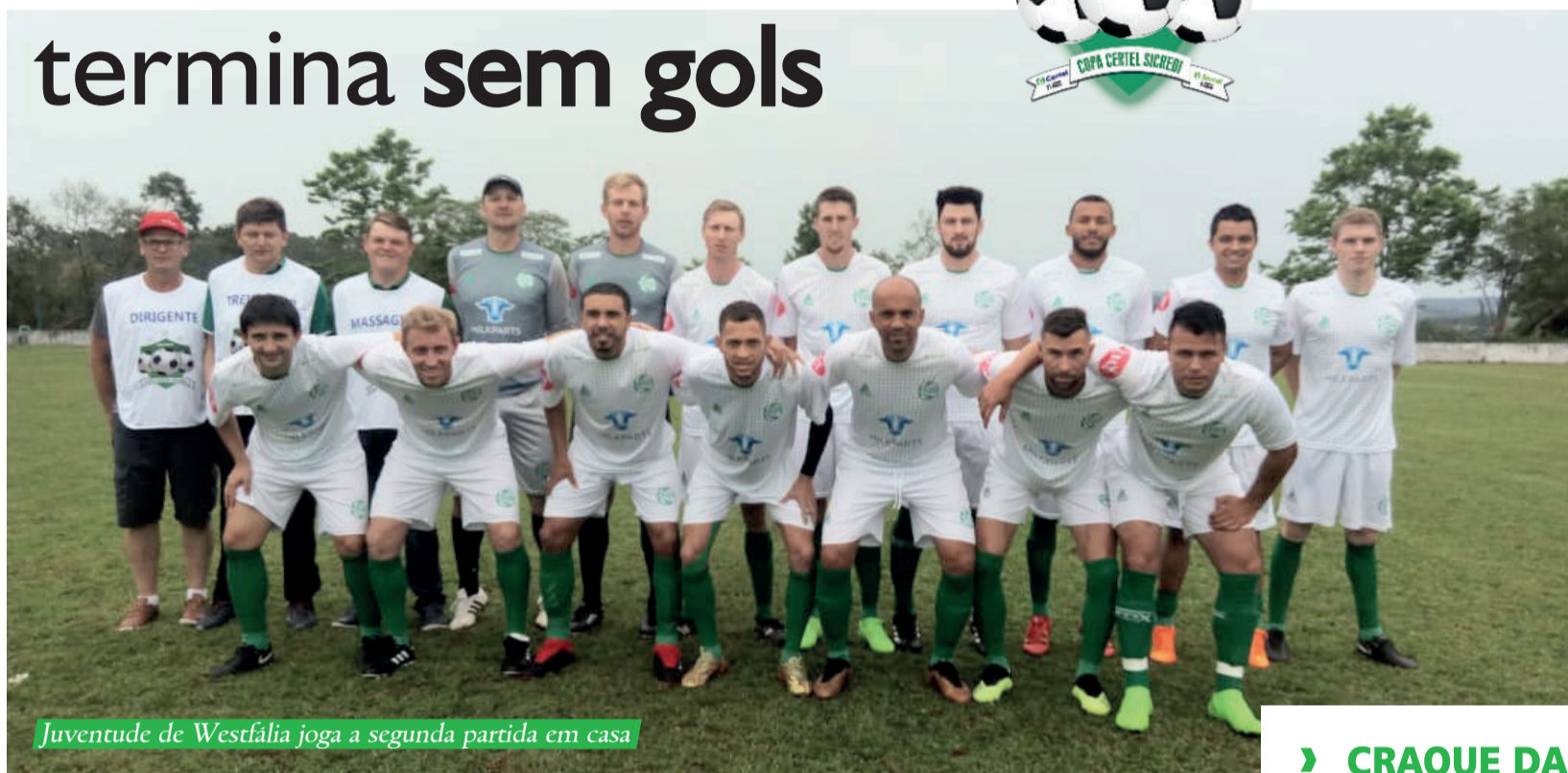
Juventude de Westfália joga a segunda partida em casa