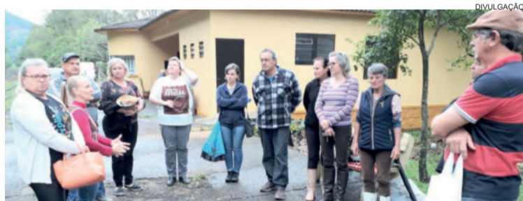
Estação Ferroviária foi sede de aula prática de ajardinamento durante o curso