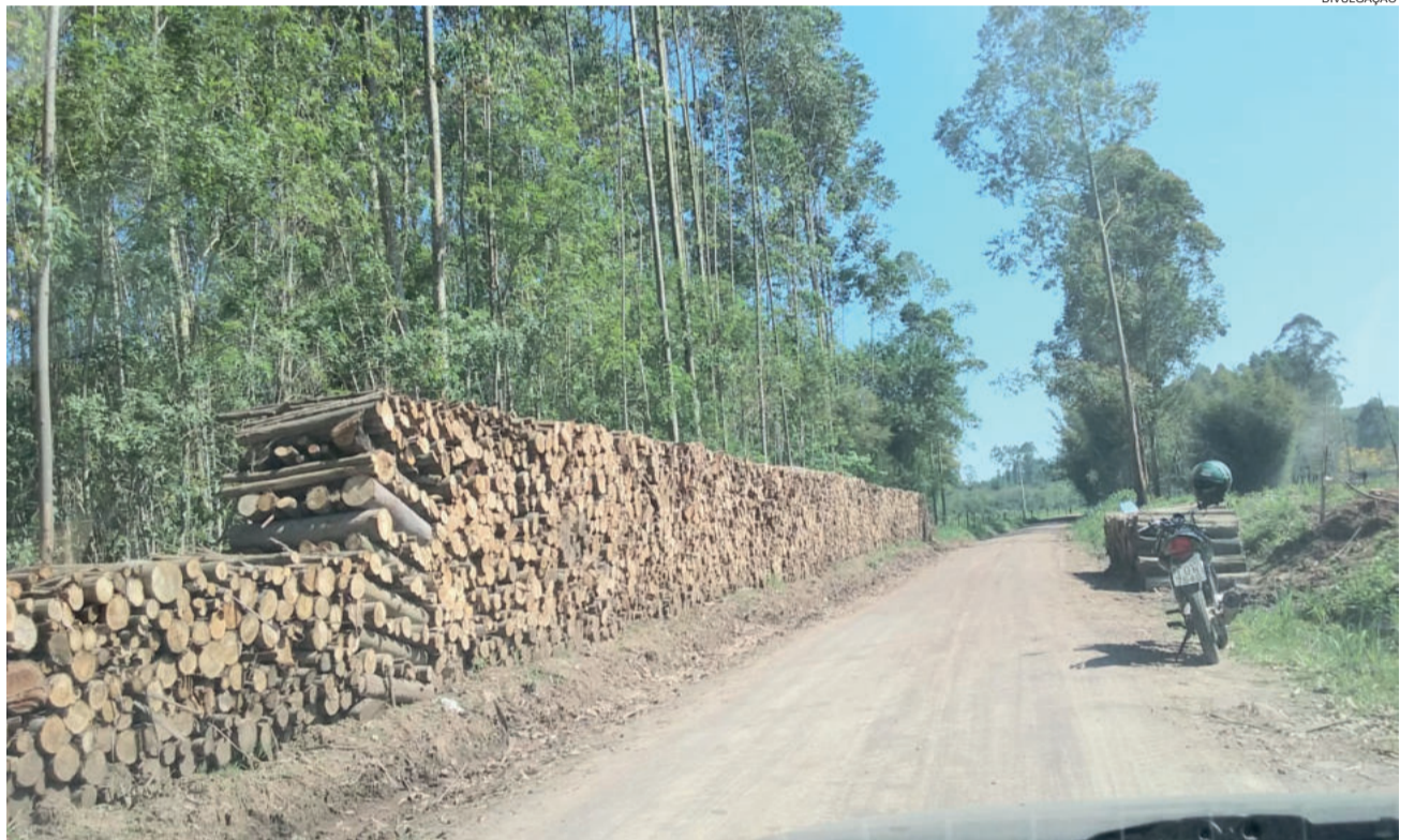
Lenha posta adequadamente, e não sobre valetas, facilita tráfego de veículos e evita transtornos com a água da chuva

A medida visa melhorias nas vias do município