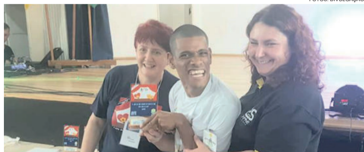
Jones conquistou o 1º lugar na categoria Artes Literárias

Apae de Teutônia participou neste evento nas modalidades dança, artes musicais, dança folclórica, artes literárias e artes visuais/artesanato.