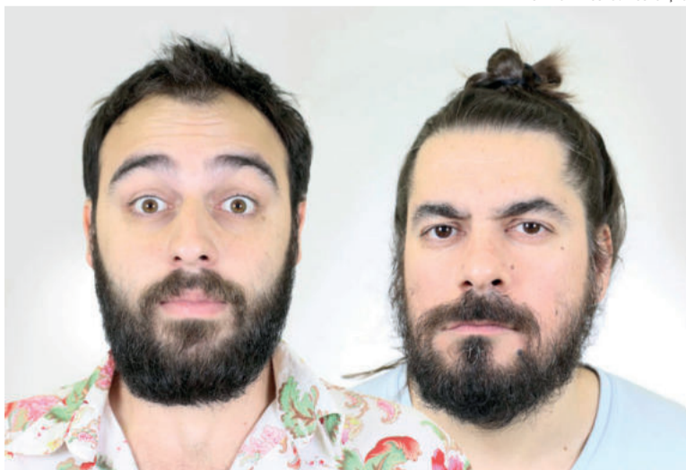
Mais dois espetáculos de comédia estão na programação do Teatro Univates

Este é o ano da comédia no Teatro Univates. Depois de apresentações como a de Afonso Padilha, Fernanda Souza, Pretinho Básico e, a mais recente, de Thiago Ventura, novas atrações de humor foram confirmadas na agenda da maior casa de espetáculos do Vale do Taquari.