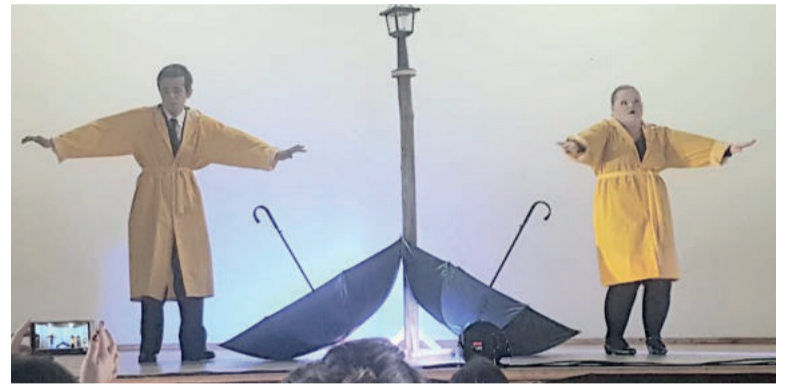
Dança também trouxe 1º lugar para a Apae Teutônia

"Estamos muito felizes com nossa participação, foi um dia de grandes espetáculos e de muita emoção", destacam a direção da escola e os professores que acompanharam os alunos que represen-