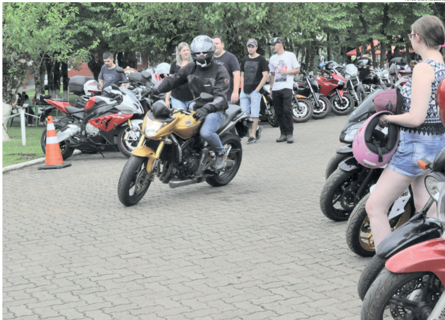
Motociclistas de várias cidades prestigiaram o encontro