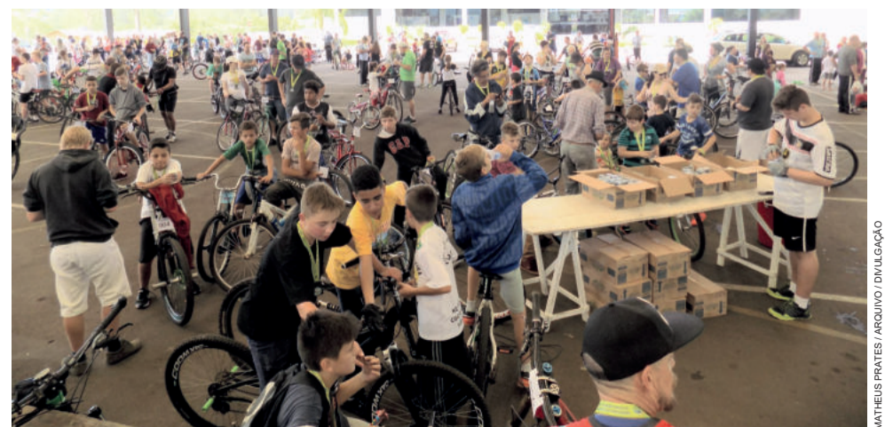
Passeio Ciclístico visa incentivar o uso da bicicleta

Luersen e Flach ainda apresentaram sugestões ao Executivo, com o propósito de estimular o uso da bicicleta, dentre elas, a instalação de bicicletários em pontos estratégicos do município.