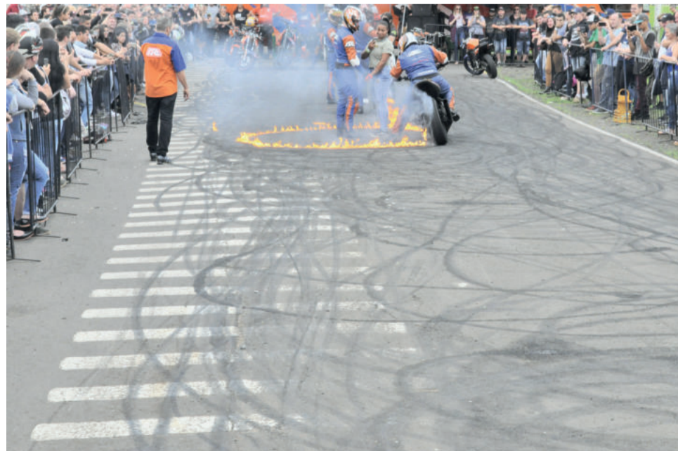
Equipe especializada fez manobras radicais para o público