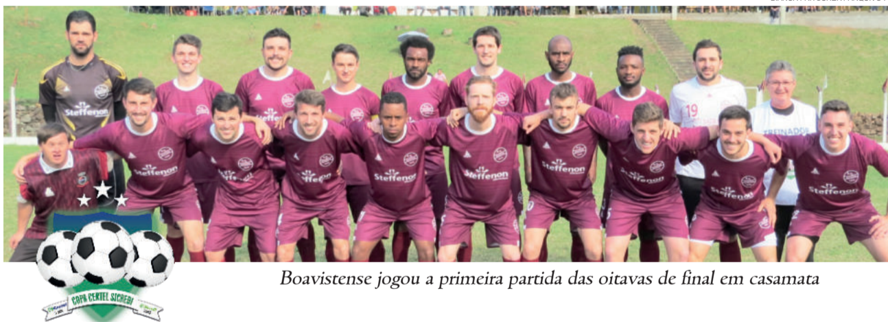
Boavistense jogou a primeira partida das oitavas de final em casamata