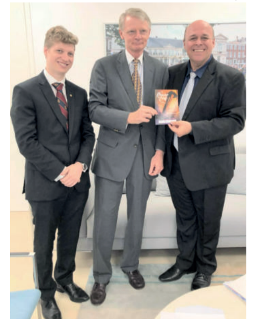
Entrega do convite ao embaixador