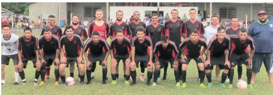
União de Linha Germano