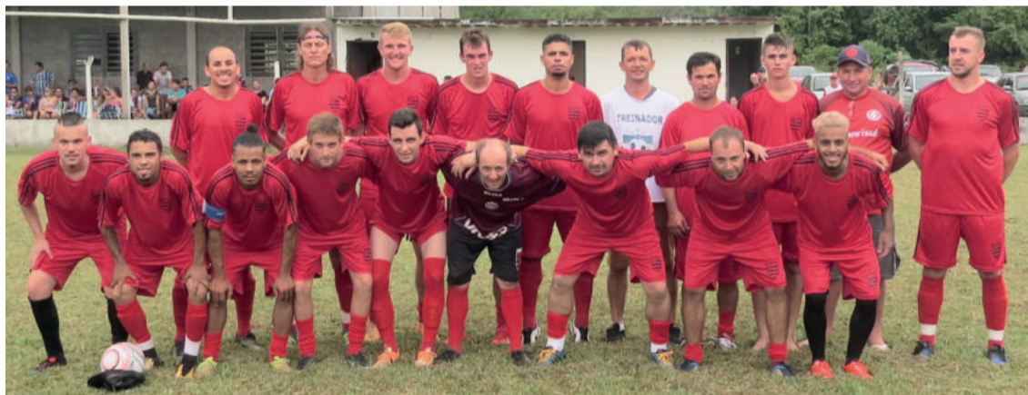
Flamengo de Linha Germano