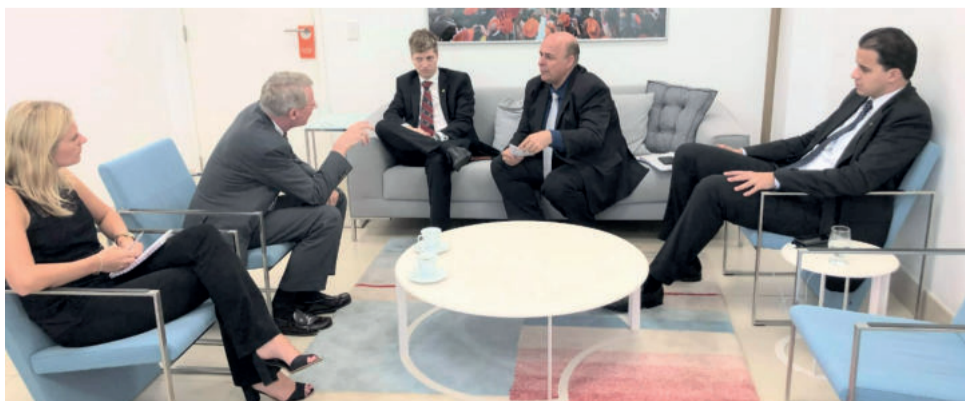
Reunião foi realizada em Brasília