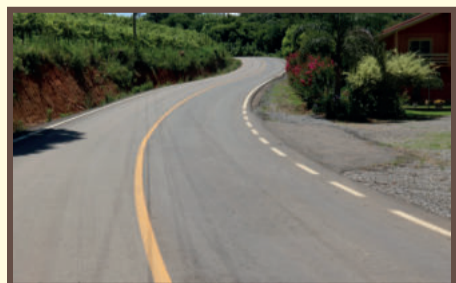
Linha Araújo e Souza a São Gotardo - R$ 1,158 milhão