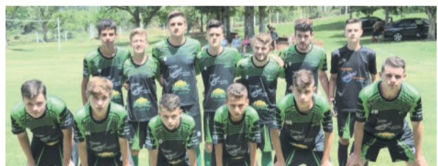
Atlético Tamanduá - Sub-16