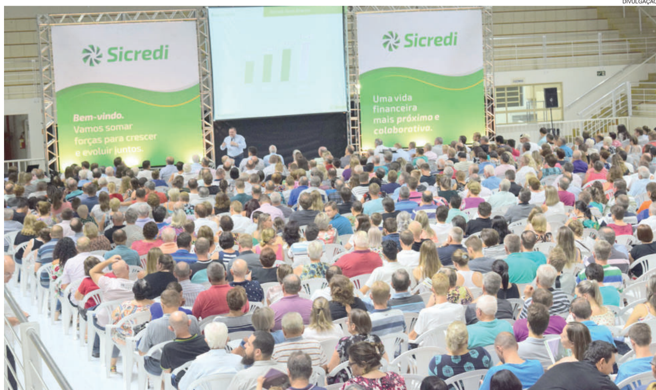
Assembleias da Sicredi Ouro Branco reuniram mais de 11 mil associados em 2018