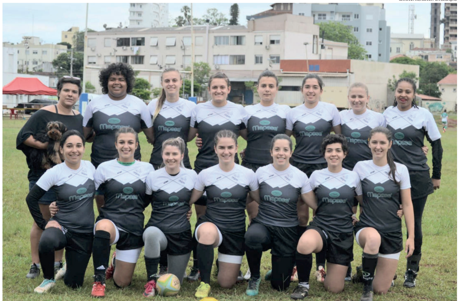
Time feminino retomou atividades após um ano parado