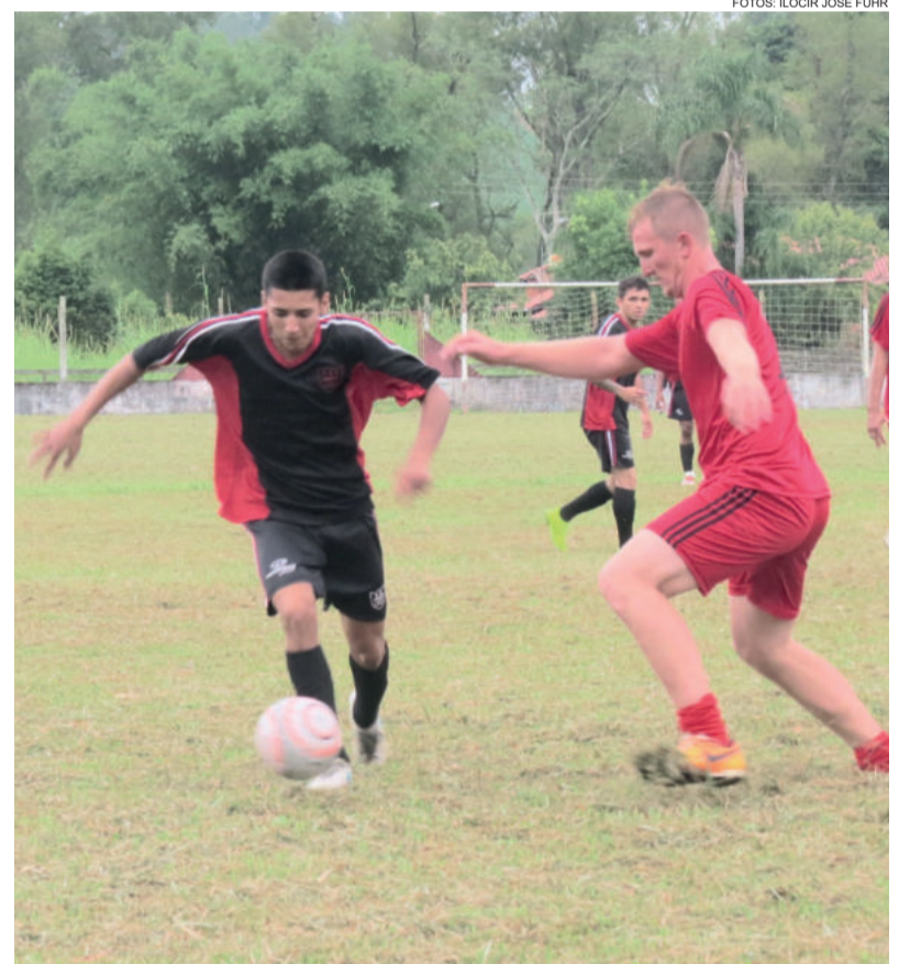
Flamengo e União fizeram bom clássico domingo e tentam pontuar contra outros adversários