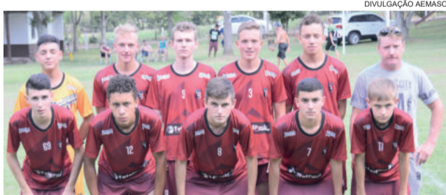
Reis do Danone - Sub-16