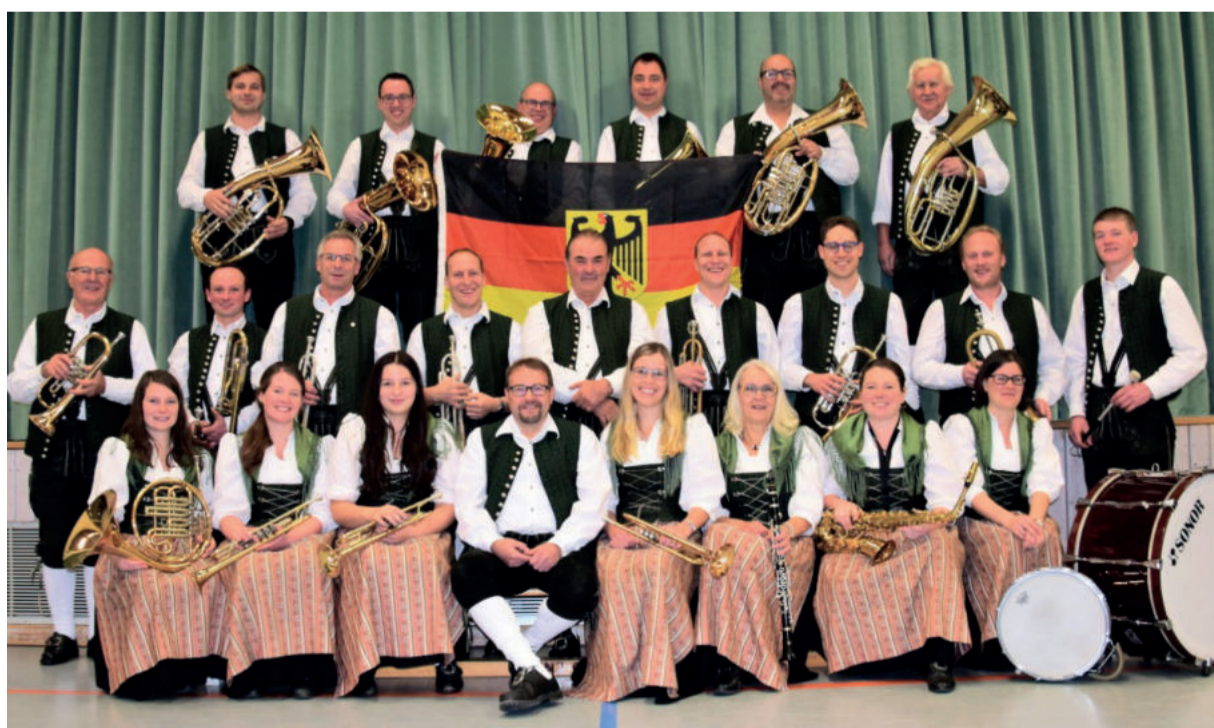
Orquestra Alemã será outra atração especial