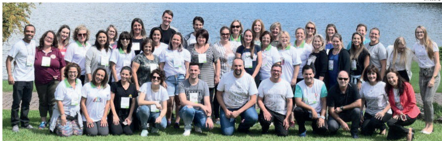
Lagoa da Harmonia em Teutônia sediou o evento das cooperativas escolares