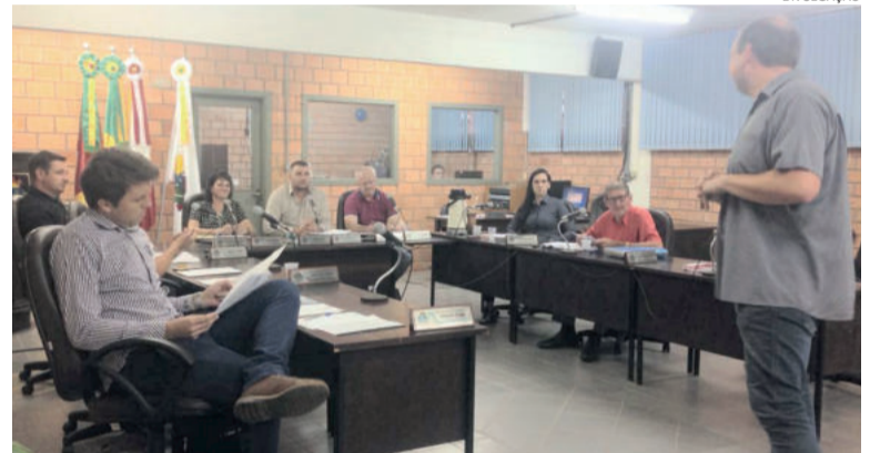
Sepultura com um crucifixo arrancado

Scheffler falou também, no uso da tribuna, a respeito da já solicitada obra para raspagem, limpeza e pintura das faixas de pedestres, lombadas e meio-fio. De acordo com ele, comerciantes locais solicitaram, também, a implantação de placas que limitem o estacionamento para até 15 minutos em frente aos estabelecimentos, para favorecer a utilização do estacionamento por parte dos clientes.