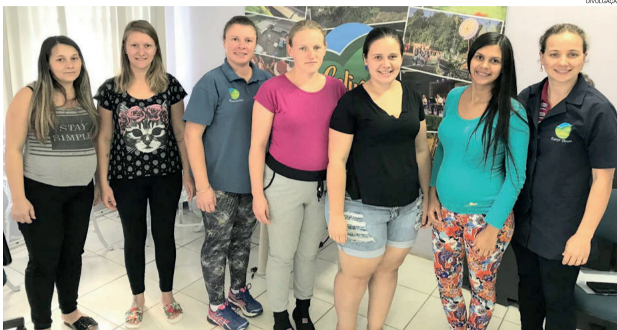
Seis mulheres participaram da roda de conversa nesta semana

O Grupo Bem Gestar e o pré-natal do parceiro são iniciativas do Projeto Colinas 1000 Dias, que se preocupa com os primeiros mil dias da criança, iniciando ainda em fase de gestação. O próximo encontro do Grupo de Gestantes será dia 19 de março, às 14h no Posto de Saúde, e terá como tema “Cuidados com o Bebê”. O objetivo dos encontros é oferecer informações sobre gravidez, cuidados com o bebê, e proporcionar troca de experiências entre gestantes.