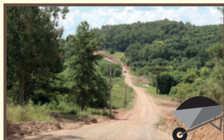
Perimetral Oeste - R$ 4 milhões