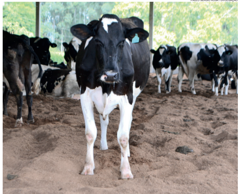
Setor primário de Teutônia é destaque no Vale

- Horas máquina: escavadeira hidráulica (128 solicitações, atendendo 39 propriedades, totalizando 178 horas), motoniveladora, retroescavadeira (172 solicitações, aten-