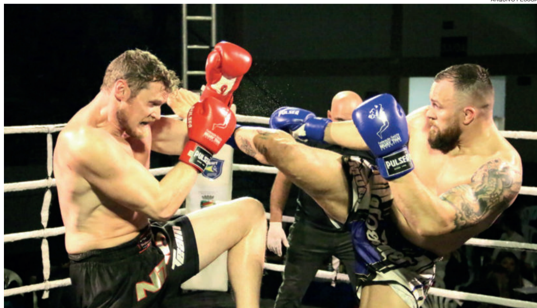
Mão de Pedra venceu na categoria mais 91kg