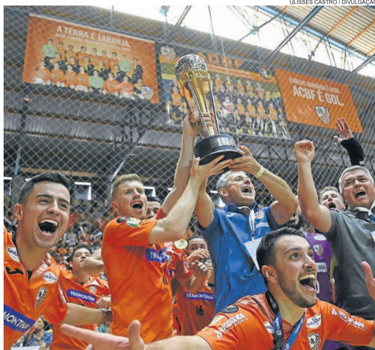
ACBF é atual campeã da Libertadores

As 12 equipes serão divididas em três grupos de quatro times. Os cabeças de chave serão a ACBF (atual campeã), San Lorenzo (sediente) e Corinthians (membro da Associação vice-campeão da última edição).