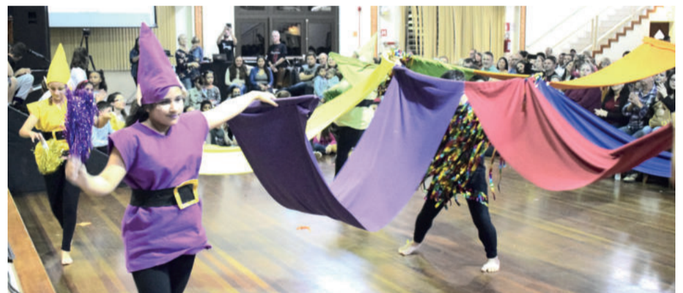
Alunos ensaiam a mais de um ano as apresentações