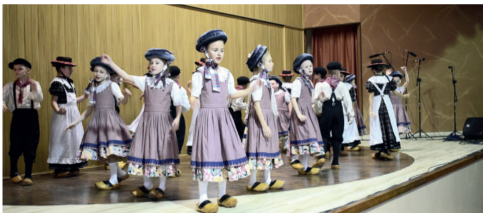
Crianças de diversos municípios participaram