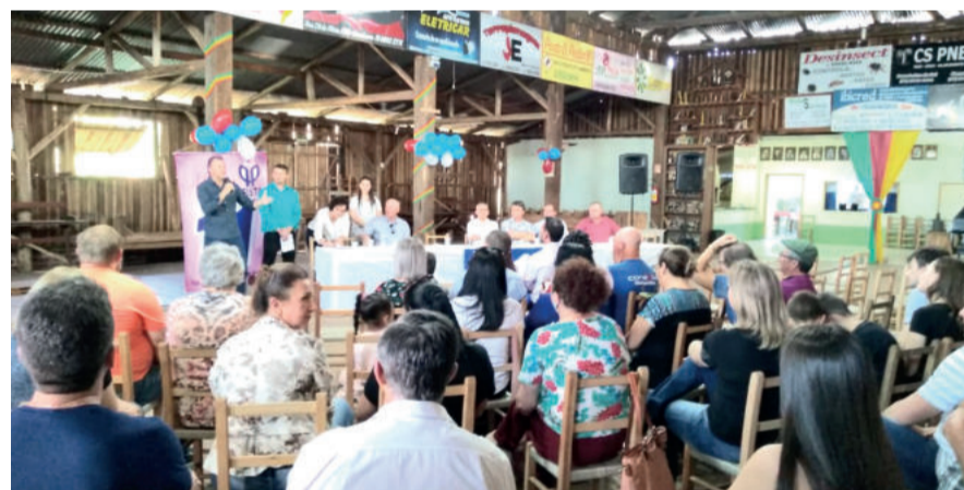
Encontro também serviu para mobilização e filiação de novos integrantes