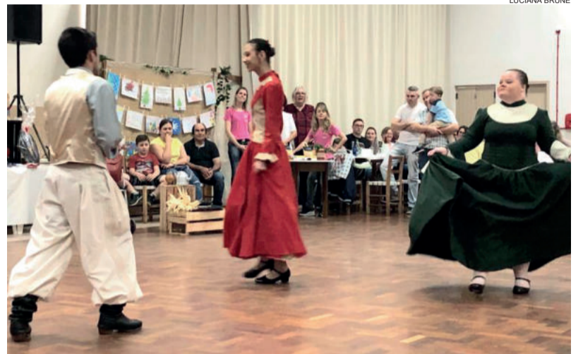
Alunos mostraram um pouco do seu talento