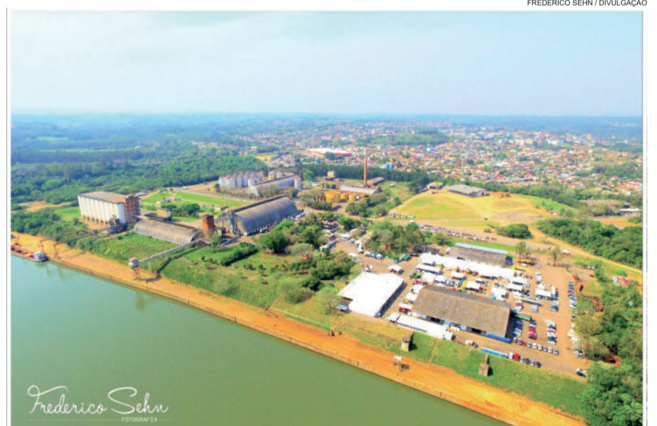
Porto sediará a feira entre os dias 4 e 9 de setembro

A sexta edição da Estrela Multifeira ocorre no período de 4 a 9 de setembro. O evento é uma realização da Cacis, com o apoio da Prefeitura e Câmara de Vereadores de Estrela. Em 2017, a programação registrou um público de 42 mil pessoas e contabilizou mais de R$ 10 milhões de negócios.