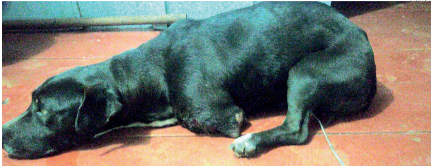
Acredita-se que o arrombamento e a mutilação aconteceram um dia antes da cadela ser encontrada

De imediato, Maciel levou o animal para o Centervet, clínica que aceitou fazer o atendimento naquele momento. Maciel ex-