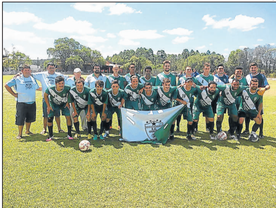
Guaíba está com duas vitórias em dois jogos