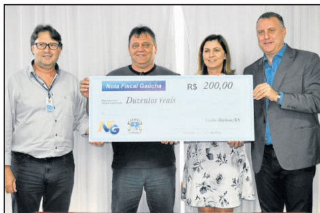
Barbosenses receberam premiação no valor de R$ 200