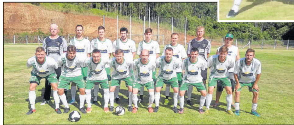
Palmeiras foi o campeão da 1ª edição, em 2013, e apresenta a melhor campanha em 2018