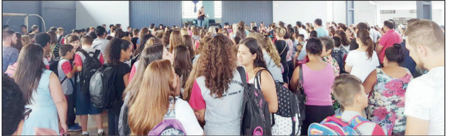
Na EMEF Teobaldo Closs alunos foram recebidos com programação especial

Escola Municipal de Ensino Fundamental Bento Gonçalves, no Bairro Boa Vista, não serão as reformas que vão chamar a atenção, mas sim um prédio completamente novo. Os 68 alunos atendidos na unidade escolar começaram o ano em uma nova estrutura. São atendidos alunos desde a educação infantil até o 5º ano no local que conta com quatro salas. São duas para as aulas com turmas multiseriadas, além de uma biblioteca e sala de informática. A escola tem área de 621 metros quadrados construídos.