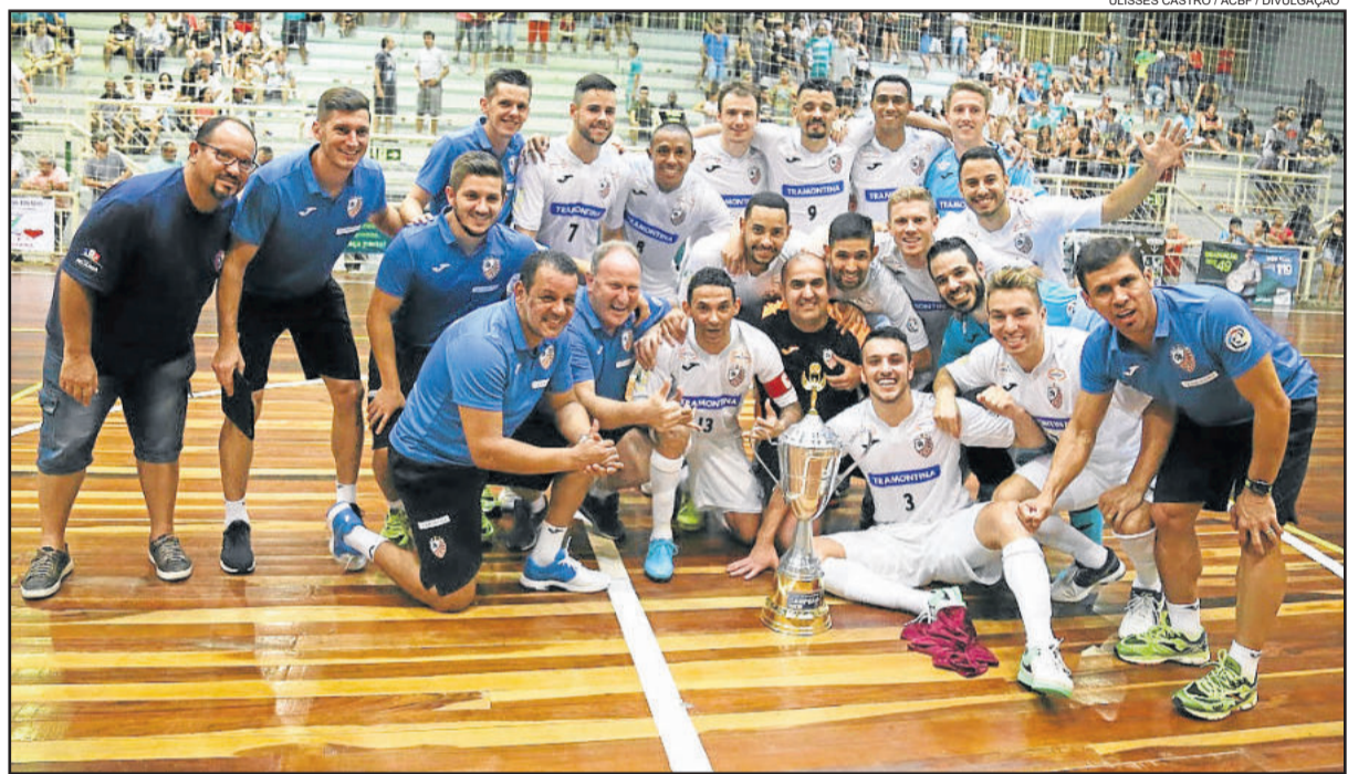
ACBF comemora o título da Copa Três Coroas

A ACBF voltou aos treinos nesta segunda-feira. O próximo compromisso será na sexta-feira, dia 23, contra o Joinville, fora de casa. A partida vale a Taça Joma e reúne os últimos campeões da Liga Nacional de Futsal (Joinville) e da Libertadores da América (ACBF).