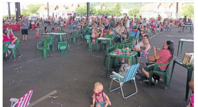
Evento reuniu famílias no Centro Administrativo