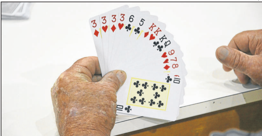
Previsão de início da terceira edição do campeonato é em 09 de março