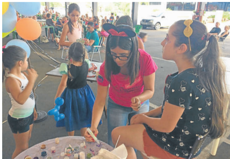
Crianças puderam se enfeitar para a folia com a maquiagem decorativa