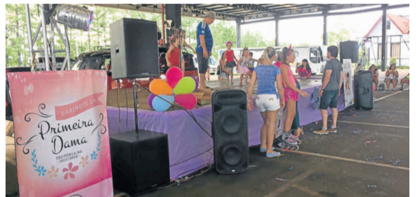
Muita festa com os acessórios e as marchinhas que tocaram durante toda a tarde