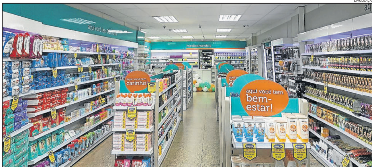
Interior da loja foi remodelado