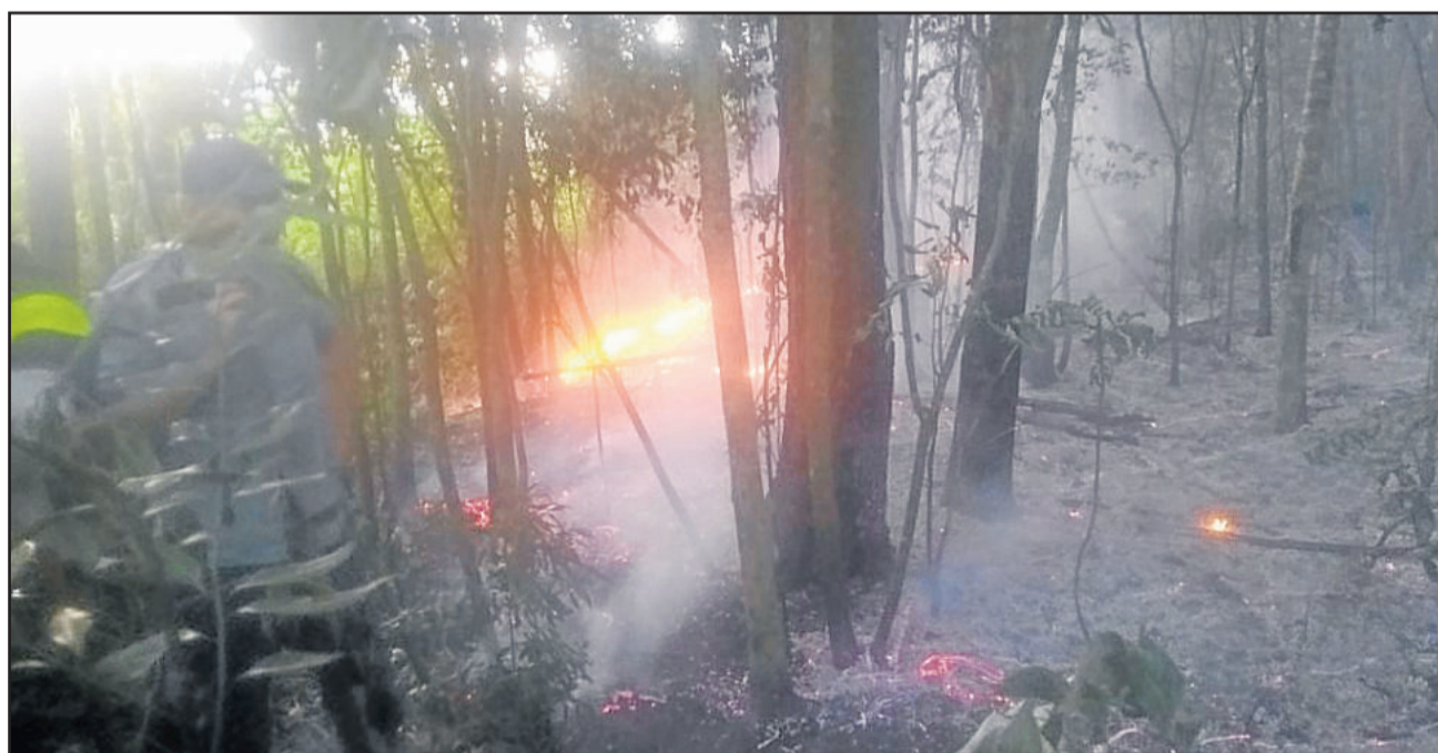
Incêndio atingiu trecho entre a ferrovia e fundos do curtume