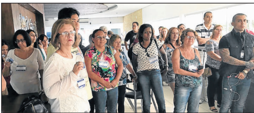
Pontos de Imigrante e roteiros da região foram apresentados pela Imitur