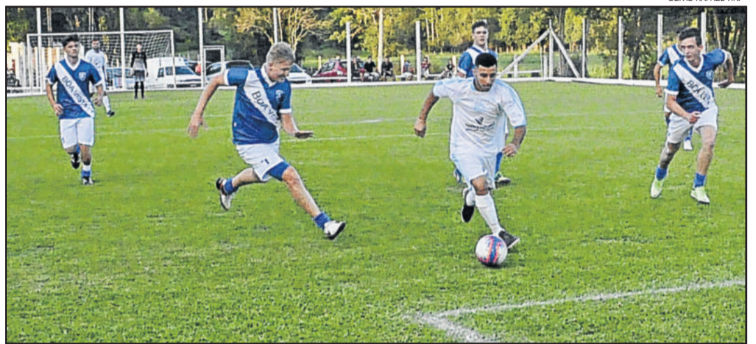
Rodada teve os últimos jogos da primeira fase nas categorias Sub-20 e Força Livre