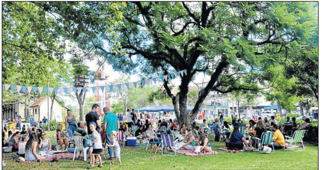
Centenas de pessoas se reuniram no Parque da Estação

O Piquenique na Estação é uma realização da Administração Municipal de Carlos Barbosa, através de parceria entre as Secretarias de Esportes, Lazer e Juventude e de Desenvolvimento Turístico, Indústria e Comércio.