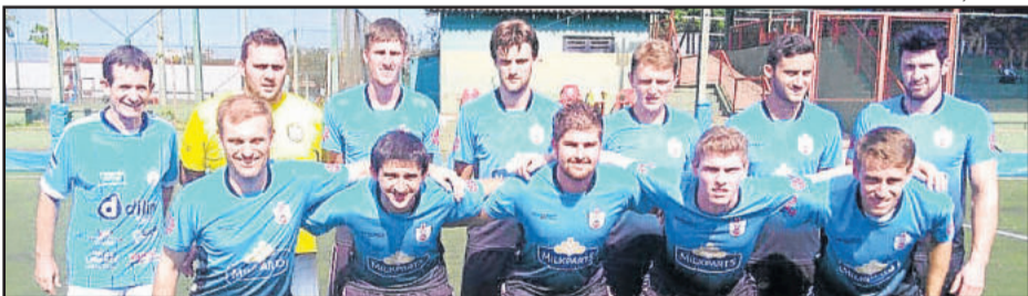
Saidera foi o único time a não sofrer gols na 1ª rodada