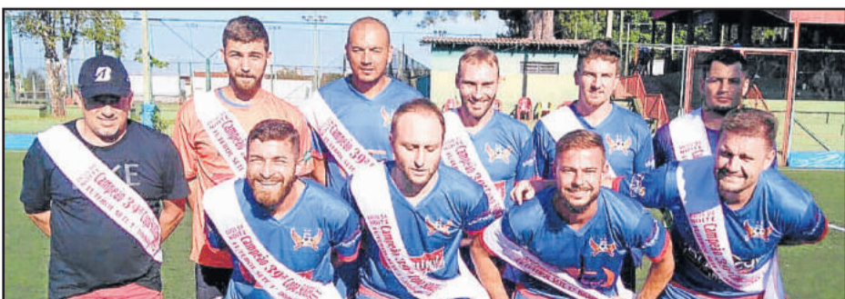
Anjos da Noite recebeu as faixas pelo título de 2017, mas perdeu na abertura