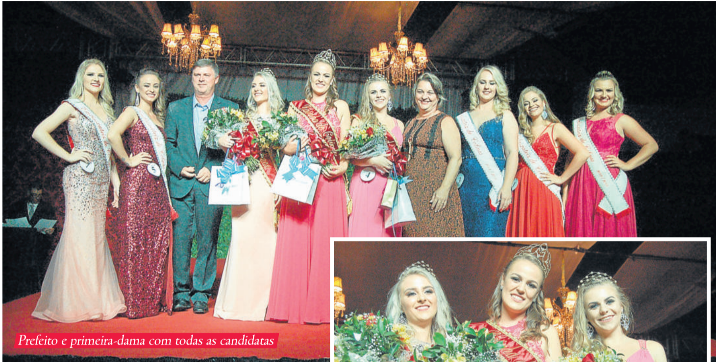
Prefeito e primeira-dama com todas as candidatas