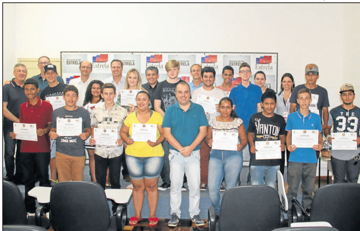
Primeiras duas turmas já receberam seus diplomas

O Programa Desenvolvendo Gerações - Jovem Aprendiz oportunizou ao longo dos últimos cinco meses, a mais de 100 jovens na faixa etária dos 14 aos 17 anos, uma capacitação visando a futura inserção no mercado de trabalho. Nesta terça-feira (20/03), os participantes das últimas três turmas do curso, oferecido gratuitamente pela Secretaria Municipal do Desenvolvimento Social, Trabalho e Habitação (Sedesth), receberão seus diplomas, às 13h30min, na Câmara de Vereadores de Estrela, em cerimônia que deverá contar com familiares dos mais de 60 jovens e autoridades.