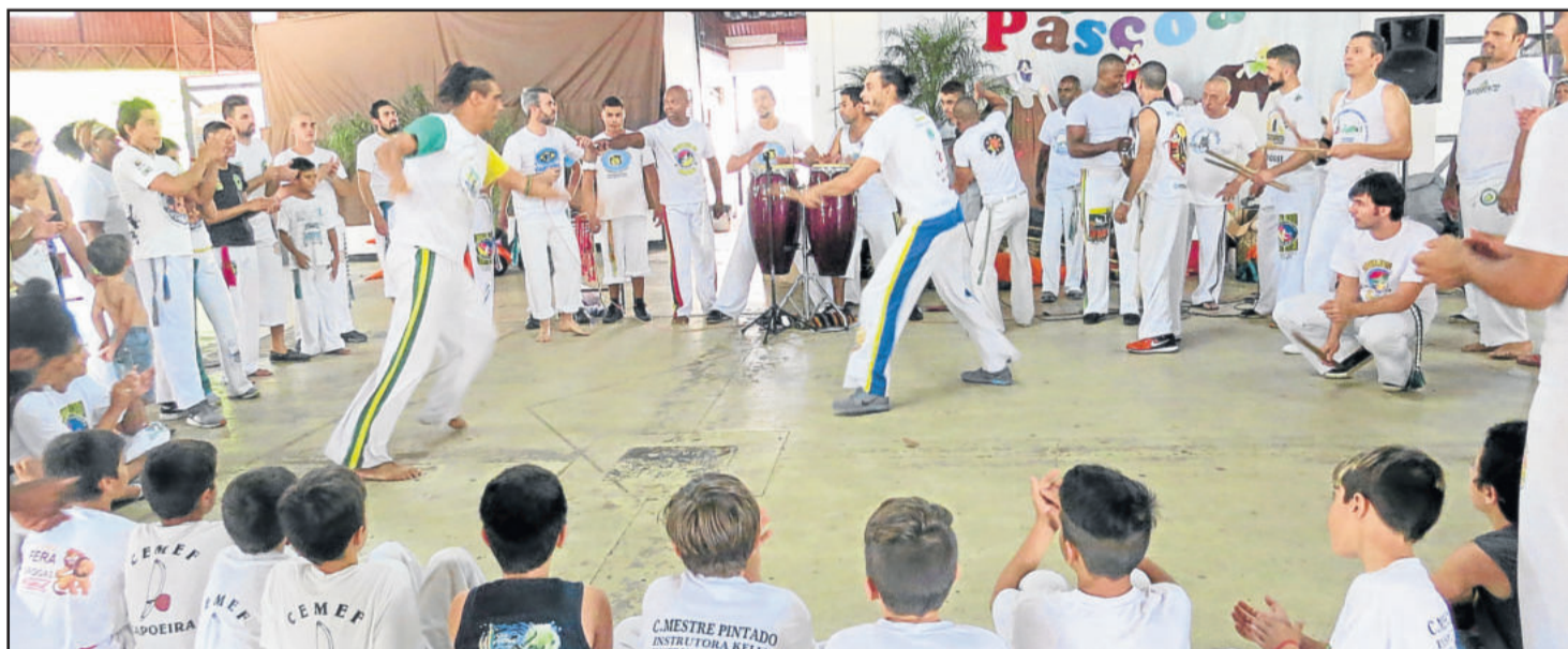
Mestres e alunos formaram uma roda de capoeira para encerrar o evento no sábado (17/03)

Nas escolas, os trabalhos foram desenvolvidos na quinta e sexta-feira, nos turnos da manhã e da tarde, envolvendo as crianças dos núcleos de cultura. Foram feitos workshops e rodas de capoeira, realizadas no CEMEF, na Escola 24 de Maio do Loteamento 8 e na Escola Guilherme Sommer da Vila Popular. O evento também contou com a 5ª edição dos Jogos Competitivos de Capoeira, com premiações em medalhas do 1º ao 3º lugar, no CEMEF. No sábado, no Centro Cívico da Prefeitura, o evento teve encerramento com roda de capoeira, muitos jogos, música e animação. Contou com apresentações do Grupo Danças e Ritmos do CEMEF e Terceira Idade, formatura dos alunos dos núcleos de cultura e entrega dos certificados.