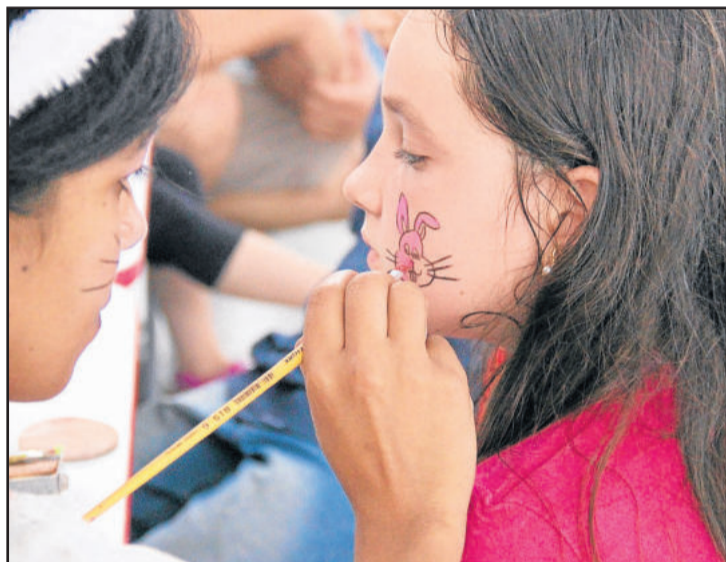
Pinturas no rosto das crianças será uma das atrações da festa

P áscoa é tempo de alegria e renovação. E para adoçar a data para as crianças, a Prefeitura de Garibaldi, por meio das Secretarias Municipais de Educação e Esportes e Lazer, realiza mais uma edição da Festa da Páscoa. No sábado, dia 24 de março, estarão disponíveis brinquedos infláveis, recreação e um delicioso lanche surpresa no Ginásio Municipal de Esportes, das 14h às 17h. Crianças da Educação Infantil ao 5º ano são convidadas a participar da festa, que tem entrada gratuita.