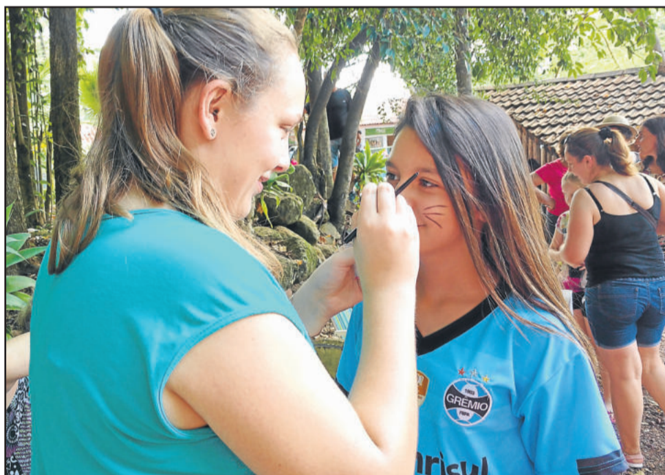
Pintura de rosto antes da caça ao ninho

Na entrada do Município, na Linha Santo Antônio, uma nova atração também movimentou grande número de turistas, a inauguração do parque temático Mundo Gigante.