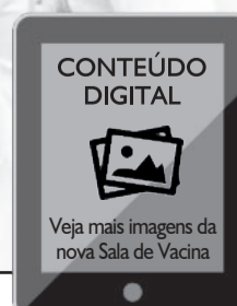
Inauguração do espaço ocorreu na tarde de quinta-feira (15/03)