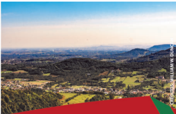
CRÉDITOS: WILLIAM W. DUNIC