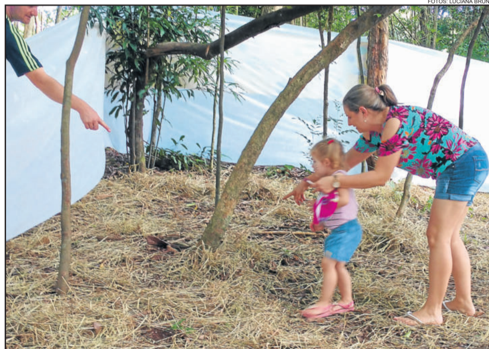
Pais ajudando os filhos pequenos a encontrar o seu ninho