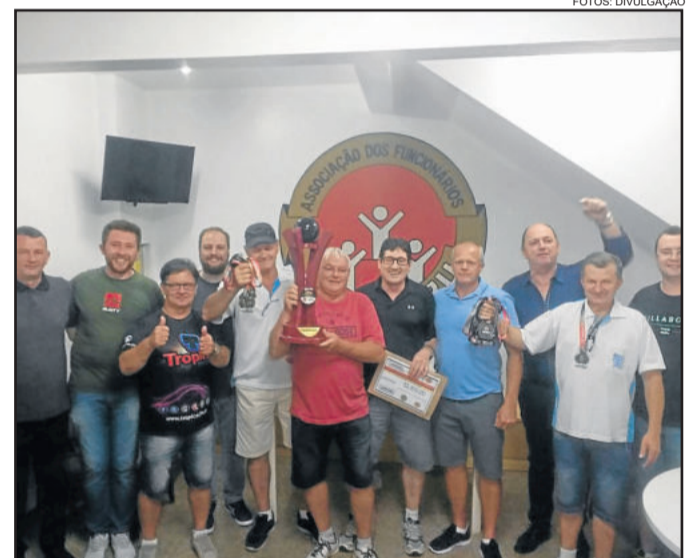
Bola XV, campeão