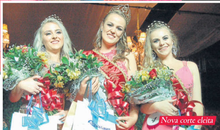
Nova corte eleita