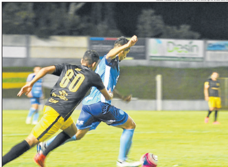
Lajeadense busca o primeiro gol e a primeira vitória na competição

Taquari realizou dois amistosos com este mesmo adversário e ganhou as duas partidas.