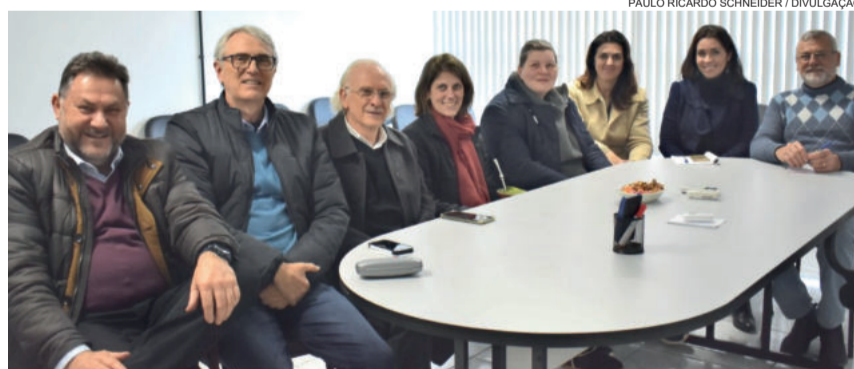
Secretário e equipe, com os representantes dos laboratórios, no encontro em que foi anunciada a verba