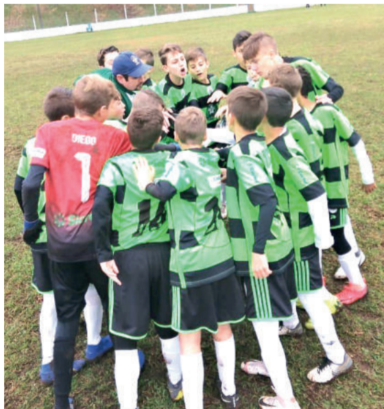
Pelo Campeonato Serrano, vitória e empate diante do Santos

O domingo (14/07) também foi de amistosos para as categorias de iniciação da Juventus. As equipes Sub-10, Sub-9, Sub-8 e Sub-7 subiram a Serra Gaúcha, na cidade de Veranópolis, onde enfrentaram as equipes do Titabol. A Juventus obteve vitória nos quatro jogos, em um dia extremamente proveitoso para as crianças.