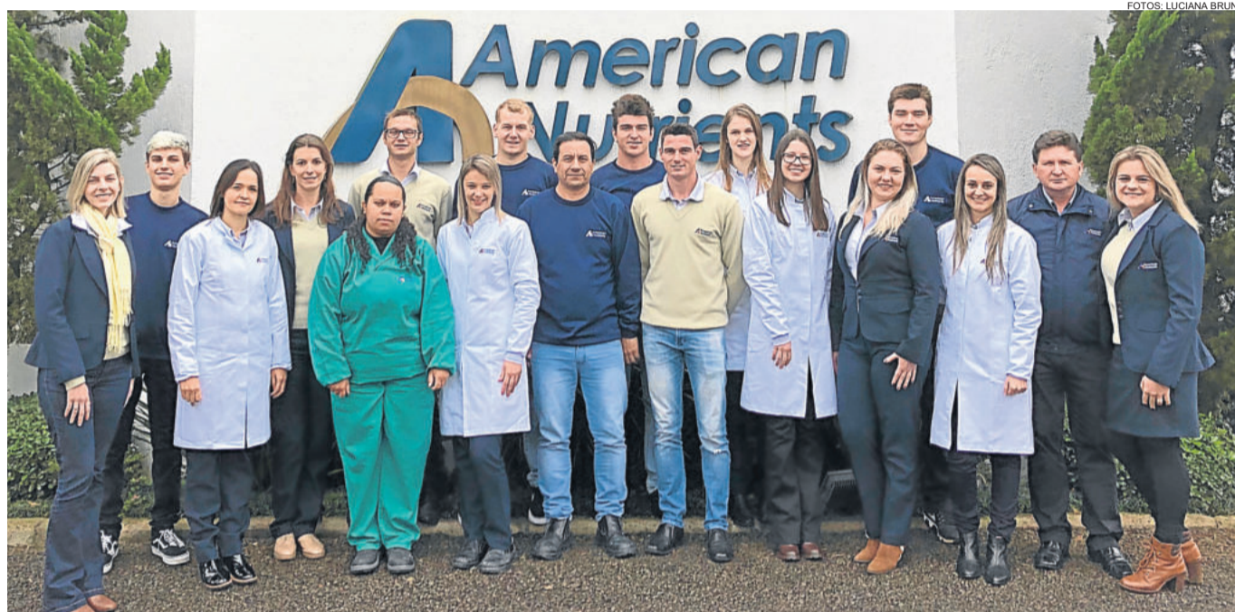
Equipe American Nutrients reunida em Teutônia no dia do aniversário da empresa