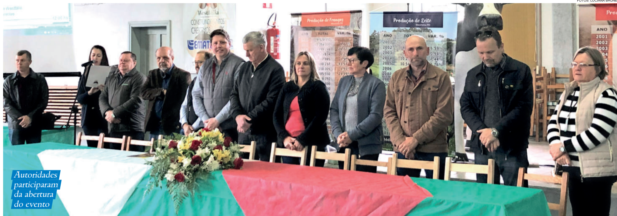
Autoridades participaram da abertura do evento