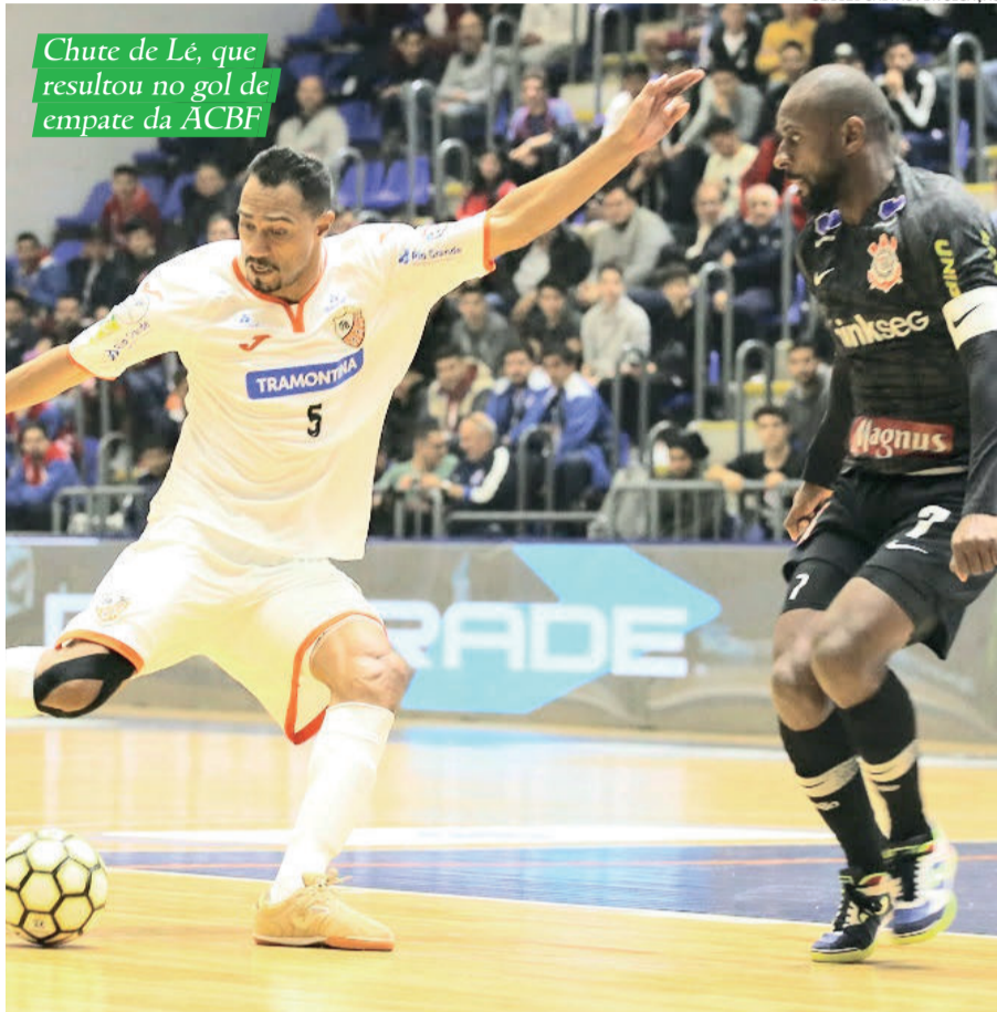
Chute de Lé, que resultou no gol de empate da ACBF