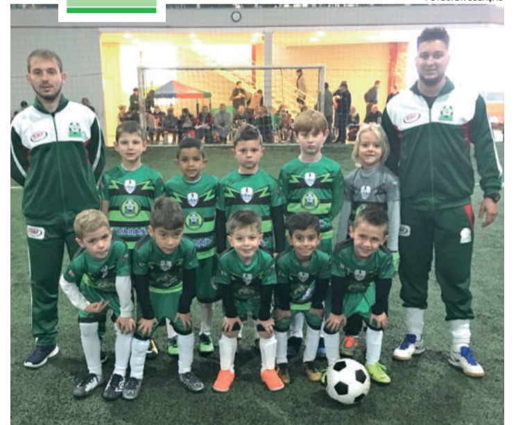
Amistosos com escola Titabol em Veranópolis