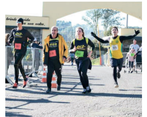
Kommer ficou em 2º lugar nos 10Km em Farroupilha