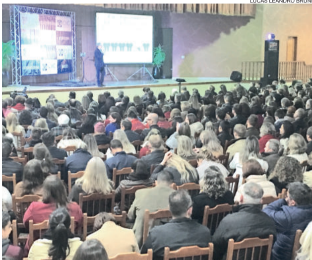
Evento lotou as dependências da Associação da Água na noite de 16 de julho

Para o palestrante, os novos tempos são caracterizados por três fenômenos importantes: primeiro, nunca se