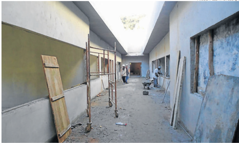
Sede do 3º BRBM está recebendo revestimento nas paredes

A ampliação contempla duas salas de aula, banheiros, cozinha, refeitório, despensa, sala de informática, salão de eventos, redimensionamento da quadra de esportes e um elevador para acessibilidade. Na parte já existente, será desativada a cozinha, onde será feita uma sala para a direção e um