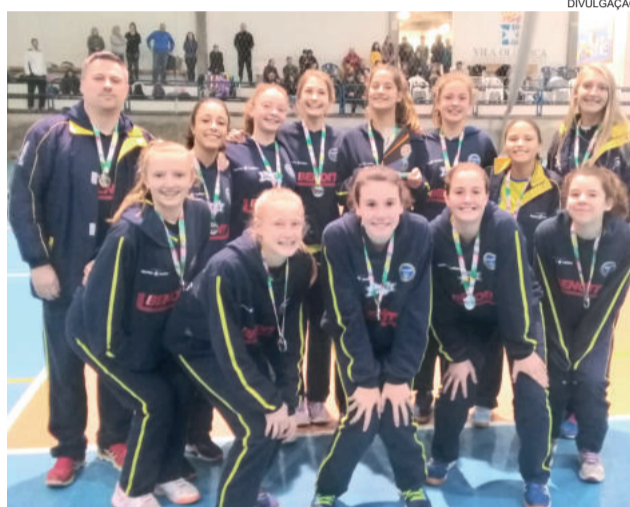
Equipe Mirim da Languiru / CML / Avates ficou vice-campeã

“Conseguimos nos manter no pódio novamente, como ocorreu durante todas as competições do primeiro semestre”, comemorou o técnico. De acordo com ele, agora será retomada a preparação para o Campeonato Estadual, que inicia em agosto.