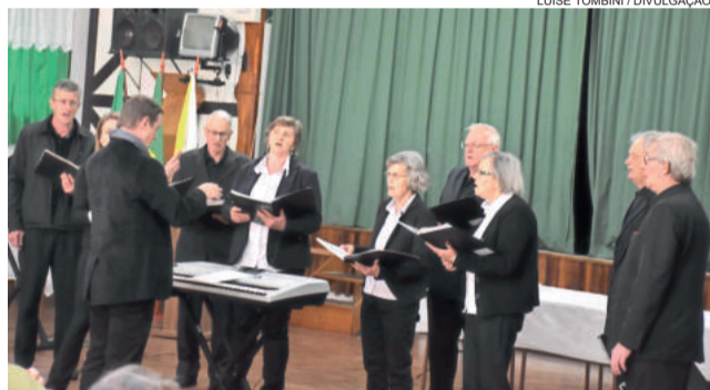
Grupo anfitrião será o Vozes