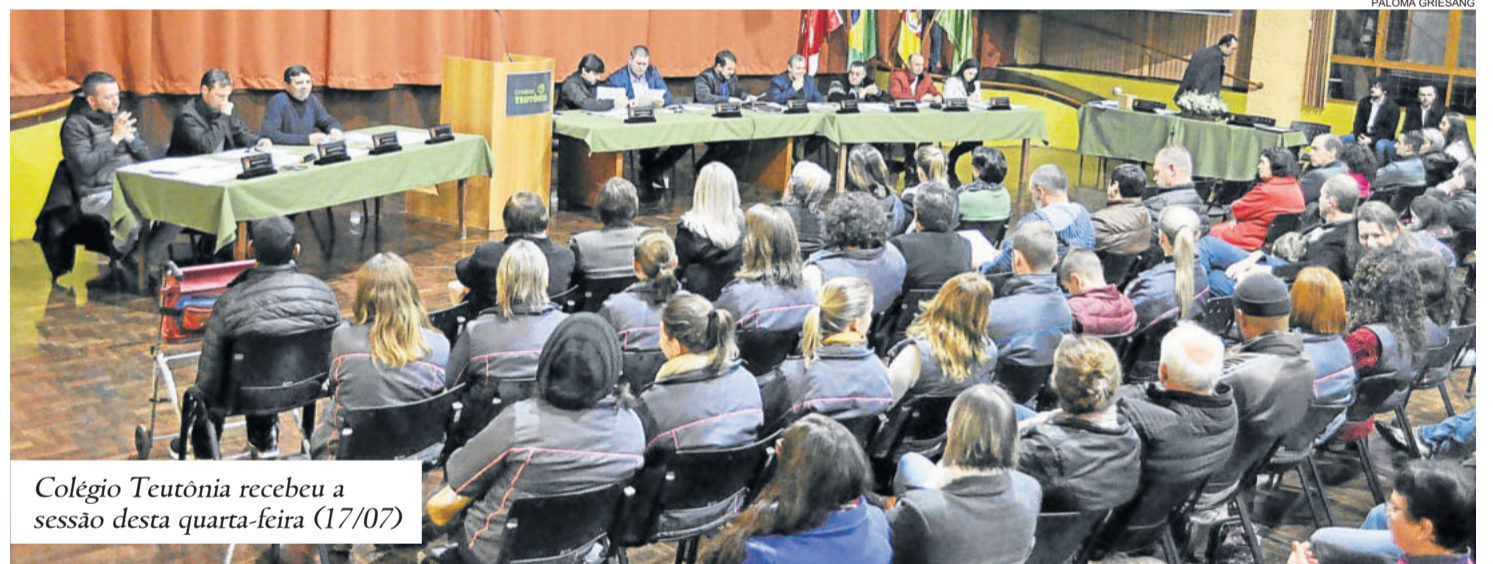
Colégio Teutônia recebeu a sessão desta quarta-feira (17/07)

O diretor avalia que 67 anos ainda é um tempo muito pequeno no que diz respeito a uma instituição. “Eu, certamente, não estarei aqui, mas se o bondoso Deus me permitir olhar lá dos céus, eu gostaria de ver como essa instituição será nos próximos 67 anos”, finaliza.