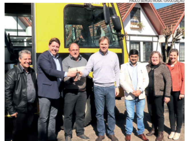
Deputado Lucas Redecker fez a entrega oficial do ônibus à Prefeitura de Teutônia

No ano passado, a Secretaria de Educação também investiu na aquisição de um ônibus escolar através do programa Caminhos da Escola Rural. O veículo é classificado como Ônibus Rural Escolar (ORE) 1, que comporta 29 crianças e é equipado com cadeira elevatória. O investimento total foi de R$ 189.900,00, sendo R$ 155.390,40 de recursos federais e R$ 34.509,60 de contrapartida do Município.