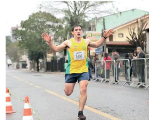
Kommer chega em 2º lugar nos 5Km em Estrela