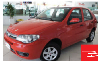
Fiat Palio Economy 1.0 8V Fire Flex 2012

Vermelho, 4 portas, Manual, Gasolina e Álcool, 177.789km