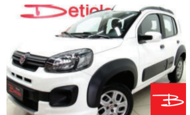
Fiat Uno Way 1.3 Flex 2018 Branco, 4 portas, Manual, Gasolina e Álcool, 89.939km De FIPE R$ 39.173,00 por R$ 35.990,00