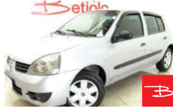
Renault Clio Authentique 1.0 16V 2007

Prata, 4 portas, Manual, Gasolina, 161.876km