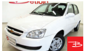
Chevrolet Classic LS 1.0 Mpdf VHC 8V Flexpower 2014

Branco, 4 portas, Manual, Gasolina e Álcool, 129.549km