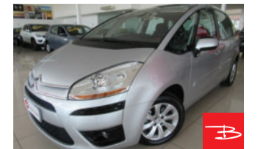
Citroën C4 Picasso GLX 2.0 16V 2009

Prata, 4 portas, Automático, Gasolina, 156.726km