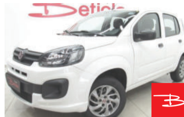
Fiat Uno Drive 1.0 Flex 2018 Branco, 4 portas, Manual, Gasolina e Álcool, 72.274km por R$ 31.900,00