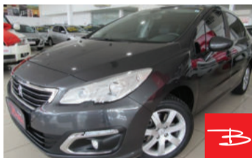
Peugeot 408 BUSINESS THP 1.6 16V Flex 2017 Cinza, 4 portas, Automático, Gasolina e Álcool, 34.901km por R$ 53.900,00