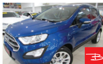
Ford Ecosport Titanium 2.0 16V Flex 2019 Azul, 4 portas, Automático, Gasolina e Álcool, 28.754km por R$ 82.900,00