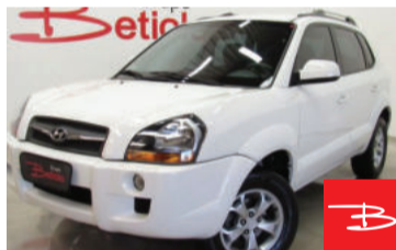
Hyundai Tucson GLS 4x2 2WD 2.0 16V 2017 Branco, 4 portas, Automático, Gasolina e Álcool, 35.317km por R$ 58.900,00