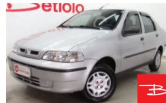
Fiat Siena 1.0 MPI 8V Fire Flex 2007

Prata, 4 portas, Manual, Gasolina e Álcool, 77.385km