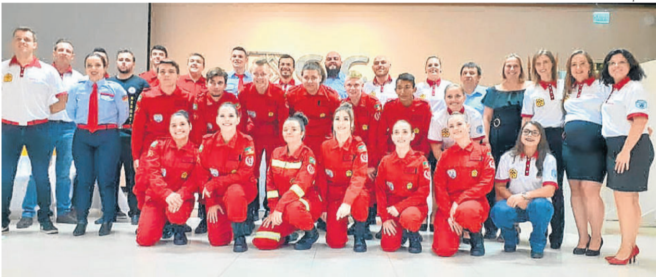
Bombeiros juvenis formandos com a equipe do CBV