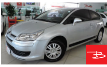
Citroën C4 VTR 2.0i 16V 2007

Prata, 2 portas, Manual, Gasolina, 186.798km