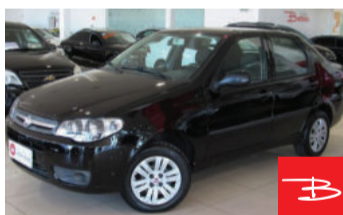
Fiat Siena Fire 1.0 MPI 8V Flex 2012

Preto, 4 portas, Manual, Gasolina e Álcool, 63.984km