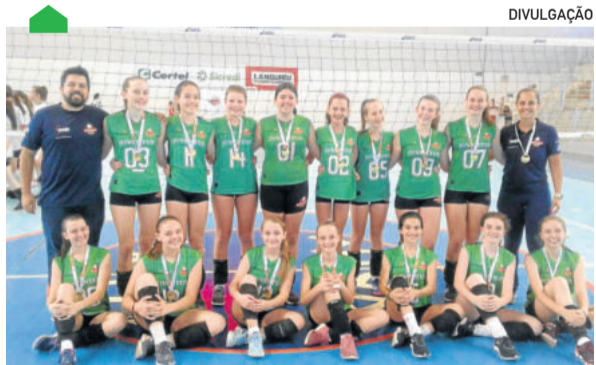
Equipe mirim campeã da Série Prata

O voleibol da Juventus obteve ótimos resultados em 2019, apresentando um crescimento notório em seus desempenhos nos últimos 2 anos, mostrando o investimento que vem sendo feito pelo clube. O ano de 2019 foi encerrado com o primeiro título em nível estadual. A equipe mirim foi campeã da Série Prata do Campeonato Estadual de Vôlei Feminino, competição organizada pela Federação Gaúcha de Voleibol (FGV). A Juventus tem o patrocínio das cooperativas Certel, Languiru e Sicredi.