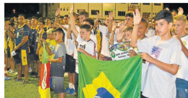
Competidores prestaram o juramento do atleta