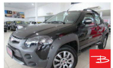
Fiat Strada Adventure Cabine Dupla 1.8 MPI 16V Flex 2015 Preto, 2 portas, Manual, Gasolina e Álcool, 25.865km por R$ 49.900,00