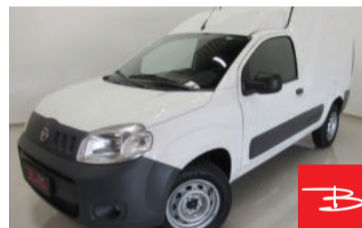
Fiat Fiorino Furgão Hard Working 1.4 EVO 8V Flex 2019 Branco, 2 portas, Manual, Gasolina e Álcool, 16.349km por R$ 62.900,00