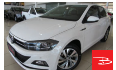
Volkswagen polo Highline 200 1.0 TSI Automática 2018 Branco, 4 portas, Automático, Gasolina e Álcool, 46.613km, Único Dono, Revisões em concessionária, Garantia de fábrica por R$ 67.900,00