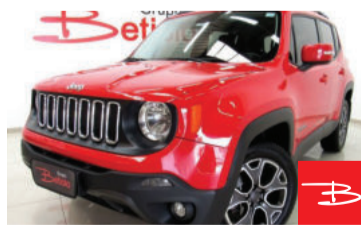
Jeep Renegade Longitude 2.0 Turbo 4x4 2018 Vermelho, 4 portas, Automático, Diesel, 81.404km por R$ 99.900,00