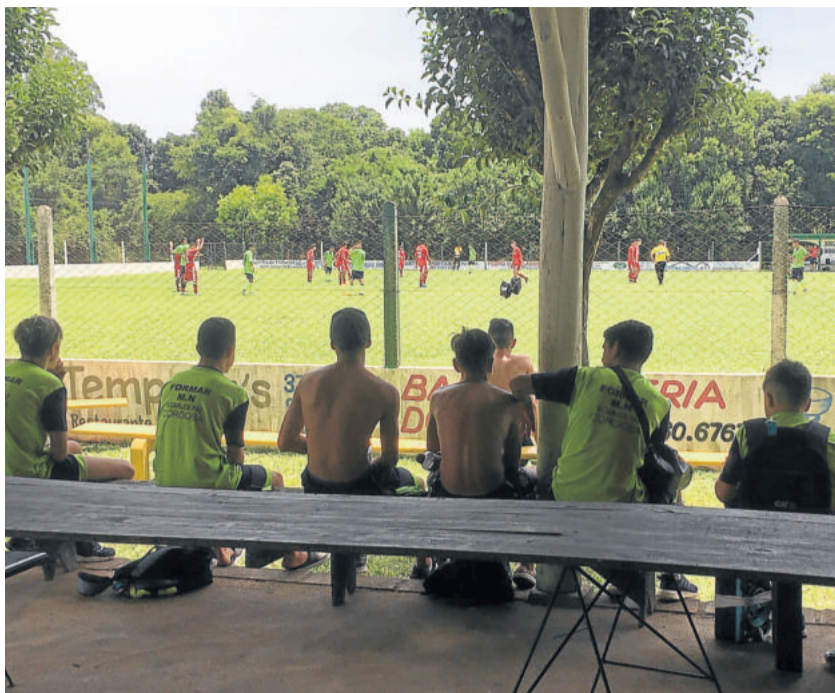
Argentinos de Córdoba acompanham colegas de outras categorias