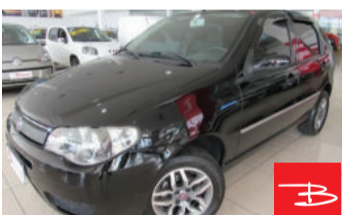
Fiat Palio Celebration 1.0 8V Fire Flex 2010

Preto, 4 portas, Manual, Gasolina e Álcool, 75.446km