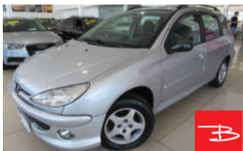
Peugeot 206 SW Moonlight 1.4 8V Flex 2008

Prata, 4 portas, Manual, Gasolina e Álcool, 133.557km