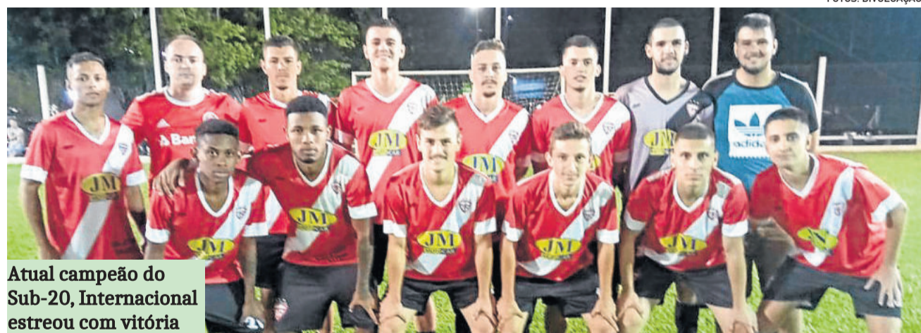
Atual campeão do Sub-20, Internacional estreou com vitória