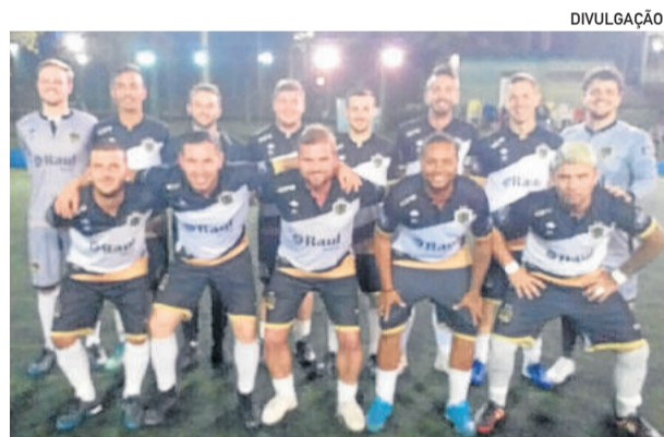
Nárnia volta a campo nesta terça-feira

“SE VOCÊ VIU OUTRAS PESSOAS TAMBÉM PODEM VER