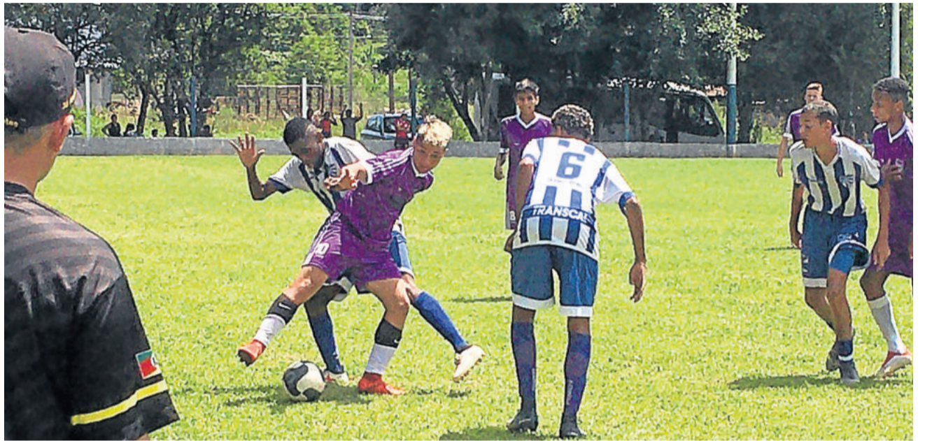
Atletas disputam os jogos com muita vontade, sonhando em se tornarem profissionais