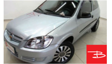
Chevrolet Celta Life 1.0 MPFI VHC 8V Flexpower 2009

Prata, 2 portas, Manual, Gasolina e Álcool, 81.627km