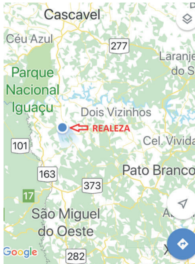
Mapa com localização de Realeza

De Realeza seguimos viagem rumo Francisco Beltrão, Vitorino, São Lourenço do Oeste. Impressionante a visão da fábrica de alimentos da empresa Parati (aquela que faz uns biscoitos gostosos) na chegada a São Lourenço do Oeste. Simplesmente é gigante, parece algo fora do comum, chama a atenção de quem vem chegando na cidade e enxerga aqueles prédios no topo do morro da cidade.