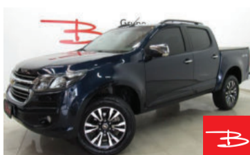
Chevrolet S10 LTZ 4X4 Cabine Dupla 2.5 Ecotec 2017 Azul, 4 portas, Manual, Gasolina e Álcool, 56.462km por R$ 96.900,00