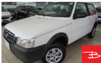
Fiat Uno Mille Way Economy 1.0 MPI 8V Flex 2013

Branco, 2 portas, Manual, Gasolina e Álcool, 159.683km