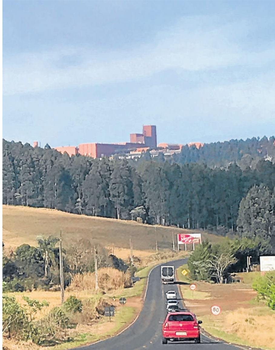
Imponente fábrica de alimentos da empresa Parati

Por volta das 17 horas, o fusca azul havia chegado no mesmo local de onde havia partido 19 dias antes, são e salvo, nenhuma avaria, tudo dentro dos conformes.