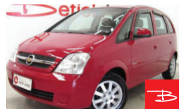
Chevrolet Meriva Maxx 1.8 Mpdf 8V Flexpower 2007

Vermelho, 4 portas, Manual, Gasolina e Álcool, 129.745km