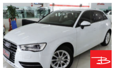
Audi A3 Sportback 1.8 TFSI 16V 2015 Branco, 4 portas, Automático, Gasolina, 43.129km por R$ 86.900,00