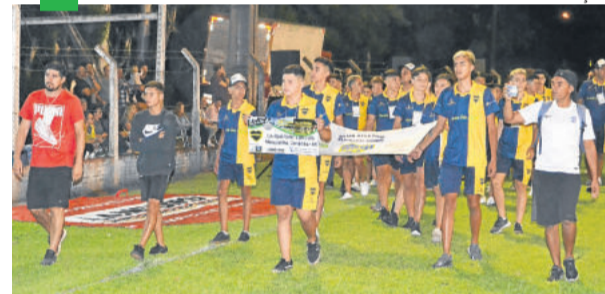
Durante a abertura, ocorreu o tradicional desfile das equipes participantes