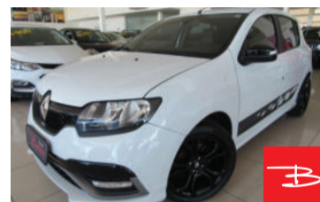
Renault Sandero RS 2.0 16V Flex 2016 Branco, 4 portas, Manual, Gasolina e Álcool, 32.467km por R$ 45.900,00