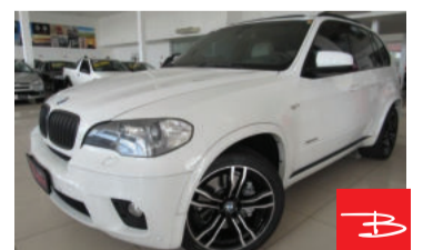
Bmw X5 Sport X Drive 50i 4.4 V8 32V 2012 Branco, 4 portas, Automático, Gasolina, 104.412km por R$ 139.900,00