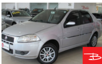
Fiat Siena EL 1.0 Flex 2011

Prata, 4 portas, Manual, Gasolina e Álcool, 214.053km