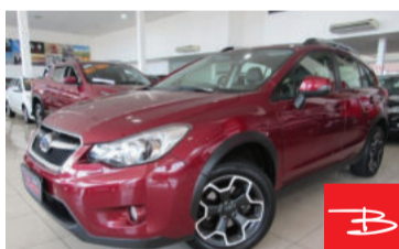
Subaru Impreza 4X4 2.0 16V 2016 Vermelho, 4 portas, Automático, Gasolina, 45.819km De FIPE R$ 75.936,00 por R$ 73.990,00