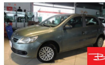
Volkswagen Gol 1.0 Mi 16V 2011

Cinza, 4 portas, Manual, Gasolina, 124.174km