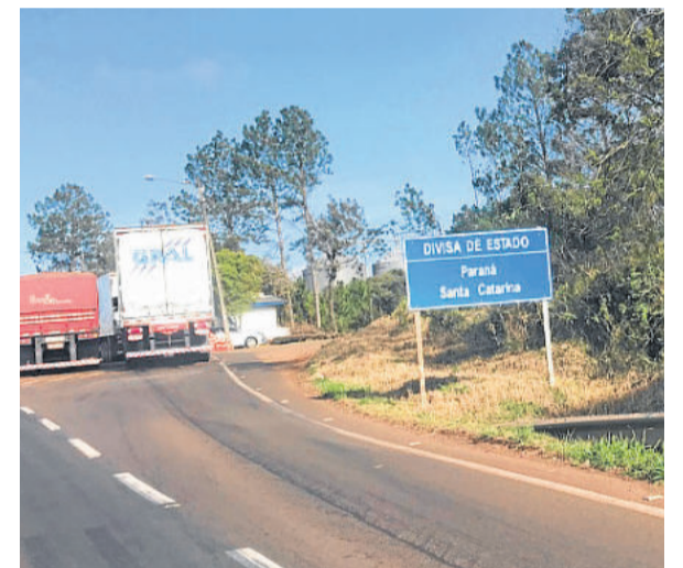
Divisa entre o Paraná e Santa Catarina

Contabilizamos uns 9600 km rodados nesses 19 dias. O fusca azul chegou em casa igual, só um pouco mais empoeirado e mais famoso. O que não voltou igual fomos nós. Não tem como voltar igual, são tantos os aprendizados de uma viagem como essa que ninguém volta igual. Aprendemos muito, rimos muito, vimos muitas coisas diferentes, conhecemos muitas pessoas e costumes diferentes, ninguém volta igual com tudo isso na bagagem.