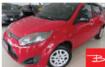
Ford Fiesta 1.0 8V Flex 2012 Vermelho, 4 portas, Manual, Gasolina e Álcool, 76.639km por R$ 23.900,00