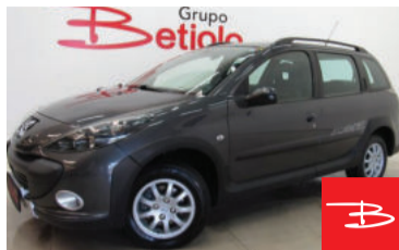
Peugeot 207 Escapade 1.6 16V Flex 2010 Cinza, 4 portas, Manual, Gasolina e Álcool, 88.811km por R$ 18.900,00