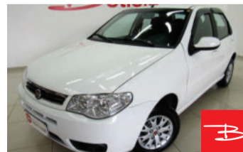
Fiat Palio Fire 1.0 2015

Branco, 4 portas, Manual, Gasolina e Álcool, 133.198km