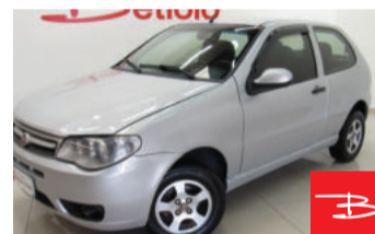
Fiat Palio Fire 1.0 2013

Cinza, 2 portas, Manual, Gasolina e Álcool, 158.804km