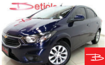
Chevrolet Prisma LT 1.4 MPFI 8V Flex 2018 Azul, 4 portas, Automático, Gasolina e Álcool, 46.550km por R$ 51.900,00