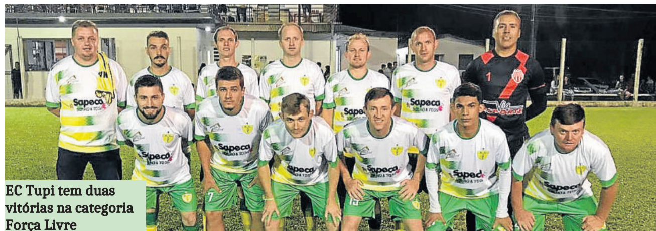
EC Tupi tem duas vitórias na categoria Força Livre