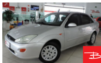
Ford Focus Sedan 2.0 16V 2003

Prata, 4 portas, Automático, Gasolina e Álcool, 114.861km