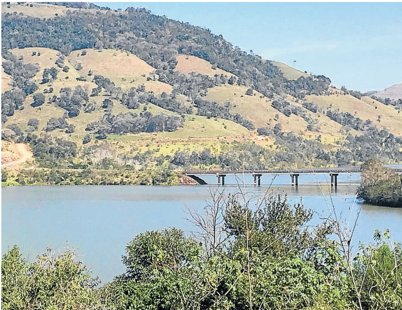
Ponte sobre o Rio Uruguai