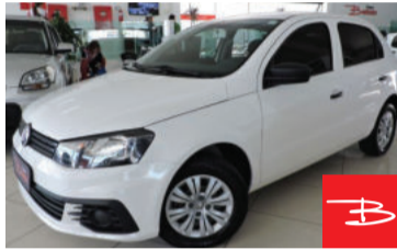
Volkswagen Gol Trendline 1.6 Total Flex 2018 Branco, 4 portas, Manual, Gasolina e Álcool, 46.868km De FIPE R$ 37.900,00 por R$ 36.900,00