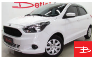
Ford KA SE 1.0 2017 Branco, 4 portas, Manual, Gasolina e Álcool, 26.584km por R$ 36.900,00