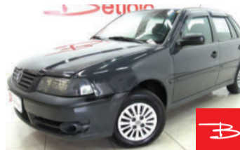
Volkswagen Gol G4 Power 1.6 Mi 8V Total Flex 2003

Cinza, 4 portas, Manual, Gasolina e Álcool, 123.268km