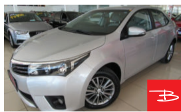
Toyota Corolla XEI 2.0 16V Flex 2017 Prata, 4 portas, Automático, Gasolina e Álcool, 98.798km De FIPE R$ 76.839,00 por R$ 71.990,00