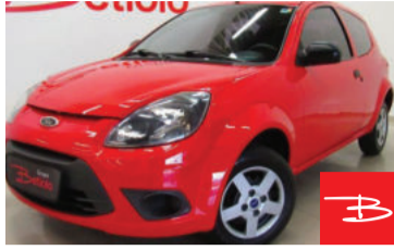
Ford KA Fly 1.0 MPI 8V Flex 2013 Vermelho, 2 portas, Manual, Gasolina e Álcool, 75.225km por R$ 21.900,00