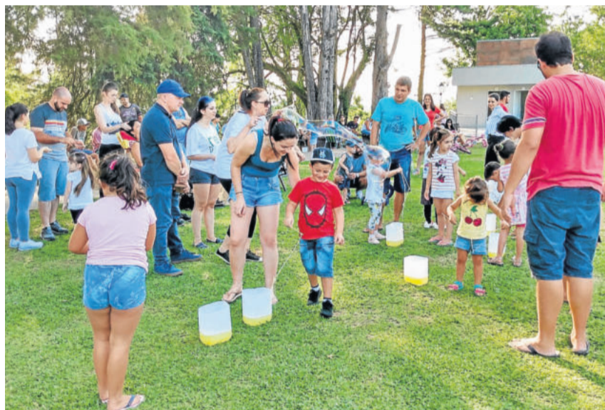
Para as crianças, brincadeiras