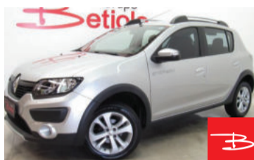
Renault Sandero Stepway 1.6 8V Hi-Flex 2016 Prata, 4 portas, Manual, Gasolina e Álcool, 64.340km por R$ 43.900,00