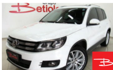
Volkswagen Tiguan TSI Tip-tronic 2.0 16V Turbo 2015 Branco, 4 portas, Automático / Sequencial, Gasolina, 103.028km De FIPE R$ 81.344,00 por R$ 73.990,00