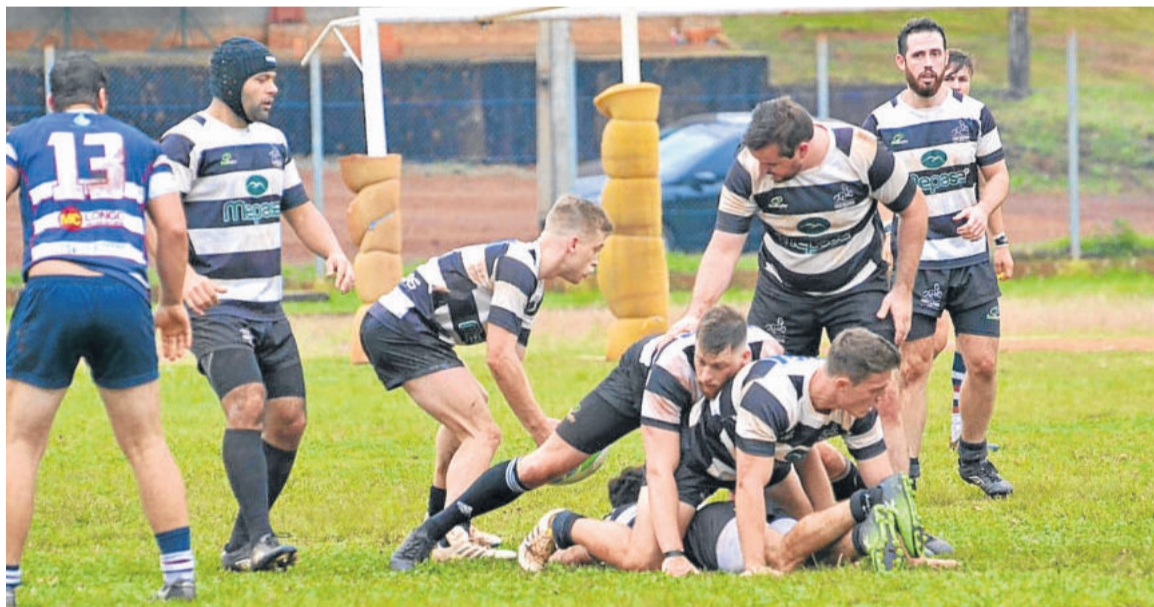
Clube precisa de mais atletas para compor plantel para as competições