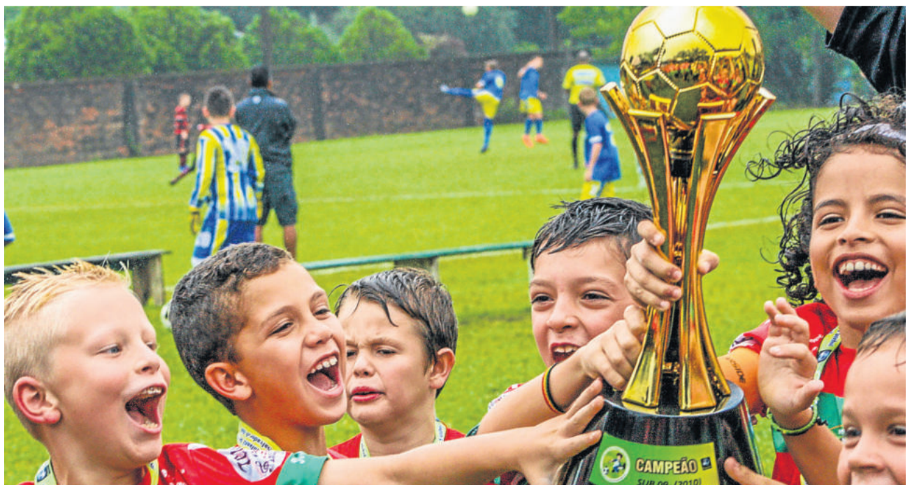
Categoria 2011 faturou o título com vitórias em todos os jogos