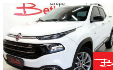
Fiat Toro Volcano 2.0 16v AT9 Diesel 2019 Branco, 4 portas, Automático, Diesel, 36.531km por R$ 115.900,00