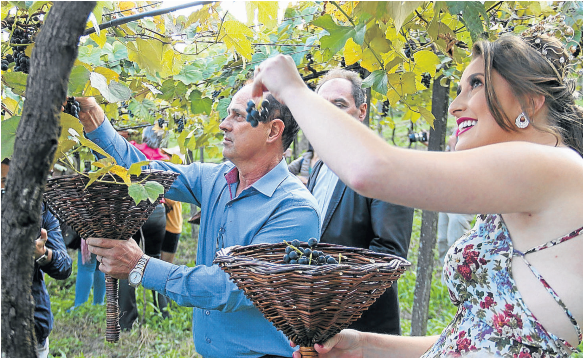
Autoridades e convidados fizeram a colheita da uva