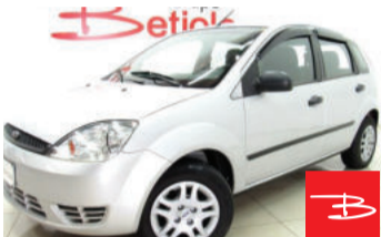
Ford Fiesta Personalité 1.0 8V 2004

Prata, 4 portas, Manual, Gasolina, 115.807km