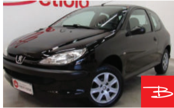
Peugeot 206 Sensation 1.4 8V Flex 2008

Preto, 2 portas, Manual, Gasolina e Álcool, 117.930km