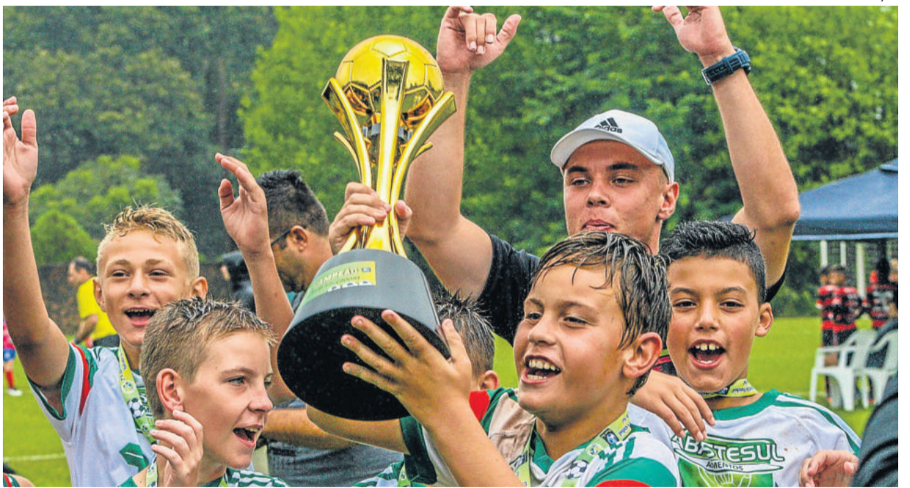
Categoria 2008 da Juventus levou o bicampeonato invicto