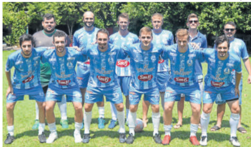
Aprovados fez a melhor campanha na categoria Municipal