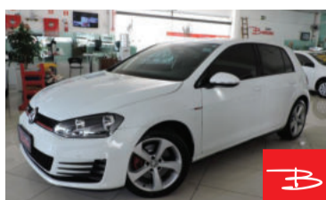
Volkswagen Golf GTI 2.0 Mi 8V 2015 Branco, 4 portas, Automático, Gasolina, 45.214km por R$ 89.900,00