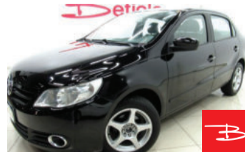
Volkswagen Voyage 1.0 Mi 8V Total Flex 2013

Preto, 4 portas, Manual, Gasolina e Álcool, 142.976km