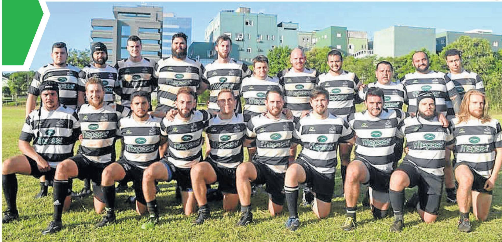
Equipe masculina volta à elite do rugby gaúcho em 2020