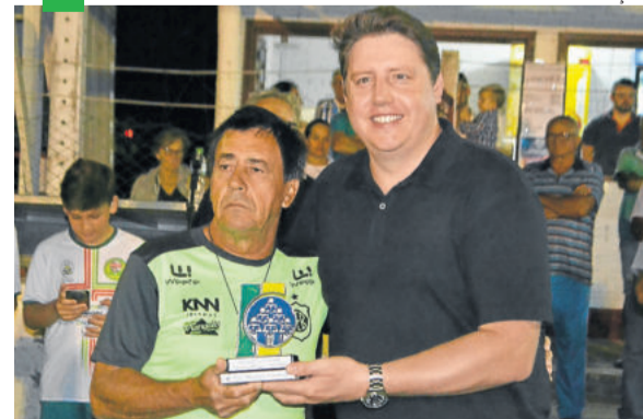
Grêmio Esportivo Bagé recebeu homenagem pelos 100 anos do clube