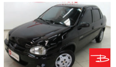
Chevrolet Classic Spirit 1.0 Mpdf VHC 8V 2006

Preto, 4 portas, Manual, Gasolina, 185.740km