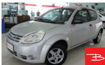
Ford KA 1.0 MPI 8V Flex 2009

Prata, 2 portas, Manual, Gasolina e Álcool, 109.353km