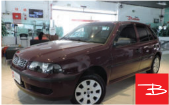
Volkswagen Gol 1.0 Mi 16V 2000

Vermelho, 4 portas, Manual, Gasolina, 180.723km