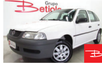
Volkswagen Gol Plus 1.0 Mi 16V 2004

Branco, 4 portas, Manual, Gasolina, 114.429km