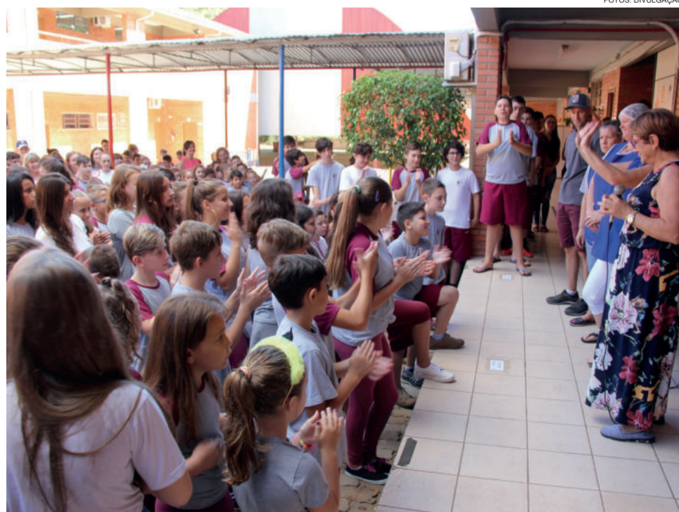
Na EMEF Porto Novo, os alunos conheceram os professores e toda equipe