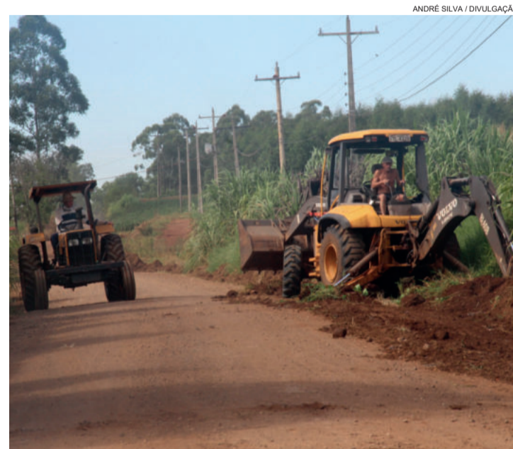
Mais de 15 máquinas estão envolvidas na operação

Os trabalhos irão sempre se concentrar em apenas uma das comunidades do cronograma. Seguindo o roteiro, o mutirão chega à Linha Geraldo e depois prosseguirá por Costão, São José, Lenz, Winck, Novo Paraíso, São Jacó, Porongos, Glória, Santa Rita, Delfina/São Luiz e Arroio do Ouro e vias paralelas.