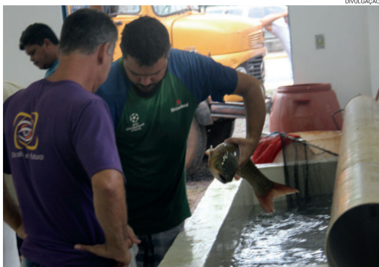
Produção local permitirá a realização de três feiras em menos de 30 dias

Segunda edição de fevereiro ocorre neste sábado (23). Outra antecederá o carnaval, dia 02 de março