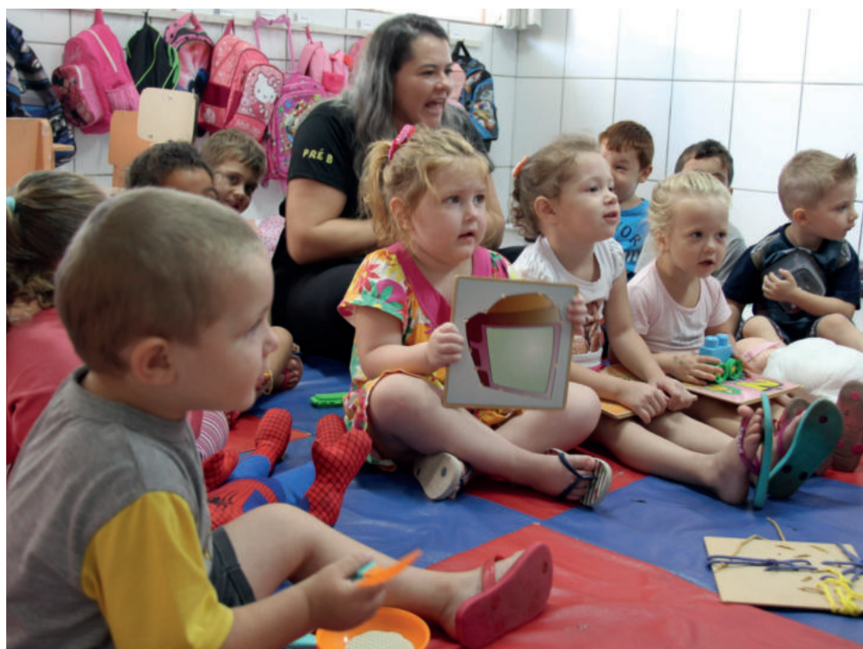
Crianças na EMEI Criança Alegre