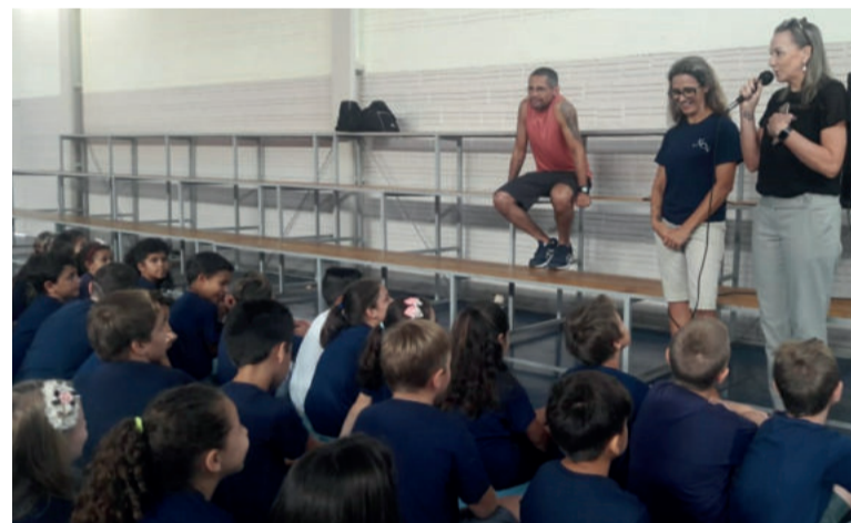
Titular da Sed visitou a EMEF Nova Viena