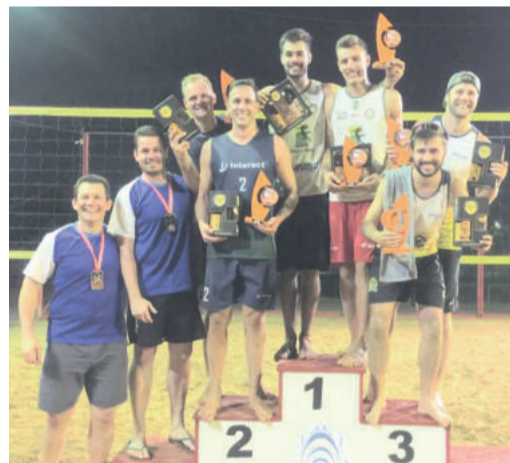
Os melhores do vôlei masculino