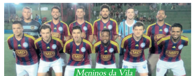
Meninos da Vila