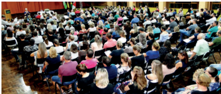
Auditério Central do Colégio Teutônia lotado para Aula Inaugural