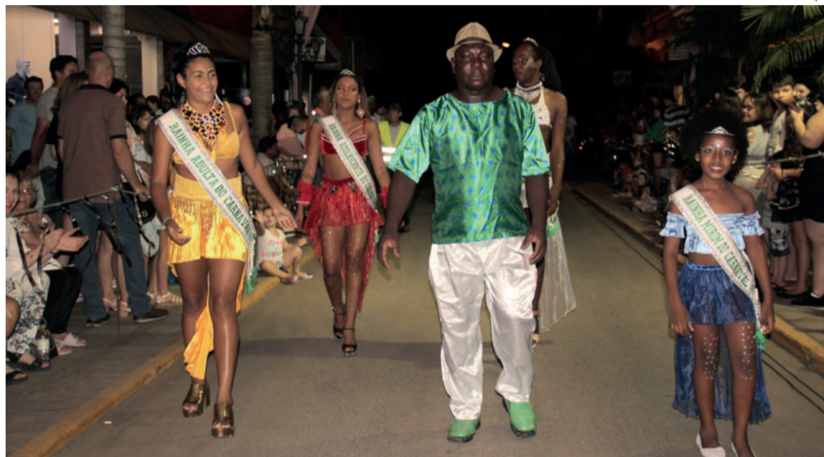
Corte do Carnaval e presidente da Renascer do Samba abrem o desfile