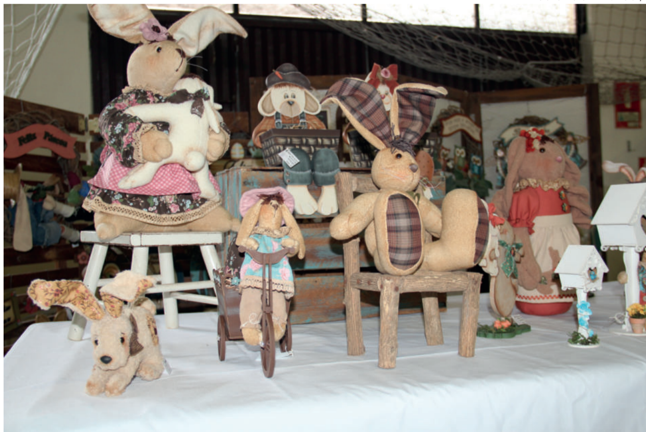
Feira se destaca pela qualidade dos produtos oferecidos