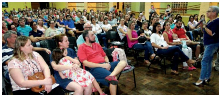
Famílias atentas a palestra