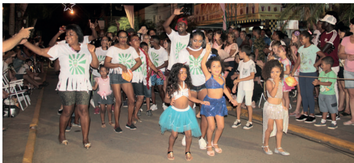
Animação marcou o desfile da Renascer do Samba