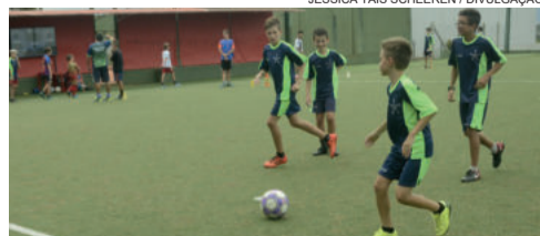
Equipe estrelense se prepara para disputar e receber os times da Copa Estrelas do Futuro