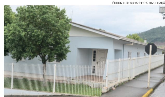
Prédio na Vila Popular receberá, em breve, a Casa-Abrigo de Menores

Os recursos destinados ao FMDCA serão empregados em projetos sociais através de entidades inscritas e devidamente regulares perante o Comdica, sendo beneficiadas crianças e adolescentes em situação de vulnerabilidade social do município. “Só