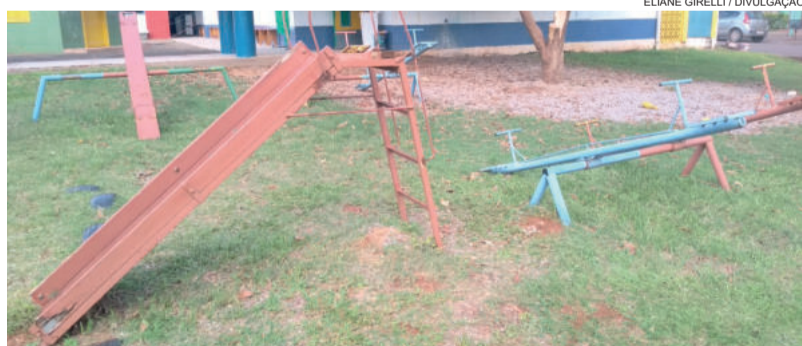
Objetivo da ação é restaurar o parquinho e aproximar família e escola

Atividade também tem o objetivo de aproximar família e escola