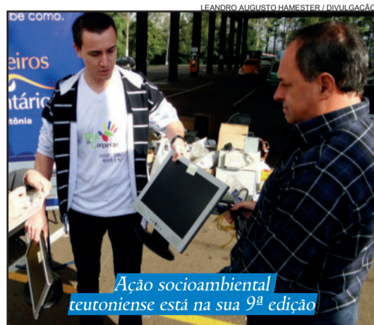
Ação socioambiental teutoniense está na sua 9ª edição

Objetivando a preservação do Meio Ambiente e a conscientização da população para cuidados com a natureza e a correta destinação do lixo, no próximo sábado, dia 23 de junho, das 8h30min às 11h30min, ocorre ação de descarte consciente de lixo eletrônico e medicamentos vencidos, com posto de coleta instalado junto ao Pavilhão Multiuso, na Prefeitura de Teutônia. A atividade integra a ação socioambiental teutoniense Revive Boa Vista, em sua 9ª edição, realização da Unidade Parceiros Voluntários de Teutônia,