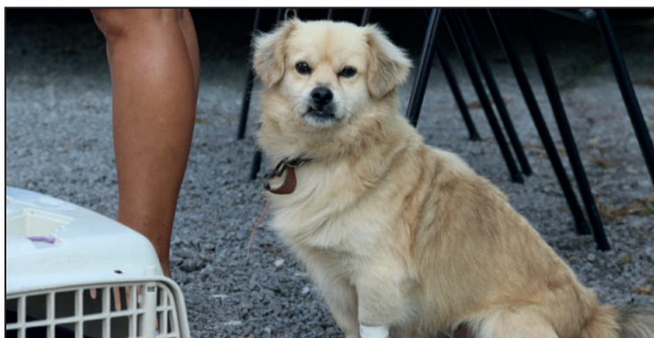
Um dos objetivos da ação é controlar a população de animais

O objetivo da ação é controlar a população de animais e incentivar a posse responsável, prevenindo a disseminação de doenças, especialmente nas comunidades de maior vulnerabilidade social.