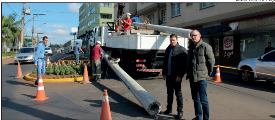
Postes começaram a ser instalados na tarde desta segunda-feira. Operação deve estar concluída até dia 29

O Governo de Estrela vai investir em torno de R$ 300 mil anuais no sistema, compreendendo todos os equipamentos, instalação e assistência técnica 24 horas, além da garantia. O contrato com a empresa