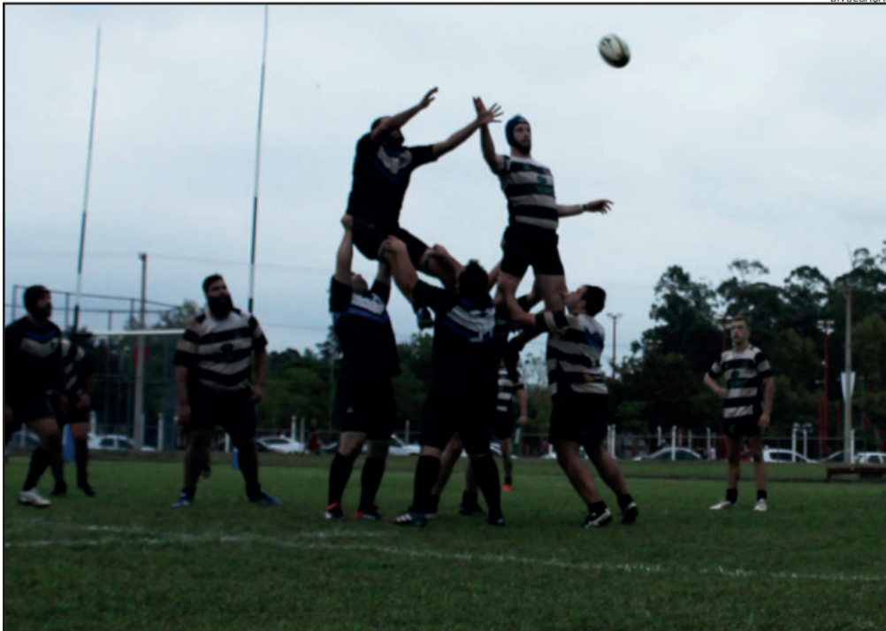
Equipe estrelense enfrenta o URTC no Parcão

A exemplo do jogo da semifinal, haverá comercialização de chopp da Prost Bier no valor de R$ 5 o copo de 500ml, além de água e refrigerante.