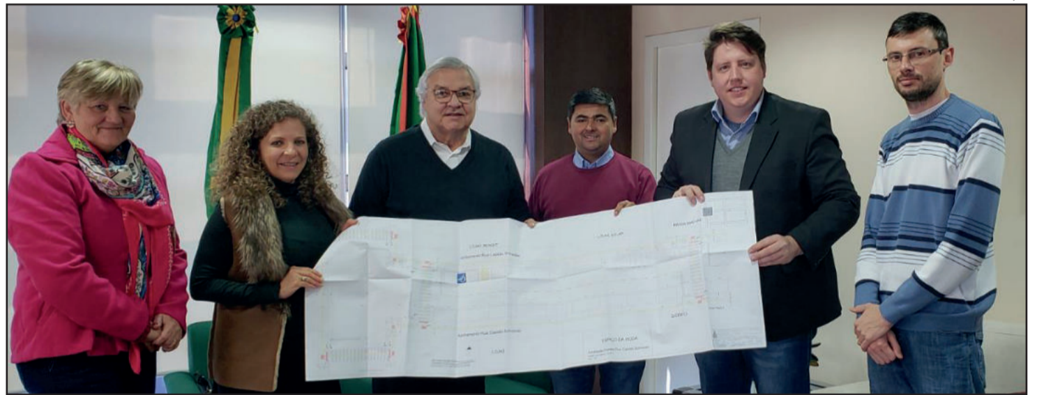
Projetos foram entregues oficialmente ao Badesul no início da semana

Dentre as propostas encaminhadas estão pavimentações de ruas, bem como o projeto de revitalização da Rua Capitão Schneider. “São obras de extrema importância para Teutônia. Vamos possibilitar investimentos que contribuem na melhoria