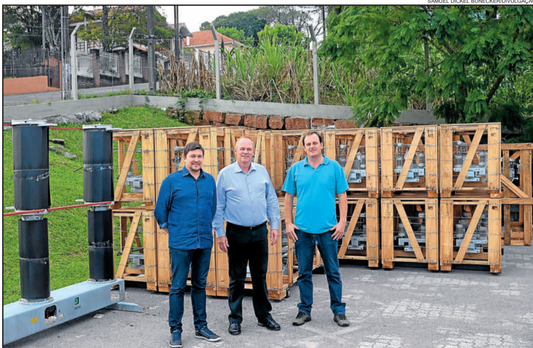
Novos equipamentos foram adquiridos em maio

A Certel Energia investirá R$ 1 milhão, principalmente em ampliações e melhorias relacionadas às subestações rebaixadoras de 69 mil volts para 13,8 mil volts, situadas em Teutônia, São Pedro da Serra, Lajeado e Canudos do Vale.