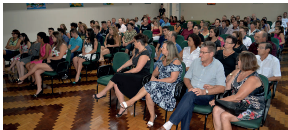
Familiares, em grande número, prestigiaram solenidade de formatura