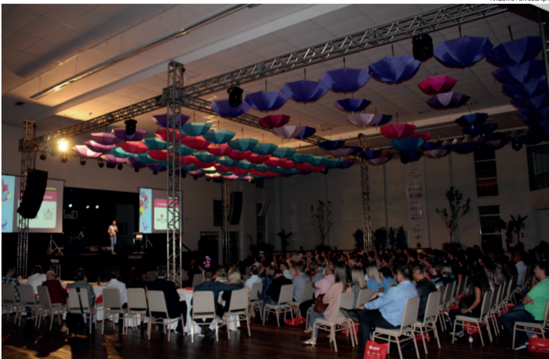
Reload Sindilojas é um evento anual e que atrai grande público

O público regional já pode garantir sua participação no Reload Sindilojas 2018. O evento de capacitação voltado para empresários, gestores e colaboradores que ocorre no dia 11 de abril, no Weiland Hotel em Lajeado, está com inscrições abertas no site www.reload-sindilojas.com.br . Os preços para as atividades variam entre R$ 49,00 e R$ 68,00 para associados Sindilojas VT e entre R$ 59,00 e R$ 78,00 para demais interessados.