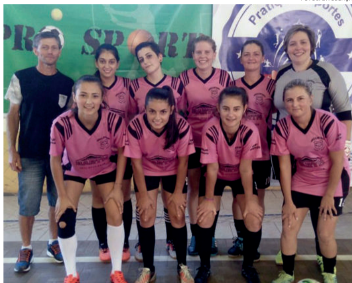
Elenco de Arroio do Ouro na disputa do futsal feminino