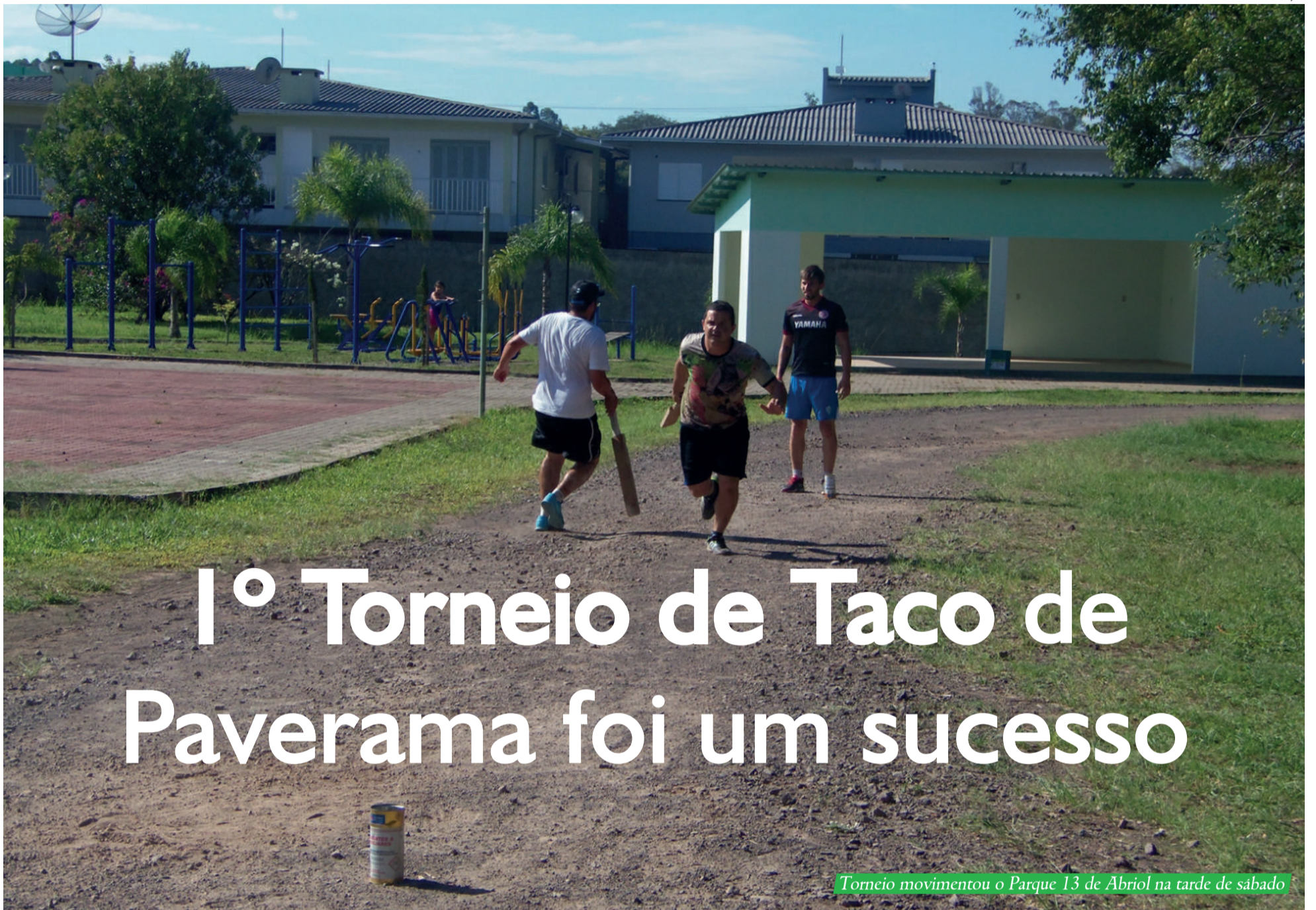
Torneio movimentou o Parque 13 de Abriol na tarde de sábado

Cerca de 200 pessoas estiveram prestigiando o 1º Torneio de Taco de Paverama - Taça Lojas Quero - Quero. Um total de 24 duplas, dos municípios de Paverama, Teutônia e Estrela, fechando 48 jogadores, foram distribuídos em 8 grupos de 3, onde 2 de cada grupo se classificavam. Após passou para as fases de oitavas, quartas e semifinal.