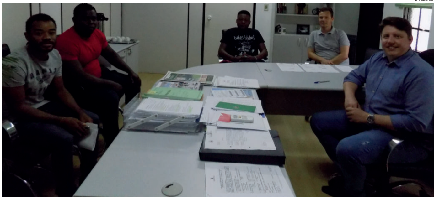
Prefeito e secretário recebem visita de haitianos que buscam apoio para se comunicar com a comunidade

Prefeito e secretário de Educação receberam visita de haitianos