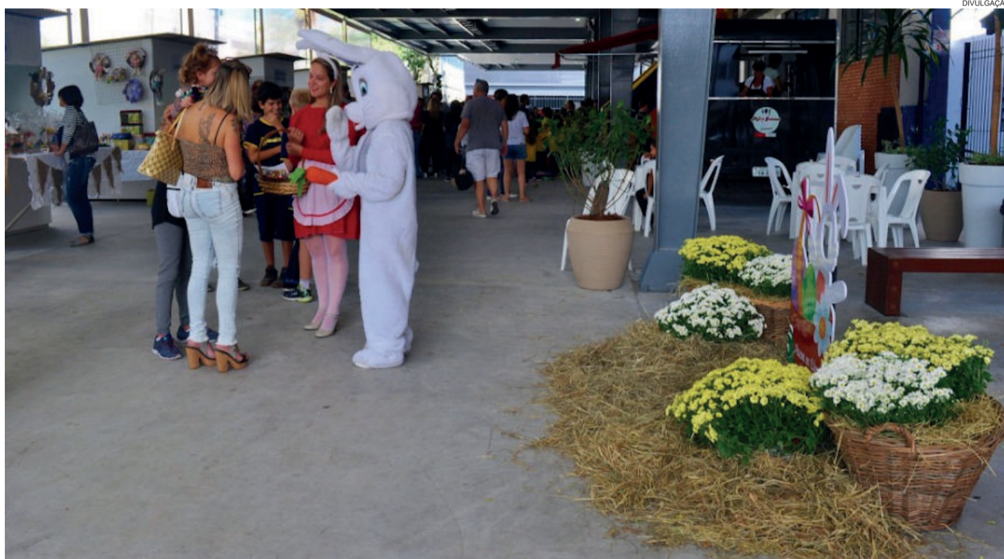
Feira de Artesanato será na Rua Coberta