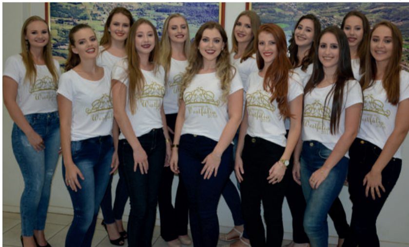
Neste ano, 12 candidatas disputam o título