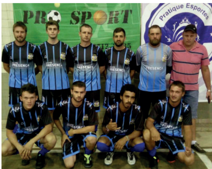
Equipe da São José na força livre do futsal

As dez comunidades participantes dos Jogos Intercomunitários são: São Luiz, São José, São Jacó, Lenz, Arroio do Ouro, Glória, Delfina, Costão, Geraldo Alta e Novo Paraíso Baixo. Cada modalidade tem um dia específico da semana para sua realização: canastra (segundas-feiras, a partir das 20h), futsal adulto masculino (sextas-feiras); vôlei misto e futsal feminino (sábados). Cerca de 500 atletas devem estar envolvidos com os jogos até junho. A entrega da premiação ocorrerá na Festa dos Campeões, na Linha São José, em outubro. Mais informações pelo telefone 3981-1045 e e-mail smel.esporte@estrela.rs.gov.br