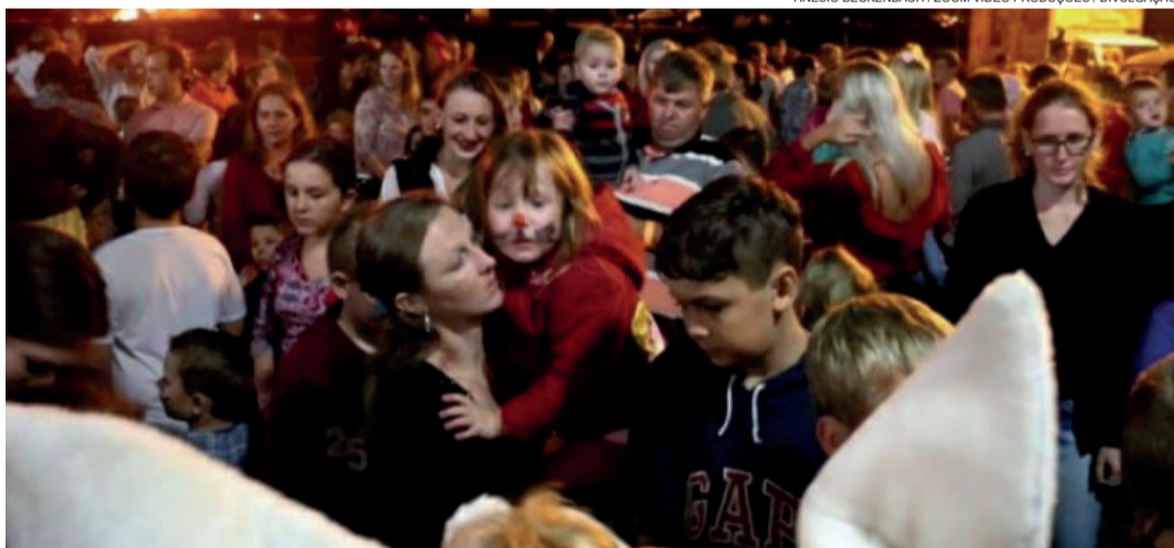
Em 2016, Osterfest reuniu cerca de 1.500 pessoas