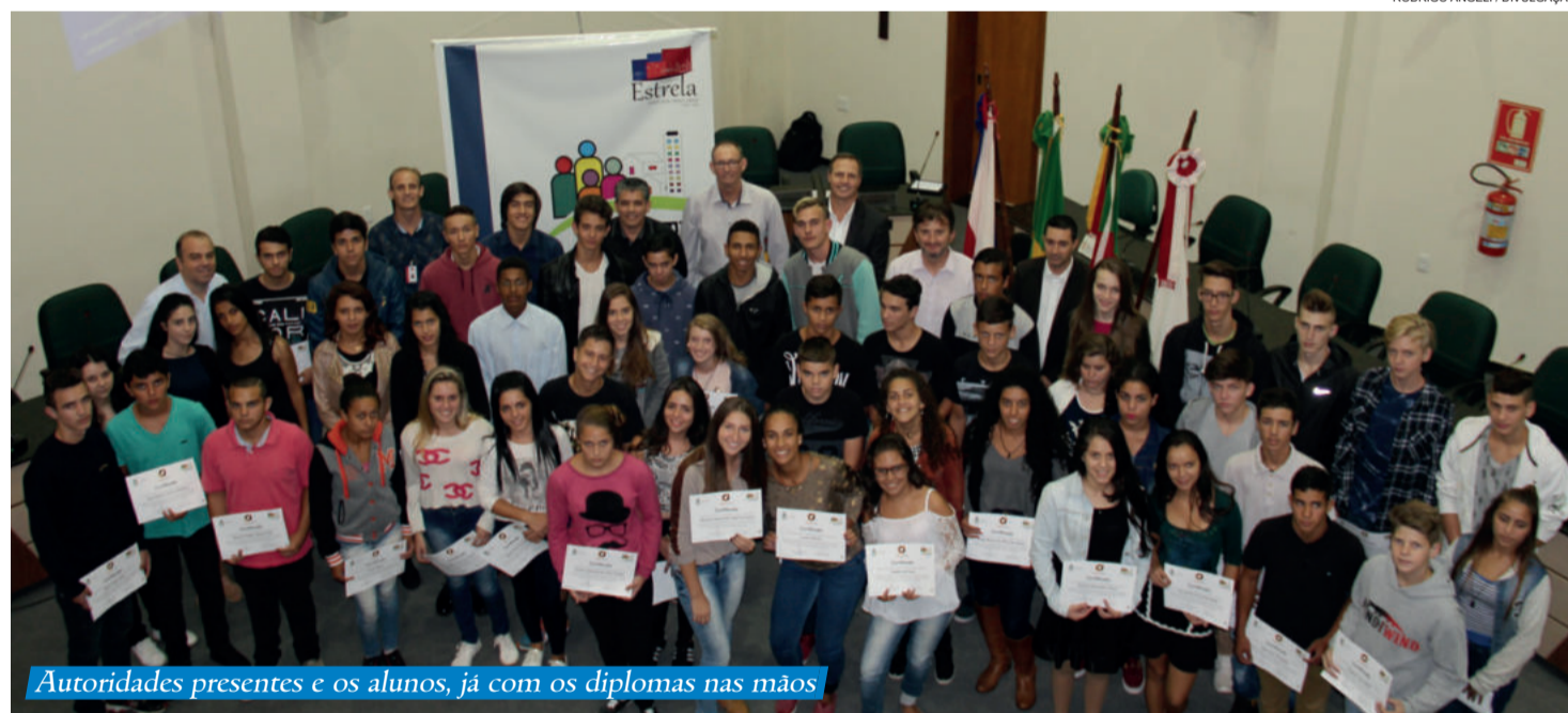
Autoridades presentes e os alunos, já com os diplomas nas mãos