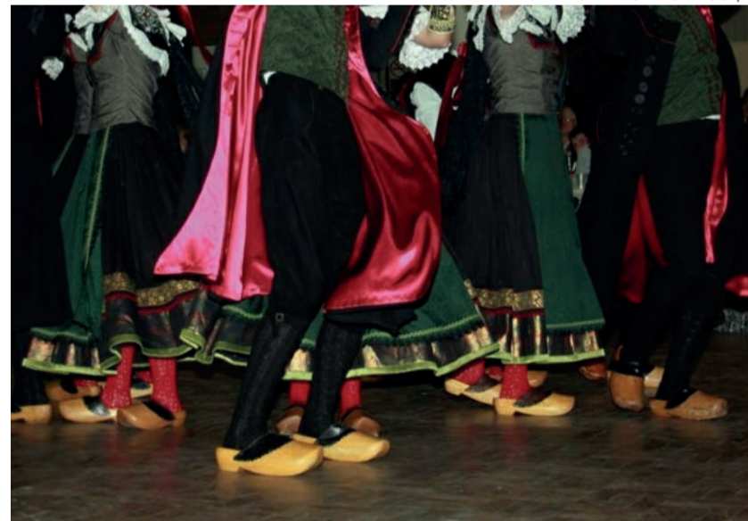
XII Westfälischer Tanzabend celebrará a cultura alemã dia 24 de março

Seu anúncio está próximo de notícias falsas da internet?