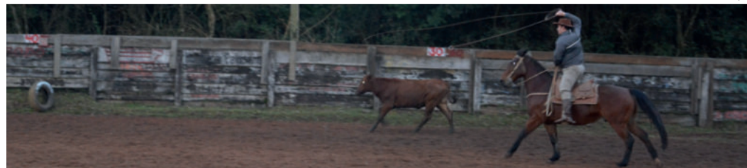
No ano passado, CTG Querência Westfaliana promoveu a primeira edição do rodeio