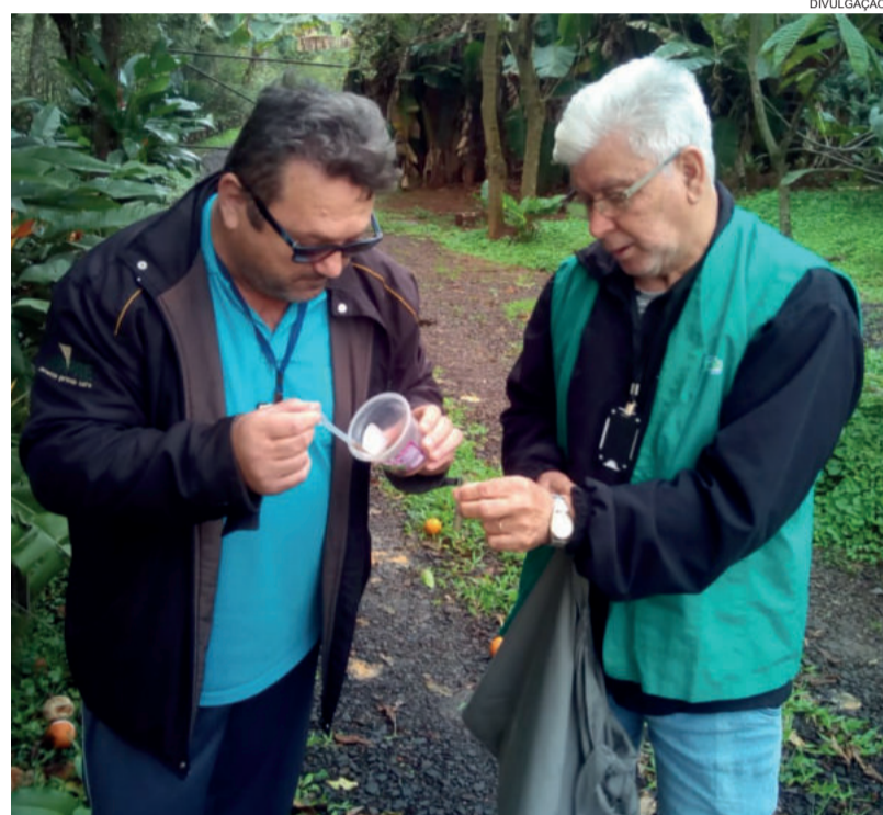
Trabalho de identificação de possíveis locais com larvas do mosquito foi realizado em todos os bairros da cidade

Nos dois primeiros Liras do ano, situações distintas foram encontradas. Em fevereiro, das amostras coletadas, 68 foram encaminhadas ao laboratório da 16ª CRS. Destas, seis deram resultado positivo ao Aedes aegypti . Em maio, das amostras encaminhadas, seis foram identificadas, mas apenas para o mosquito Aedes albopictus , espécie parecida a do Aedes , não transmissora da dengue mas de outras doenças. Entretanto que se cria em condições e ambientes muito parecidos ao do aegypti . Em Estrela houve registro no ano de apenas um caso da Dengue, mas considerada “importada”, ou seja, não contraída no município. Tratou-se de um morador que visitou a Paraíba em período de férias, onde começou a ter os sintomas.