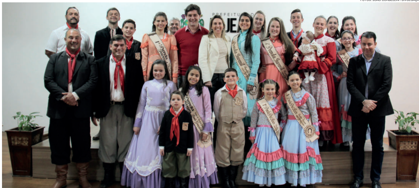
Autoridades municipais com as crianças e jovens que ajudam manter as tradições gaúchas em Lajeado