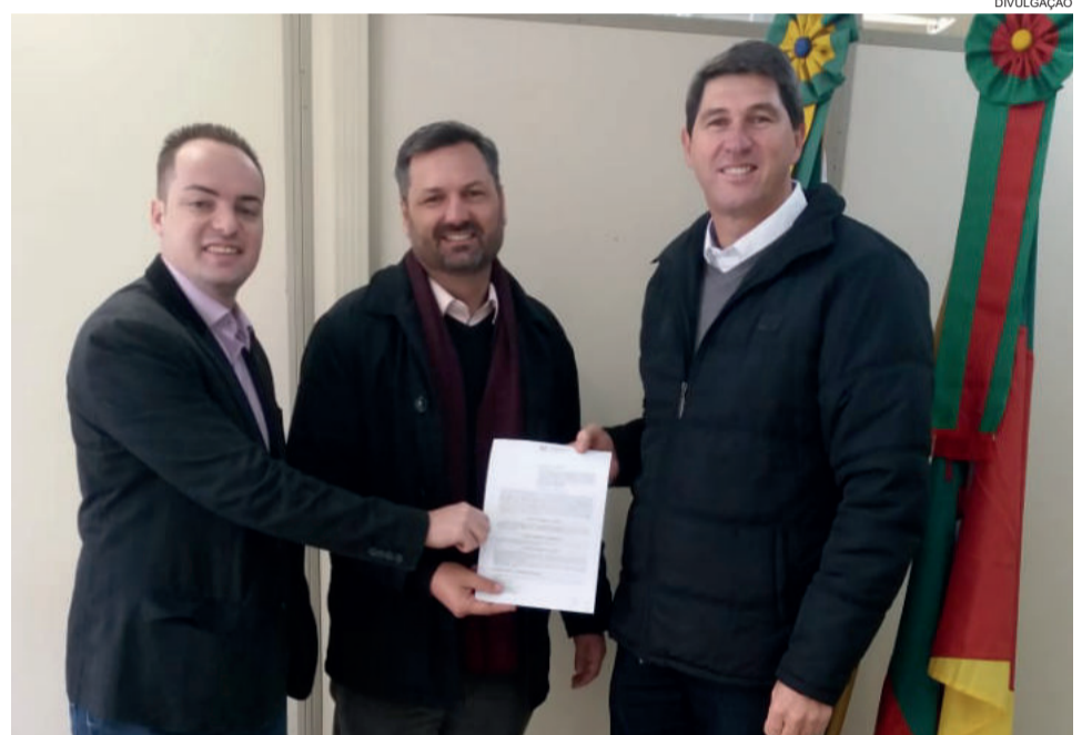
Convênio foi assinado no dia 13

O atraso na assinatura do convênio ocorreu em virtude da troca de gestão no Governo do Estado. O edital foi lançado pela Secretaria de Estado da Cultura, Turismo, Esporte e Lazer do Rio Grande do Sul. Porém, com a troca de governo, a Secretaria de Cultura se desmembrou da Secretaria do Esporte e Lazer. Isso ocasionou os atrasos na assinatura do convênio. Além disso, também auxiliou nesse atraso o fato de alguns municípios, que não foram contemplados no edital, terem entrado com recurso contra o Estado.