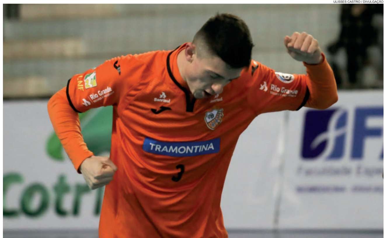
O jogo melhorou no segundo tempo

Com a vitória, a ACBF pulou para a terceira colocação com 14 pontos em nove jogos. O foco agora passa a ser a LNF. Nesta quinta-feira (22/08), a equipe enfrenta a Copagril, em Carlos Barbosa.