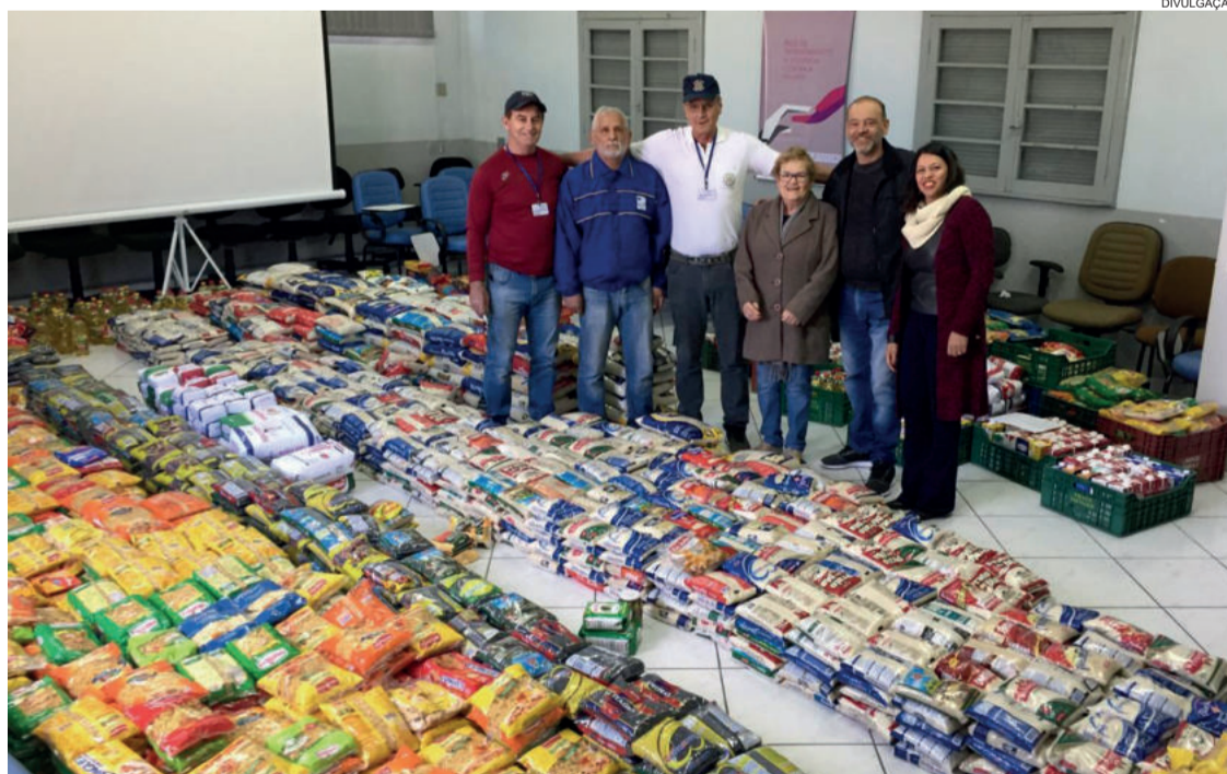
Secretaria recebeu mais de 2,4 mil quilos de alimento

Em Lajeado, a campanha aconteceu no sábado (17/08), quando os acadêmicos do curso de medicina da Univates arrecadaram cerca de 3.650 quilos de alimentos em diversos pontos da cidade. A ação ocorreu nos supermercados Imec do Centro, Florestal, Montanha e São Cristóvão, no estabelecimento da Rede Super BR-386 e também no STR do Centro. O Rotary Club de Lajeado - Engenho auxiliou na campanha, assim como os servidores da Sthas, realizando a abordagem, esclarecendo à comunidade o destino dos mantimentos e apoiando na logística.