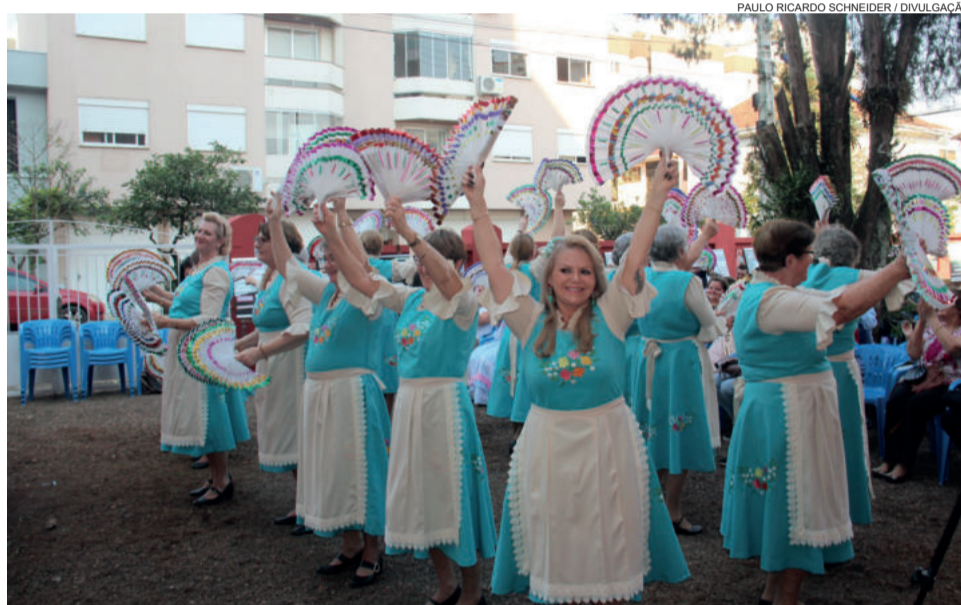
Grupo de Senhoras apresentou danças alemãs

No palco, apresentações artísticas mostraram ao público a diversidade das várias etnias que ao longo dos anos construíram a identidade do município. Teve início com o Grupo de Escaletas do Núcleo de Cultura e em seguida a Escola Renascer do Samba trouxe o samba; a Invernada Mirim do CTG Raça Gaudéria apresentou danças típicas da cultura gaúcha; o Grupo de Senhoras Caminhando Juntas destacou a tradição alemã,