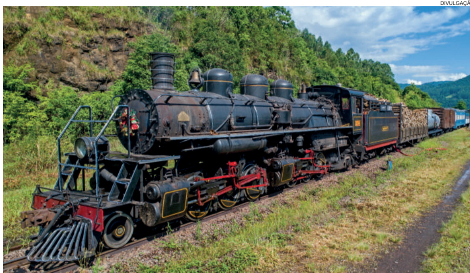
Trajeto será entre Guaporé e Muçum, Vespasiano Corrêa e Dois Lajeados

Já para a Associação dos Municípios de Turismo da Região dos Vales (Amturvaes), idealizadora do projeto, os primeiros pas-