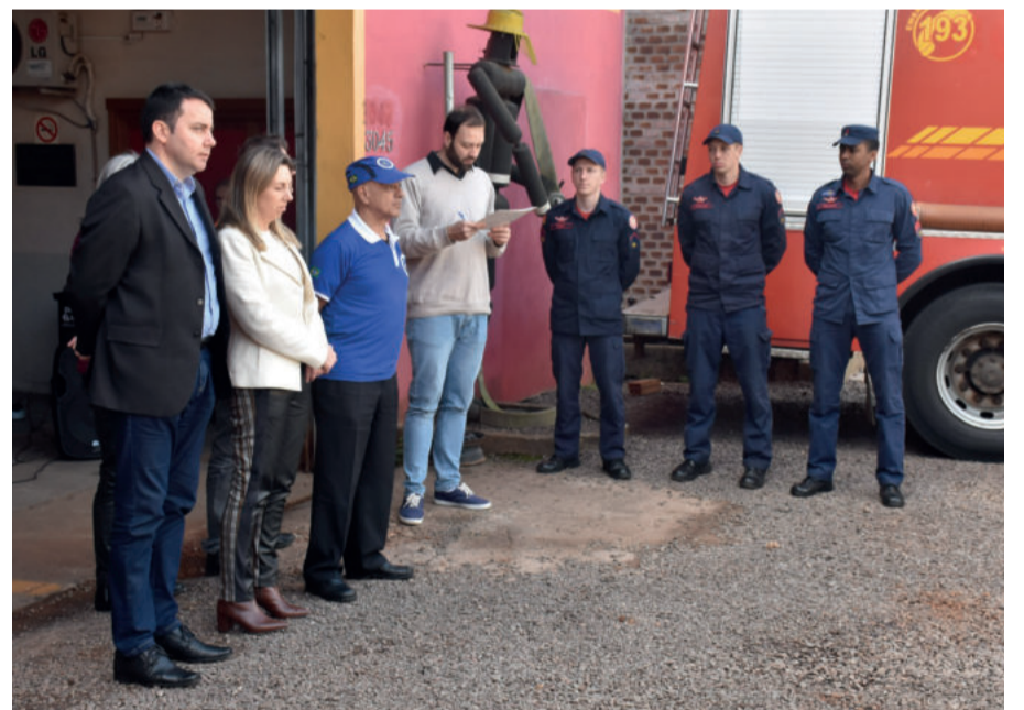
Cerimônia aconteceu na sede dos bombeiros