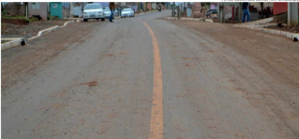
Rua 20 de Maio recebeu pavimentação asfáltica