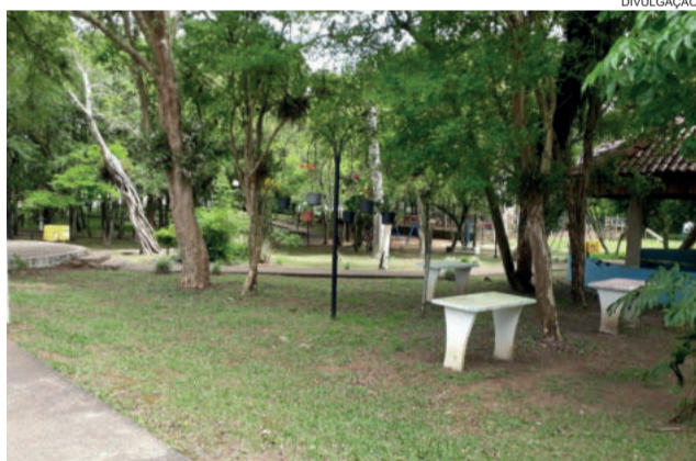
As obras fazem parte de um planejamento

A quadra poliesportiva será construída onde está o campo de futebol de areia. A obra será executada pela empresa EAZ Prestadora de Serviços LTda, orçada em R$ 328,941,15, através de emenda parlamentar do deputado federal do MDB Darcísio Perondi com uma pequena contrapartida do município.