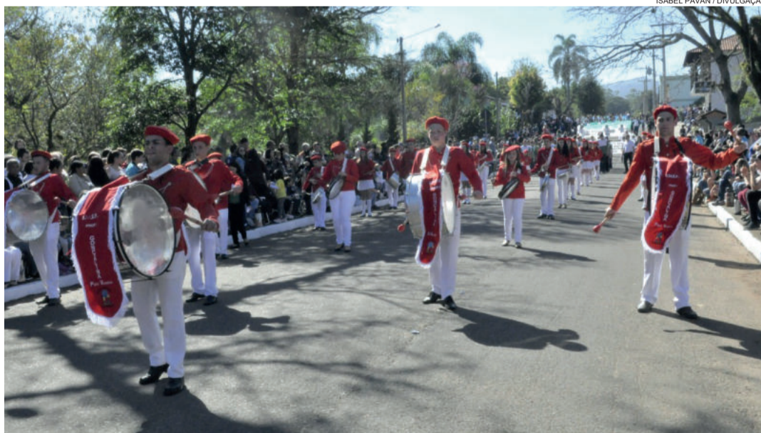
Instituições, grupos, escolas e igrejas estão confirmando presença no evento