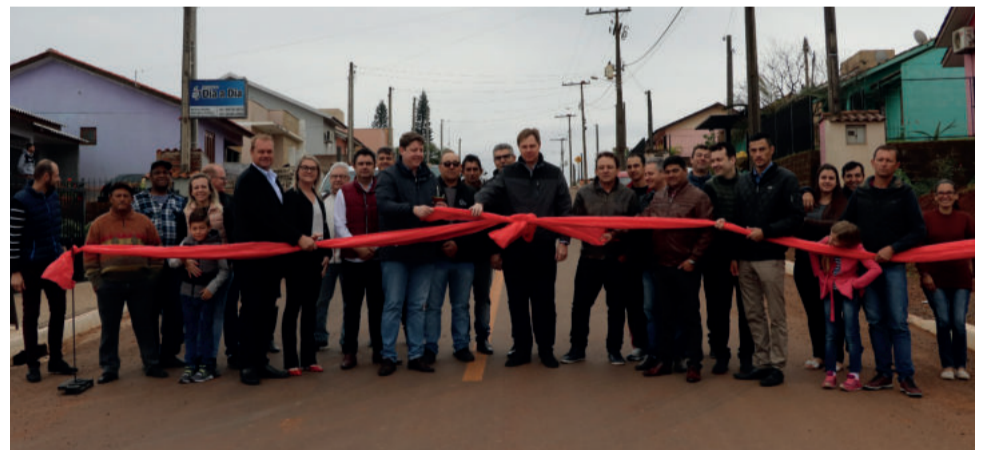
Ato reuniu autoridades e moradores da via