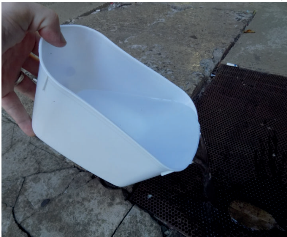
Eliminar os focos do mosquito é dever de todos