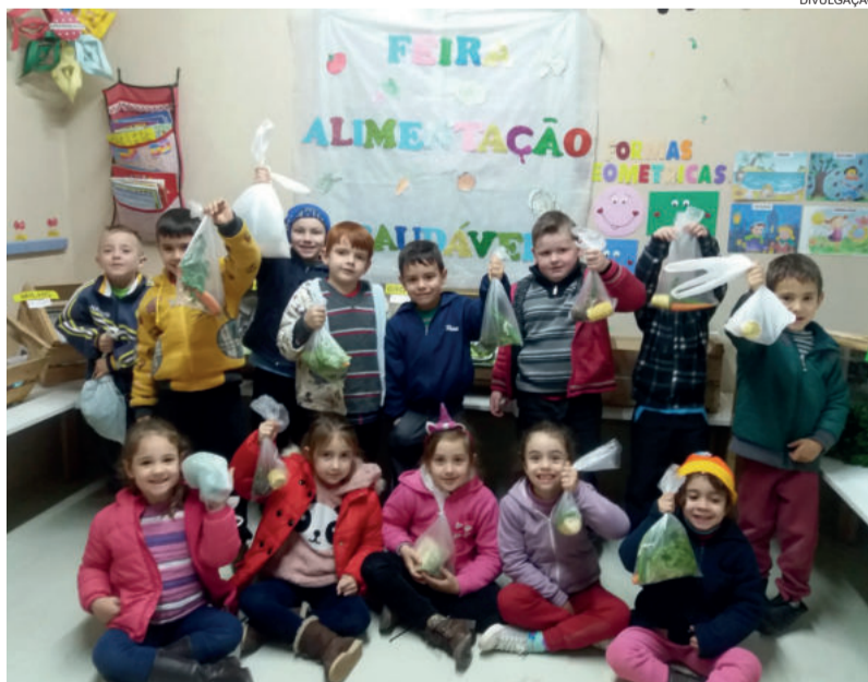
Alunos simularam uma feira em que compraram produtos saudáveis

O objetivo da atividade conforme a direção do educandário é o de que os pequenos valorizarem o valor do dinheiro, entendendo o custo das mercadorias, além de junto a suas famílias comerem os alimentos saudáveis que compraram.