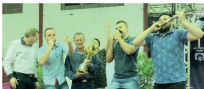
A Grings Piccadilly levou o título de melhor torcida