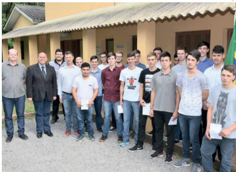
Jovens que prestaram juramento à Bandeira