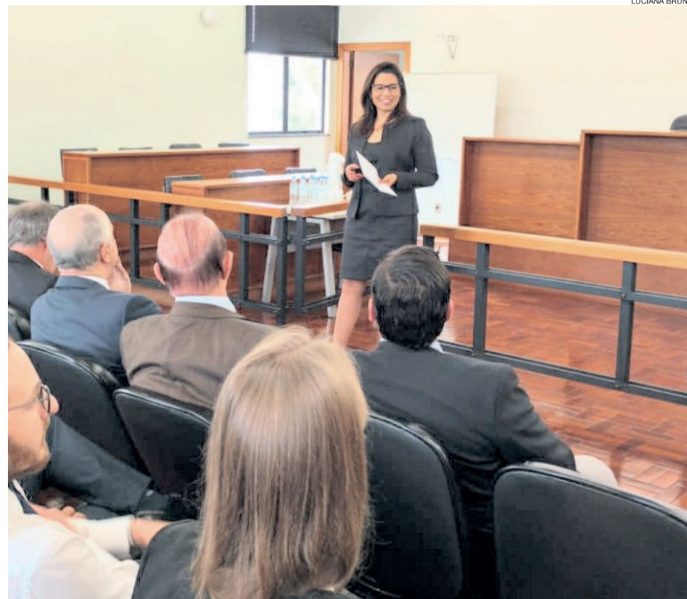
Juíza anunciou conquista da 3ª Vara para a Comarca de Estrela