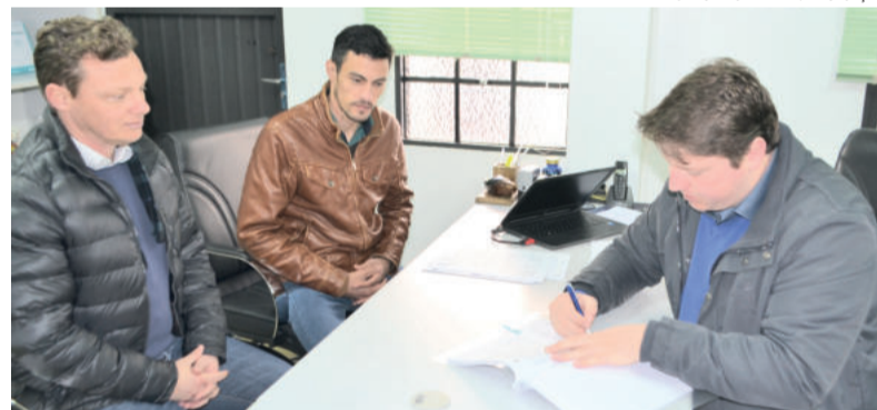
Edital do chamamento público foi publicado no final de agosto