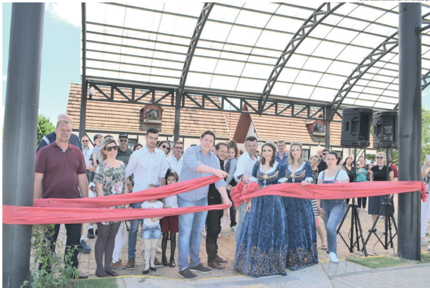
Rua Coberta foi inaugurada

O Arte na Rua será realizado mensalmente, no quarto domingo do mês, para não coincidir com iniciativas semelhantes na região, como Arte na Praça, com duas edições em Lajeado, e Arte na Escadaria, em Estrela. A próxima edição do Arte na Rua ocorre no dia 25 de novembro, com progra-