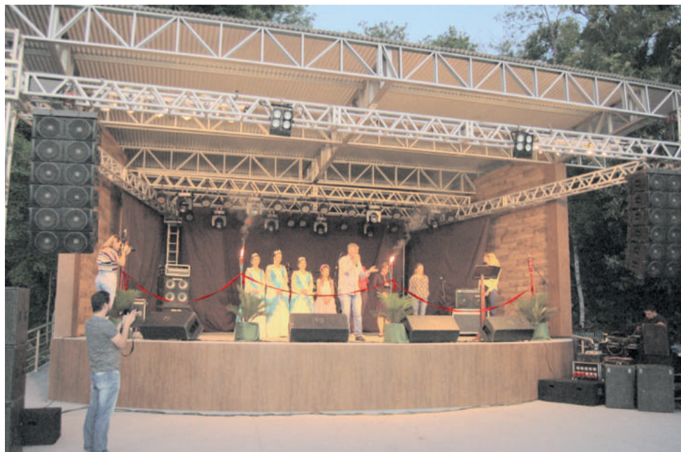
Concha acústica construída na Praça dos Pássaros

dos belos jardins que trazem tanta notoriedade ao município. Os tecidos nobres, como a renda, representam toda a qualidade de vida que os colinenses possuem. O traje completo é composto por saia de armação, saia longa, sobressaia, blusa e colete.