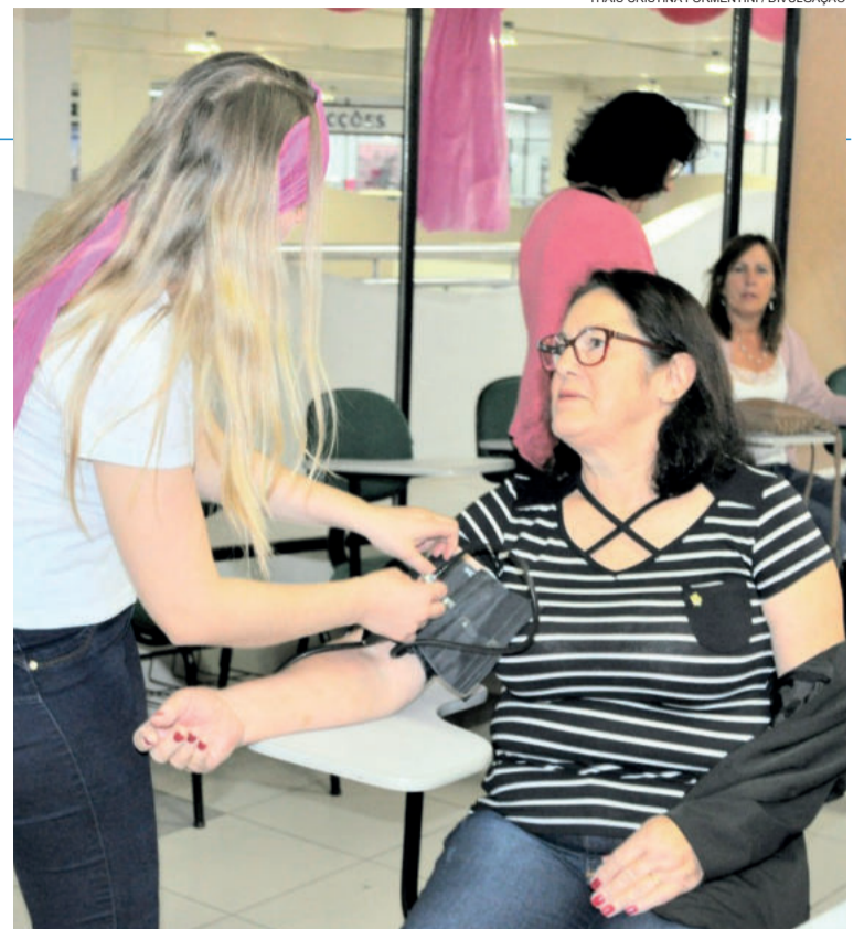
Exames de saúde estiveram entre as atividades ofertadas

A campanha Outubro Rosa tem o objetivo de alertar as mulheres e a sociedade sobre a importância da prevenção e do diagnóstico precoce do câncer de mama. Além disso, conscientiza o público feminino sobre a relevância de conhecer suas mamas, ficando atentas às alterações suspeitas.