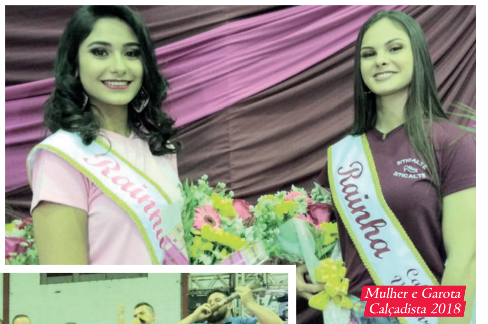
Mulher e Garota Calçadista 2018