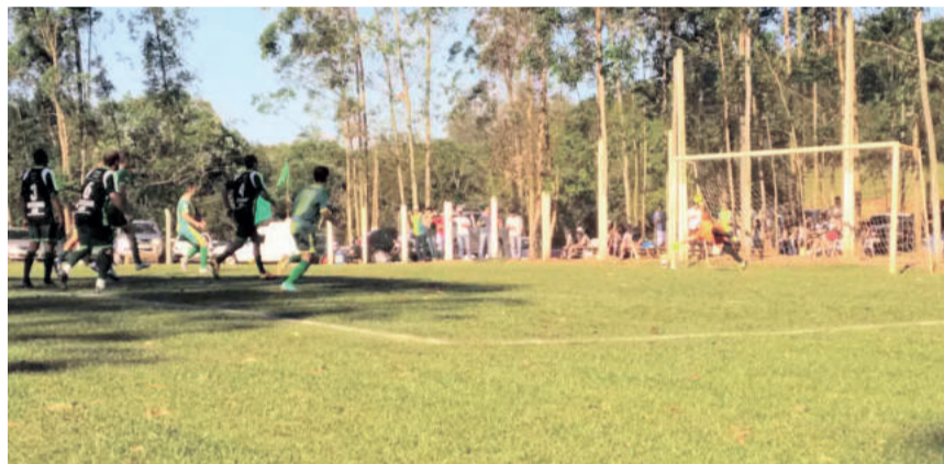
Primeiro gol de pênalti do 7 de Setembro de Capitão. Partida teve total de três penalidades

Com o empate, a equipe do 7 de Setembro precisa apenas de um novo empate para se classificar. Já ao Rubibar apenas a vitória interessa para seguir na competição.