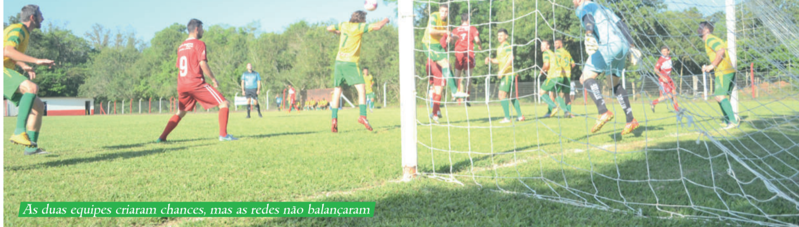
As duas equipes criaram chances, mas as redes não balançaram