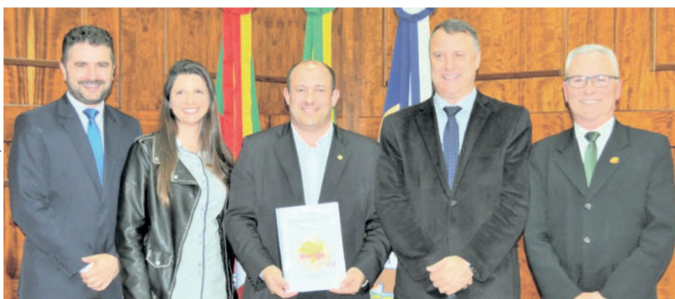
Relatório e novo presidente foram apresentados em reunião na Câmara

Além disso, apresentou valores investidos para a realização do evento. "Tivemos uma despesa total de R$108.590,06 e receita de comercialização dos espaços, de 603m 2 ao valor de R$110,00 ao m 2 , totalizando R$66.330,00", destacou. O investimento do Município foi de R$42.260,06. O vice-prefeito salientou ainda que em todos os anos de Feira de Compras, a Administração Municipal isentou os impostos dos expositores e ainda repassou um determinado valor. "De 2016 a 2018, os últimos dois anos que teve envolvimento de recursos públicos, houve uma diminuição de investimento de 41% e o valor do metro quadrado, do ano passado para esse ano, teve uma diminuição de 38%.", ressaltou. Finalizou apresentando a pesquisa de satisfação efetuada com os expositores.