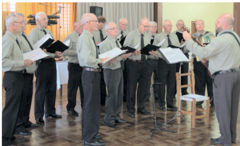
Coro de Homens General Canabarro

“A Comunidade Redentor tem 145 anos, e o Coral sempre era uma parte importante para ser igreja, para ser comunidade. O coro não podia faltar, porque tinha um serviço de louvar a Deus, de render glórias pelos feitos, para cantar no nascimento, na vida adulta e também na morte”, ponderou. “Tem músicas que marcam a gente na alma, no coração, na carne e na memória”, relacionando as diferentes músicas que marcam as fases da vida.