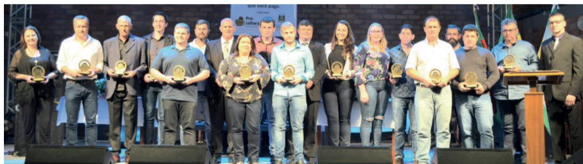
Agraciadas as 20 empresas do simples nacional