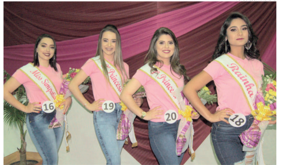
Corte das Garotas Calçadistas 2018