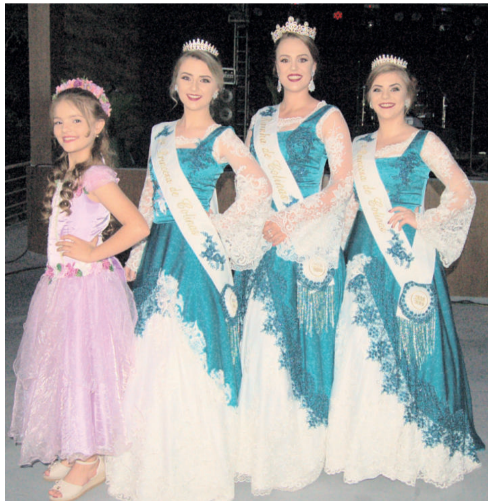
Soberanas (d) apresentaram novos trajes à comunidade, ao lado da Menina Flor