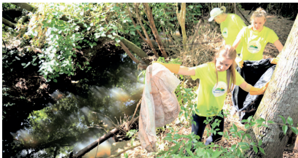
Voluntários recolheram resíduos às margens do Arroio Boa Vista e afluentes

O Revive Boa Vista é uma realização da Unidade Parceiros Voluntários de Teutônia, com apoio da Administração Municipal de Teutônia e da Emater/RS-Ascar, além das mantenedoras CIC Teutônia, Certel, Couros Bom Retiro, Seccare, Cooperativa Languiru, Sicredi Ouro Branco, Unimed Vales do Taquari e Rio Pardo e Star Led.