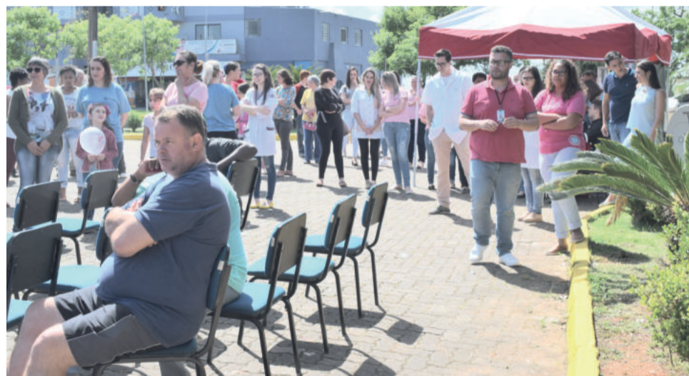
Novas salas foram apresentadas à comunidade