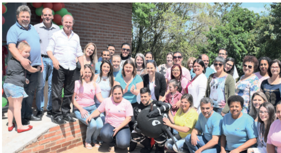
Novas salas foram apresentadas à comunidade