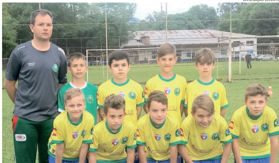
Equipe Sub-11 da Juventus disputará torneio na Espanha

O grupo sairá às 2h da madrugada de quarta-feira de Teutônia até o Aeroporto Salgado Filho. Depois, embarcam para São Paulo às 6h. De São Paulo, seguem em voo até Madri, de onde vão a Barcelona. O retorno está previsto para o dia 30/10, fazendo o trajeto de volta, para estar em torno das 15h30 do dia 30 em Porto Alegre.