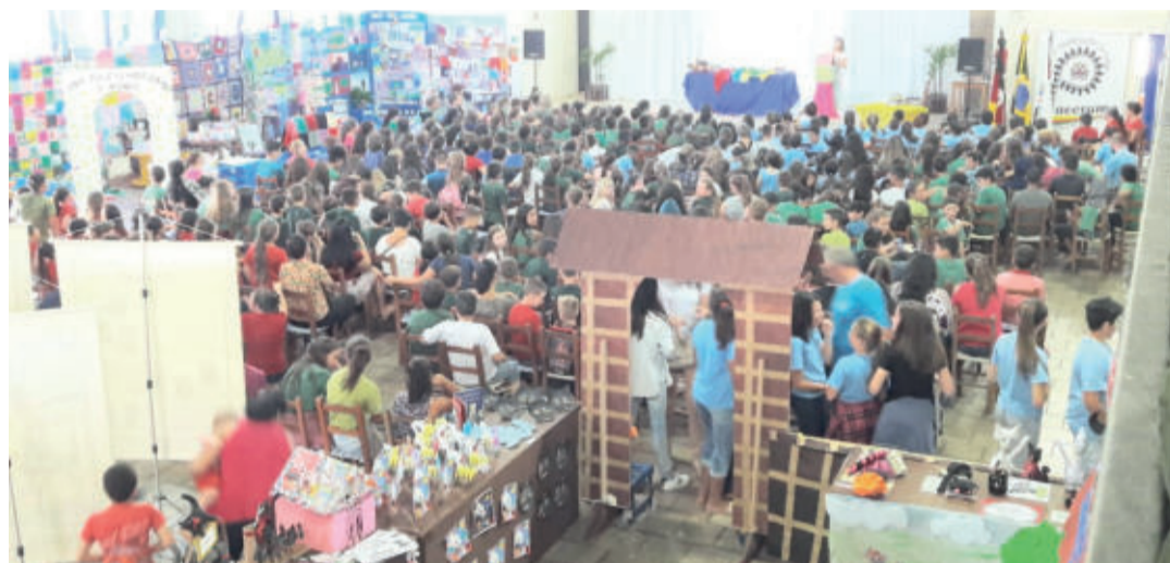
Alunos lotaram o Centro Cultural Evangélico durante a programação da feira

A ideia em desenvolver a temática, conforme a supervisora, é de promover o saber popular. “Conseguimos voltar um pouco para essa tradição das lendas e fazer com que os alunos recontem elas”, explica.