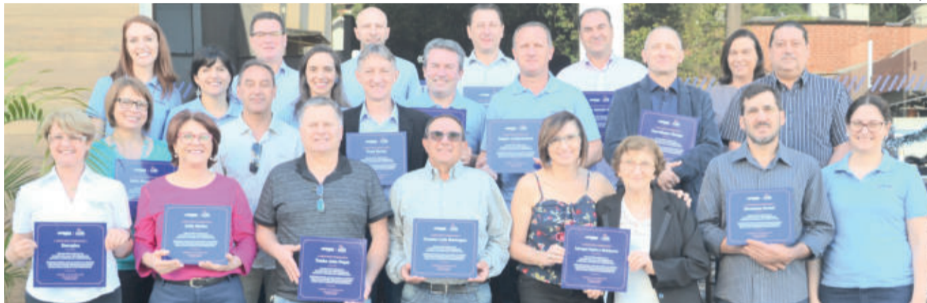
Primeiros associados estiveram reunidos na Apeme