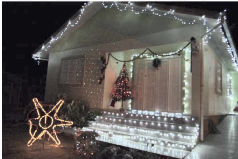
Ilumina Vilanova vai premiar as residências mais decoradas com o tema de Natal