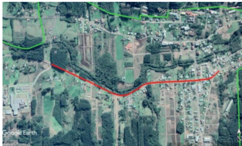
Trecho vai do km 13,6 até o fim da rodovia