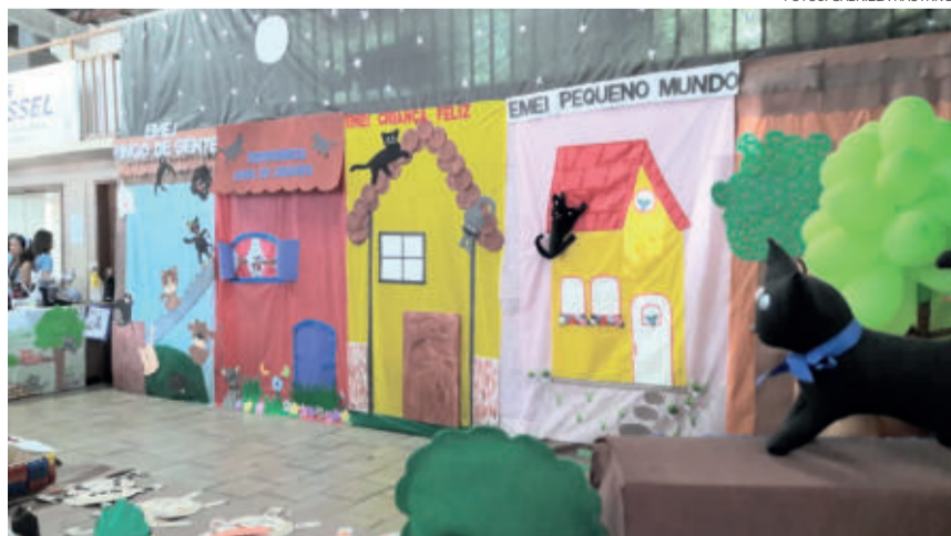
Trabalhos desenvolvidos nas escolas foram expostos na Feira do Livro