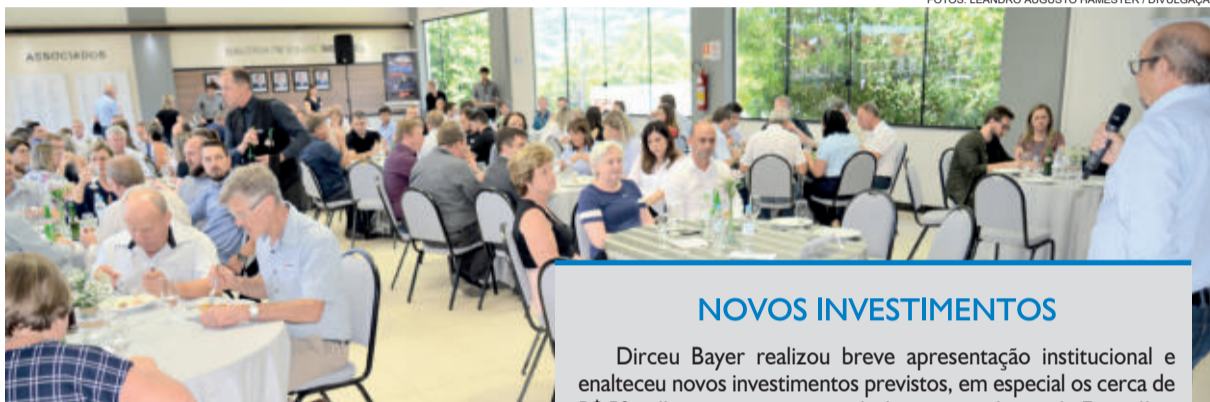
Evento reuniu grande público no Auditório 03 da entidade empresarial teutoniense

“Todo esse trabalho da Languiru está focado no desenvolvimento econômico e social dos seus associados e, consequentemente, no crescimento das comunidades em que estamos inseridos, valorizando o produtor rural que fornece a matéria-prima para os produtos de qualidade da Languiru comercializados no mercado nacional e internacional”, disse o presidente.