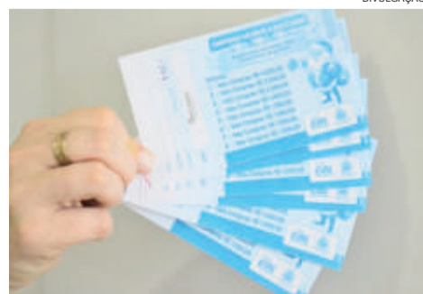
Cautelas estão disponíveis nas lojas conveniadas ao CDL Paverama

sumidor tem direito a uma cautela. O sorteio será no dia 13 de janeiro no Parque 13 de Abril.