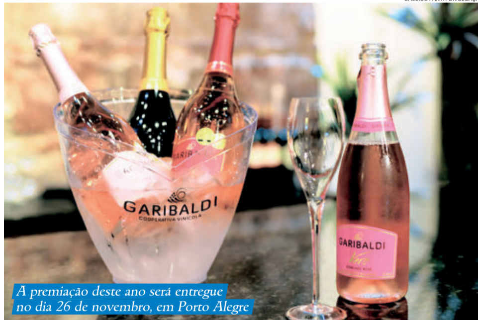
A premiação deste ano será entregue no dia 26 de novembro, em Porto Alegre

nas vendas de espumantes na comparação com igual período do ano passado – o mercado gaúcho representa 38% do faturamento total acumulado. A expectativa é encerrar o ano com o total de 2,8 milhões de garrafas de espumantes vendidas (40% a mais em relação a 2017).