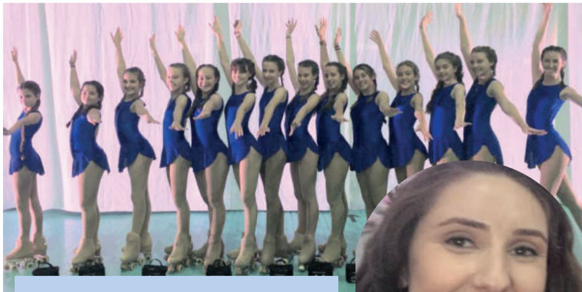
Algumas patinadoras do Grupo de Imigrante