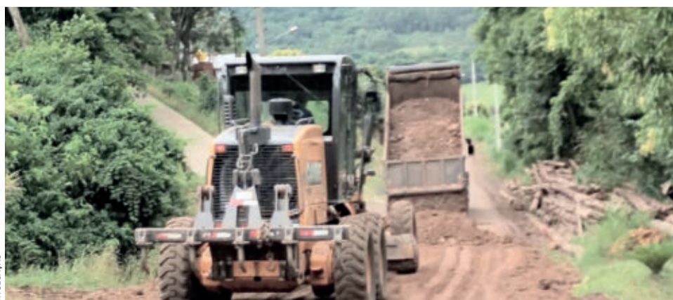
Via recebe ensaibramento