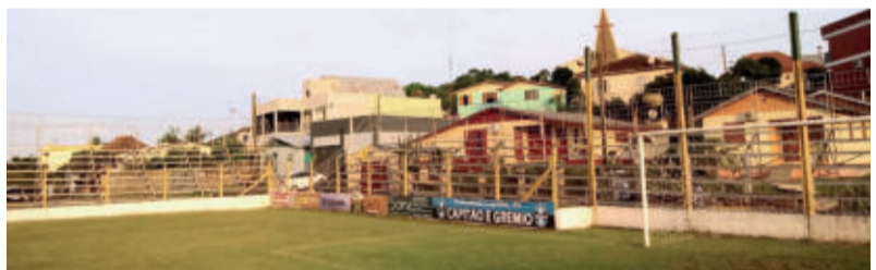
Estrutura do 7 de Setembro preparada para receber 2 mil torcedores em arquibancadas móveis