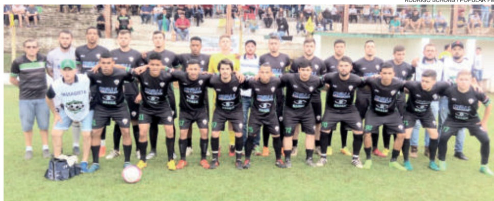
São Cristóvão tem a vantagem do empate na decisão do Campeonato Regional