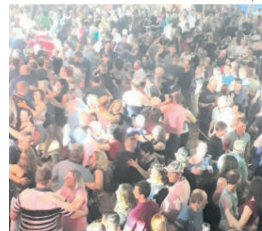
Público expressivo compareceu ao evento no Cebovi