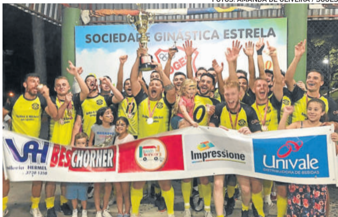
Xtotz United - Campeão da 1ª Divisão