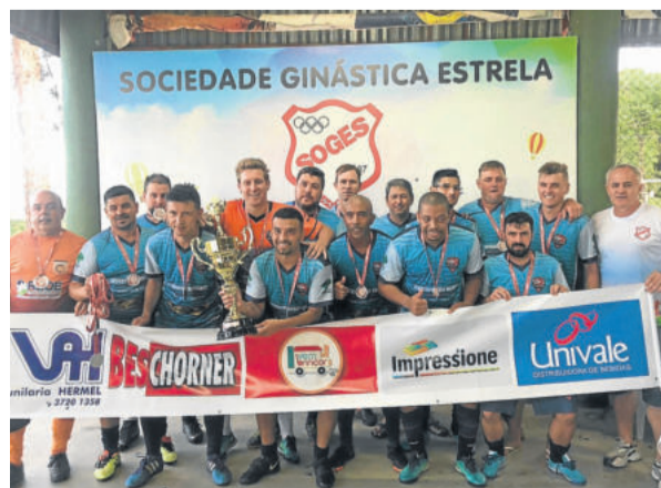
Rejeitados - Vice-campeão da 2ª Divisão