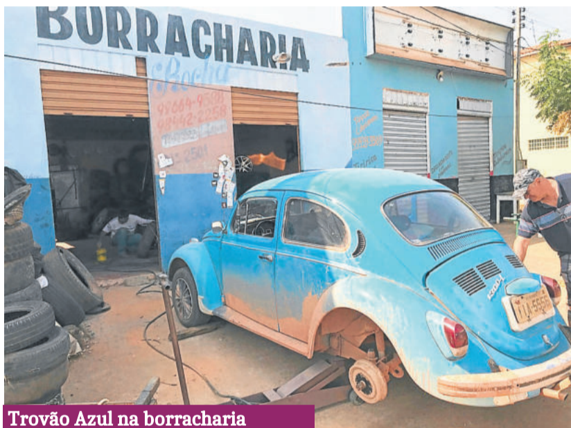
Trovão Azul na borracharia

fotos, filmamos ele falando e no fim o cara queria uns míseros trocados pelo serviço. Deixamos um valor a mais, pois era perceptível a maior necessidade dele do que a nossa em ficar com aqueles trocados. Não era questão de ser rico ou pobre, até porque dos valores que estávamos falando ninguém enriqueceria ou empobreceria, mas era o negócio de ajudar quem nos ajudou... 5 reais a mais fazem muita diferença nesses momentos.