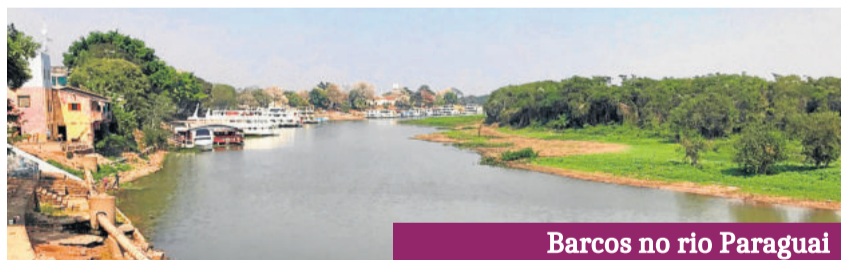
Barcos no rio Paraguai