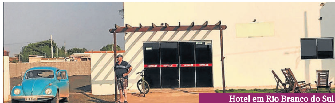
Hotel em Rio Branco do Sul

grãos, óleos e cargas diversas; fazendo daquela cidade um polo de distribuição. Por isso, a enxurrada de caminhões que nos atormentaram a vida. Finalizamos o dia nos hospedando à beira da estrada numa localidade minúscula chamada Ouro Branco do Sul, mas num hotelzinho simpático, com boa comida e cerveja gelada... pra variar!!!