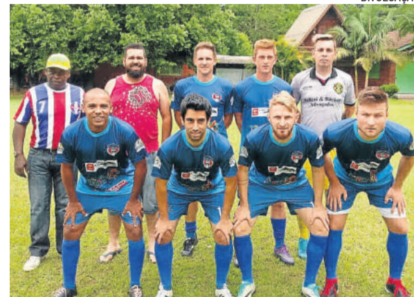
Os Sombras obteve importante vitória no sábado