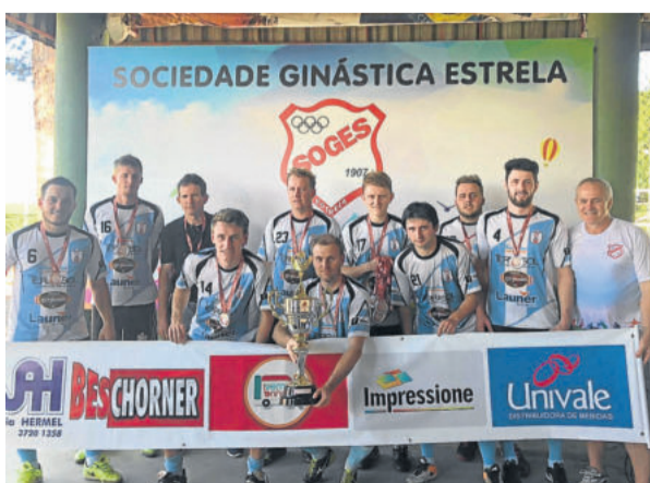
Saidera - Vice-campeão da 1ª Divisão