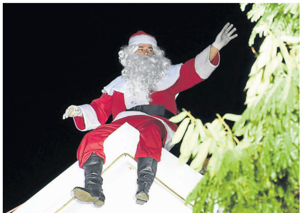
Papai Noel apareceu de surpresa