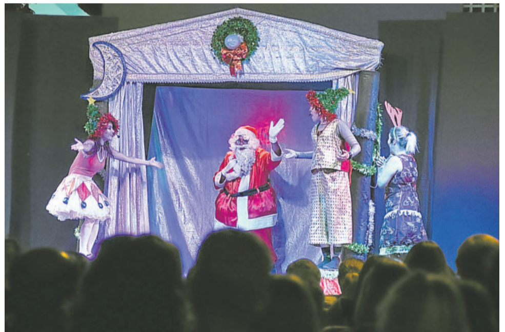
Espetáculo “O Natal da família Gentil”