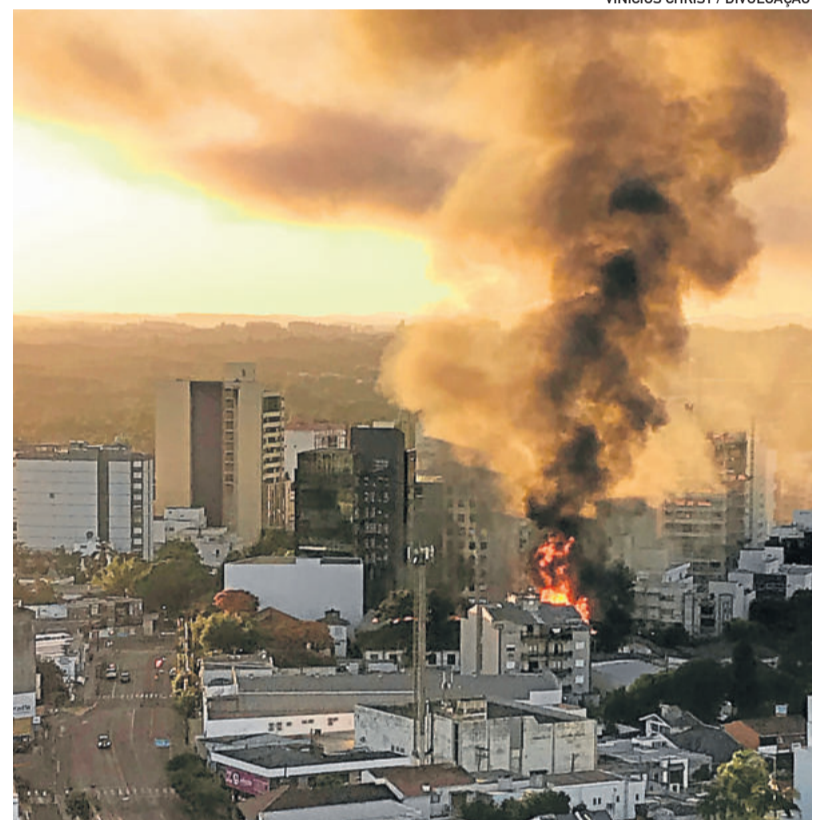
Fumaça tomou conta do céu de Lajeado durante o fogo