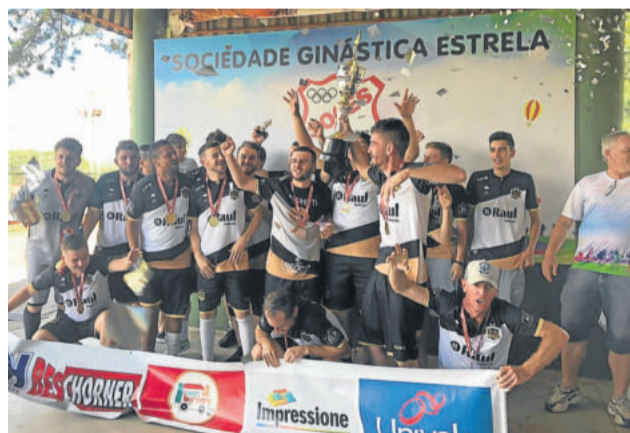
Nárnia - Campeão da 2ª Divisão