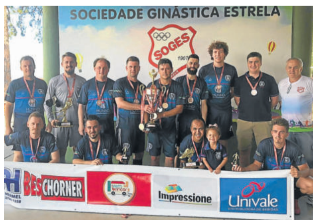
Cevaria - Vice-campeão da 2ª Divisão