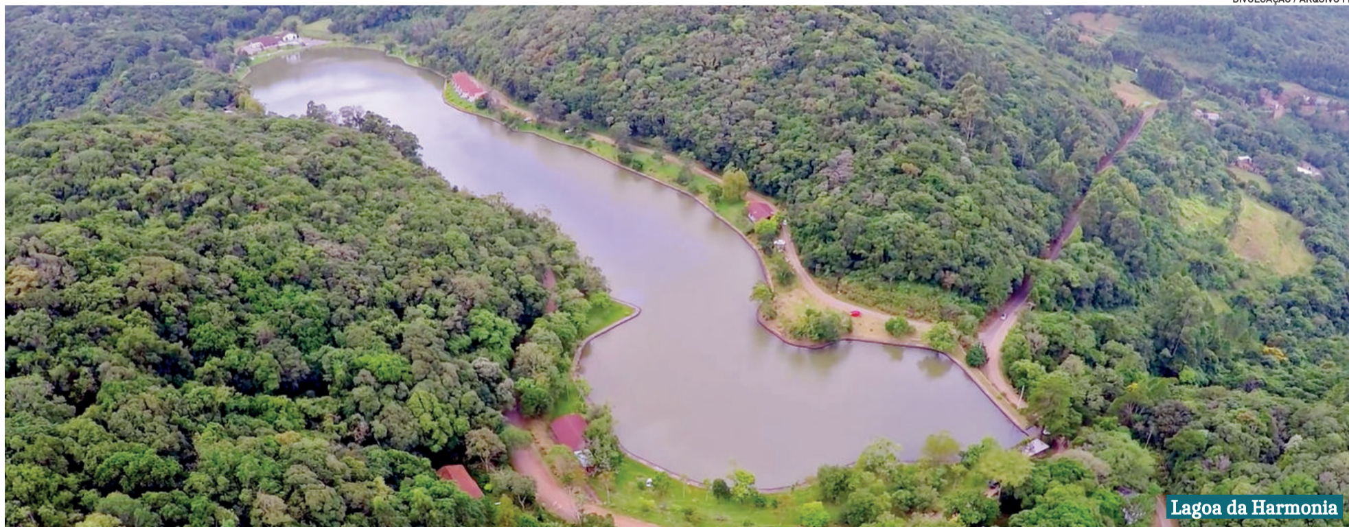
Lagoa da Harmonia