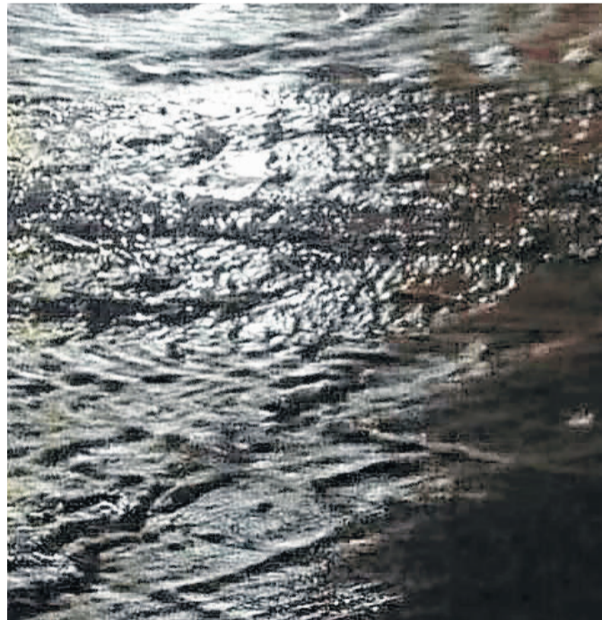
Alguns pontos tiveram alagamento

As equipes da prefeitura já estão realizando, desde sábado (21/12), a limpeza de algumas ruas e continuarão os trabalhos nos próximos dias. "Também estamos analisando com a equipe de engenharia alguns pontos que precisam de soluções mais rápidas", completou Kaplan. Uma das situações mais complicadas é na rua Guilherme Ernesto Lagemann, que precisa de uma drenagem nova, assim como será feito na Rua Augusto Gärtner.