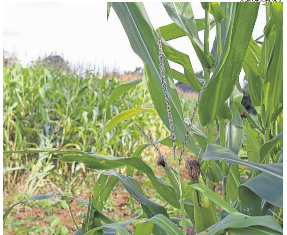
JULIA CAROLINE GEIB

Neste cenário de oportunidades e desafios, com custos de produção elevados, capacitação e gestão são primordiais para os produtores rurais.