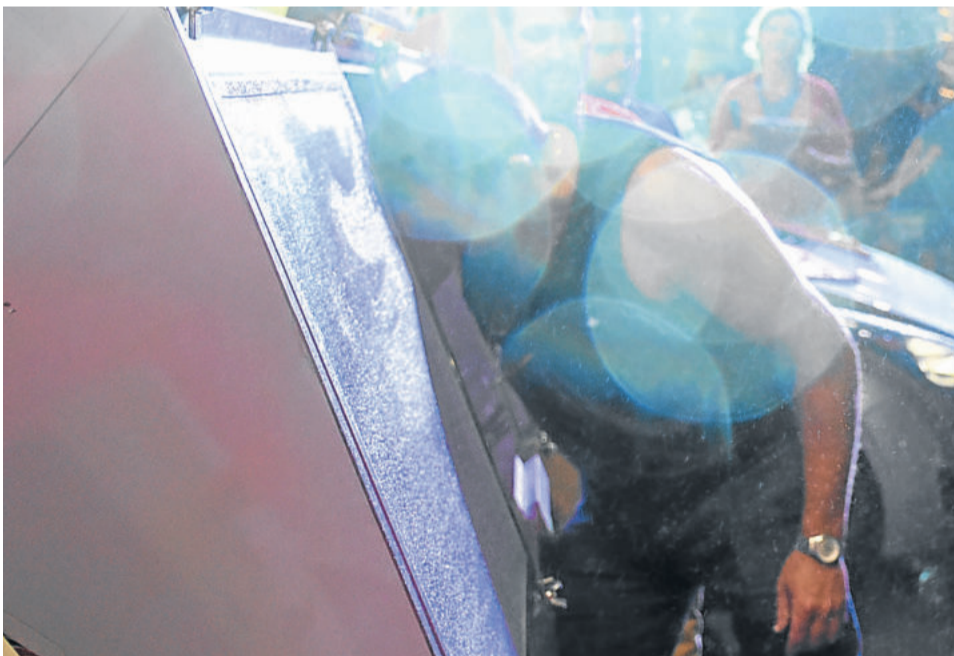
Chuva marcou o sorteio da Temporada de Prêmios