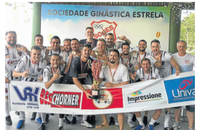
Diretoria - Campeão da 3ª Divisão