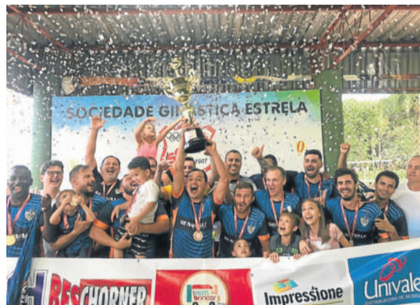
Limitados - Campeão da 2ª Divisão