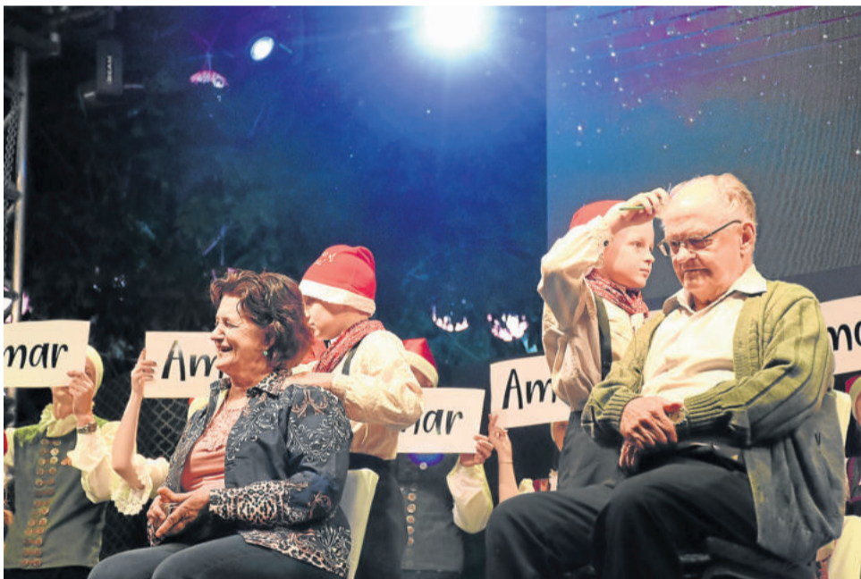
Avós e netos foram destaque no palco

fogos anunciou a chegada do Papai Noel, que apareceu no telhado da prefeitura e desceu de rapel ao encontro das crianças.