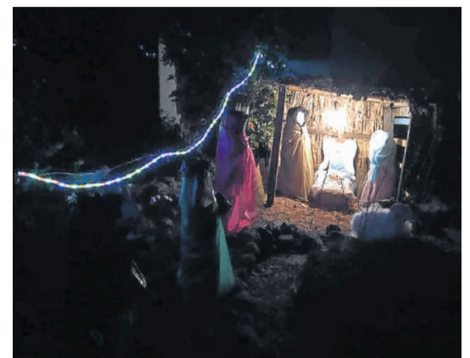
Walli Schmidt - 1º lugar melhor criatividade residências