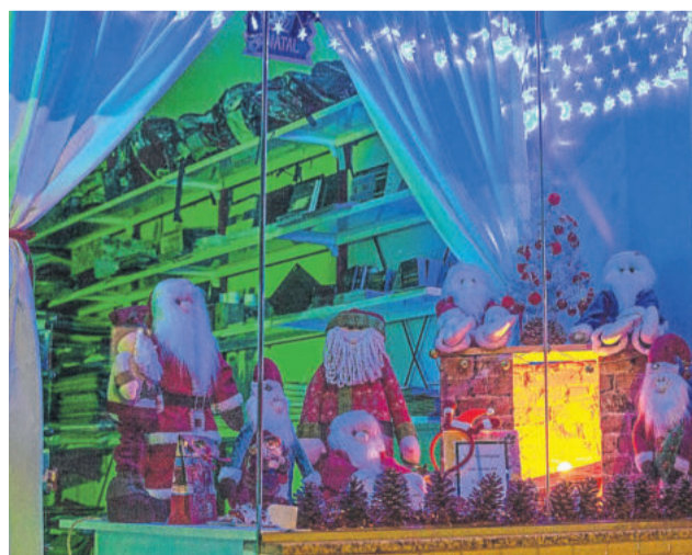
Naturalú - 1º lugar categoria Melhor Criatividade para comércio