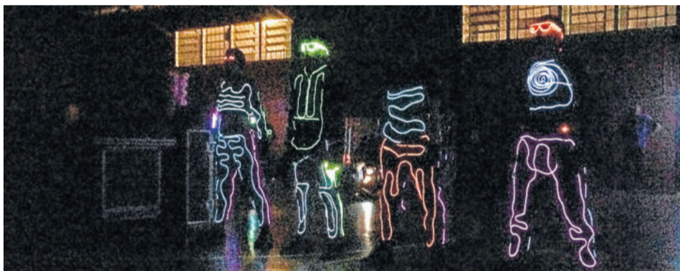
Show "Horizonte de Neon" captou a curiosidade através das luzes de led