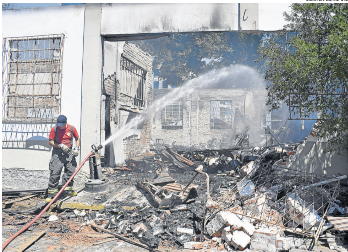
Fogo foi controlado por volta das 8h30 da manhã