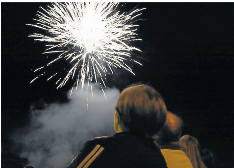
Noite foi encerrada com show de fogos