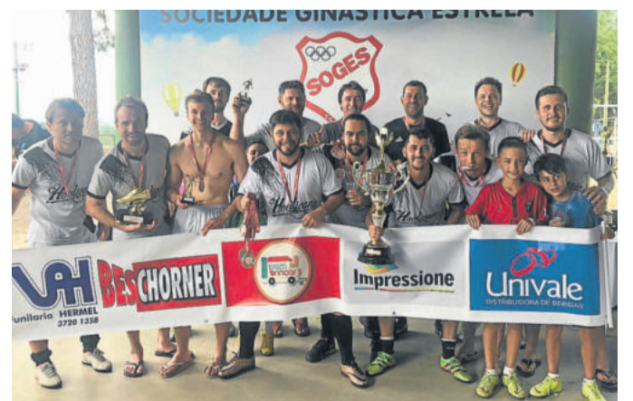
Hooligans - Vice-campeão da 3ª Divisão