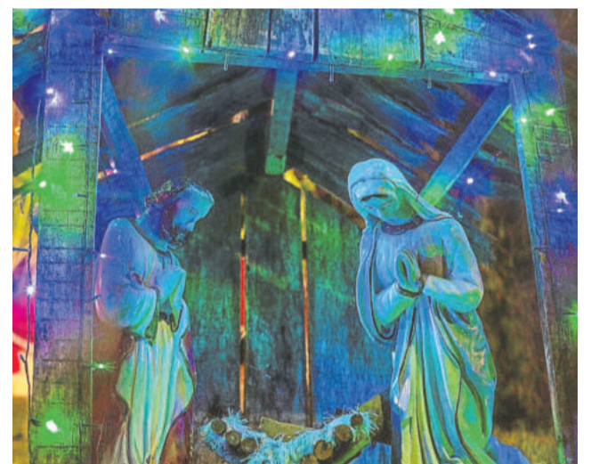
Fabrício Kortz - 1º lugar na Melhor Iluminação de residências