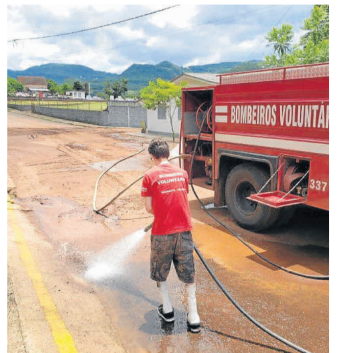
Bombeiros Voluntários auxiliaram na limpeza