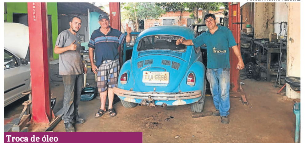
Troca de óleo