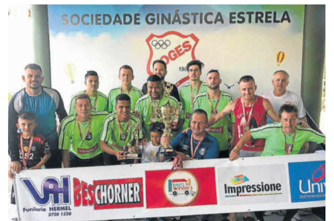
Super 10 Original - Vice-campeão da 3ª Divisão