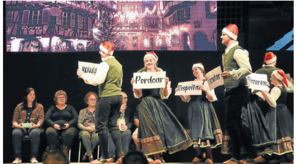
Westfälische Tanzgruppe fez parte da apresentação

O Grupo Instrumental de Westfália e apresentações de dança também tiveram espaço durante a programação. Ao fim do espetáculo, o show de