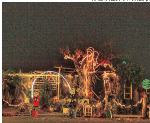
Colibri Artesanatos - 1º lugar como Melhor Iluminação para comércio