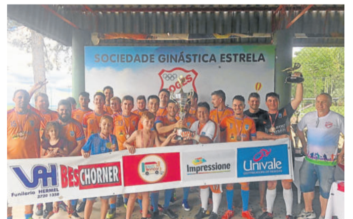
Fúria - Campeão da 3ª Divisão