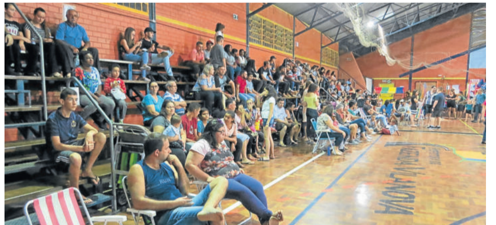
Aos poucos, público foi ocupando os espaços da arquibancada