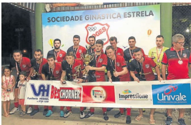
Brocadores - Vice-campeão da 1ª Divisão