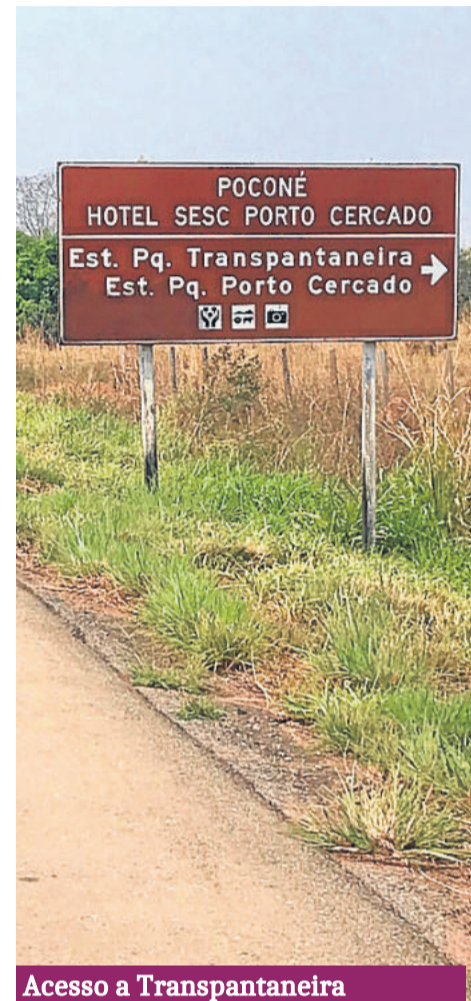
Acesso a Transpantaneira