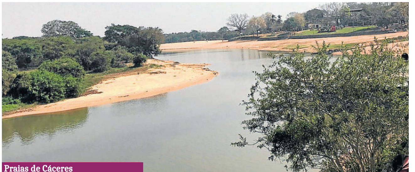
Praias de Cáceres