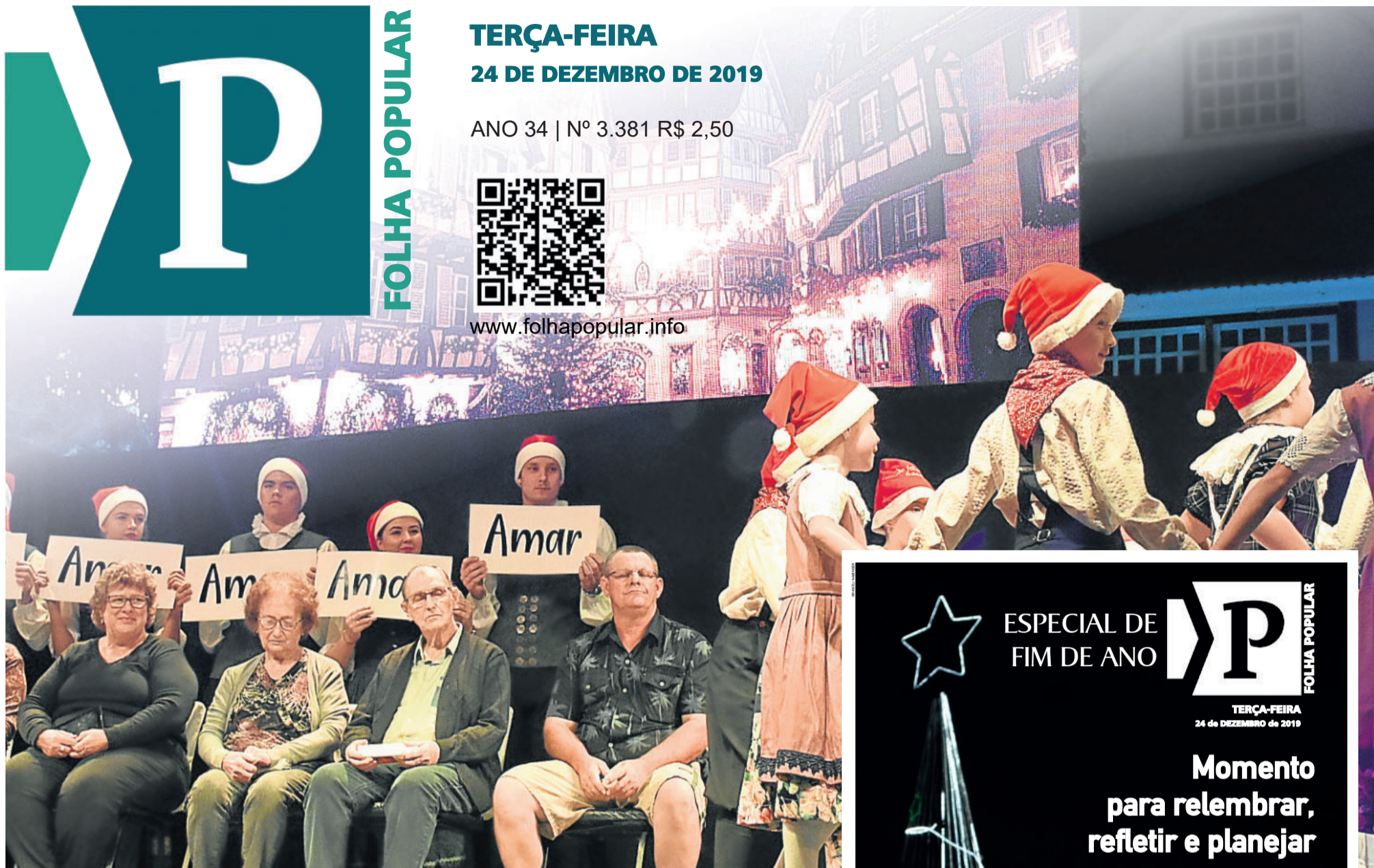
Eventos de Westfália (foto), Boa Vista do Sul, Fazenda Vilanova, Teutônia e Imigrante levantaram reflexões, acenderam o clima natalino e uniram comunidades