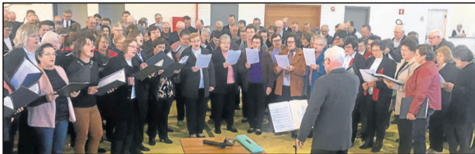
Grande coral misto se apresentou durante a celebração religiosa