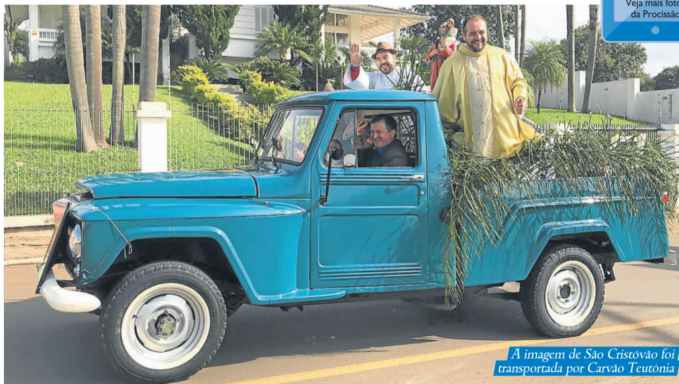
A imagem de São Cristóvão foi transportada por Carvão Teutônia