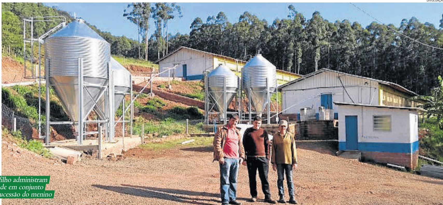
Pai, mãe e filho administram a propriedade em conjunto e visam a sucessão do menino

Entre os motivos que dificultam a sucessão, estão fatores que podem ser encontrados tanto dentro de casa, quanto fora. Dentre eles, estão a falta de autonomia financeira dos jovens, a resistência dos pais em deixar os filhos ajudarem no gerenciamento dos negócios, falta de divisão dos lucros com os filhos. Fora de casa, a educação brasileira voltada para as demandas urbanas, falta de uma política governamental voltada para a juventude rural, crescente urbanização, promessas e possibilidades de emprego nas cidades, são outros obstáculos para a sucessão.