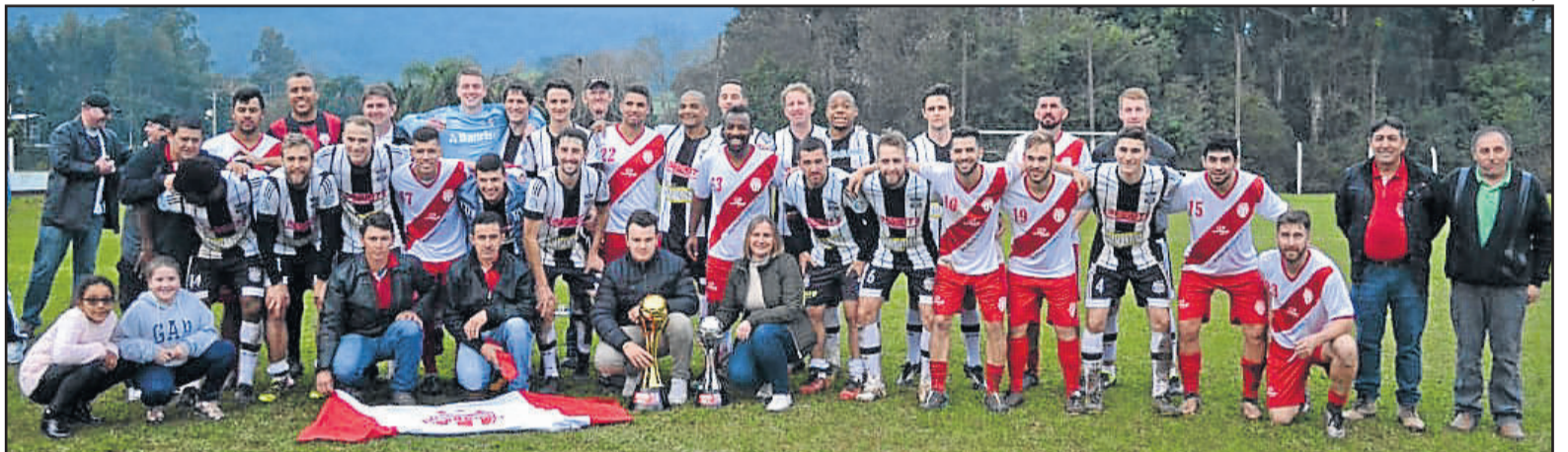
ECAS e Atlético Gaúcho se enfrentaram nos Titulares