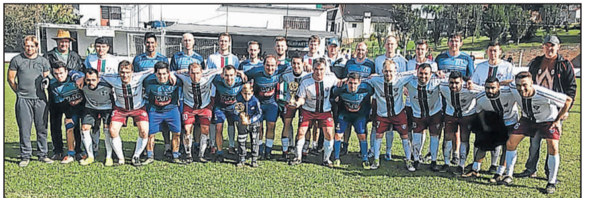
Avante e Fluminense fizeram o primeiro jogo do dia