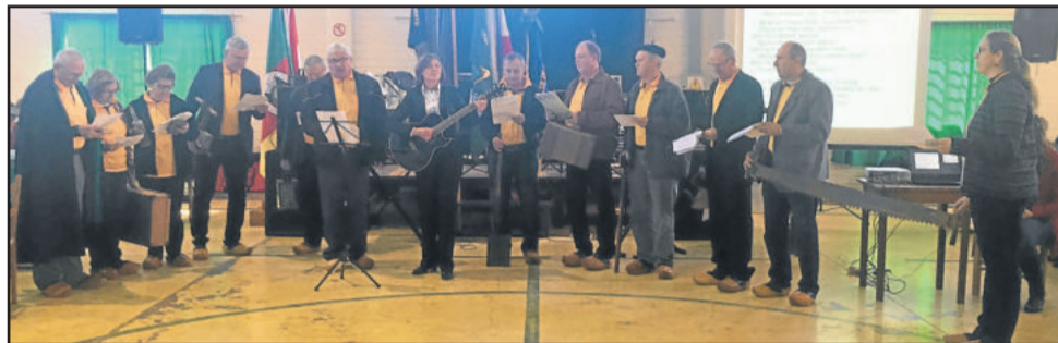
Amigos do Sapato de Pau se apresentaram