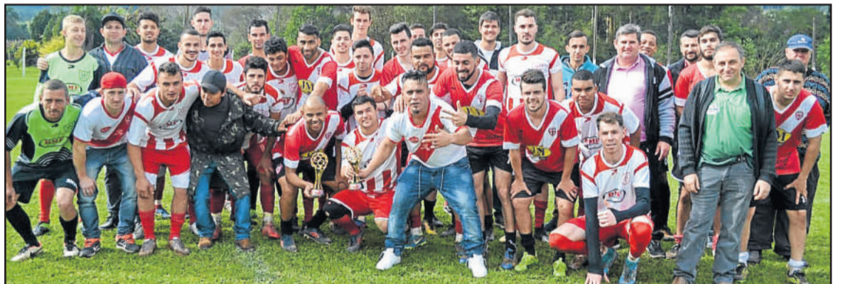
União da Germano e Internacional jogaram no fim da manhã de domingo