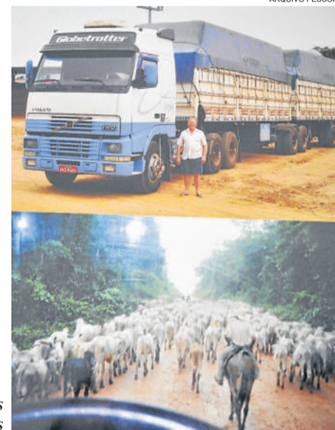
Imagens recordam as viagens e histórias ao longo dos anos