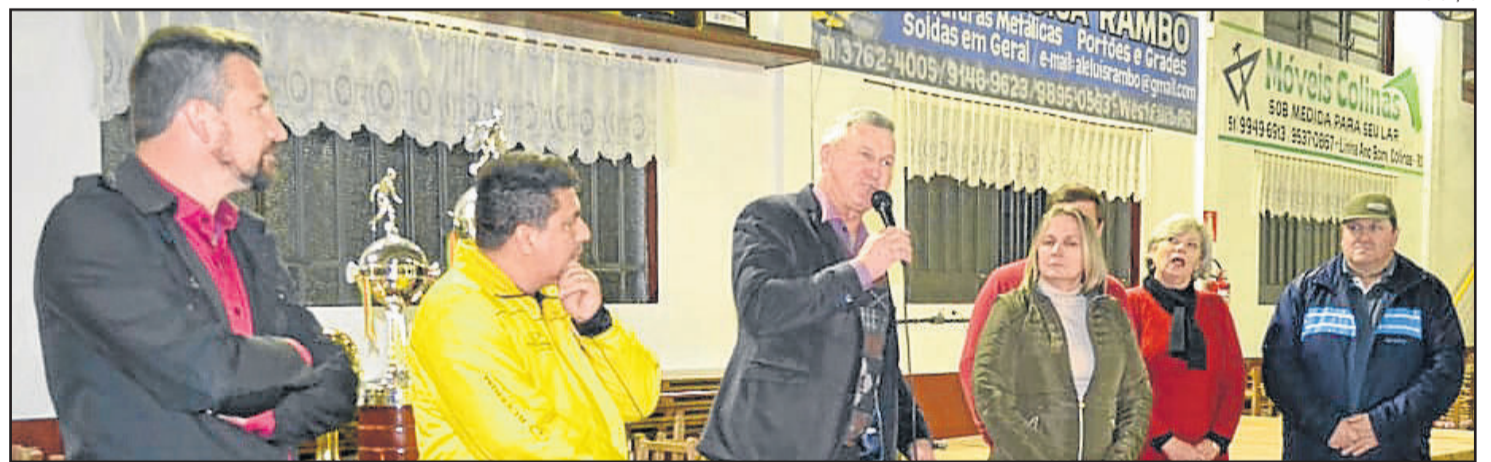
Premiação da Taça da Amizade foi entregue na noite de domingo