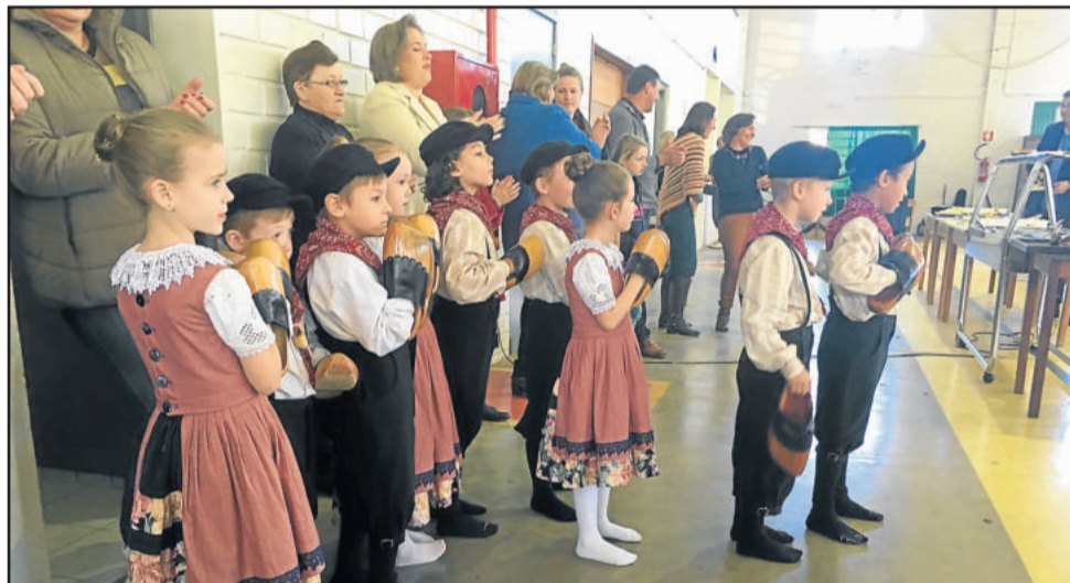
Categoria Mirim do Westfälische Tanzgruppe se apresentou no início da tarde