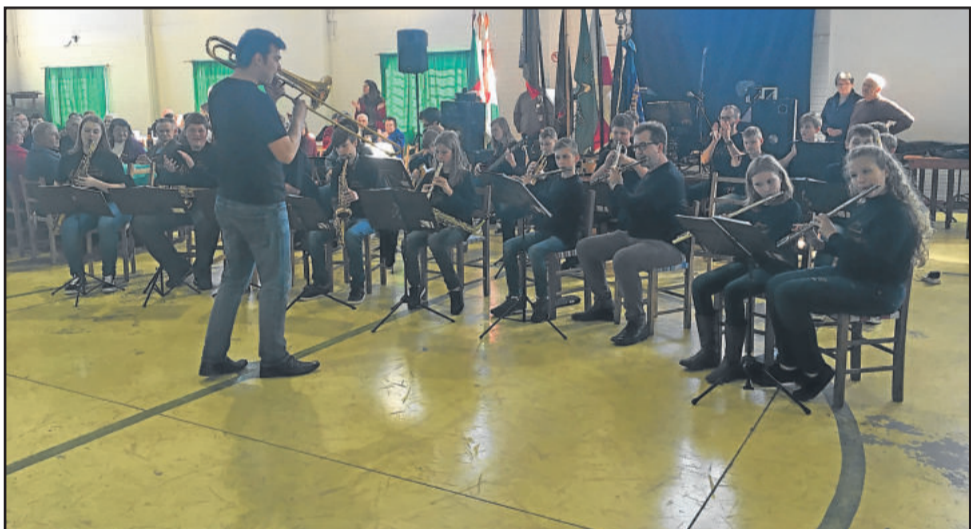
Grupo Instrumental de Westfália