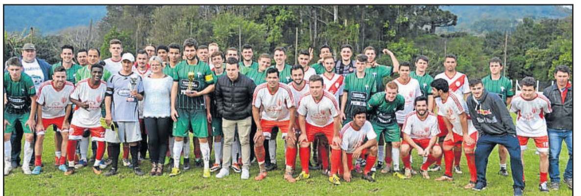
Atlético Gaúcho e 11 Amigos jogaram domingo à tarde

HS consórcios Uma empresa do Grupo Herval