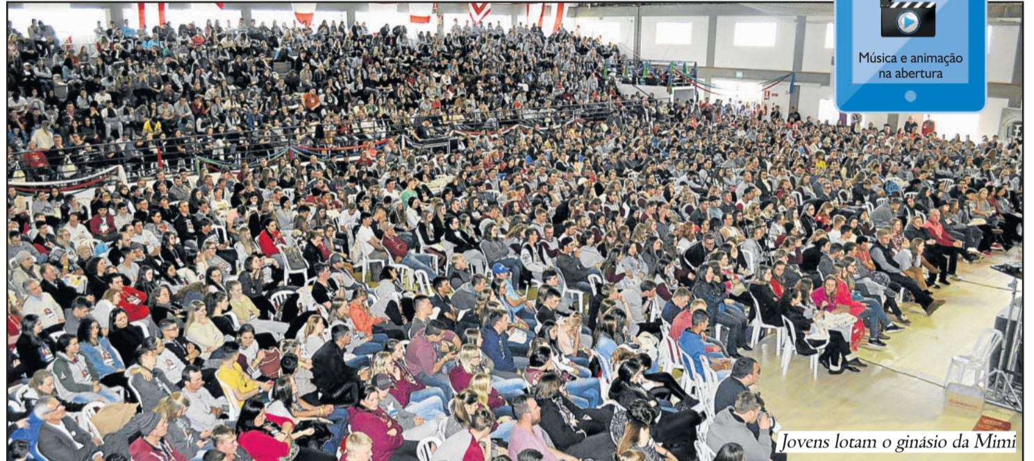
Jovens lotam o ginásio da Mimi