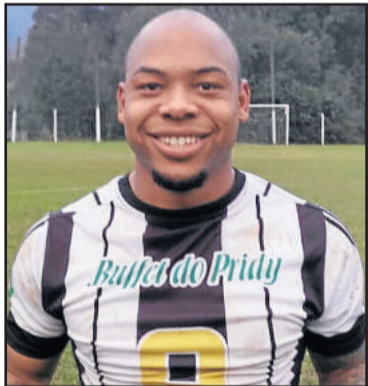
Tanque, do ECAS, craque dos Titulares