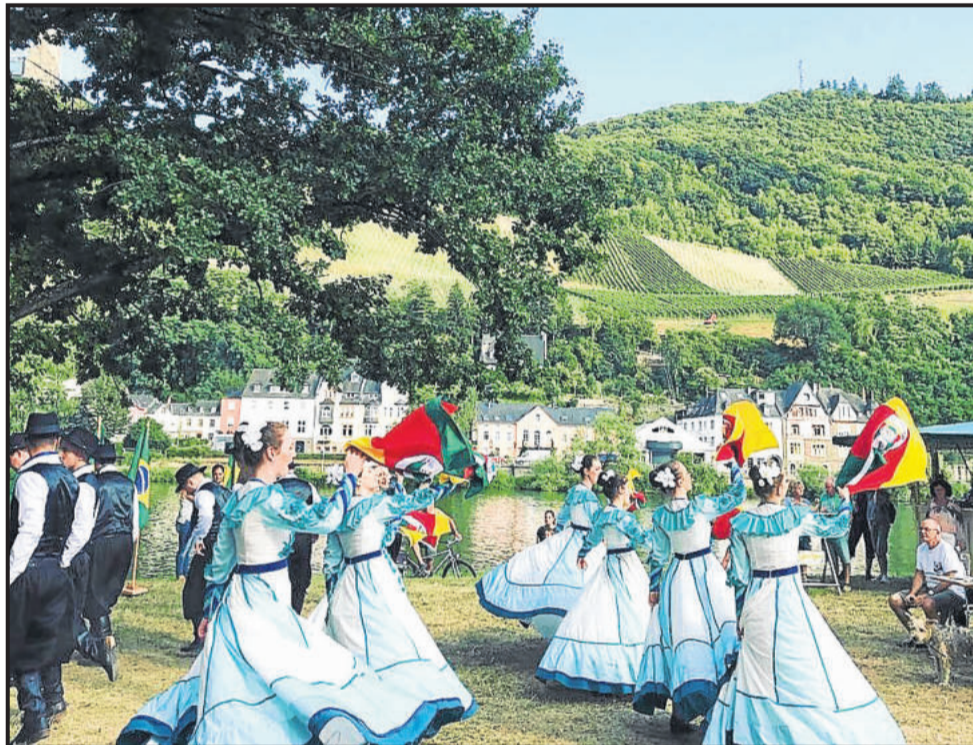
Apresentação durante o Moselauen Fest: grupo exibiu talento e desenvoltura durante o festival no município de Bernkastel-Kues