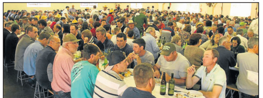
Almoço será servido a preço de R$ 37 (adulto)