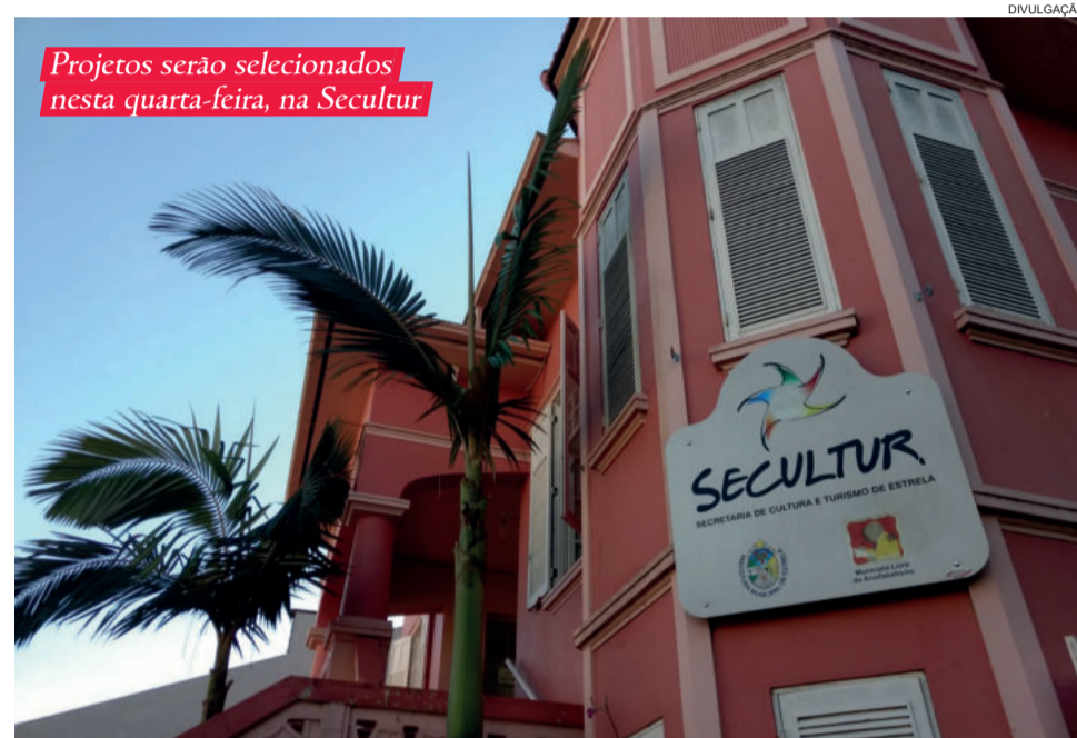
Projetos serão selecionados nesta quarta-feira, na Secultur

artísticas e culturais da comunidade. Mais informações pelo telefone (51) 3190-1258, das 8h às 11h30min e das 13h30min às 17h, na Secultur.