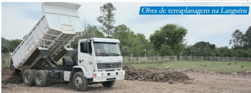
Obra de terraplanagem na Languiru