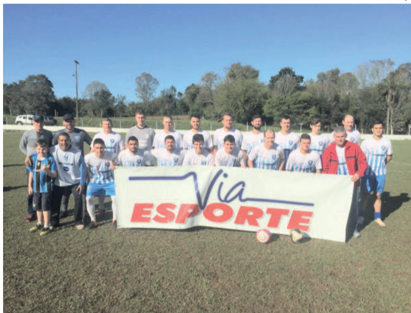
Boa Vista venceu o 11 Amigos em Poço das Antas por 2 a 0

Nos Aspirantes, também há cinco vagas definidas: Flamengo, Recreativo, Poço das Antas, Fluminense e 11 Amigos estão garantidos. A última vaga será na Chave B, entre Boa Vista e Independente.