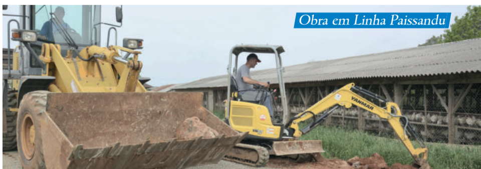
Obra em Linha Paissandu