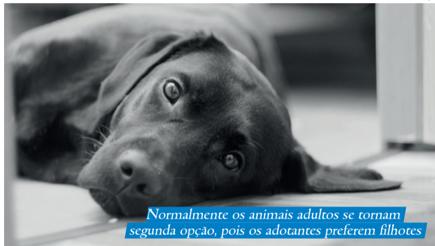
Normalmente os animais adultos se tornam segunda opção, pois os adotantes preferem filhotes

Por estes e outros motivos, como a possibilidade de um animal se ferir, por exemplo, existem critérios para a adoção. A integrante da APANTE sempre certifica-se de que a pessoa tenha um pátio fechado, pois, segundo ela,