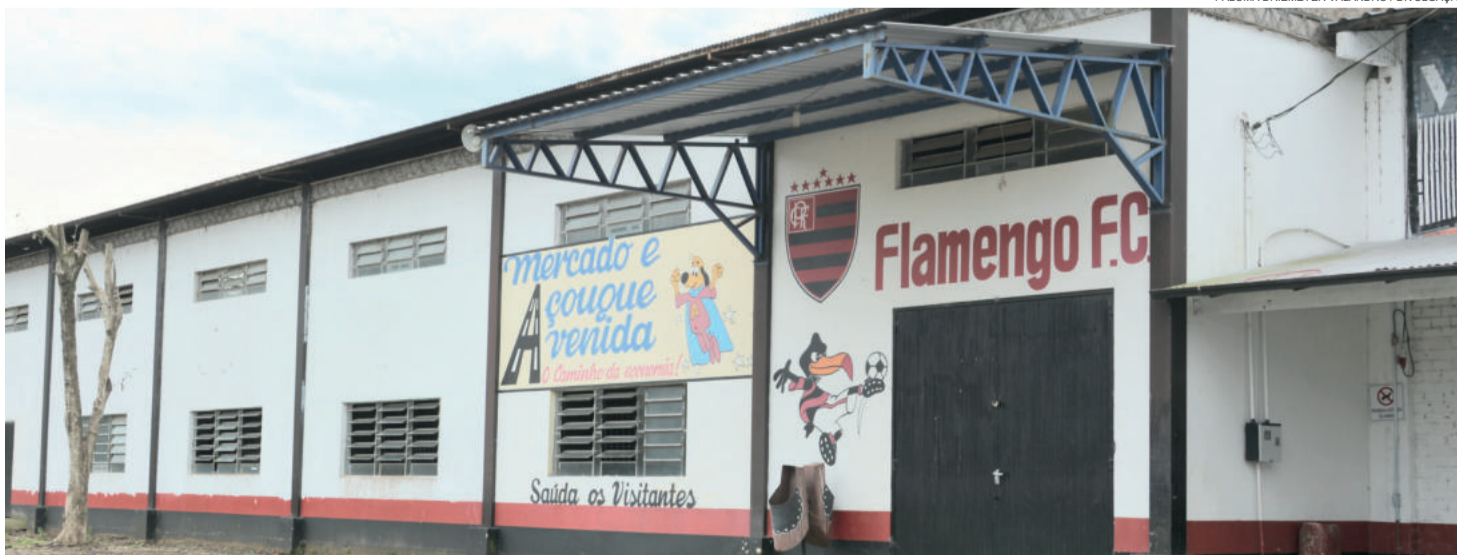
Terceira edição do evento ocorrerá no dia 28 de setembro, na sede da entidade

Terceira edição do evento ocorrerá na sede do clube e terá a animação de Os Atuais