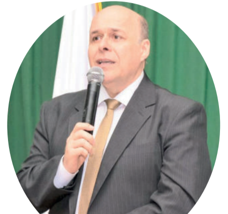
Prefeito Celso Kaplan

O prefeito ainda destaca que as pavimentações das estradas do interior são de grande importância para auxiliar no escoamento da produção primária e manter o desenvolvimento econômico destas pessoas. Na parte urbana, mais ruas serão contempladas com recursos de emendas parlamentares na ordem de aproximadamente R$ 500 mil, cujos processos já estão em tramitação, além da administração estar ainda aguardando novos trechos que poderão ser contemplados com mais recursos.