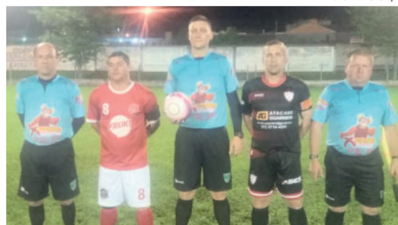
Estudantes e Gaúcho jogaram na noite de sexta-feira