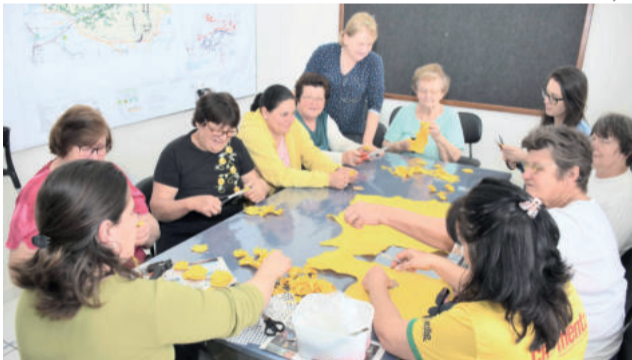
Ações visam conscientizar para a prevenção