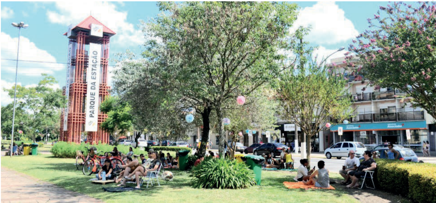
Programação acontece no Parque da Estação