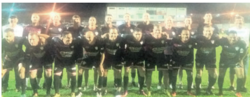
Estudantes é vice-lider do Regional de Veteranos