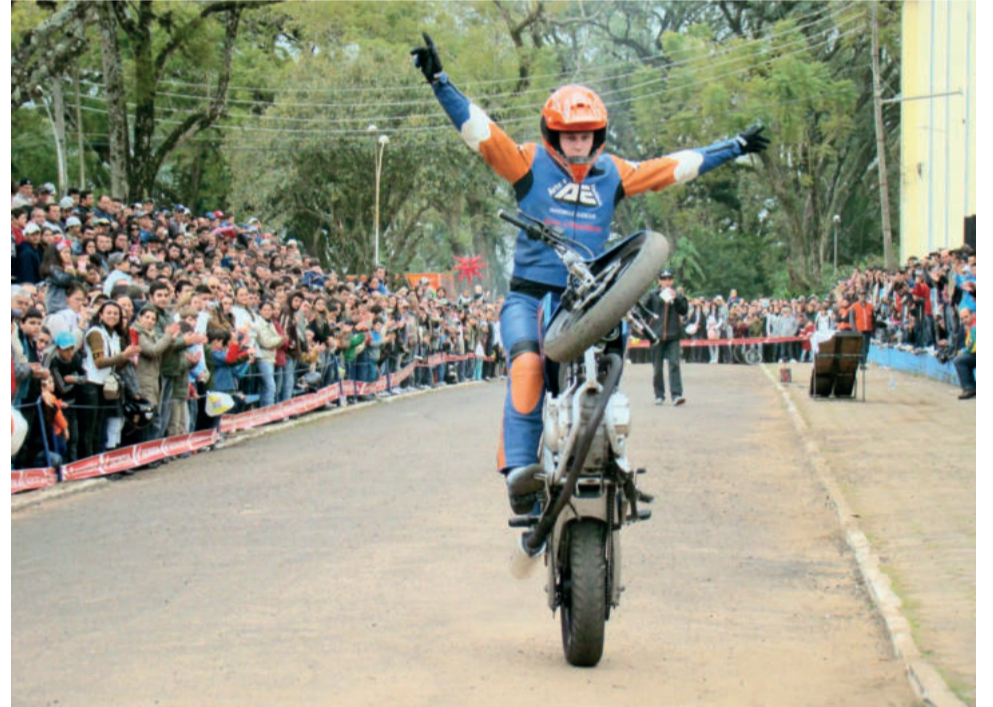
Manobras radicais com a Equipe Arte e Equilíbrio

"Teutônia Moto Fest é um evento de integração dos moto-grupos que percorrem várias cidades e agora terão a oportunidade de receber os amigos aqui. A cidade já tem tradição nesse gênero de evento. A repercussão está muito forte, com a expectativa de