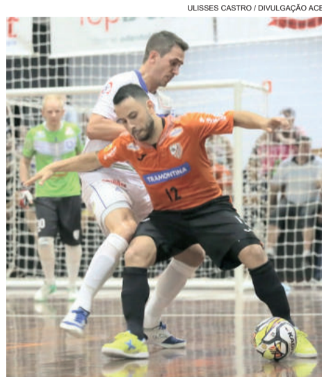
Apesar do empate em Parobé, a ACBF segue líder da Liga Gaúcha

mês de outubro. Na primeira fase, as equipes se enfrentaram em Santa Catarina. Na ocasião, a ACBF venceu o Tubarão por 3x2, na casa do adversário.