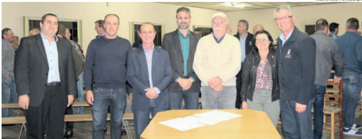
Assinatura contou com a presença de autoridades e representantes da comunidade

Autoridades e representantes das comunidades que serão beneficiadas estiveram presentes du-