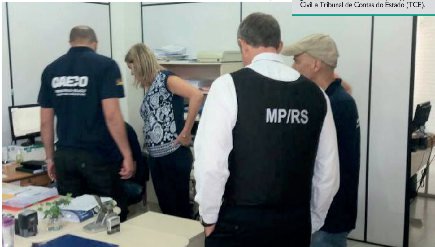
Operação Schmutzige Hände focou o setor de licitações e outras áreas da Prefeitura em 28 de março de 2018