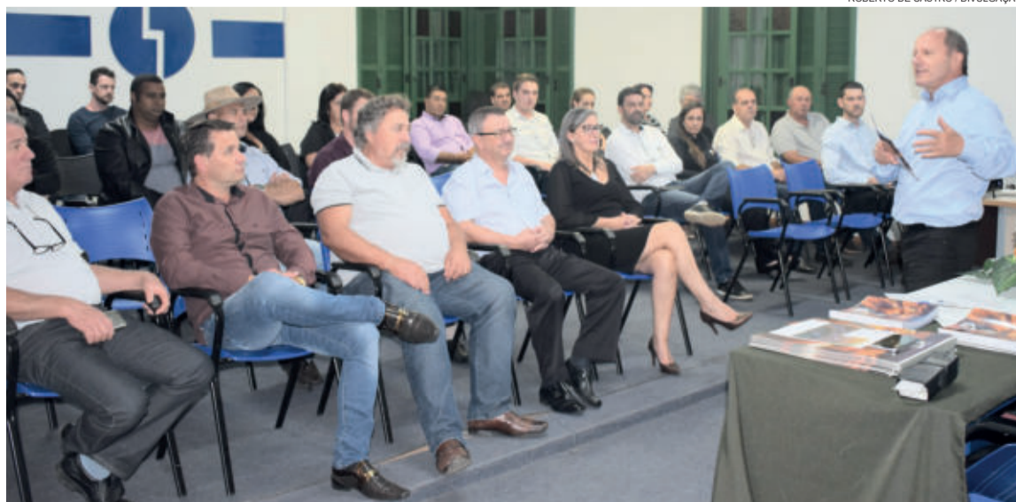
A apresentação foi comemorada com entusiasmo pelos presentes