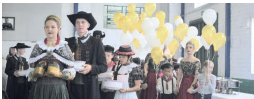
A comunidade westfaliana cantou Parabéns ao município

Além disso, ainda teve uma exposição especial voltada às ex-soberanas do município. Na oportunidade, estiveram expostos os trajes e as fotografias oficiais das cortes. O momento foi marcado por emoção e boas lembranças para aquelas que fazem parte da história do município de Westfália.