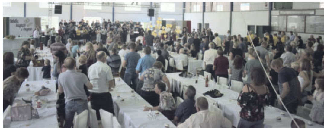
O evento teve um grande público

da Secretaria de Educação, Cultura, Turismo e Desporto (SMEC). A programação de aniversário de Westfália contou ainda com o 13º Encontro de Danças sênior, na quinta-feira (21/03), promovido pelo Grupo de Danças Vergissmeinicht. E também, com o 3º Rodeio Estadual do CTG Querência Westfaliana, que encerrou no domingo (24/03), e marcou a inauguração do Parque de Rodeios do município.