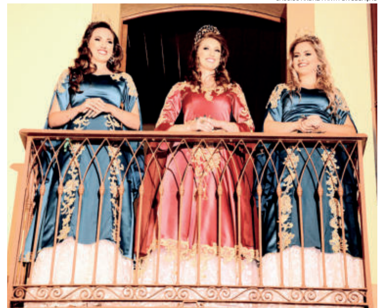
Novo traje foi inspirado em figurinos clássicos da Disney, com referências nas indumentárias do período Medieval e Vitoriano