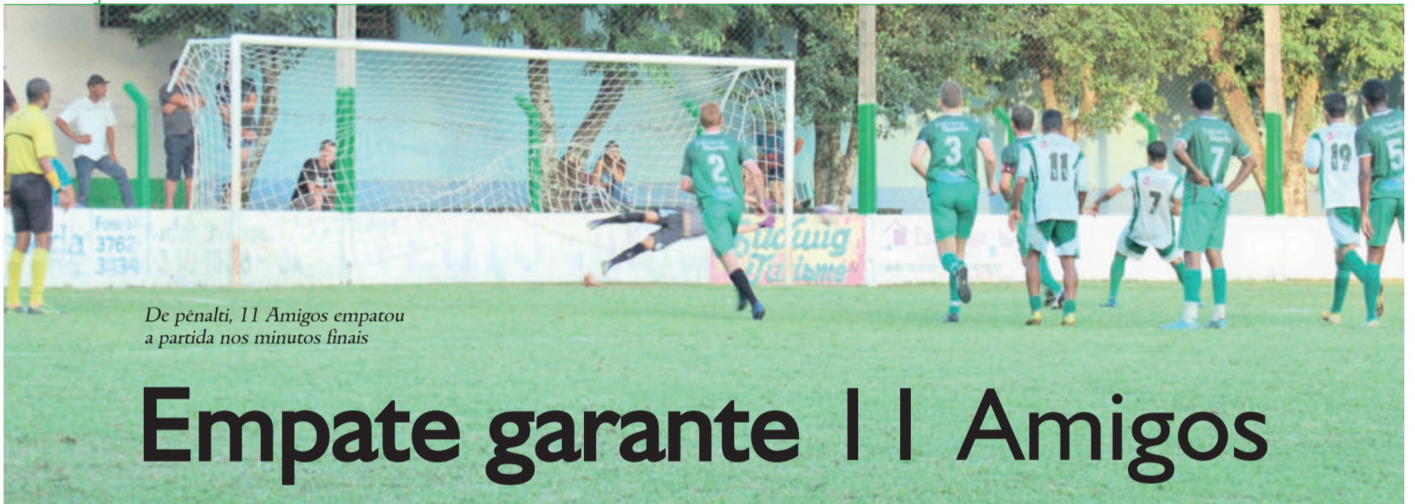
De pênalti, 11 Amigos empatou a partida nos minutos finais