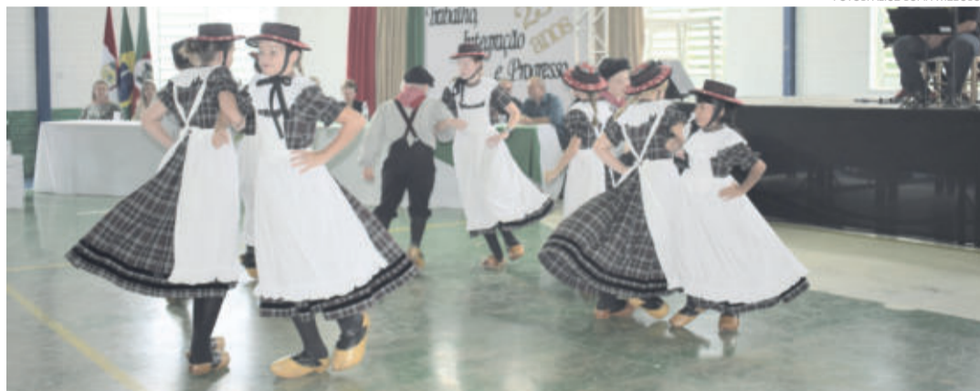
As danças alemãs contagiaram os presentes

A Festa Cultural foi uma realização da Prefeitura Municipal de Westfália, por meio