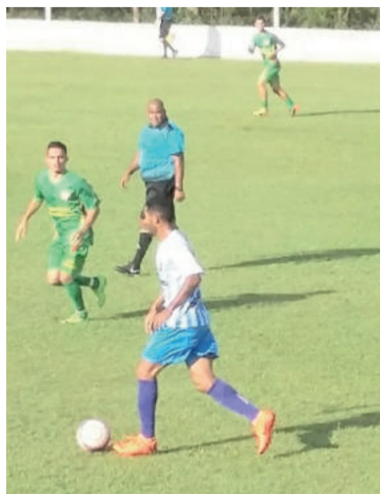
Boa Vista (de branco) vai disputar a Segunda Divisão