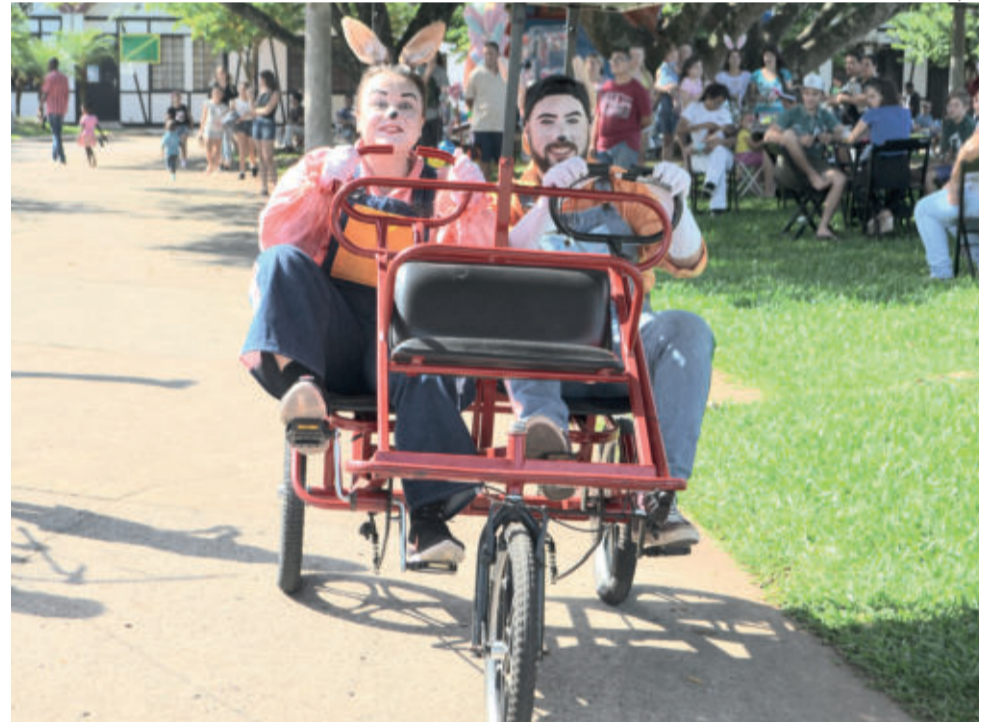
Coelhoha Chefe e Coelho Novato foram atração à parte