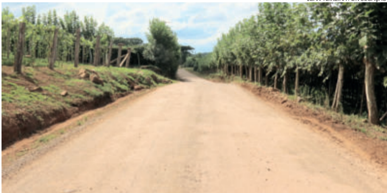
Trecho receberá 772 metros de pavimentação

obra receberá 772 metros de pavimentação asfáltica, concluindo em 100% a ligação com o vale dos vinhedos.