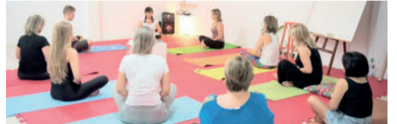
Workshop realizado no ano passado