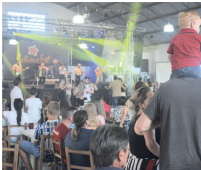
O grupo musical Tchê Guri foi sucesso em apresentação no palco principal