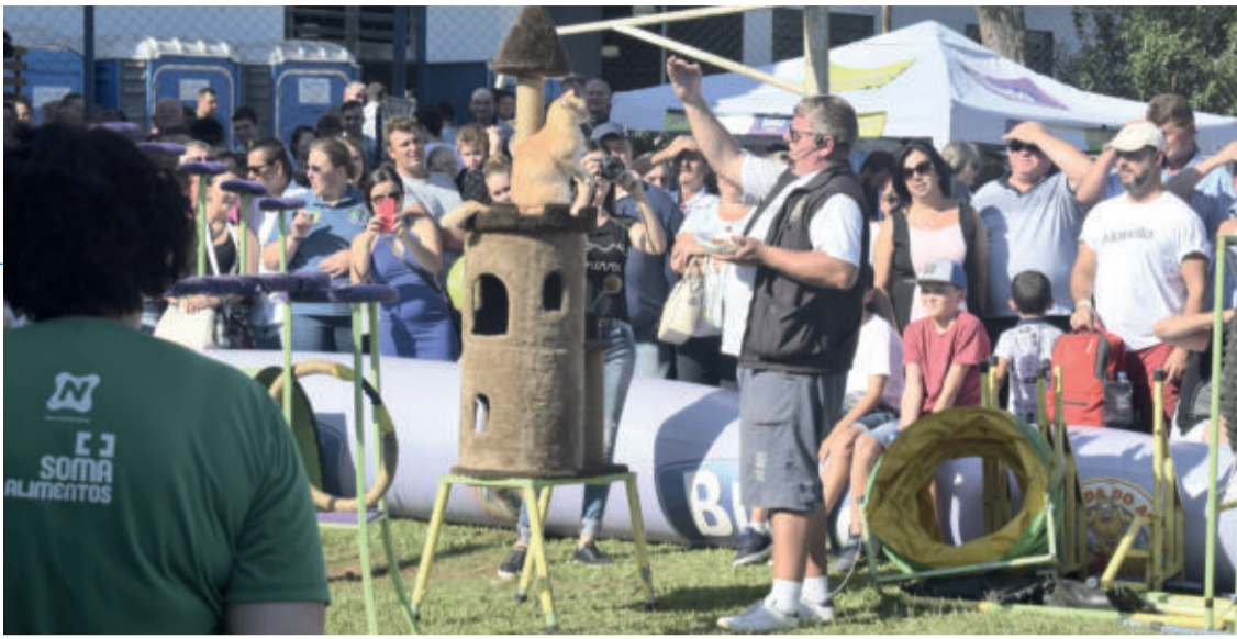
Show de animais adestrados reuniu diversas pessoas na tarde do domingo