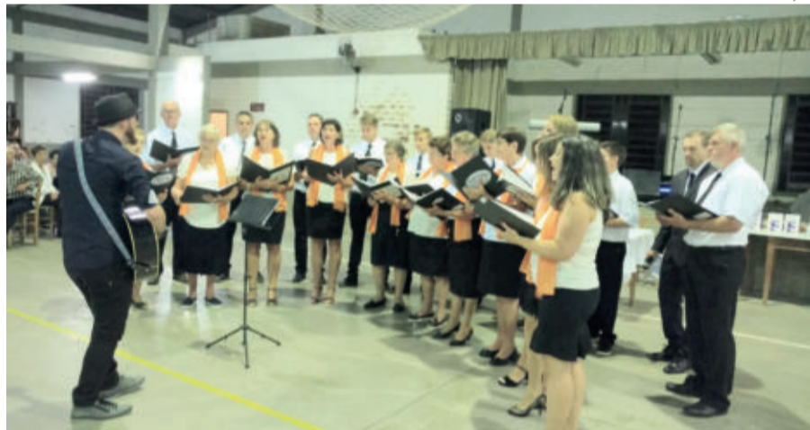
Coral Inovação de Linha Wink