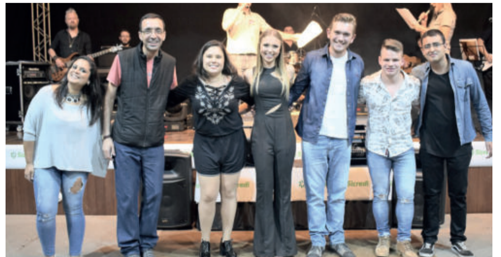
Foram escolhidos sete classificados da categoria livre