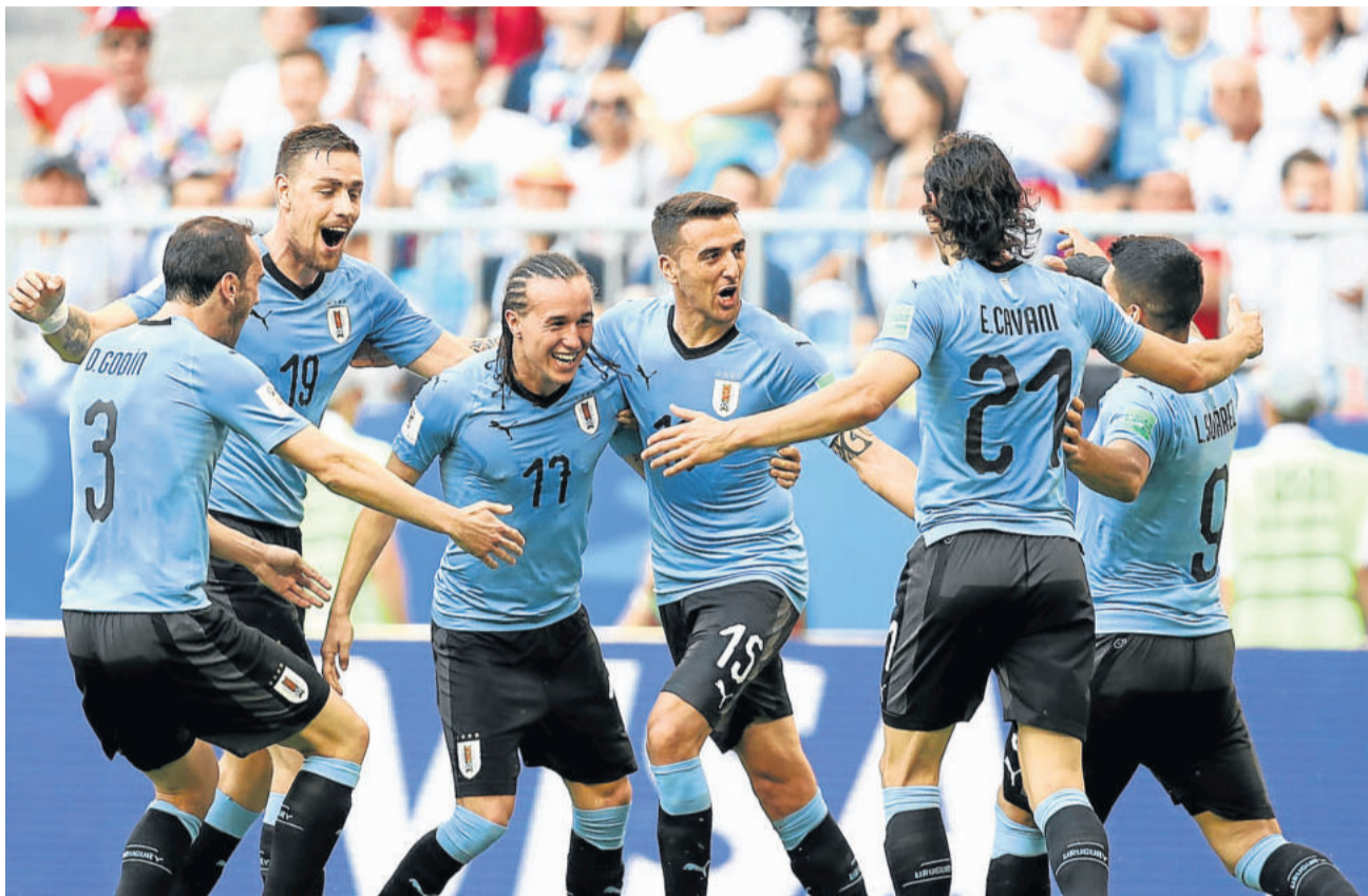
Uruguai comemorou a classificação com 100%