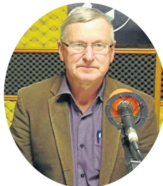
Prefeito Otávio Landmeier afirma querer finalizar a obra antes do final de seu mandato

volvimento da região e também a valorização das áreas no entorno do asfalto. Ele ainda pede a conscientização da pessoa, para que permita a passagem das obras em suas terras “de qualquer forma ela não poderá aproveitar aquele pedaço, pois está em APP”.