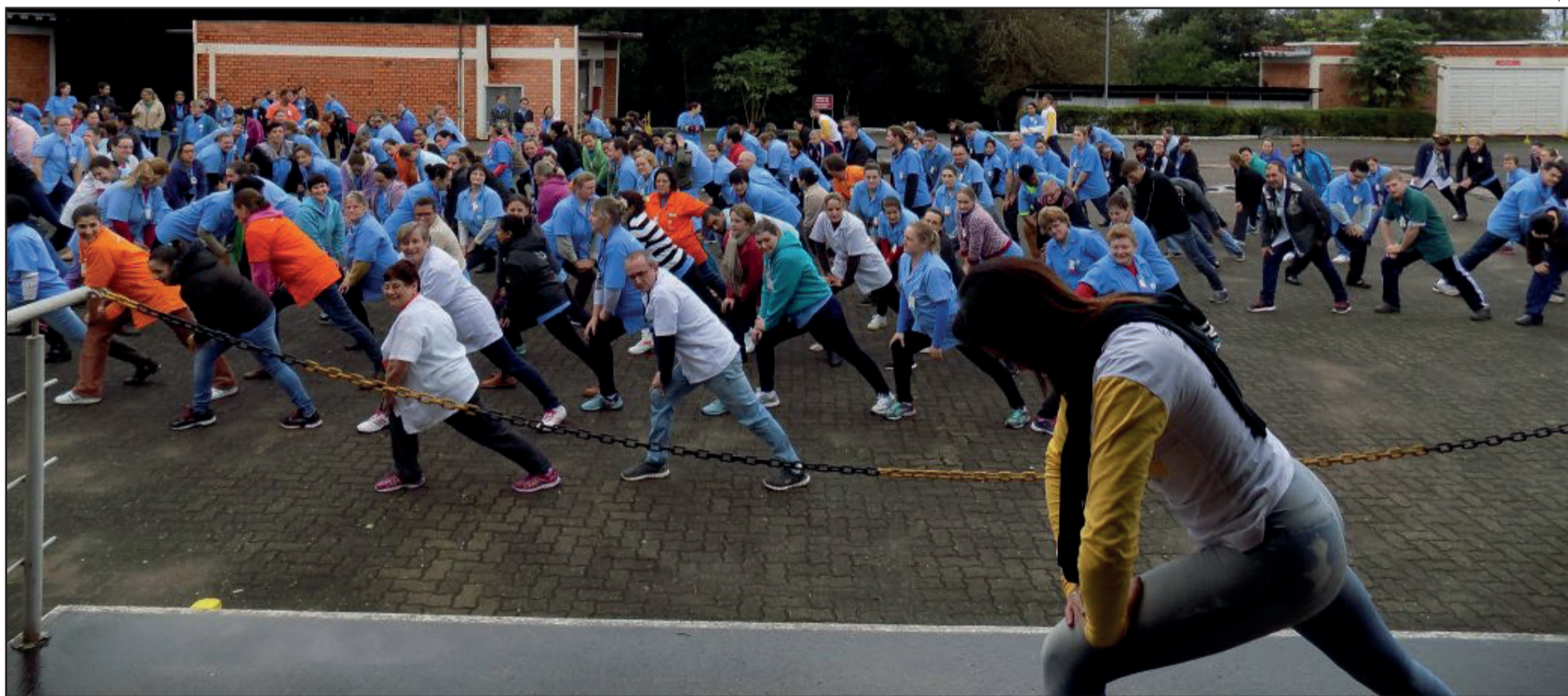
Atividades do Dia do Desafio foram realizadas em empresas de Teutônia em 2017

O Sistema Fecomércio-RS/Sesc em parceria com as prefeituras de 492 cidades gaúchas, realizam nesta quarta-feira (27/06), o Dia do Desafio 2018. Neste dia, toda a comunidade está convidada a realizar por pelo menos 15 minutos consecutivos, qualquer tipo de atividade física. O evento tem como objetivo provocar a reflexão da necessidade de mudar os hábitos para uma vida mais ativa e prazerosa e incentivar as pessoas a saírem do sedentarismo. O Dia do Desafio é realizado sempre na última quarta-feira do mês de maio. Neste ano, em virtude das paralisações que ocorreram no período, a data foi postergada para junho.