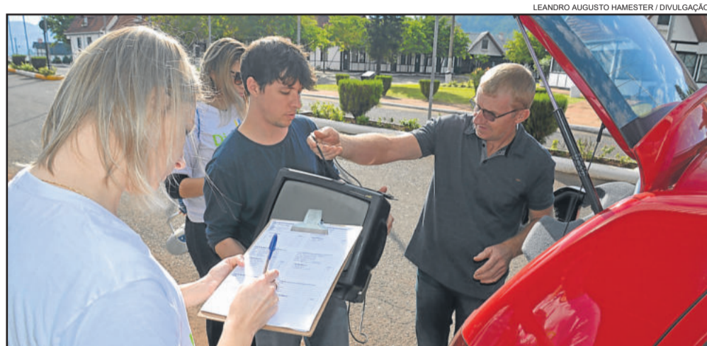
Voluntários receberam materiais em posto de coletas instalado junto ao Pavilhão Multiuso, na Prefeitura de Teutônia

Esta foi a primeira atividade do Revive Boa Vista no ano, que tem por objetivo a preservação do Meio Ambiente e a conscientização da população para cuidados com a natureza e a correta destinação do lixo. Depois dessa, ainda haverá outras iniciativas nestes mesmos moldes nos dias 04 de agosto, no Supermercado Languiru do Bairro Canabarro; 20 de outubro, no Pavilhão Multiuso, juntamente com a tradicional programação do Revive Boa Vista; e 1º de dezembro, novamente no Supermercado Languiru do Bairro Canabarro. Mais informações podem ser obtidas pelo fone (51) 3762-1233 ou pelo e-mail parceirosvoluntarios@cicteutonia.com.br .