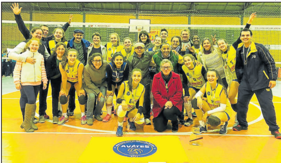
Equipe Infantil comemorou o título da Copa RS