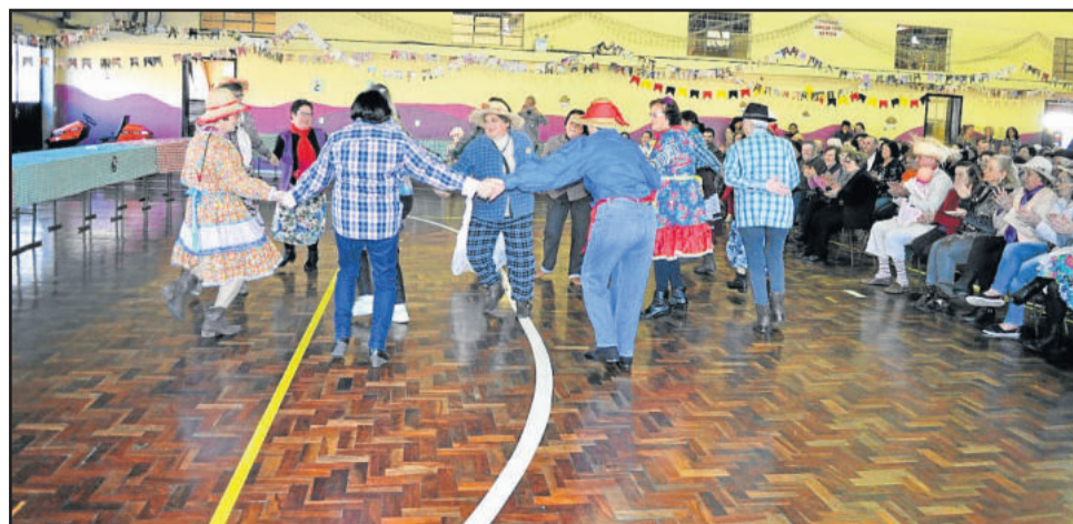
O Grupo de Danças apresentou a dança da quadrilha