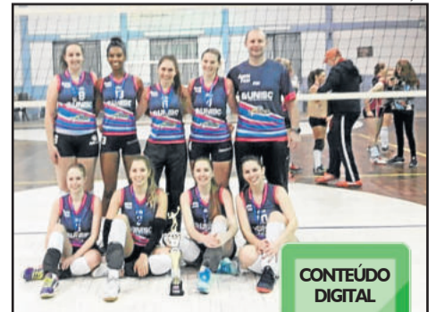
Academia Life Style, de Venâncio Aires, campeã