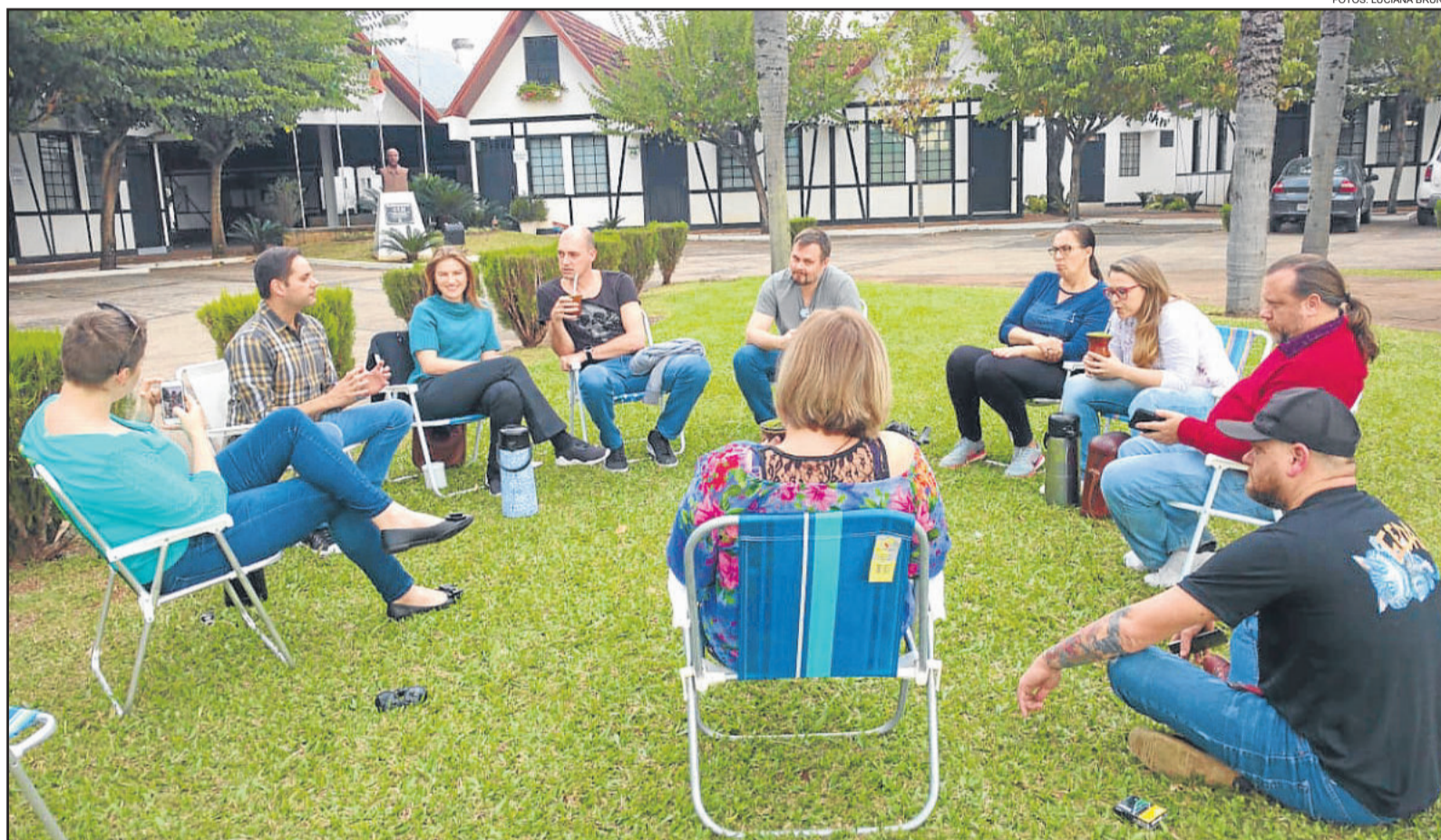
Bate-papo sobre o cenário político brasileiro