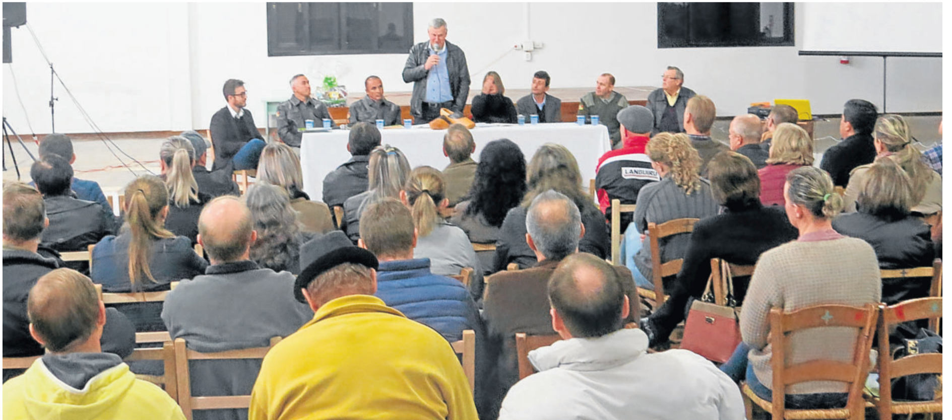
O Sistema de Segurança Integrada com os Municípios visa a instalação de câmeras de videomonitoramento.