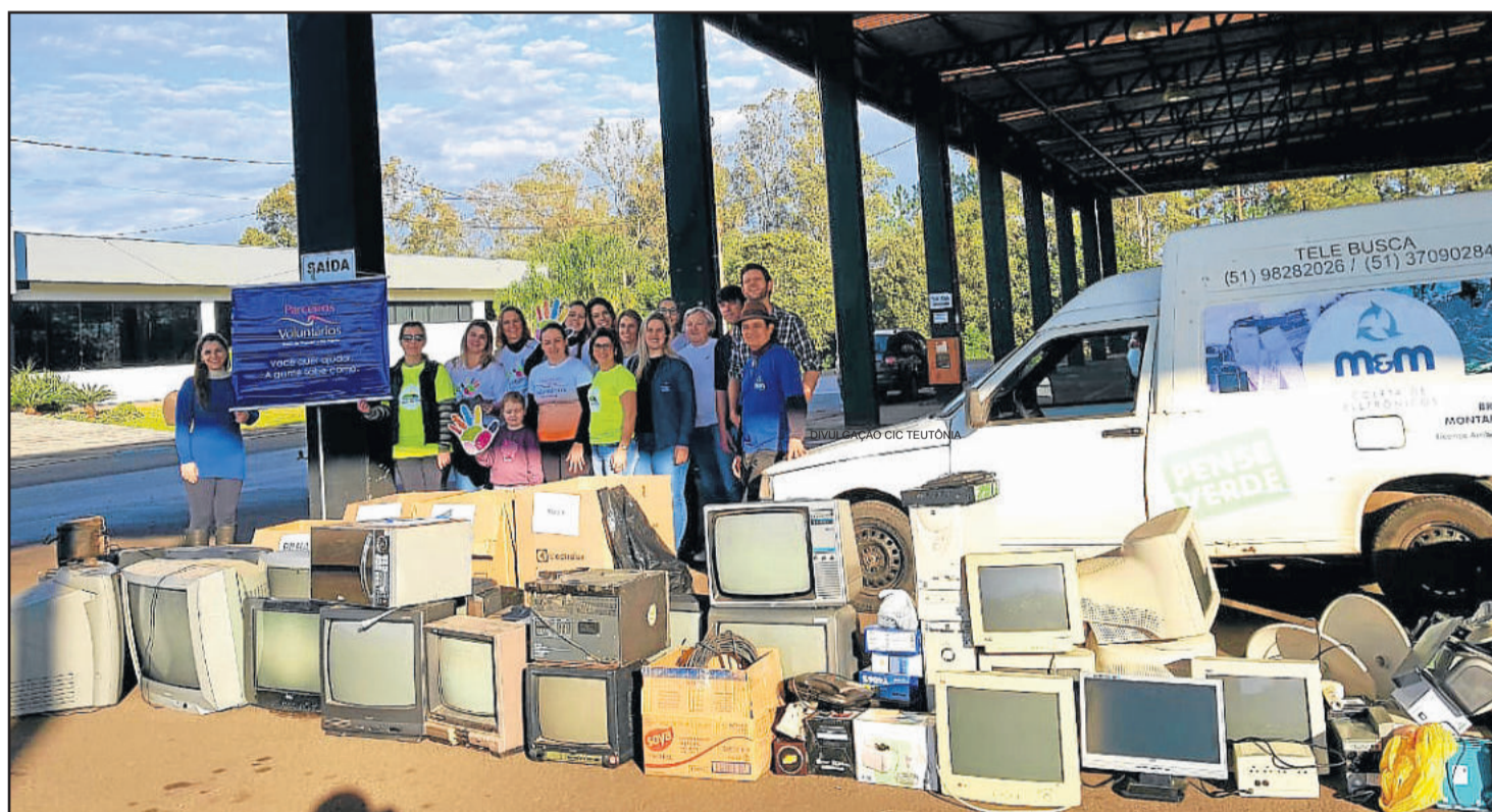
Voluntários coordenaram atividades na manhã de sábado