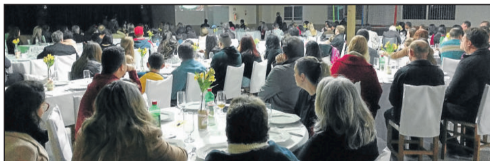
Evento reuniu público para conhecer a ONG

Voluntários também apresentaram relatos sobre os benefícios que tiveram a partir da participação na ação voluntária. Alguns definiram como uma terapia, além da alegria de poder fazer algo pelo próximo e aprender a ajudar outros.