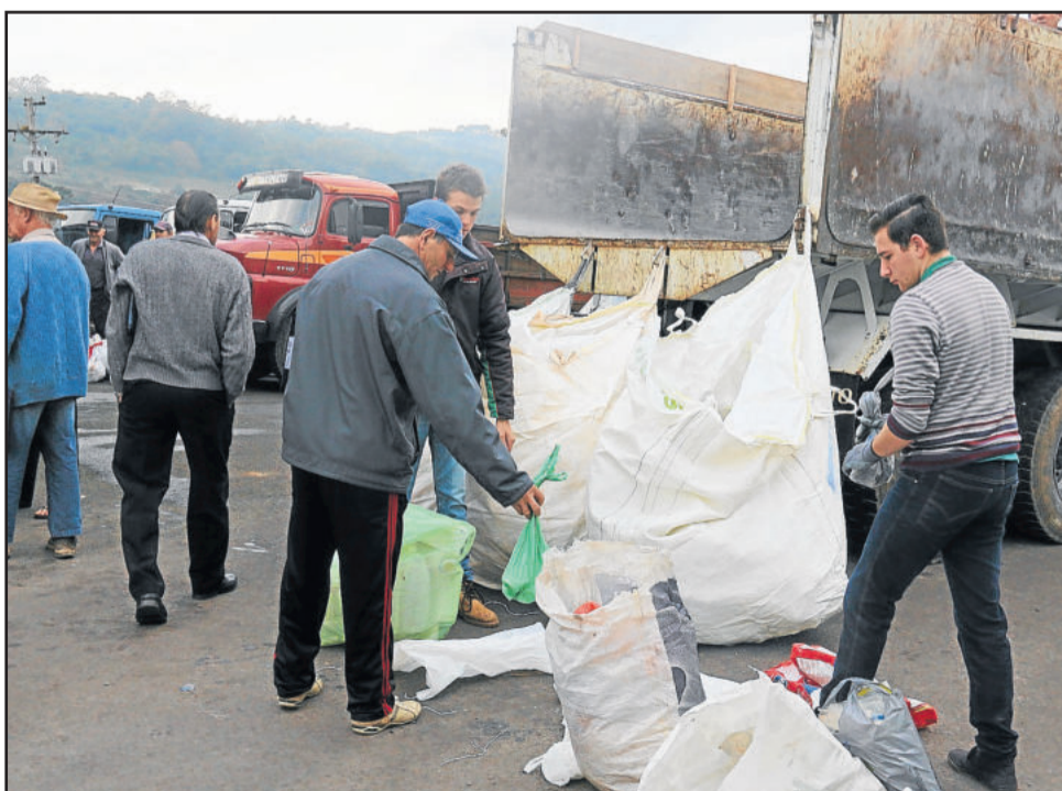
37.709 embalagens de agrotóxicos foram recolhidas