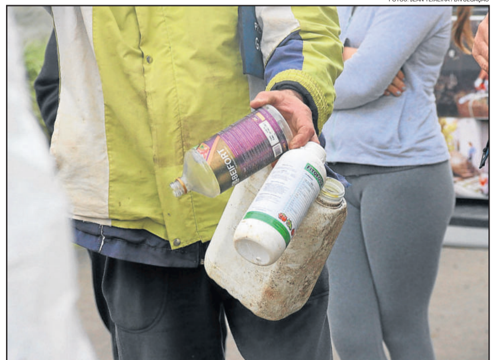
O volume de embalagens recolhidas foi 1,5% inferior a 2017