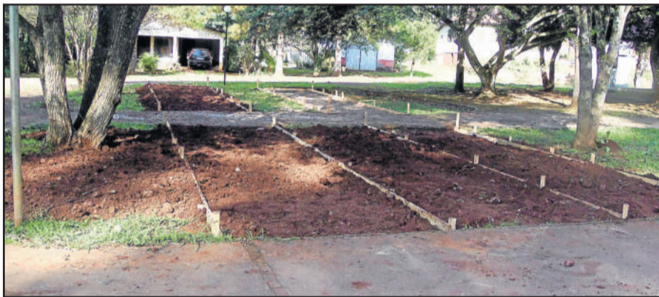
Local onde será construída a academia de Saúde da Cidade Baixa