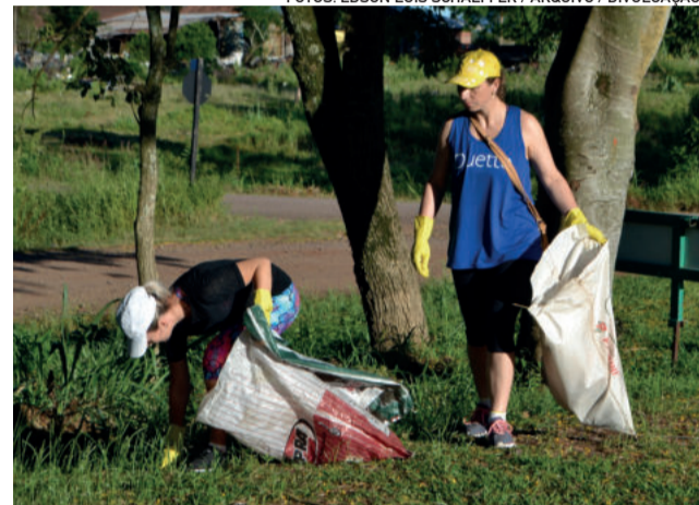
No ano passado, ação ocorreu ao longo das rodovias Via Láctea e Rota do Sol

A Semana da Consciência Limpa é uma realização da Secretaria de Agricultura e Meio Ambiente e do Conselho Municipal de Meio Ambiente. A iniciativa ainda conta com o apoio das secretarias de Educação, de Obras, de Saúde e de Assistência Social e Habitação, além da Vigilância Sanitária.