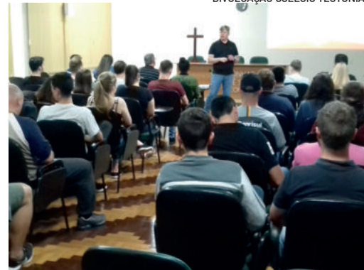
Integralidade física e psicossocial pautou palestra para estudantes da Educação Profissional