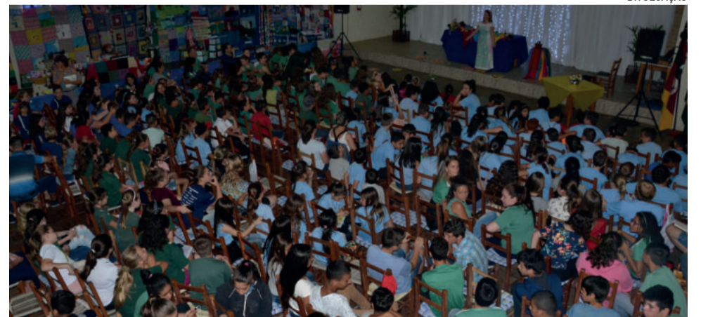
Feira do livro reúne a comunidade em torno da literatura