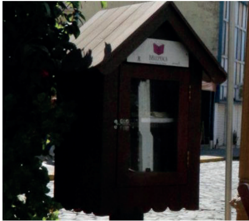
Município conta com três Casinhas Literárias

A reposição dos exemplares nas Bibliopraças está a cargo da Biblioteca Pública Municipal Frei Miguel. Para não esgotar o acervo, a secretária reitera o pedido de doações de obras (com exceção de enciclopédias, que não são comportadas no espaço). A entrega deve ser feita na Biblioteca Pública, que faz a identificação dos livros.