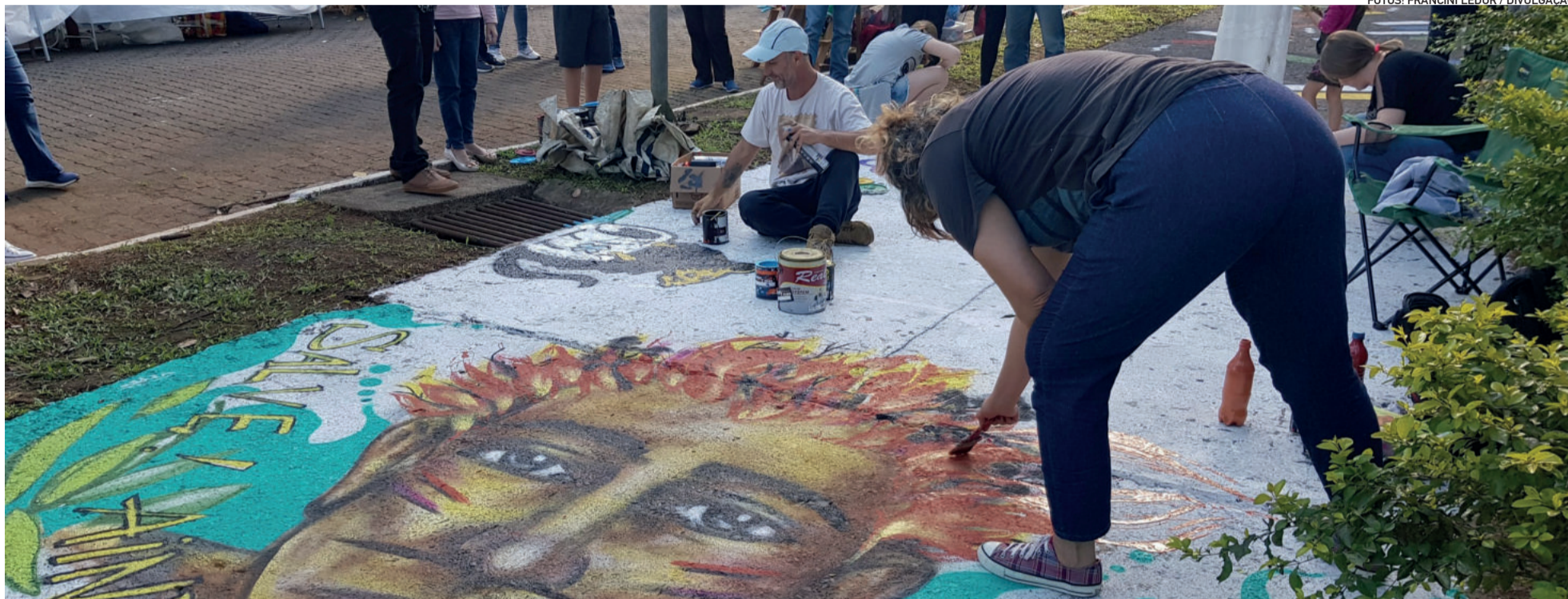
Comunidade ajudou a colorir o espaço