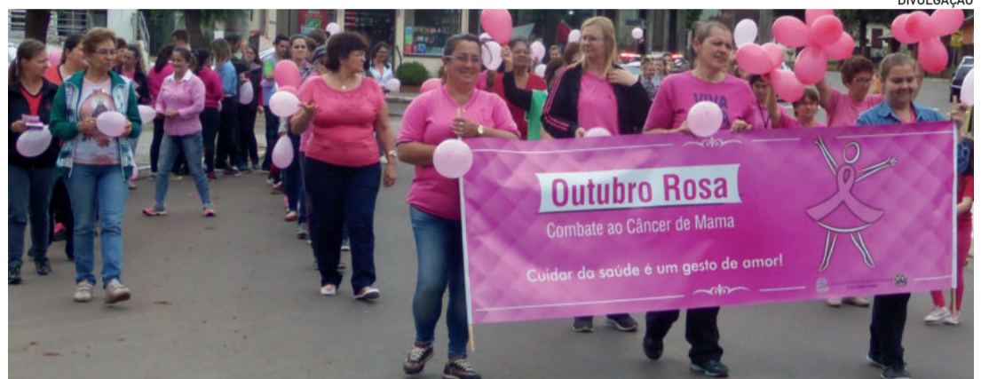
Caminhada Outubro Rosa

A caminhada será acontecerá na Rua 4 de Julho, no dia 7 de outubro, com início às 14h30, partindo da frente da esquina entre as ruas 5 de Março e 4 de Julho.