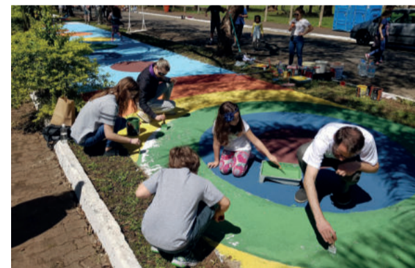
Muita tinta e cor para renovar o valão