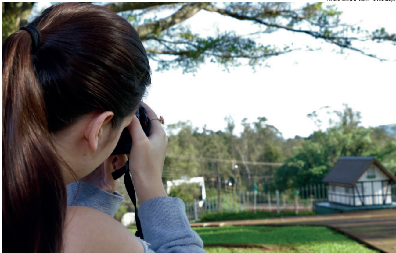
Fotógrafos terão que se inspirar no hino para fazer os seus registros