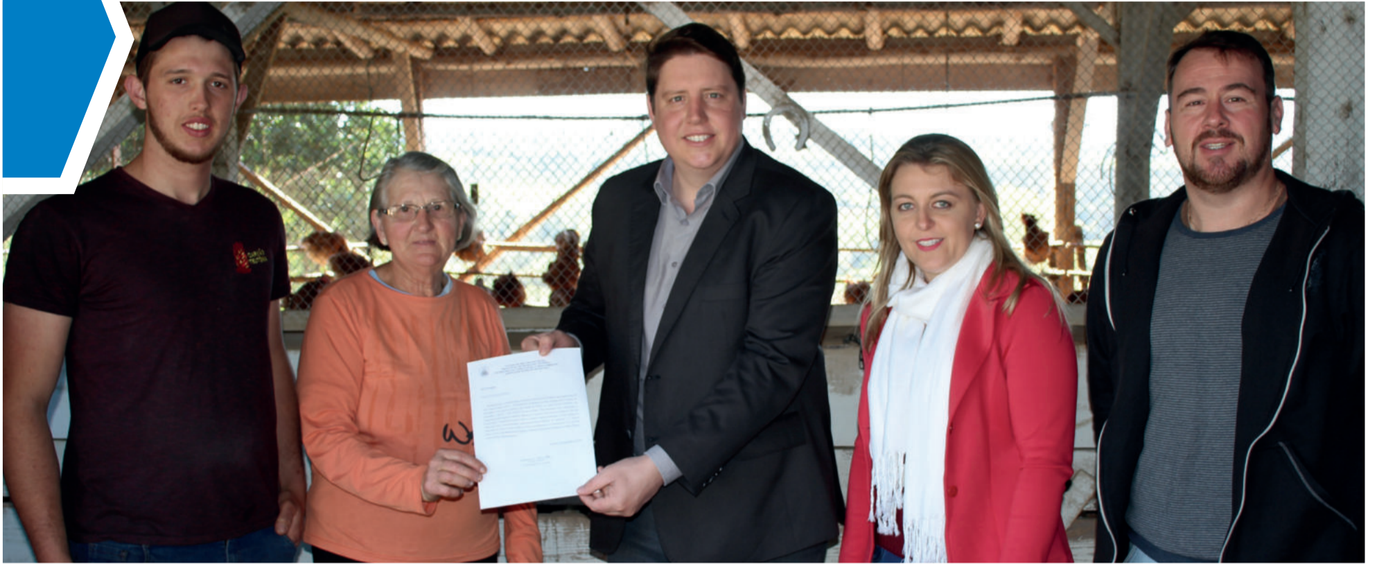
Entrega do ofício que informa a homologação da granja junto ao Susaf ocorreu nesta segunda-feira