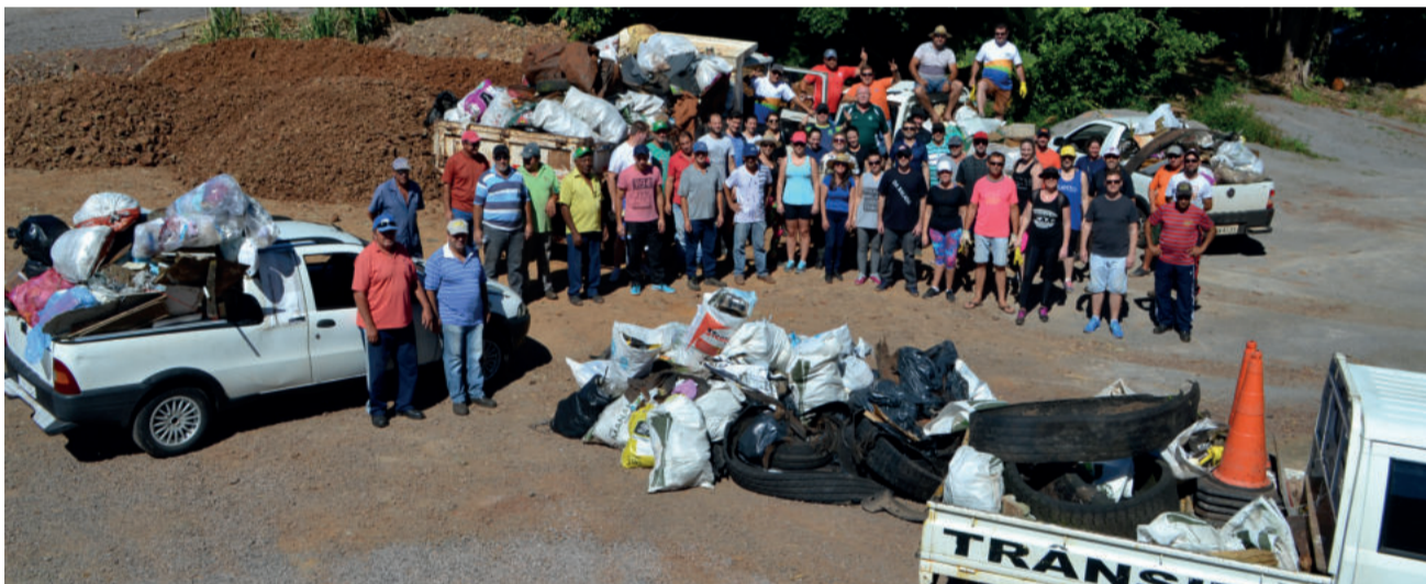
Ano passado, cerca de 10 toneladas de lixo foram recolhidas