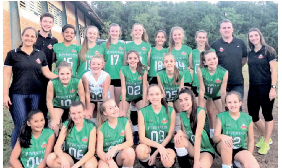
Equipes Mirim e Infantil do Colégio Teutônia/Juventus Voleibol com a comissão técnica