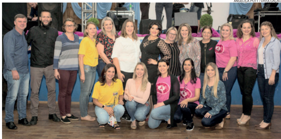
Comissão organizadora do evento junto a palestrante (c)