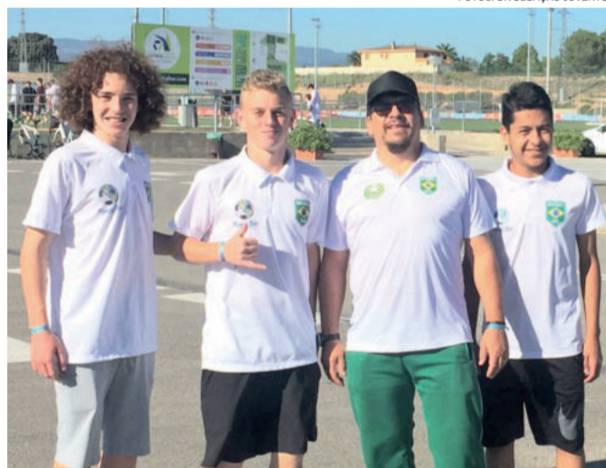
Três garotos da Sub-14 da Juventus integram a equipe Sul do Brasil