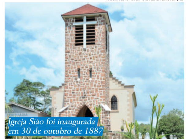
Igreja Sião foi inaugurada em 30 de outubro de 1887

Apresentando diversas peculiaridades, como a torre erguida em pedra grês, a Igreja Evangélica Sião é, até hoje, um dos pontos turísticos mais atrativos de Westfália. Na sua história, está o registro do batismo de Ernesto Geisel, presidente do Brasil na década de 1970.