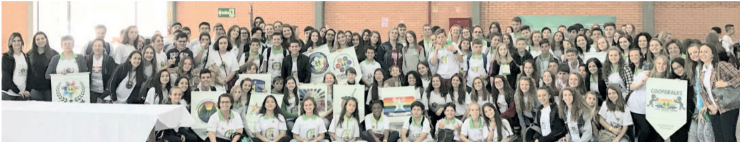
Sicredi Ouro Branco levou 174 jovens de três municípios para o evento