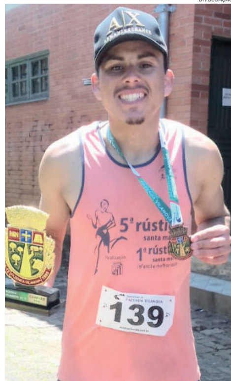
Neybolt saiu com o troféu de campeão