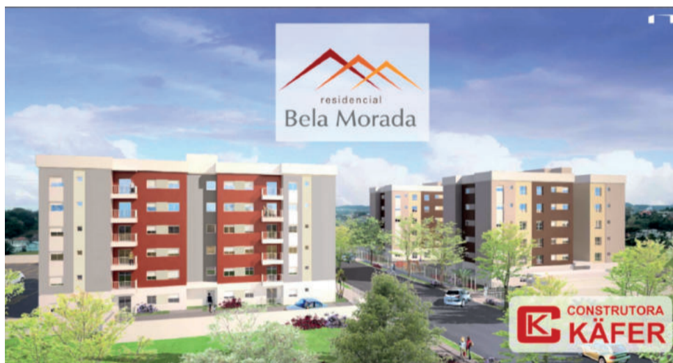
O residencial será construído entre as ruas 21 de abril e José Raimundo Carlotto, no Bairro Navegantes

no Bairro Navegantes e contará com salão de festas, playground, fachadas contemporâneas, elevador, porteiro eletrônico, prevenção contra incêndio e iluminação das circulações por sensor de presença. Conforme destacou o prefeito Evandro Zibetti em suas falas, este é o primeiro empreendimento do Programa Minha Casa Minha Vida, com participação da Administração Municipal, do qual se tem conhecimento, que contará com elevador.