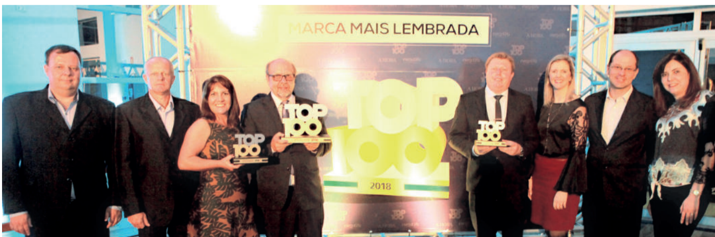
Representantes da Cooperativa Languiru com os três troféus recebidos na noite de 16 de outubro

O levantamento tomou por base extrato do IBGE, que equaciona os públicos conforme idade, renda e densidade demográfica de cada microrregião. Em novembro, durante a Expovale 2018, revista especial apresenta o ranking completo de marcas e personalidades destacadas.