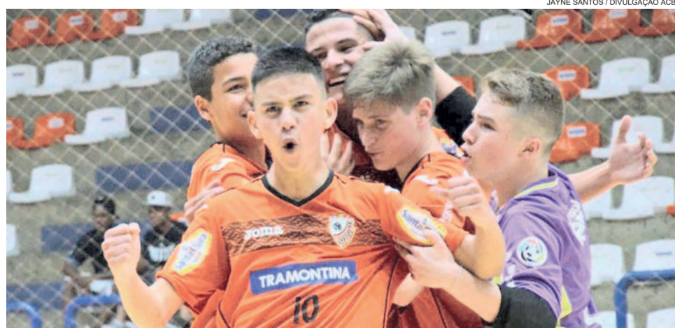
No jogo de ida, as equipes empataram em 3x3

A regra é ir para Santiago com a mesma postura adotada ao longo da temporada para buscar a conquista inédita para o clube. “A expectativa é grande para buscar do primeiro título da categoria para a ACBF. Mas também temos que ter tranquilidade para poder repetir o bom jogo feito aqui e manter o padrão que estamos apresentando no ano todo, corrigindo alguns pequenos detalhes”.