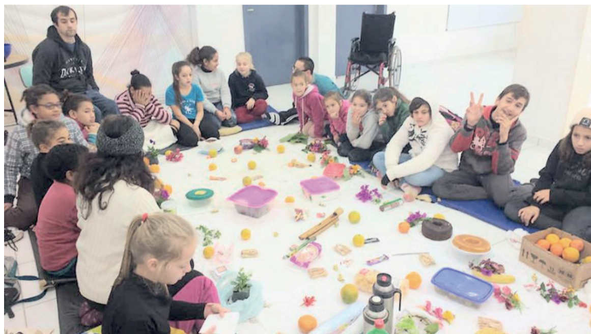
Alunos preparando para o Sat Chakra

- Etapa 1: Workshop Índia: palestra com apresentação de fotos e vídeos das viagens à Índia em 2004, 2012, 2015, 2017. A programação contou com recepção, documentário, montagem do