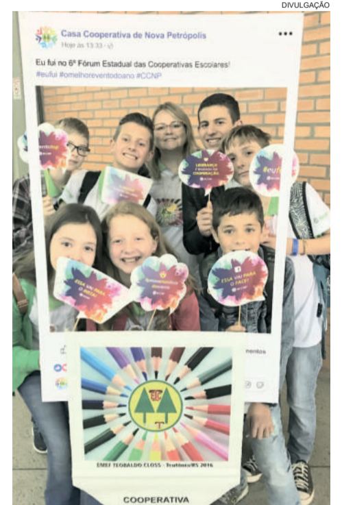
Foram diferentes momentos vivenciados e compartilhados pelos jovens