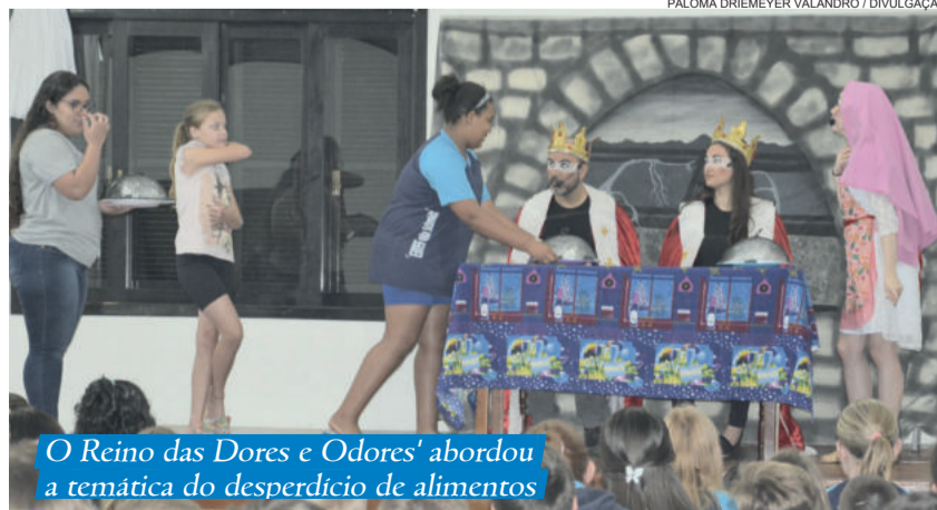
O Reino das Dores e Odores' abordou a temática do desperdício de alimentos

A 8ª Semana da Alimentação e 9ª Semana da Saúde Bucal foi uma realização da Administração Municipal de Westfália, através da Secretaria de Educação, Cultura, Turismo e Desporto e da Secretaria de Saúde, Trabalho, Habitação e Assistência Social.