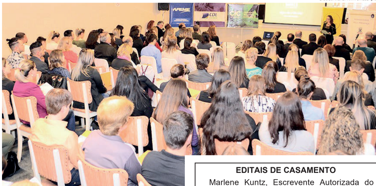
Mais de 100 pessoas foram recepcionadas no Hotel Casacurta