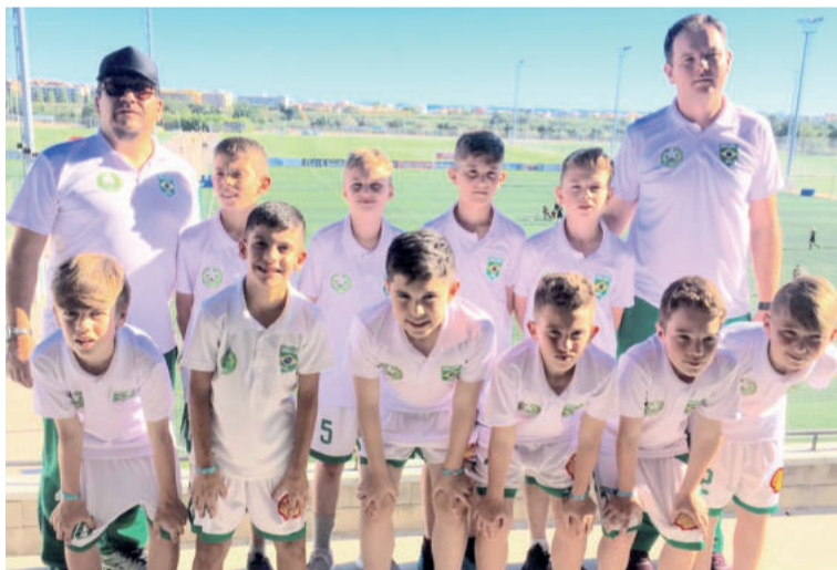
Equipe Sub-11 da Juventus está na Espanha para torneio de futebol