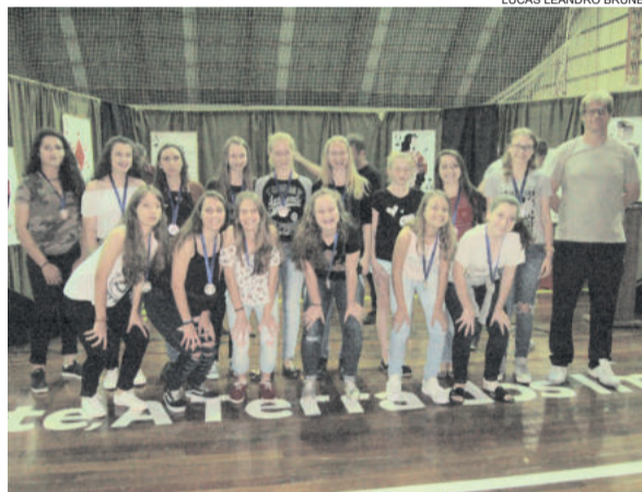
Equipe feminina de Imigrante foi vice-campeã regional no Bom de Bola