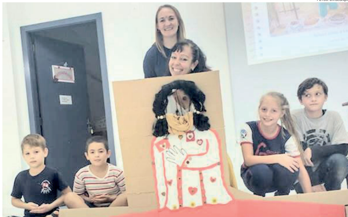
Painel com uma boneca desenhada em espacate e sem rosto foi uma das atrações