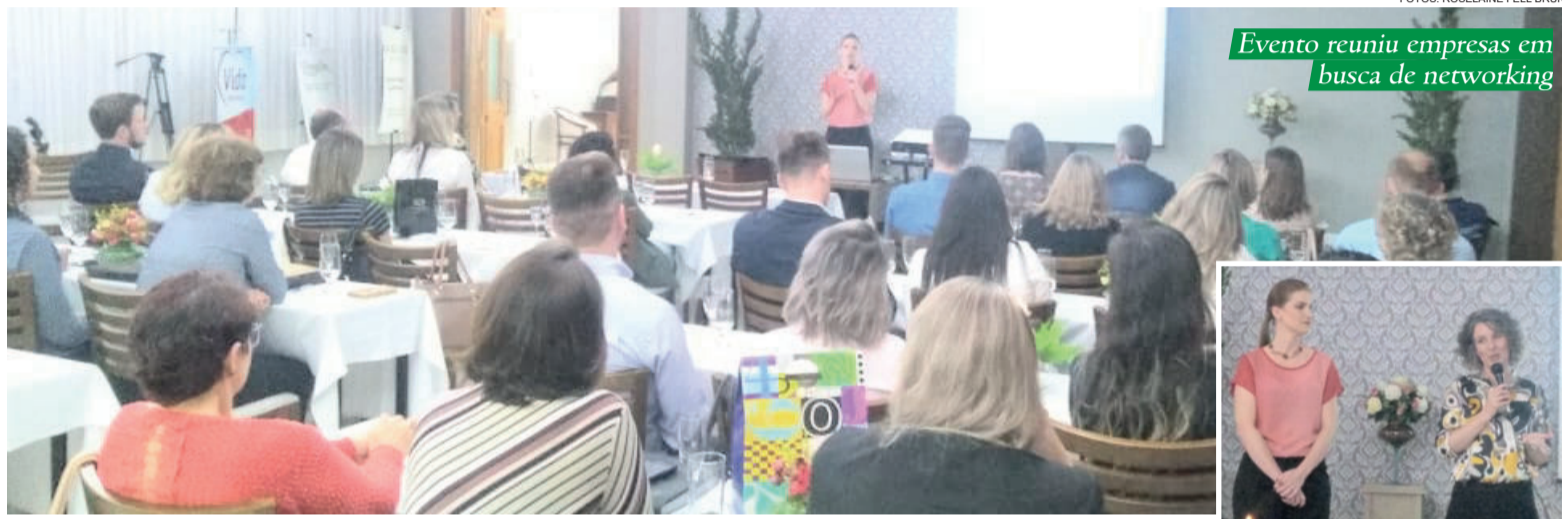
Evento reuniu empresas em busca de networking

Somente uma empresa de cada setor tem a oportunidade de participar da noite, justamente para que todas possam se conectar, fechar parcerias e negócios. Cada empresário falou por um minuto, apresentando sua empresa e oportunidades de negócio. Também teve tempo e espaço para ne-