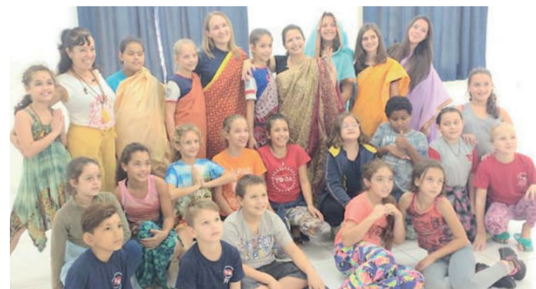
Parte da turma participante do Workshop