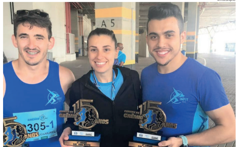
Trio conquistou o terceiro lugar na Corrida do Grêmio