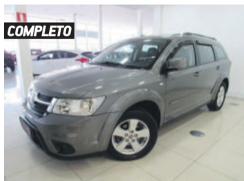
COMPLETO FIAT FREEMONT PRECISION 2.4 16V 2012 CINZA, 4 PORTAS, AUTOMÁTICO, GASOLINA, 94.468KM. R$ 49.990,00