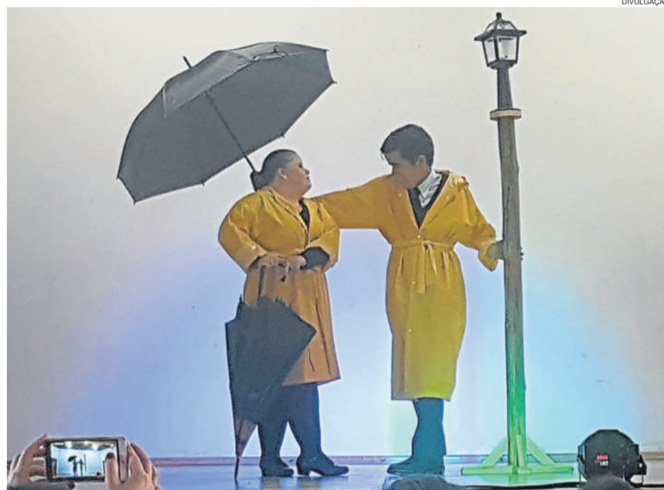
Apae de Teutônia costuma participar do Festival Estadual

O evento é estadual, mas terá a cara de Teutônia, buscando valorizar a cultura local e tradição germânica. "O baile, por exemplo, será em ritmo de oktoberfest, para valorizar a cultura alemã", ressaltam as organizadoras. O acesso ao evento é gratuito.