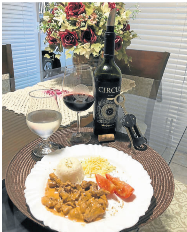
Produções do casal Baukat para harmonização