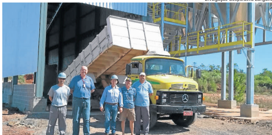
Primeira entrega de grãos de milho ocorreu no dia 09 de abril