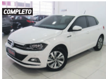
COMPLETO VOLKSWAGEN POLO HIGHLINE 200 1.0 TSI AUTOMÁTICA 2018 BRANCO, 4 PORTAS, AUTOMÁTICO, 33.170KM. R$ 69.900,00