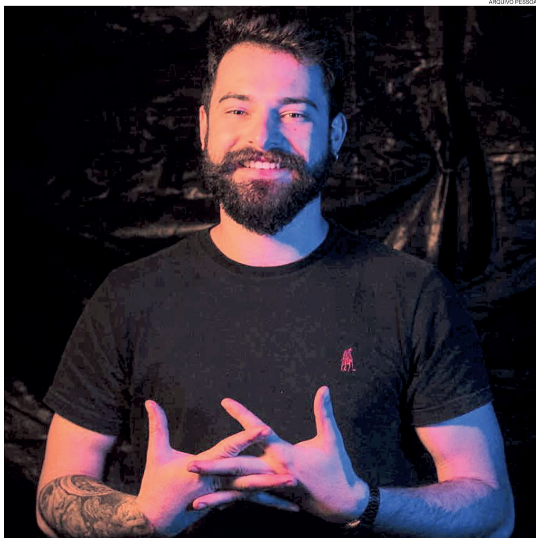
William Perin já tem mais de 60 fotos premiadas em concursos