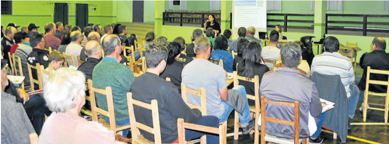
Cerca de 80 moradores participaram da audiência pública