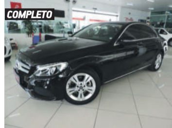
COMPLETO MERCEDES-BENZ C-180 CGI AVANTGARDE 1.6 16V TURBO 2017 PRETO, 4 PORTAS, AUTOMÁTICO, 29.396KM. R$ 125.900,00