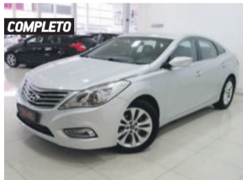
COMPLETO HYUNDAI AZERA GLS 3.0 MPFI V6 24V 2013 PRATA, 4 PORTAS, AUTOMÁTICO, GASOLINA, 85.453KM. R$ 69.900,00