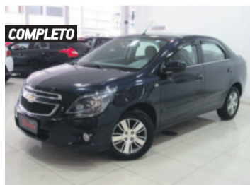
COMPLETO CHEVROLET COBALT LTZ 1.8 8V FLEX 2013 AZUL, 4 PORTAS, AUTOMÁTICO, 85.121KM. R$ 36.900,00