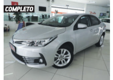
COMPLETO TOYOTA COROLLA XEI 2.0 16V FLEX 2018 PRATA, 4 PORTAS, AUTOMÁTICO, 39.629KM. R$ 89.900,00