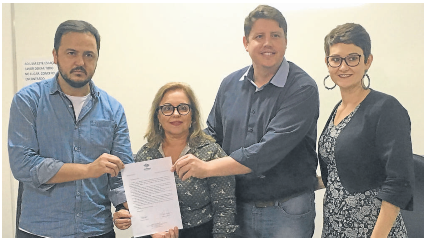
Amvat e Codevat entregaram pleito das telecomunicações ao Procon