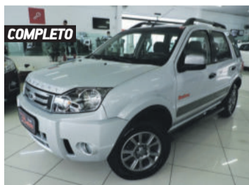
COMPLETO FORD ECOSPORT FREESTYLE PLUS 1.6 FLEX 2012 PRATA, 4 PORTAS, MANUAL, 35.246KM. R$ 37.900,00