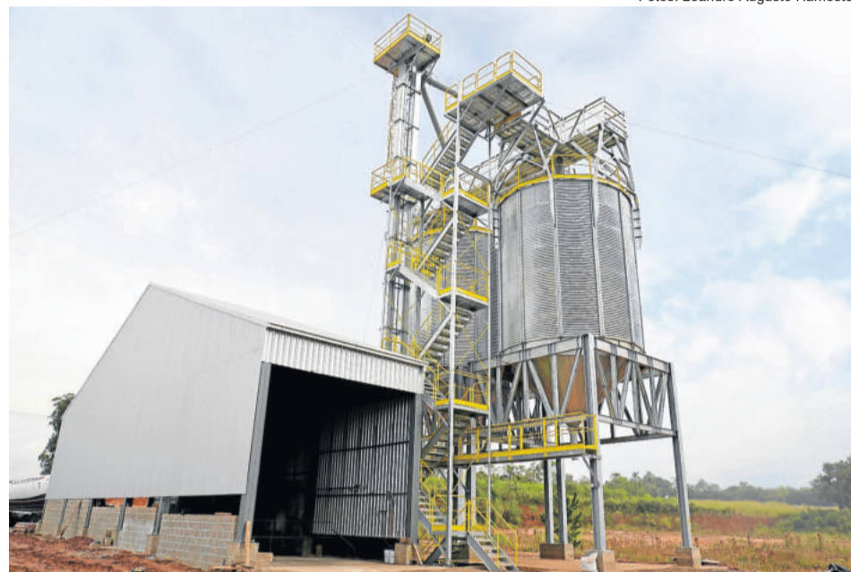
Unidade de Recebimento de Grãos em Venâncio Aires conta com dois silos verticais graneleiros e moega

O fato de ser o primeiro silo instalado junto a uma loja Agrocenter Languiru também facilita o acesso dos produtores ao portfólio da unidade de varejo. "Na entrega da safra o produtor