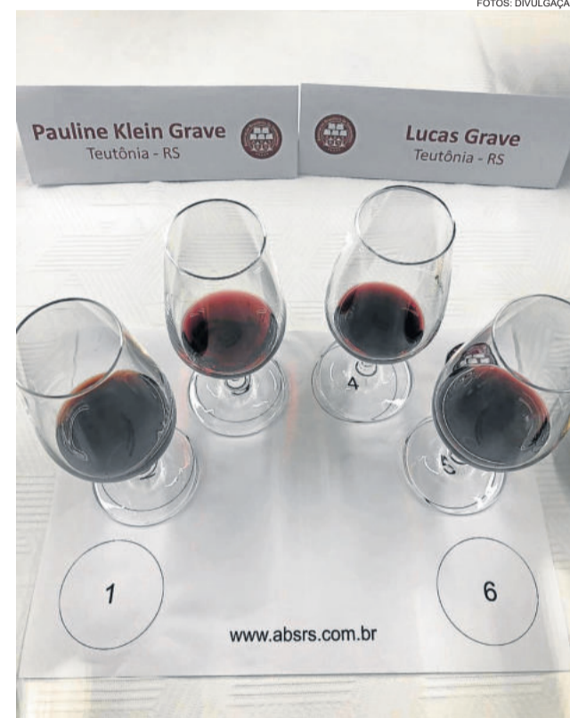
Pauline e Lucas estão realizando o curso de sommelier