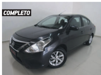
COMPLETO NISSAN VERSA SV 1.6 16V FLEX 2018 CINZA, 4 PORTAS, AUTOMÁTICO, 36.536KM. R$ 49.900,00