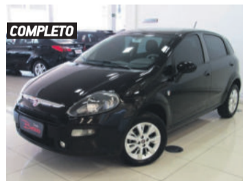
COMPLETO FIAT PUNTO ATTRACTIVE 1.4 FLEX 2017 PRETO, 4 PORTAS, MANUAL, 14.210KM. R$ 44.900,00