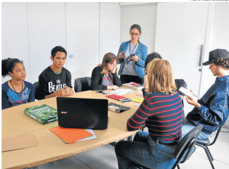
A oficina reuniu seis jovens de Carlos Barbosa

Fanzines ou zines são publicações autorais produzidas na maioria das vezes de forma artesanal, aliando o recorte e colagem de imagens à produção textual do seu autor, sempre com o objetivo de trazer uma reflexão sobre o tema abordado.