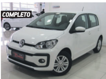
COMPLETO VOLKSWAGEN UP! MOVE 1.0L MPI TOTAL FLEX 2018 BRANCO, 4 PORTAS, MANUAL, 38.565KM. R$ 43.900,00