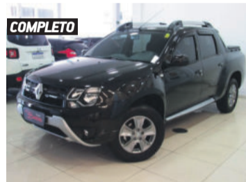
COMPLETO RENAULT DUSTER OROCH DYNAMIQUE 1.6 16V 2017 PRETO, 4 PORTAS, MANUAL, 24.287KM. R$ 62.900,00