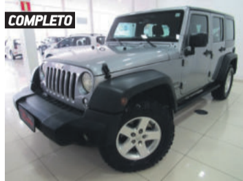
COMPLETO JEEP WRANGLER SPORT UNLIMITED 4X4 CAPOTA DUPLA 3.6 V6 2015 PRATA, 4 PORTAS, AUTOMÁTICO, GASOLINA, 62.272KM. R$ 139.900,00