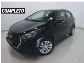
COMPLETO HYUNDAI HB20 COMFORT PLUS 1.6 FLEX 2018 PRETO, 4 PORTAS, AUTOMÁTICO, 36.901KM. R$ 51.900,00