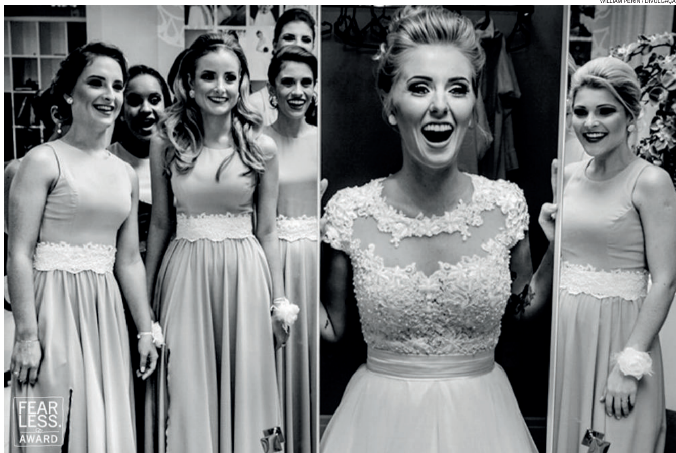
Foto premiada no concurso Fearless