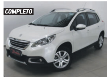
COMPLETO PEUGEOT 2008 ALLURE 1.6 16V FLEX. 2017 BRANCO, 4 PORTAS, AUTOMÁTICO, 48.629KM. R$ 53.990,00