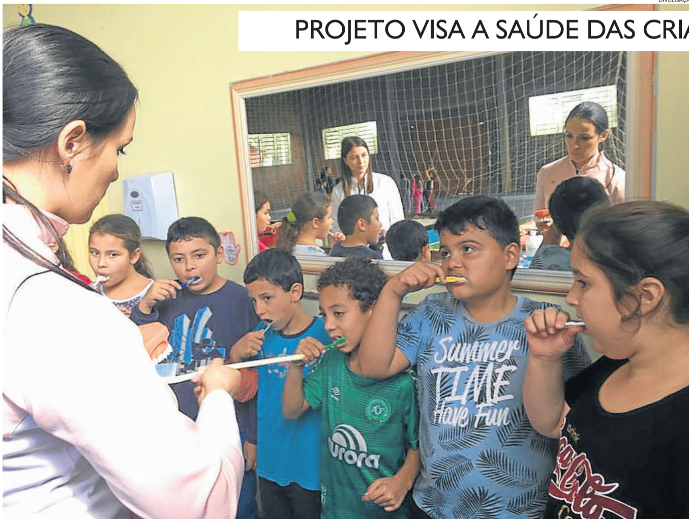
Os alunos recebem informações para fazer a higiene bucal em casa