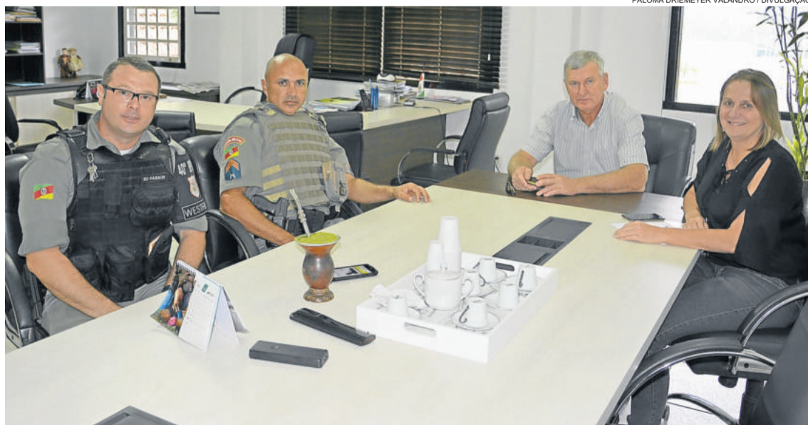
Foram apresentadas ações preventivas realizadas e outras sugeridas

O Conselho Municipal dos Direitos da Criança e do Adolescente (COMDICA) de Westfália comunica que foram prorrogadas até o dia 07 de maio (terça-feira) as inscrições para vagas de conselheiros tutelares. Mais informações podem ser obtidas no site e mural da Prefeitura Municipal. As eleições estão previstas para o mês de outubro.