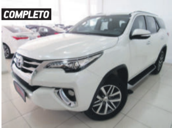
COMPLETO TOYOTA HILUX SW4 SRX AT 5 LUGARES 2.8L 16V TURBO INTERCOOLER 2016 BRANCO, 4 PORTAS, AUTOMÁTICO, DIESEL, 63.294KM. R$ 204.900,00