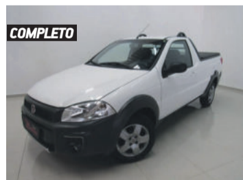
COMPLETO FIAT STRADA HARD WORKING 1.4 EVO FLEX 2017 BRANCO, 2 PORTAS, MANUAL, 53.252KM. R$ 36.900,00