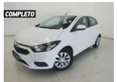
COMPLETO CHEVROLET ONIX LT 1.4 MPFI 8V 2018 BRANCO, 4 PORTAS, MANUAL, 31.624KM. R$ 43.900,00