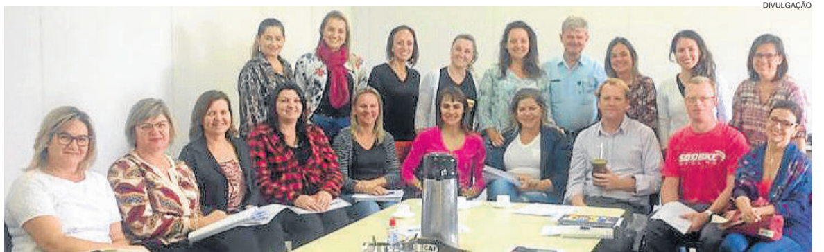
Reunião da Smed tratou da questão territorial do RCG e formação da comissão

O documento está dividido em cinco cadernos: Educação Infantil,