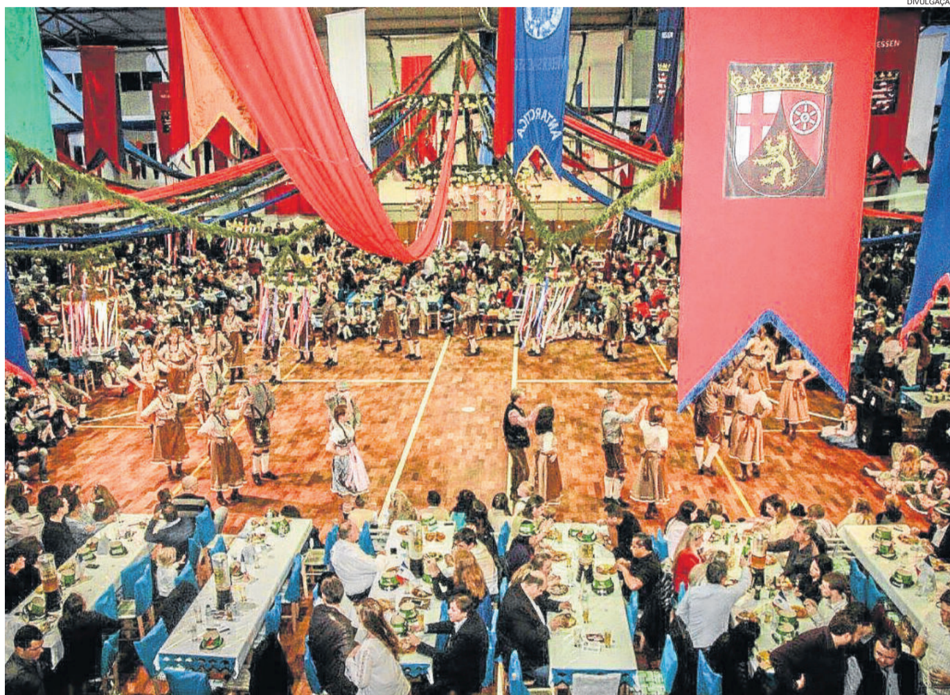
Ingressos para os bailes já estão à venda

27 de abril – 9h, no calçadão, divulgação com entrega de brindes, folders e adesivos 4 de maio – Desfile típico dos Grupos Folclóricos 18 de maio – 1º Baile Típico, 20h, Centro Comunitário Cristo Rei 19 de maio – 1º Café Colonial, 15h, Centro Comunitário Cristo Rei 22 de maio – 25ª Festa do Idoso, 9h, Centro Comunitário Cristo Rei 23 de maio – 13ª Festa das Apaes, 14h, Centro Comunitário Cristo Rei 25 de maio – 2º Baile Típico, 20h, Centro Comunitário Cristo Rei 26 de maio – 2º Café Colonial, 15h, Centro Comunitário Cristo Rei