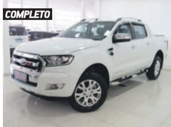
COMPLETO FORD RANGER LIMITED 4X4 CD 3.2 2017 BRANCO, 4 PORTAS, AUTOMÁTICO, DIESEL, 35.598KM. R$ 148.900,00