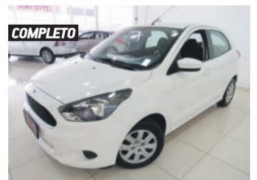
COMPLETO FORD KA SE PLUS 1.0 2015 BRANCO, 4 PORTAS, MANUAL, 66.089KM. R$ 34.900,00