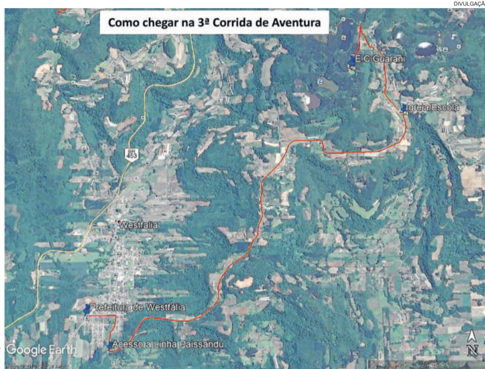
O ponto de encontro será no Esporte Clube Guarani, em Linha Paissandu

A comissão organizadora da 3ª Corrida de Aventura disponibilizou um mapa orientador para os atletas vindos de fora. Ainda assim, o trajeto até o Esporte Clube Guarani também estará devidamente sinalizado com placas indicativas. A organização recomenda que os participantes cheguem cedo para se organizarem. No ponto de encontro, serão repassadas informações sobre as provas, bem como esclarecidas todas as dúvidas.