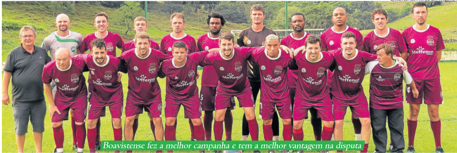
Boavistense fez a melhor campanha e tem a melhor vantagem na disputa