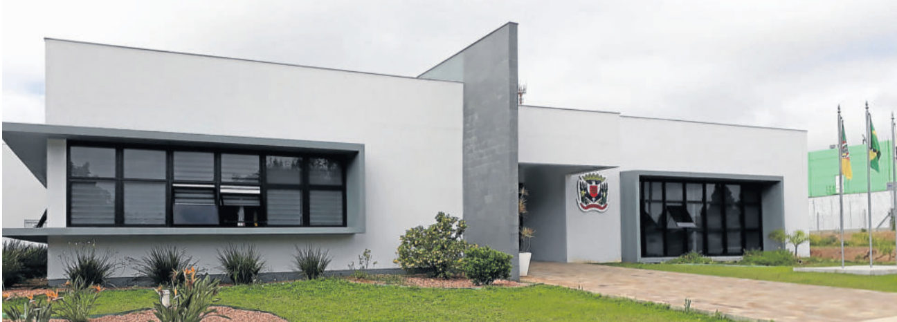
Podem ser calculados valores em aberto até 31 de dezembro de 2018