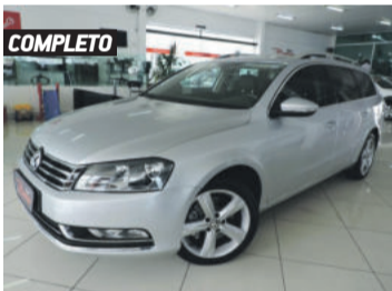
COMPLETO VOLKSWAGEN PASSAT VARIANT 2.0 TSI 16V 211CV 2014 PRATA, 4 PORTAS, AUTOMÁTICO, GASOLINA, 89.224KM. R$ 74.900,00