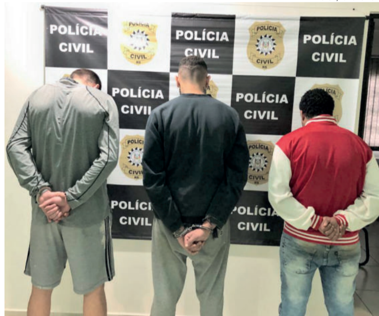
Quadrilha presa nesta sexta-feira em Teutônia