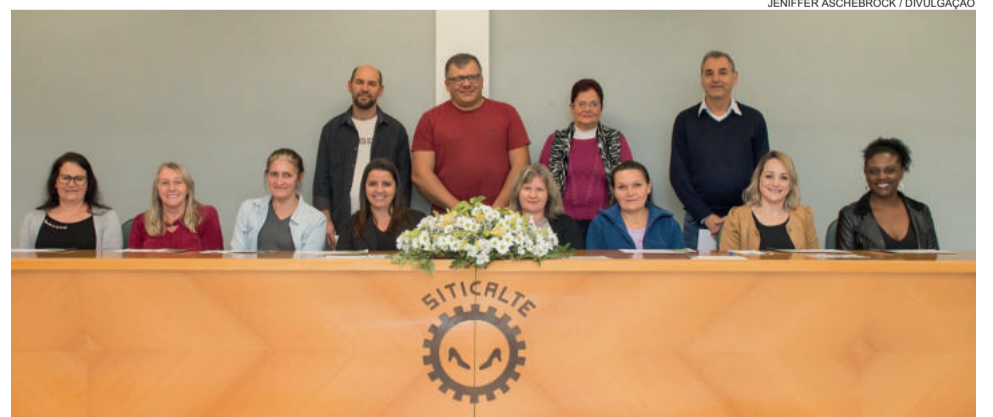
Homenageados com 21 anos de associação