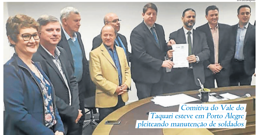
Comitiva do Vale do Taquari esteve em Porto Alegre pleiteando manutenção de soldados