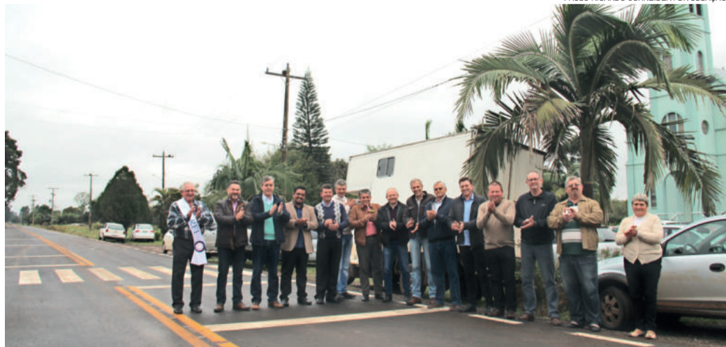
Autoridades na estrada asfaltada, em frente à comunidade de Arroio do Ouro