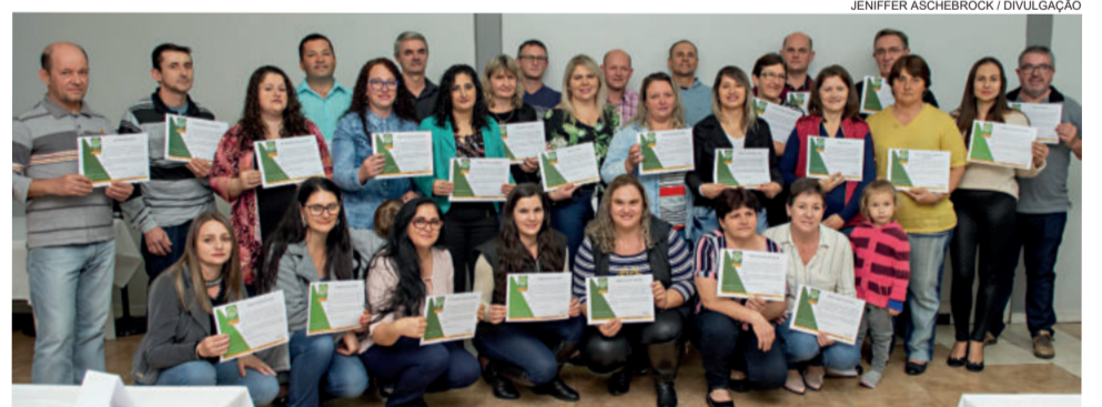
Homenageados com 23 anos de associação