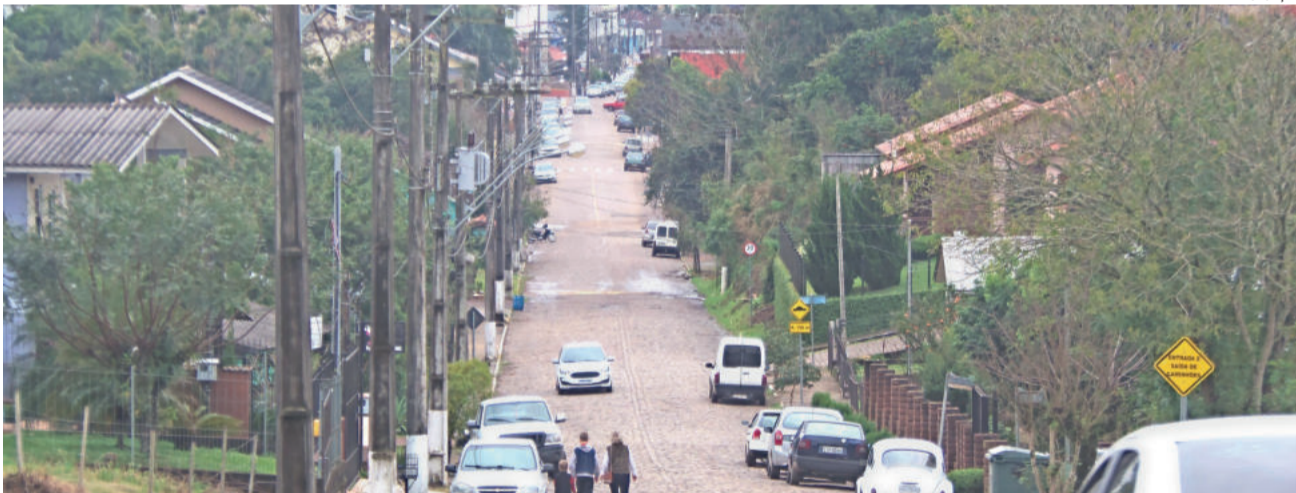
Ao todo, as melhorias terão aporte de R$ 5 milhões