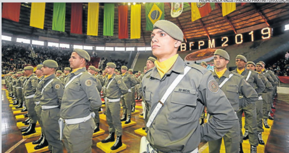
Ontem, 507 novos policiais militares foram graduados em cerimônia no Gigantinho