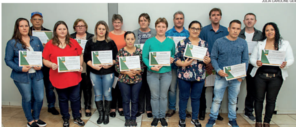
Homenageados com 22 anos de associação