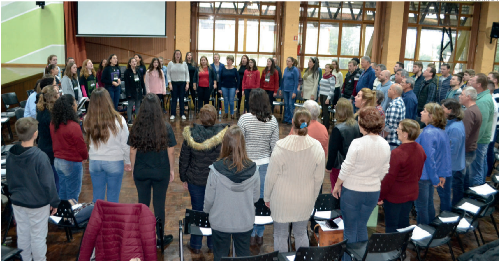
Oficina de Canto Coral foi aberta aos coralistas e regentes de Teutônia