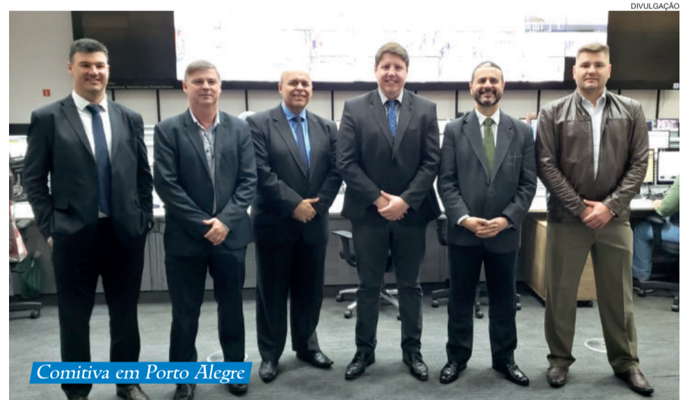
Comitiva em Porto Alegre