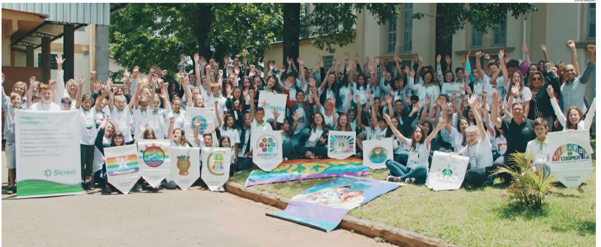
Case Cooperativas Escolares será apresentado na Conferência Mundial

De um total de 11 cases brasileiros que concorrem à premiação no programa World Young Credit Union People (Wycup), três são gaúchos. Sicredi Ouro Branco leva projeto das cooperativas escolares