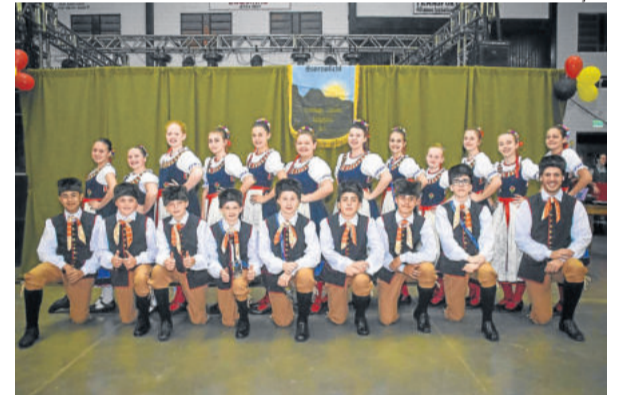
Um das categorias do Grupo de Danças Sonnenlicht, que promoveu o evento