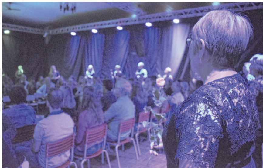
O objetivo é despertar sensações no público

O evento teve o apoio da prefeitura de Imigrante e da Associação Cultural de Imigrante.