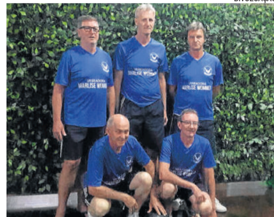
Associação de Bolão Imigrante