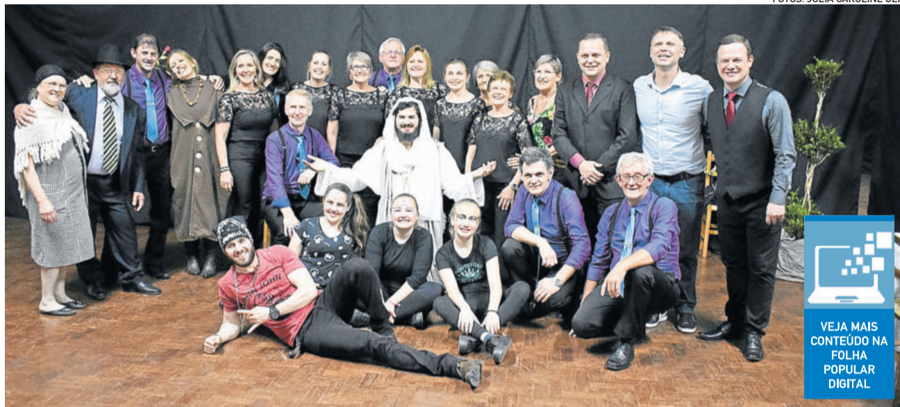
Espetáculo uniu integrantes do Coral Municipal e o Grupo Teatral Façarte e Façarte Júnior