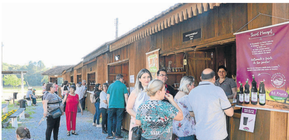
Agroindústrias também foram atração

da Fenachamp se mede pelo número de visitantes, mesmo diante do grande número de dias com chuva que a edição de 2019 enfrentou. Mesmo com mais da metade dos dias com instabilidade do clima, o número de atrações não tirou o ânimo de expositores, organização e de quem vistou a festa.