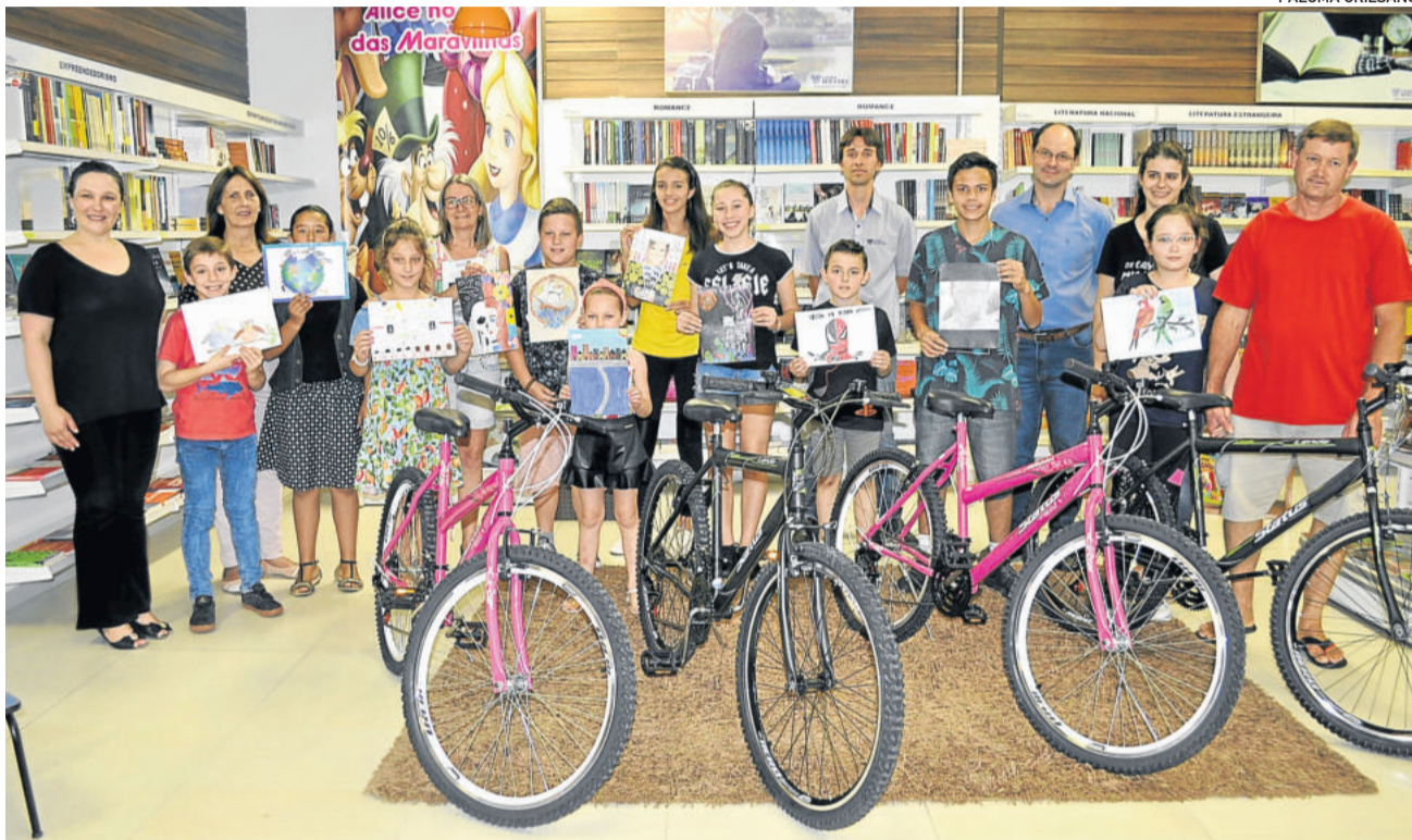
Estudantes receberam premiação do concurso