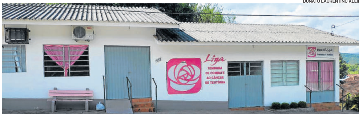
Desde 2015 a sede da Liga fica localizada no antigo Posto de Saúde, no Bairro Teutônia