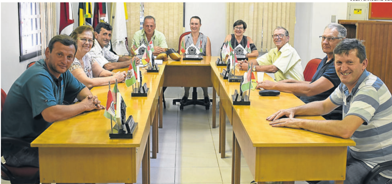
Sessão extraordinária aprovou a ata da sessão anterior