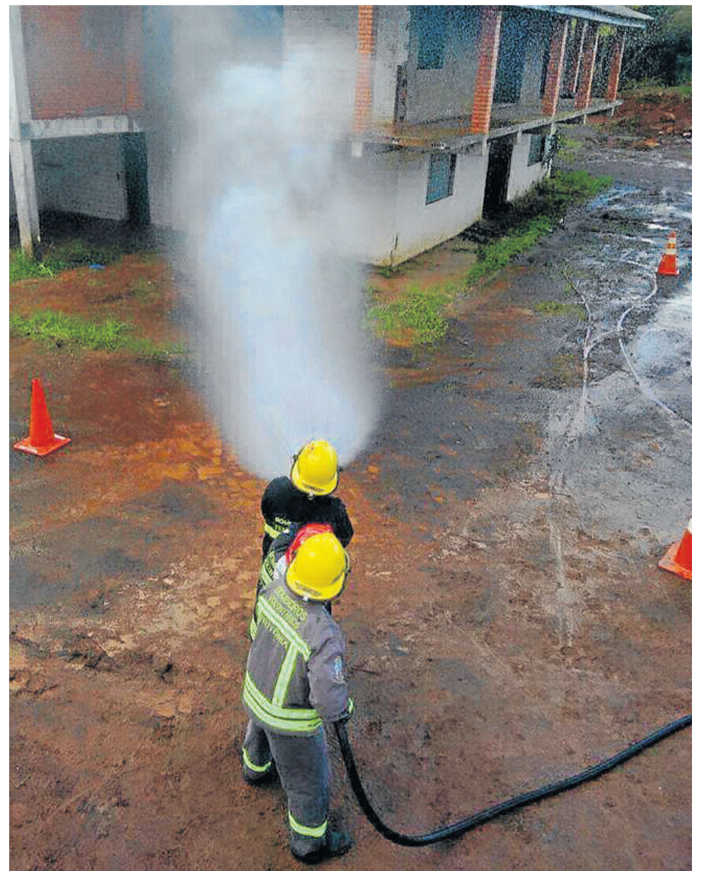
Corpo de Bombeiros Voluntários pode deixar de atender em Teutônia

A nota expõe sua preocupação de que o Corpo de Bombeiros Militar