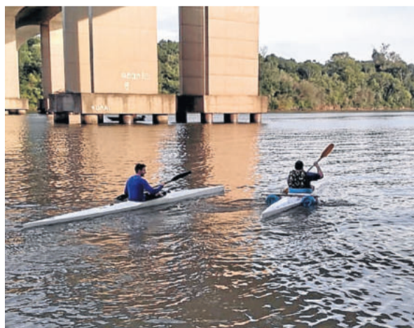
Depois, as aulas práticas acontecem no Rio Taquari