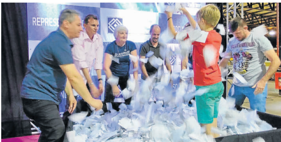
Último sorteio da campanha Natal da Sorte foi realizado no Pavilhão Multiuso