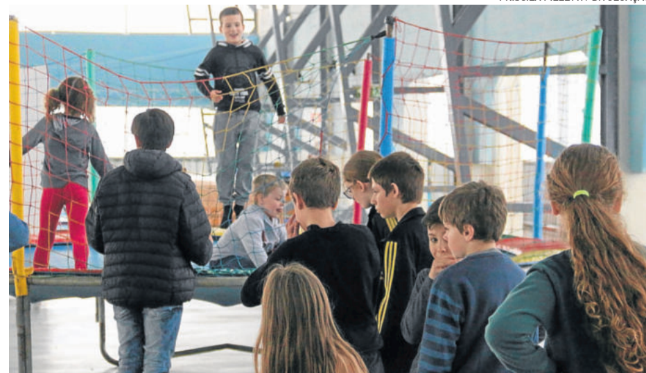
Brinquedos são oferecidos durante as férias