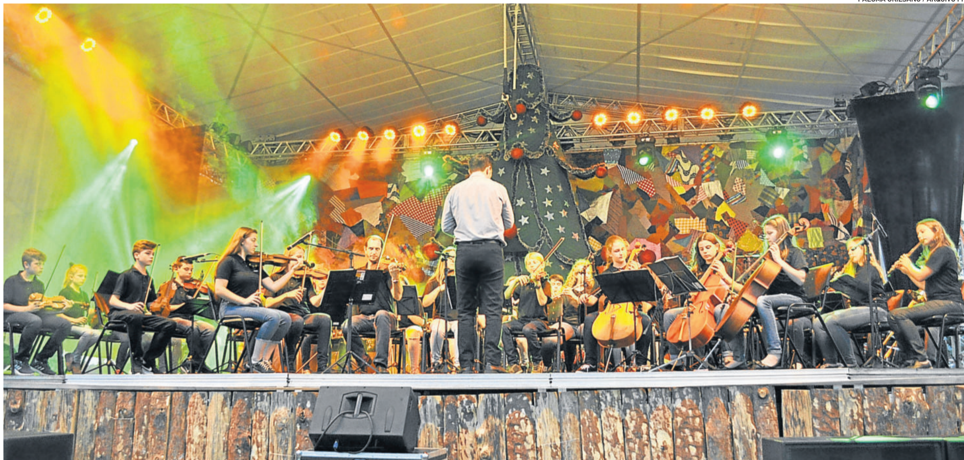
Conjunto Instrumental do CT vai levar sua música para a Europa