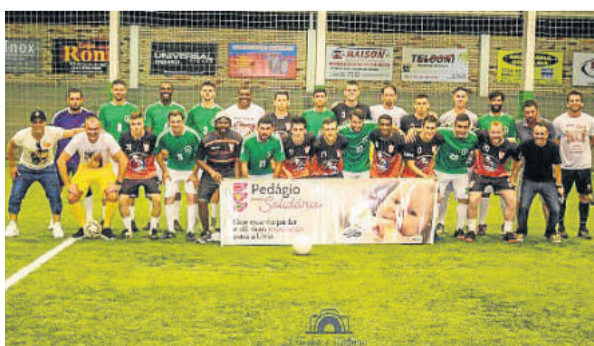
Jogo beneficente reuniu atletas, ex-atletas e árbitros de futebol