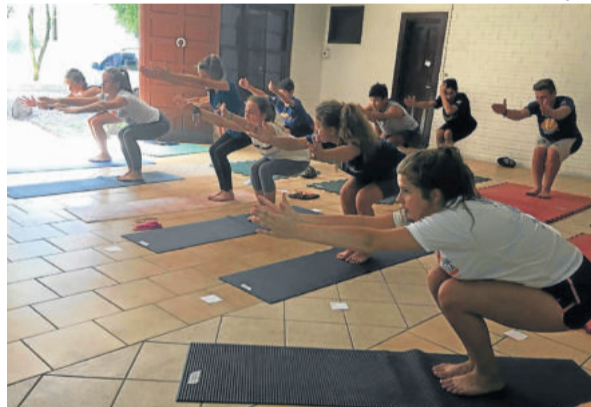
Preparação começa fora do rio