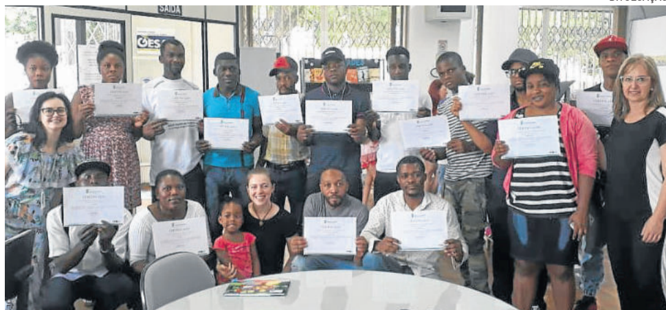
25 alunos imigrantes finalizaram o curso neste mês