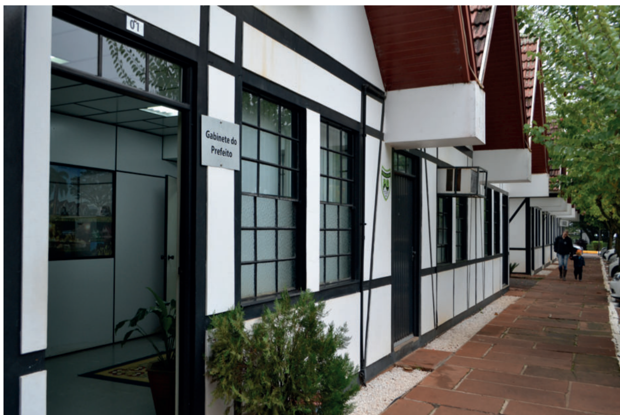
Crescimento de Teutônia foi de 6,1%

O VAF é calculado pela diferença entre as saídas (vendas) e as entradas (compras) de mercadorias e serviços em todas as empresas localizadas no município. Outras variáveis e seus pesos correspondentes são: população, 7%; área, 7%; número de propriedades rurais, 5%; produtividade primária, 3,5%; inverso do valor adicionado per capita, 2%; e pontuação no Programa de Integração Tributária (PIT), 0,5%.