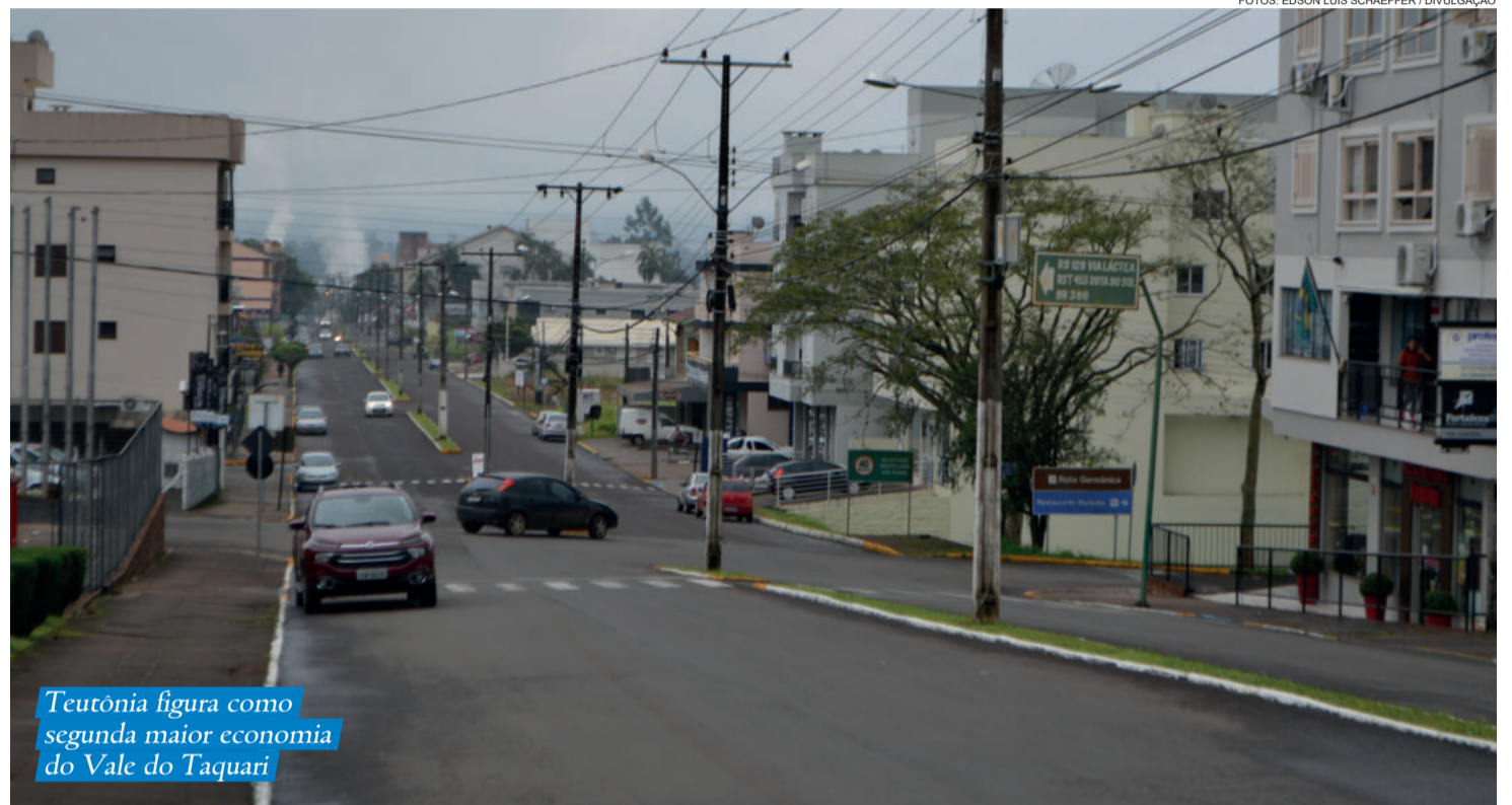
Teutônia figura como segunda maior economia do Vale do Taquari

Entre as maiores economias do Vale do Taquari, Teutônia aparece somente atrás de Lajeado, posição que já vinha ocupando. No ranking estadual, Teutônia passa da 56ª maior economia (índice 0,339251) em 2018 para a 53ª colocação (índice 0,360098) em 2019. A variação é 6,1%, o que coloca o município na segunda colocação entre as