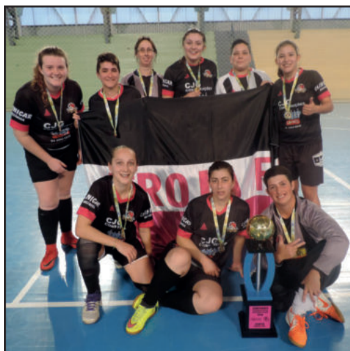
1º lugar - Tróia FC