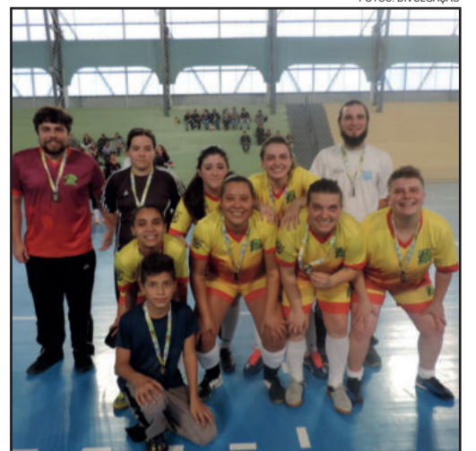
3º lugar - Damas de Ferro