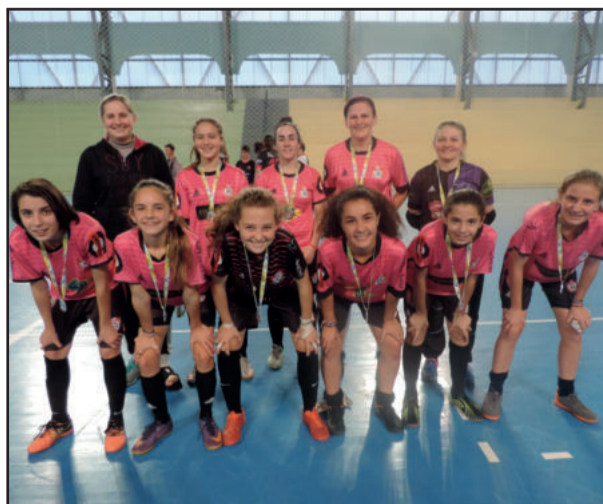
2º lugar - Vênus