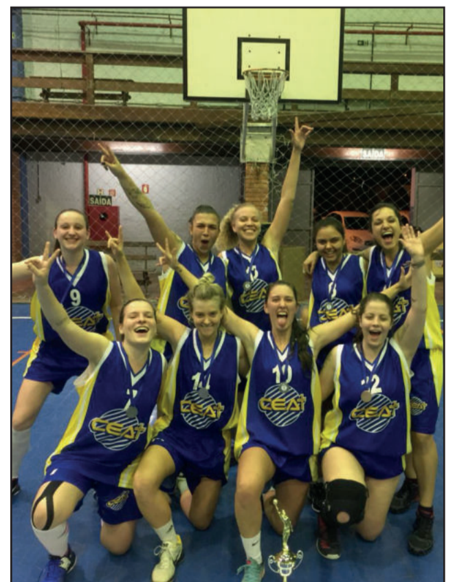
Meninas ex-atletas adultas