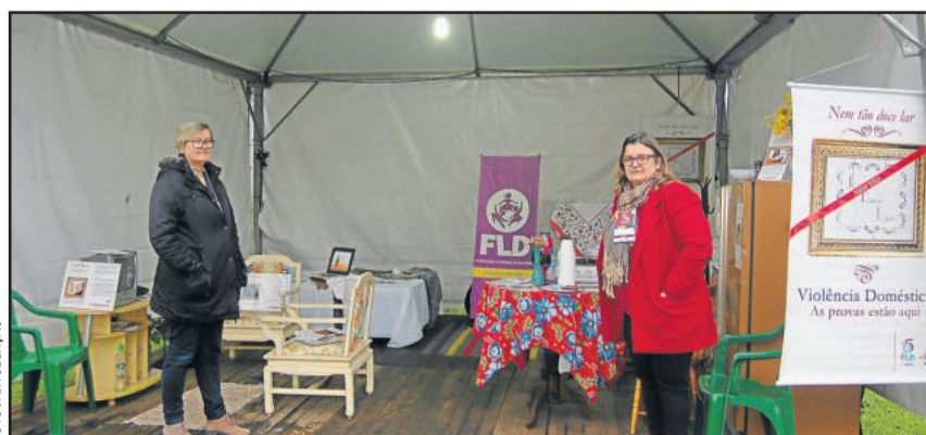
Espaço foi montado dentro do Congrenaje

Os voluntários e profissionais envolvidos na exposição da Casa planejam agora articular novas parcerias para que, futuramente, seja possível ampliar o raio de ação e expor o trabalho num espaço público, que permita a participação de toda a sociedade.