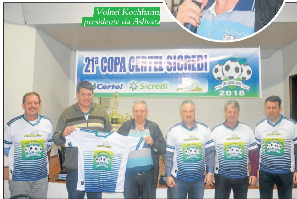
Autoridades lançaram a 21ª Copa Certel Sicredi 2018