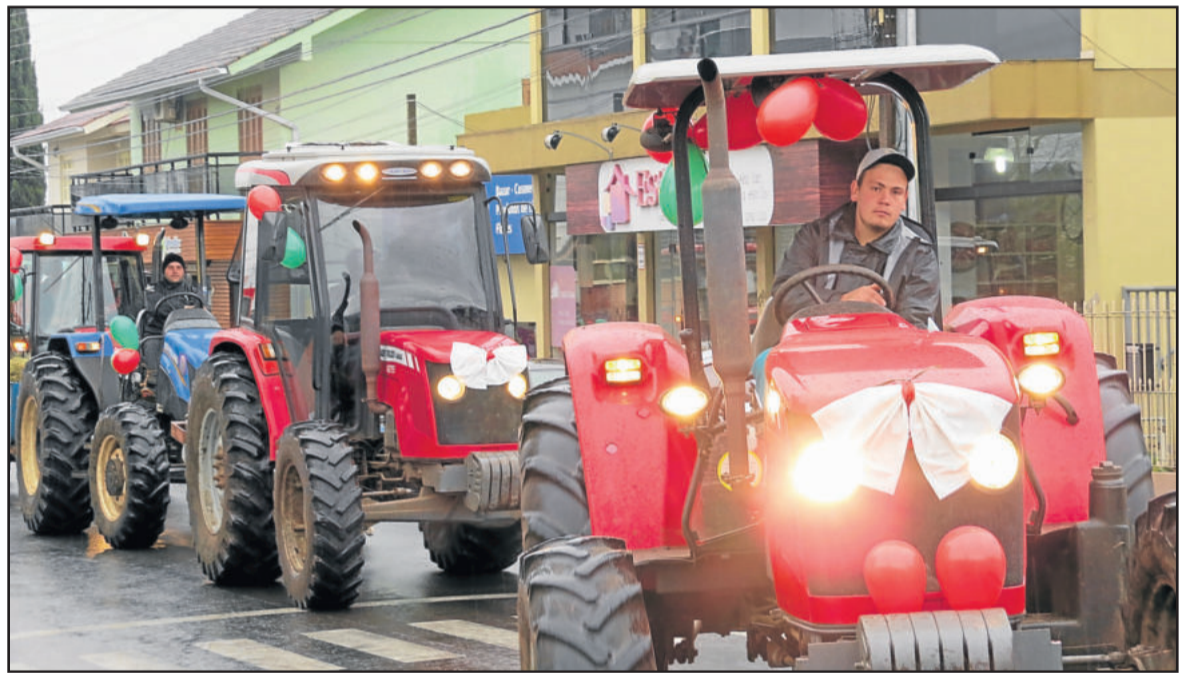
Programação iniciou com desfile pelas ruas dos bairros Centro Administrativo e Languiru

A presidente acrescentou que, mesmo com chuva, são muitos os motivos a serem comemorados.