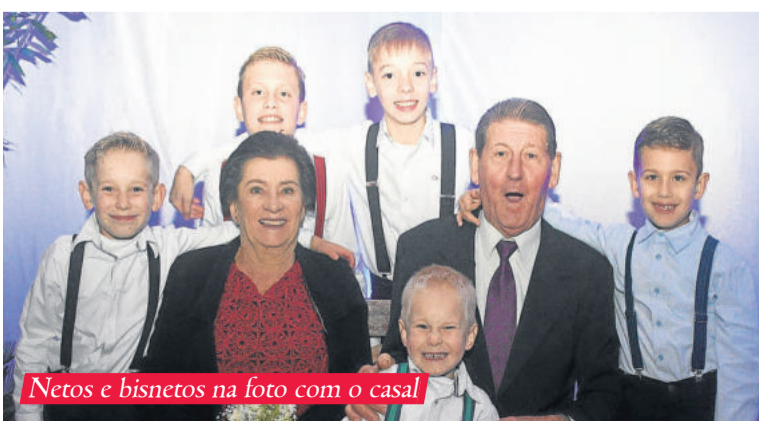
Netos e bisnetos na foto com o casal