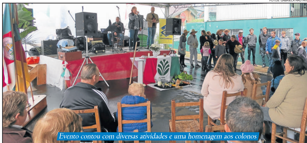
Evento contou com diversas atividades e uma homenagem aos colonos