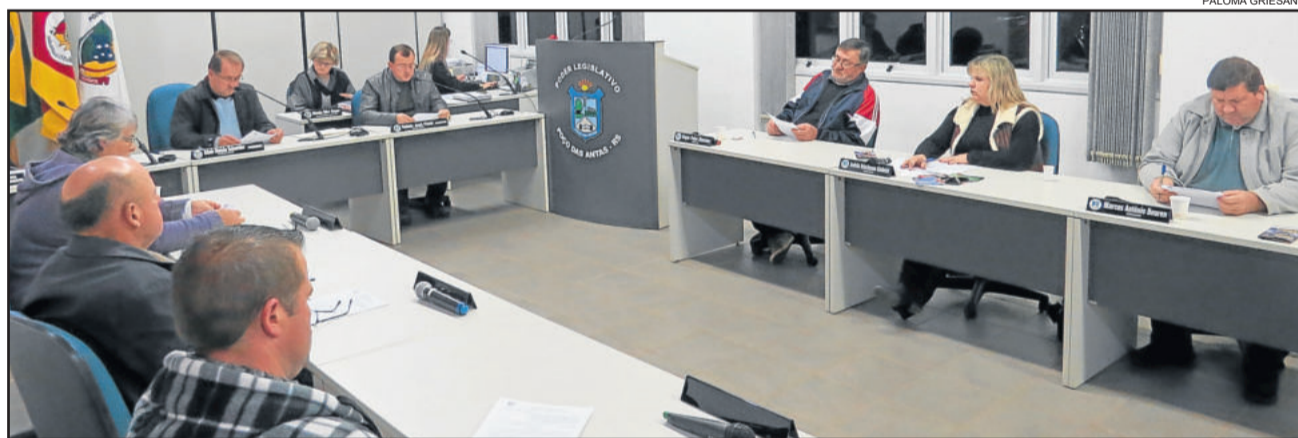
Sessão não teve uso da tribuna