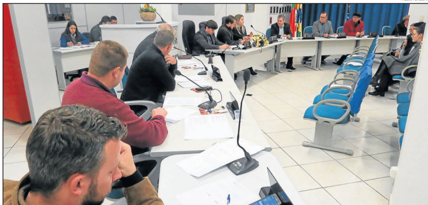
Vereadores votaram o relatório da CPP nesta quinta-feira (26/07)

A consumação do fato seria a prova da quebra de decoro. Sendo assim, o relator destacou ainda que o simples diálogo não prova a falta de decoro. Além disso, destaca que o depoimento das testemunhas indica que a