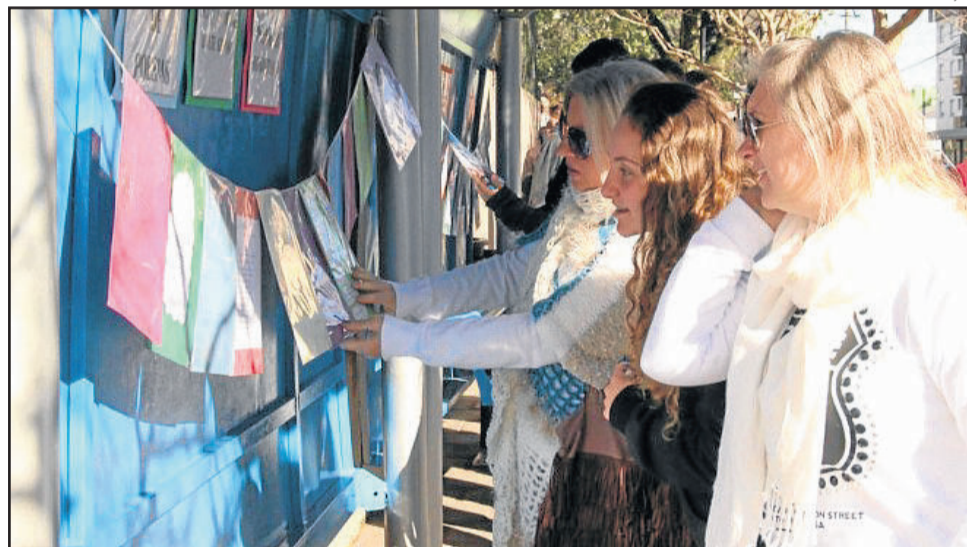
Um ano após sua criação, o projeto já recebeu premiações, incluindo o Prêmio Gestor Público Sindifisco-RS