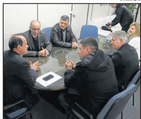
Encontro ocorreu no início da semana

muito forte da população e do poder público, desta forma, o município deu ultimato à CORSAN, pois entende que a empresa é superavitária no município e de tal forma deve respeito com os seus consumidores.