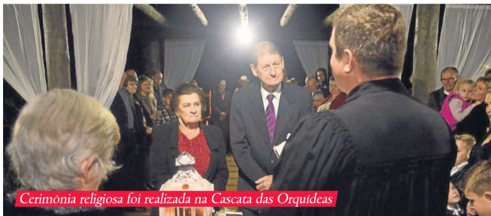
Cerimônia religiosa foi realizada na Cascata das Orquídeas