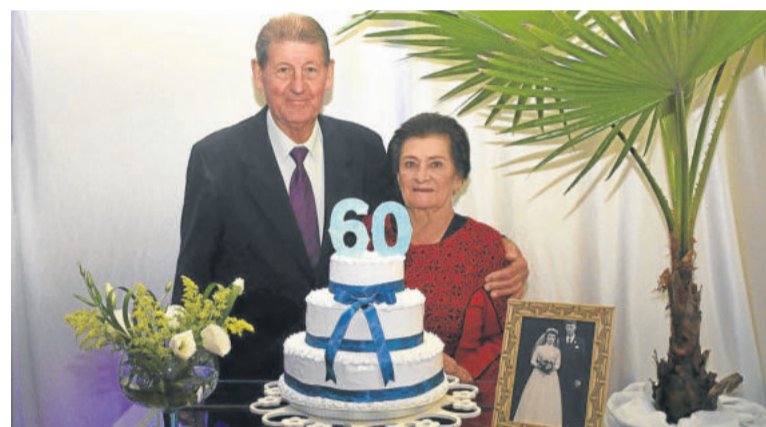
Bodas de Diamante