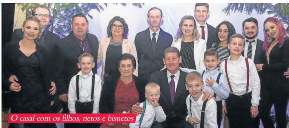
O casal com os filhos, netos e bisnetos