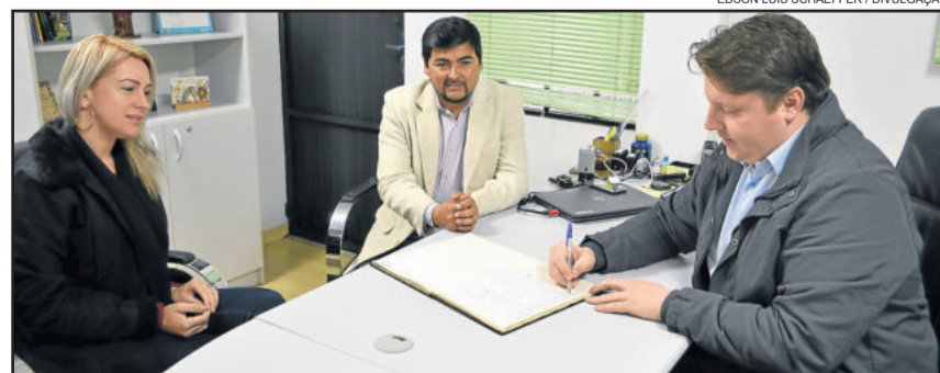
Amaral assumiu o Executivo nesta quinta-feira