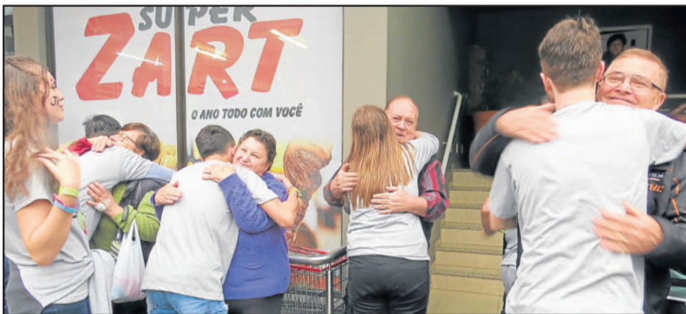
Participantes do Congrenaje distribuíram abraços para a comunidade