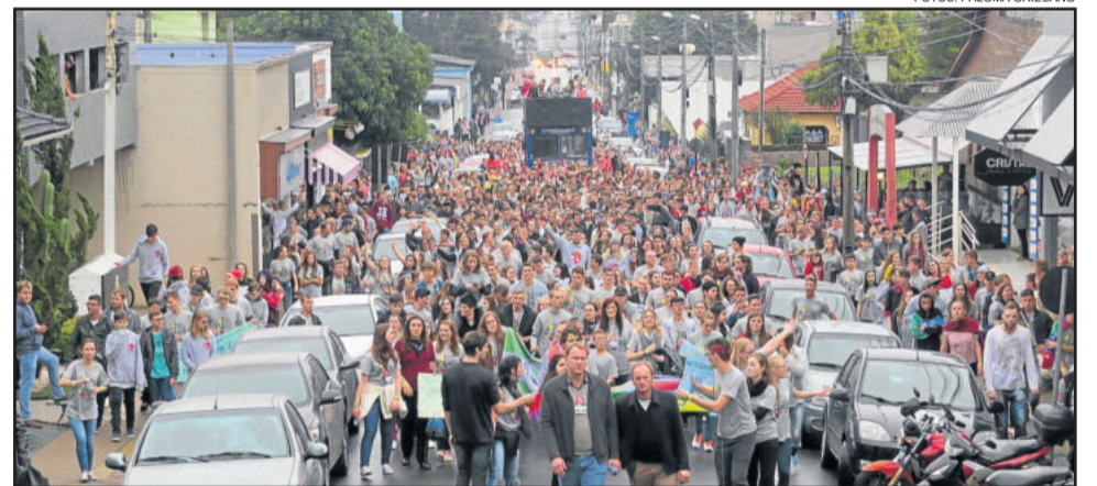
Jovens tomaram as principais ruas do Bairro Languiru