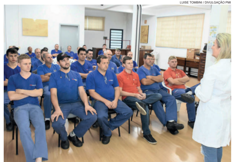
Colaboradores fazem exames e recebem orientações dentro das empresas