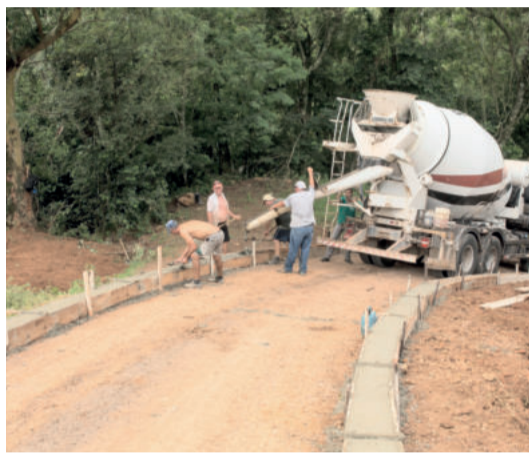
Estrada da comunidade de Ano Bom Alto

Segundo ele, o governo municipal investido em melhorias nos acessos e estradas vicinais. "Nosso município têm comunidades que precisam ser olhadas com carinho. Vamos fazer o que estiver em nosso alcance para pavimentar o que for possível", destaca.