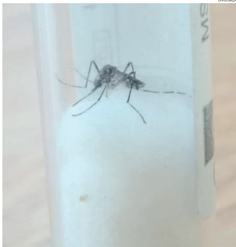
Mosquito vivo foi encontrado dentro de caixa d'água

Em janeiro, 4 de 86 amostras deram positivas