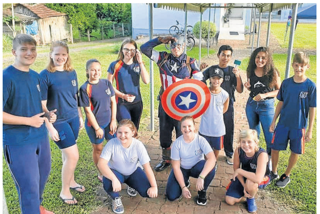
Alegria dos personagens infantis no retorno