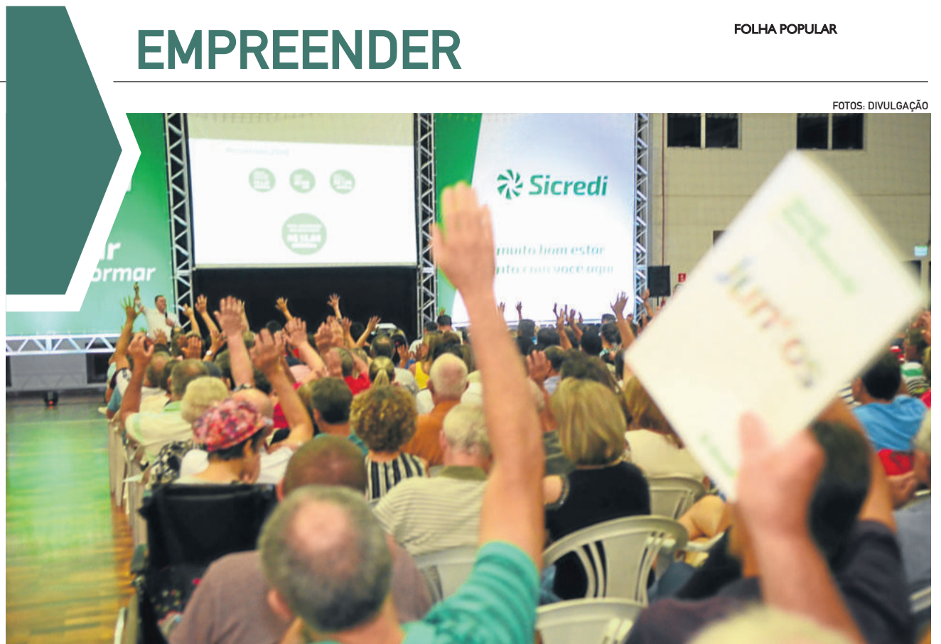
Em 2019, assembleias da Scredi Ouro Branco movimentaram 12 mil associados

Esse exemplo vem comprovar que colaboradores não são engrenagens, são pessoas, e assim devem ser tratados. Como resultados na Starbucks, a rotatividade diminuiu e a satisfação dos clientes aumentou significativamente, o que fez a empresa crescer astronômicamente.