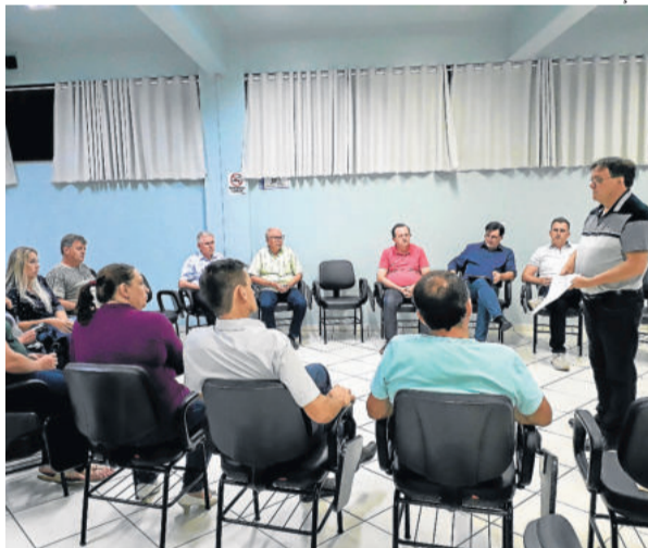
Reunião ocorreu na CIC Teutônia e antecede o processo da negociação da Convenção Coletiva de Trabalho 2020