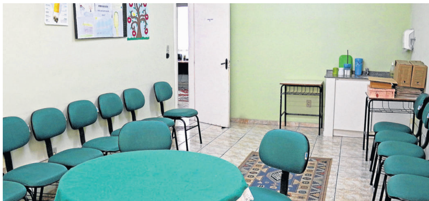
Espaços estão preparados para receber as demandas dos grupos

Neste sentido, foi determinado aos fiscais das Secretarias de Obras e Meio Ambiente para realização de nova fiscalização conjunta no intuito de averiguar todas as economias do entorno, quais encontram-se irregulares e concedendo prazo de 30 dias para adequar-se e efetuar a ligação do esgoto na rede correta.