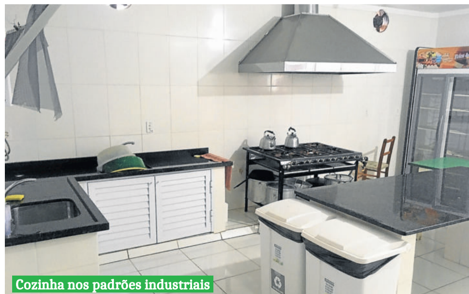
Cozinha nos padrões industriais

2019 – Colocação de piso na área da bocha, telhado, construção de casamatas, muro externo e colocação de paviess (blocos de concreto) no acesso à sede