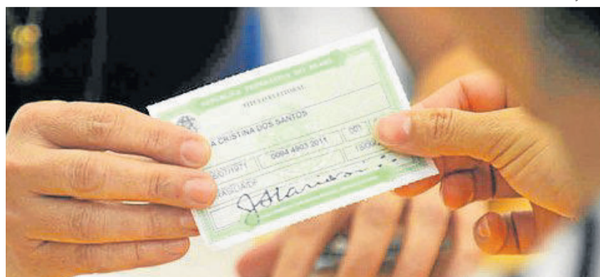
Mudanças no título eleitoral só até dia 6 de maio

No ano passado, a Justiça Eleitoral cancelou mais de 2,4 milhões de títulos de eleitores em situação irregular. O título é cancelado, entre outros casos, quando o eleitor deixa de votar e de justificar a ausência às urnas por três eleições consecutivas. É importante lembrar que cada turno de um pleito é considerado uma eleição diferente.