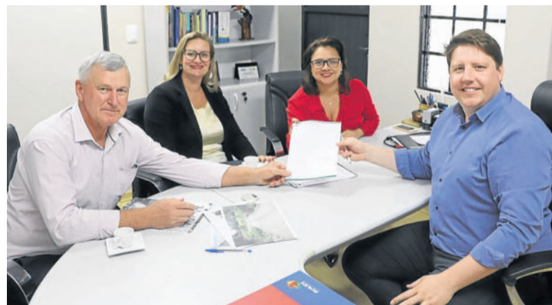
Teutônia e Westfália solicitaram à Fepam agilidade na licença ambiental para a construção de ponte

Presidente da Fepam também conheceu o Aterro Sanitário de Teutônia