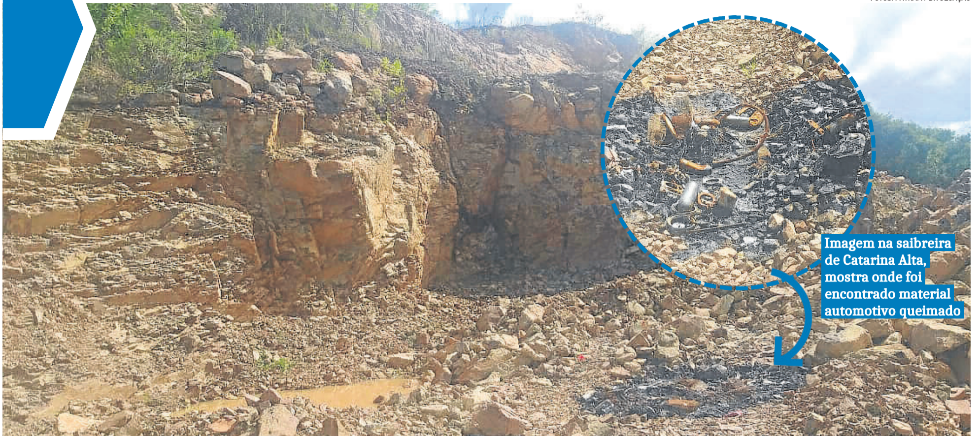
Imagem na saibreira de Catarina Alta, mostra onde foi encontrado material automotivo queimado

As saibreiras funcionam há mais de 10 anos