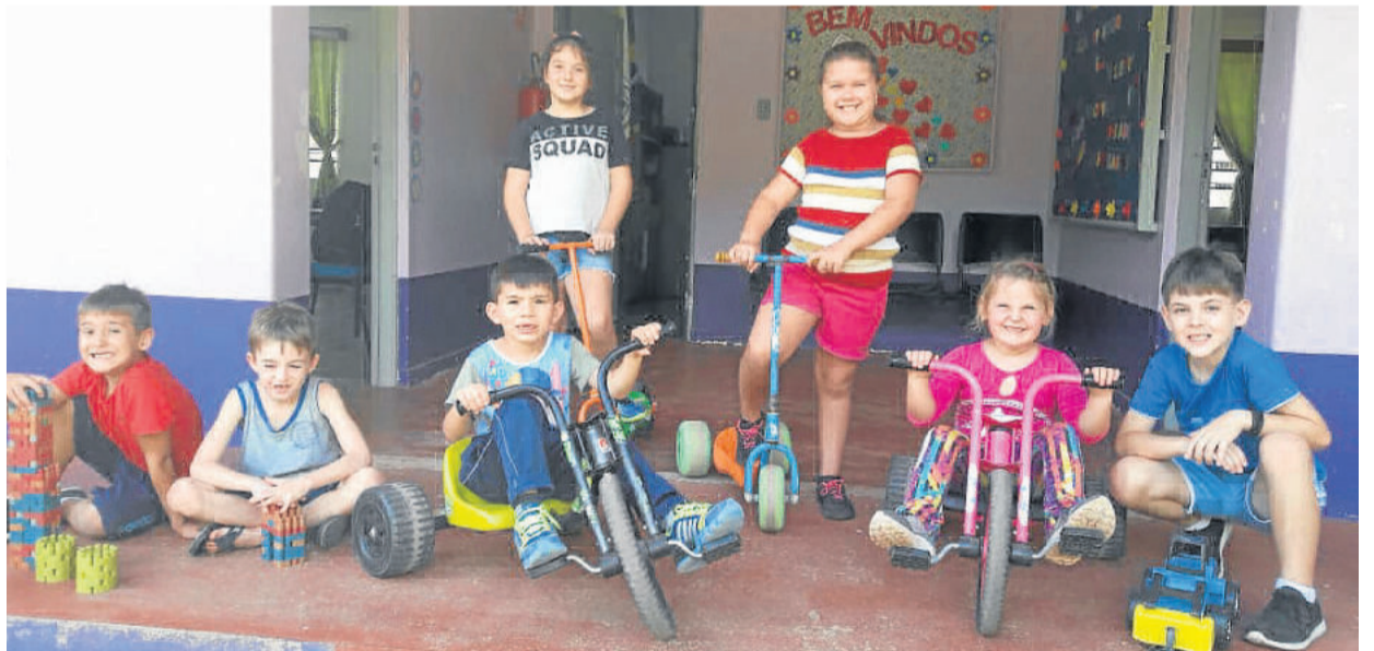
Primeira semana é de integração e brincadeiras