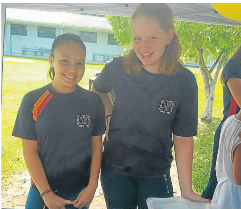
Grêmio estudantil preparou surpresa na recepção