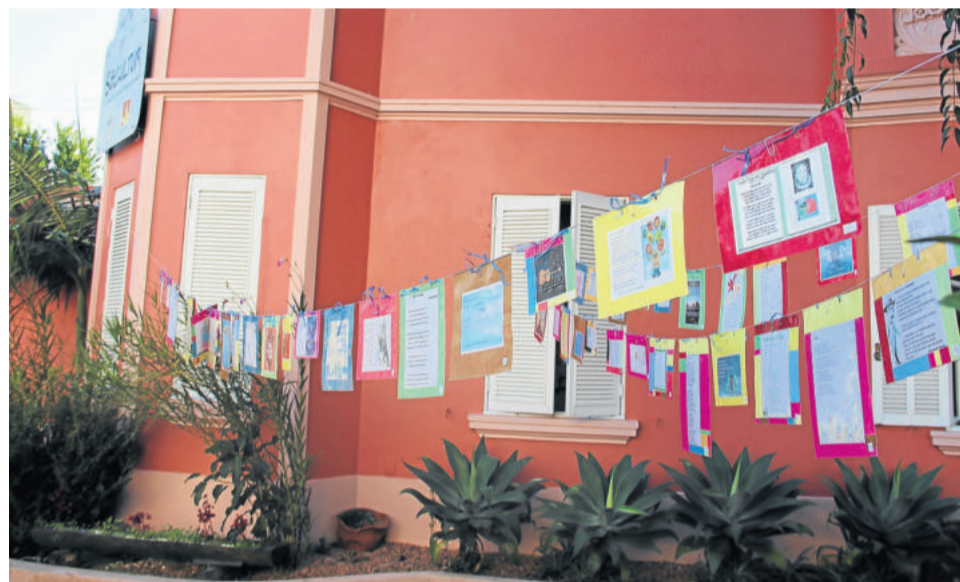
Poesia no Varal vai apresentar obras de mulheres