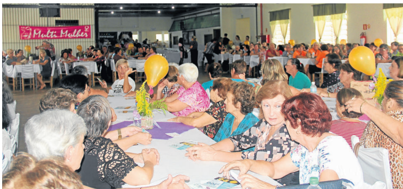
Chá da Integração, como em anos anteriores, nesta edição será em Novo Paraíso