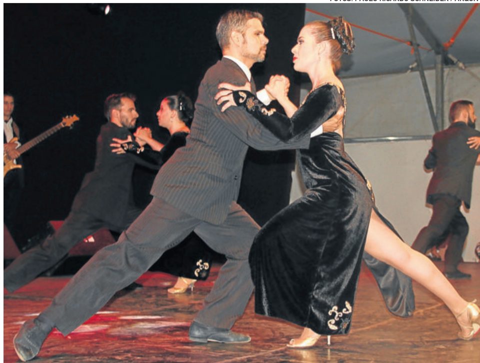
Espectáculo de tango e folclore argentino é uma das atrações do Multimulher