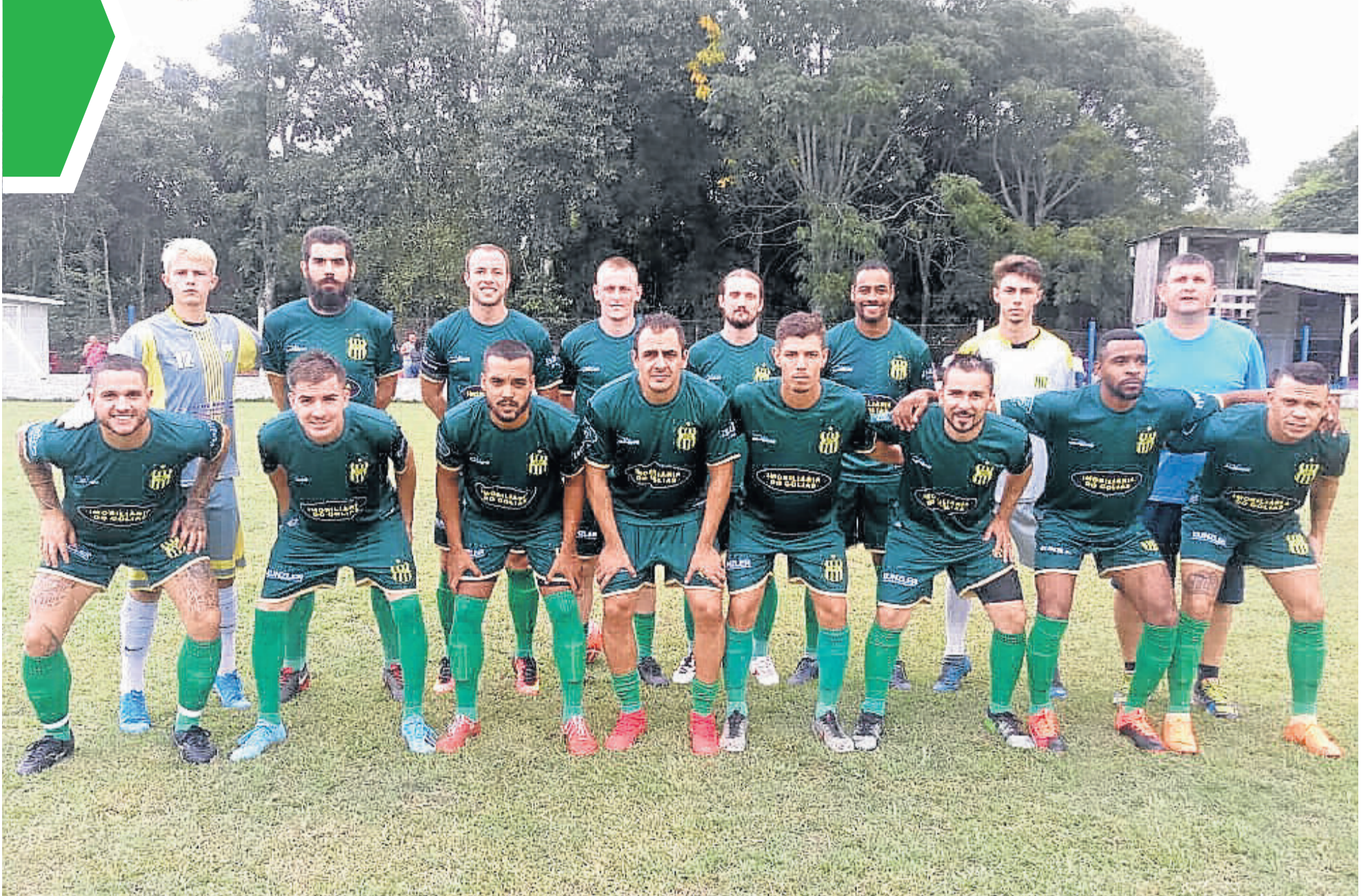
Ouro Verde faz segundo jogo em casa e encara líder do grupo