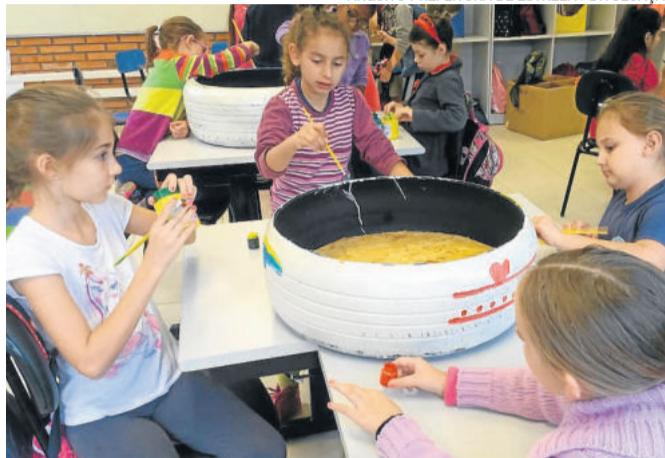
ARQUIVO PREFEITURA DE ESTRELA / DIVULGAÇÃO