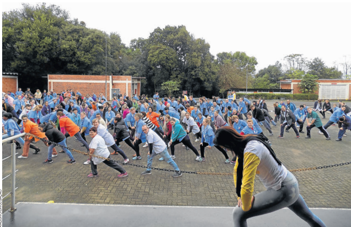
Teutônia enfrentará cidade do Ceará no Dia do Desafio

No dia 30 de maio, toda a comunidade está convidada a praticar, por pelo menos 15 minutos consecutivos, qualquer atividade física entre a 0h e 20h do dia. Neste ano, Teutônia enfrentará a cidade cearense Jaguaruana, conforme sorteio realizado no dia 7 de maio pelo Sistema Fecomércio-RS/Sesc, organizador da mobilização.