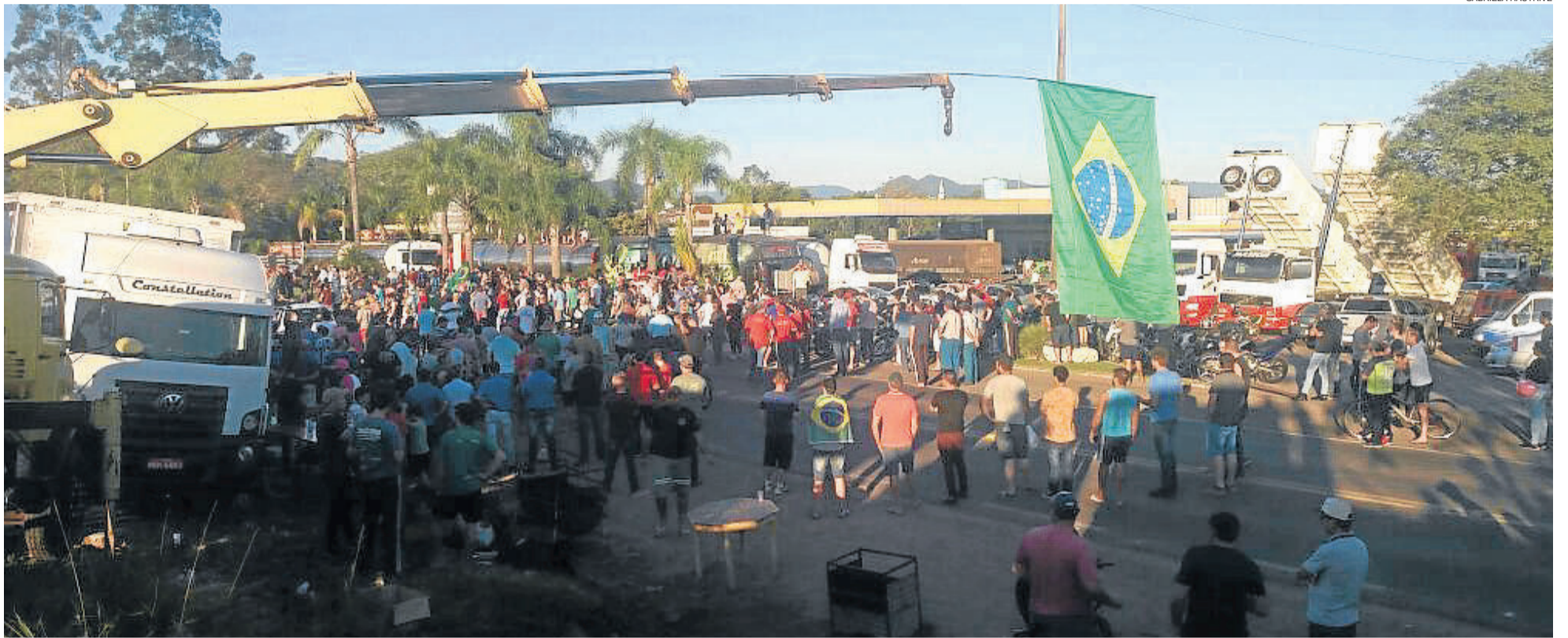
Município realizou uma manifestação em apoio aos caminhoneiros e solidária às reivindicações de redução nos preços dos combustíveis e da redução de carga tributária. TEUTÔNIA > 6 e 7