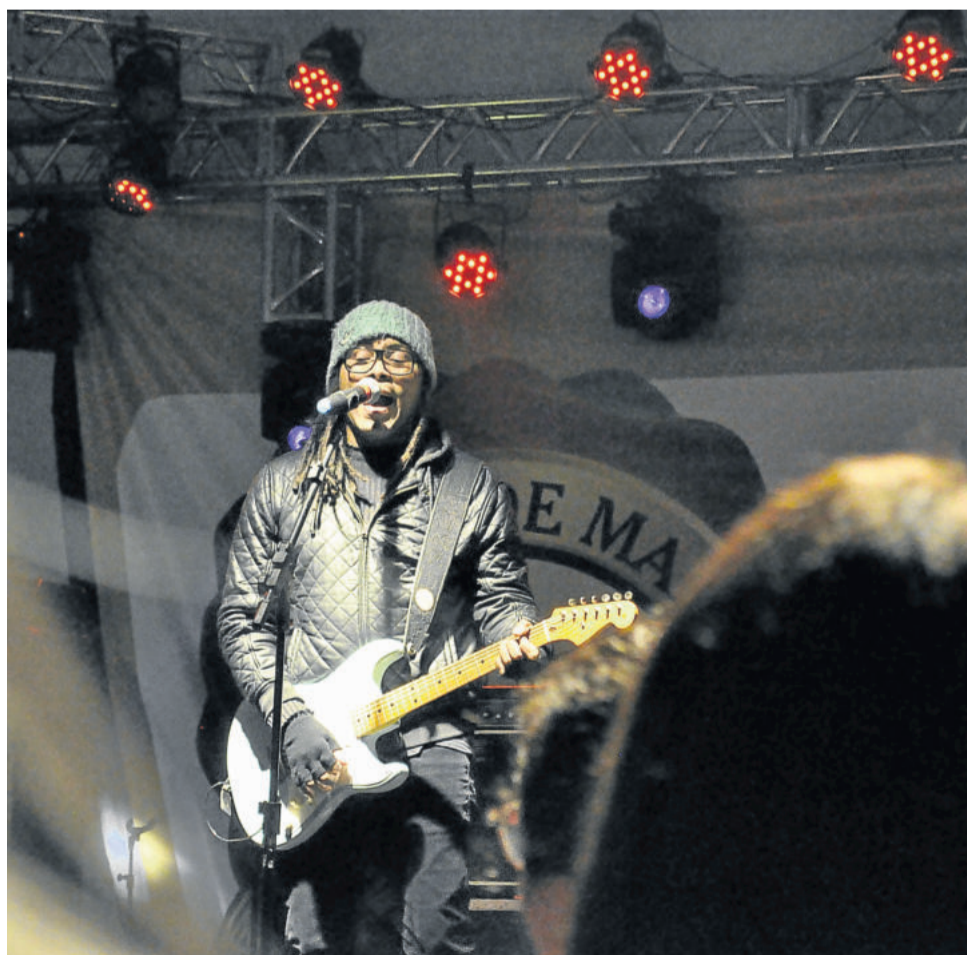
Serginho Moah levou ao palco da Festa de Maio os maiores sucessos da Banda Papas da Língua

Público cantou e dançou ao som de Serginho Moah e Banda