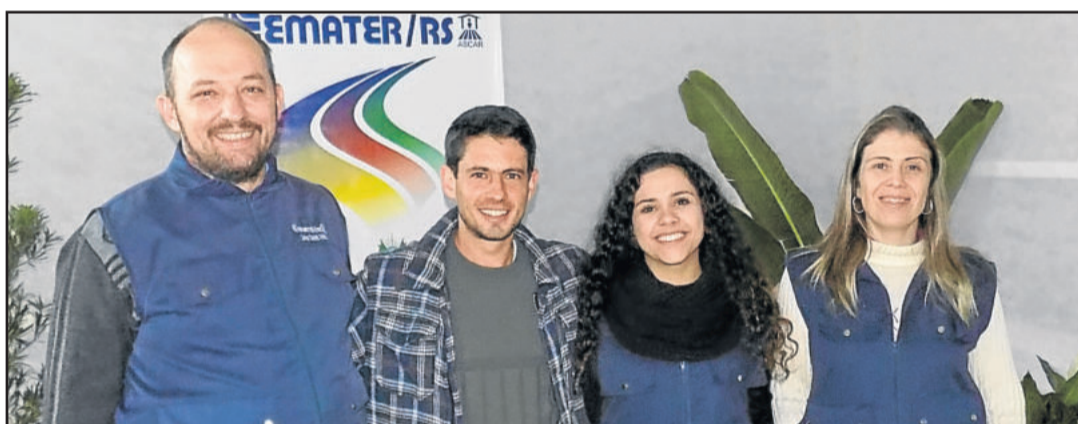
Intenção é mostrar sistemas de produção ecologicamente corretos