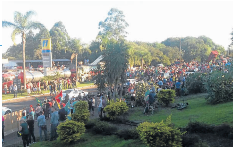
Concentração foi na Rota do Sol, junto à Certel Artefatos

O presidente da República, Michel Temer, anunciou na noite de domingo um novo acordo com os representantes dos caminhoneiros. O governo cedeu a todas as exigências da categoria e anunciou uma redução de R$ 0,46 no valor do diesel vendido aos consumidores, válido por 60 dias. Depois, os reajustes serão mensais até dezembro.