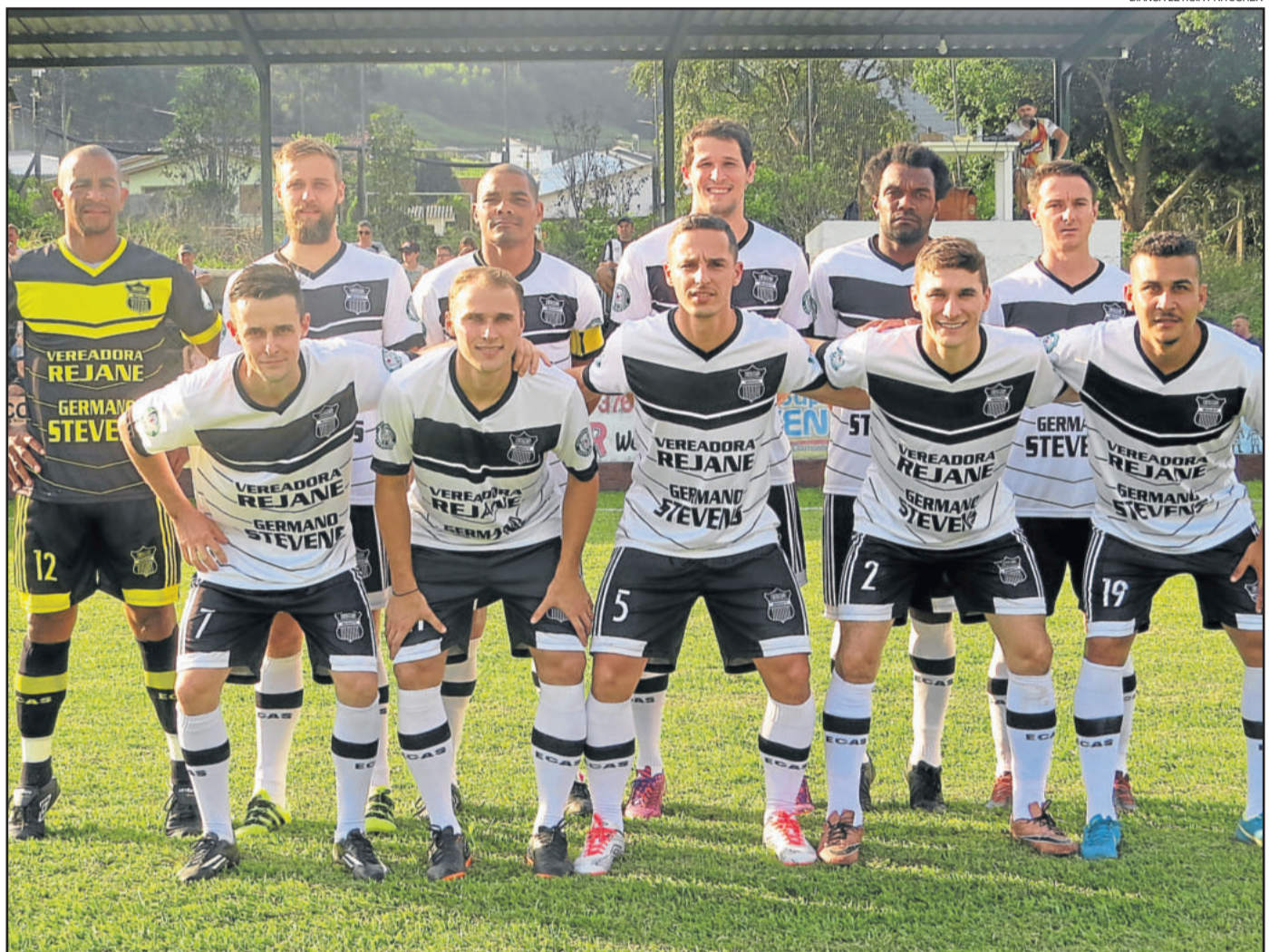
ECAS venceu o Esperança fora e volta a enfrentar o Juventude de Brochier