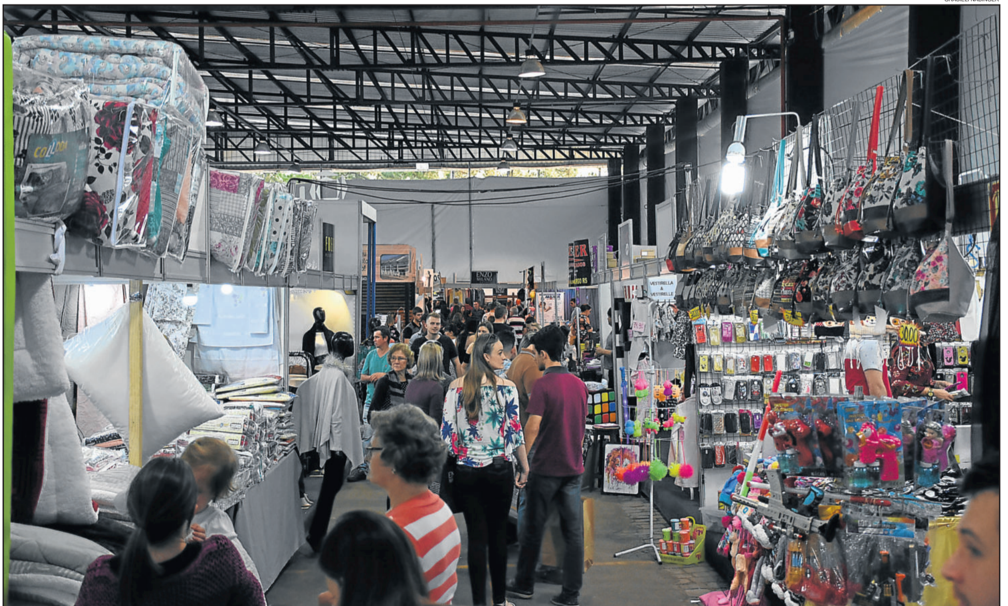
Expositores apresentaram suas marcas e produtos na feira industrial, comercial e de serviços

A 15ª edição da Festa de Maio foi uma realização da CIC Teutônia, com patrocínio máster de Sicredi, patrocínio ouro de Certel e Languiru, patrocínio prata de Cervejaria TeutoBier e patrocínio bronze de Fruki, produção de AM9 Produções e apoio da Prefeitura de Teutônia.