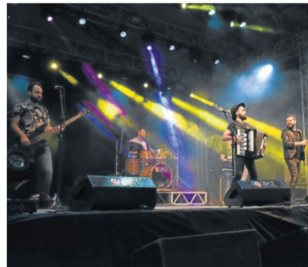
Banda Eh Expresso