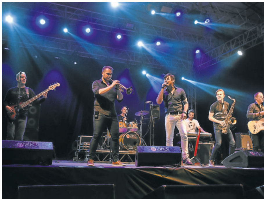
Porto do Som