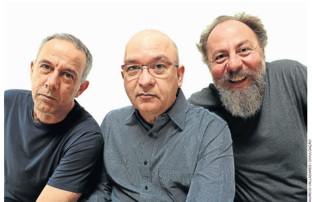
Paralamas do Sucesso

Mais informações pelo telefone (51) 3714-7000, ramal 5949, ou pelo e-mail bilheteria@univates.br .