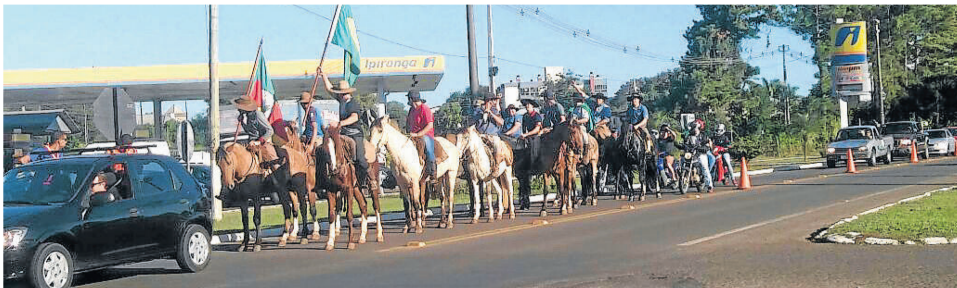
Veículos, cavalos, tratores, bicicletas e pedestres participaram da manifestação

Na visão dele, é hora de dar um basta! "A sociedade já clamou muito por reforma política, por reforma tributária, para economizar nos gastos públicos, mas nada disso acontece. Agora, houve um basta! Começamos pelos caminhoneiros, agora todos apoiam - indústria, comércio, serviços. O país está todo parado. E chega! Vamos lá! O Exército, a Força Nacional tem que tomar conta, convocar eleições diretas já e todos que já tiveram cargo político estão fora e vamos começar um país novo, do zero, para dar exemplo a essa juventude que está vindo aí".