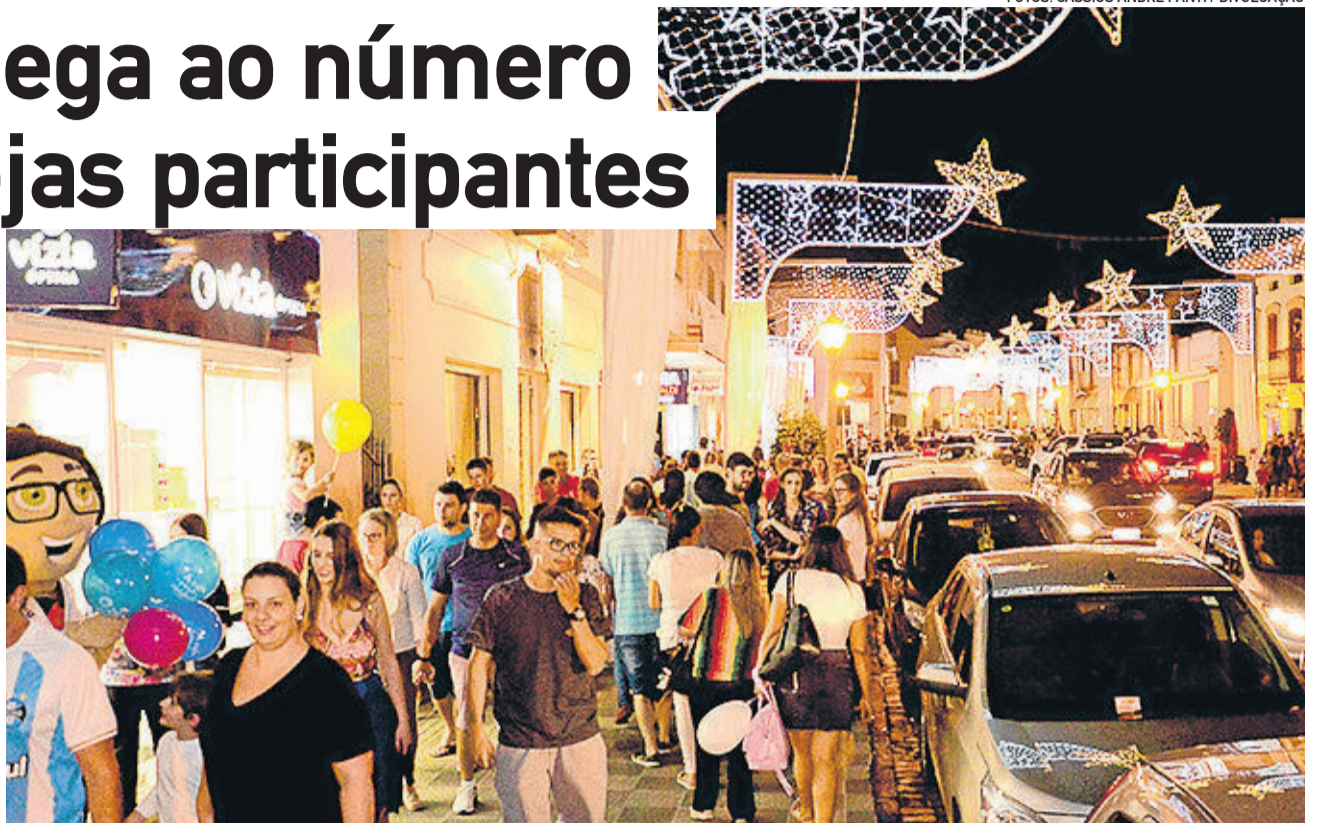
Noite Branca movimenta o comércio de Garibaldi às vésperas do Natal

Mais informações podem ser obtidas na Apeme, na CDL ou na CIC, pelos telefones 3462-2755, 3462-3365 ou 3462-8500, respectivamente. A 6ª Noite Branca, que integra o Natal Borbulhante 2019, será realizada com qualquer condição climática.