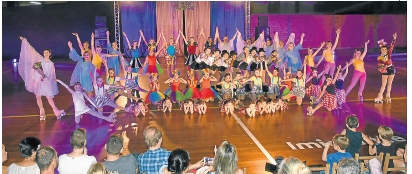
Patinadoras ensaiaram durante todo o ano para a apresentação de fim de ano