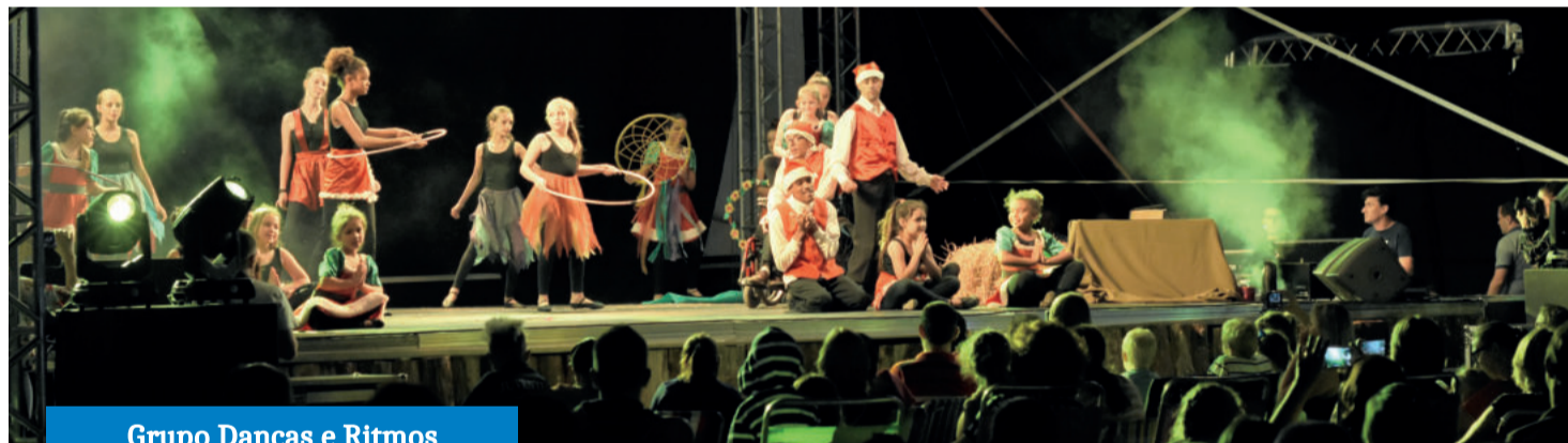
Grupo Danças e Rítmicos