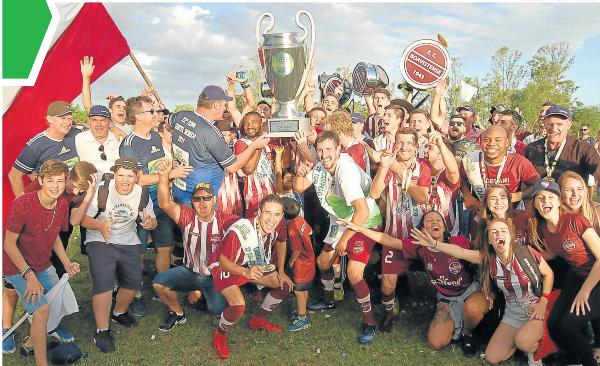
Boavistense campeão regional 2019 - Série A - Titulares

REGIÃO ▶ 22ª COPA CERTEL SICREDI ASLIVATA 2019