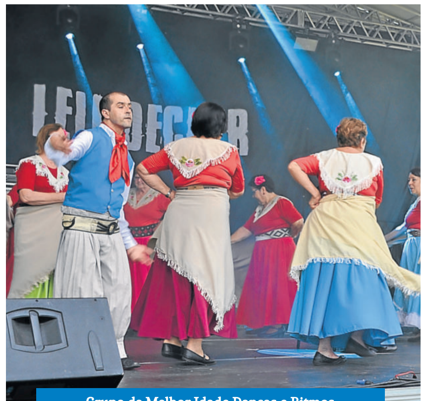
Grupo da Melhor Idade Danças e Ritmos

A programação do sábado (30/11) iniciou por volta das 17h30 com apresentação do Grupo Danças e Ritmos do Cemef, que dançou seis músicas, e da Melhor Idade, que apresentou duas coreografias. Na sequência, subiu ao palco a inverno juvenil do CTG Rincão das Coxilhas que apresentou, em cerca de meia hora, nove danças tradicionalistas. Além disso, teve apresentações do Coral Lira, Oficinas de Danças do Colégio Teutônia e show da Banda Alpha Rock de Imigrante.