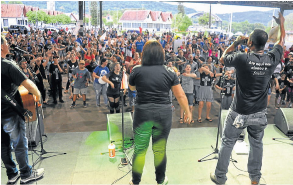
No Pavilhão Multiuso da Prefeitura foi realizada uma celebração

cha estamos fazendo isso de uma forma visual e prática”, explica. A Marcha foi organizada pelas igrejas, mas aberta ao público em geral. “Não estamos fazendo uma marcha das igrejas, mas uma marcha de toda a população, de todas as pessoas”, pontua.