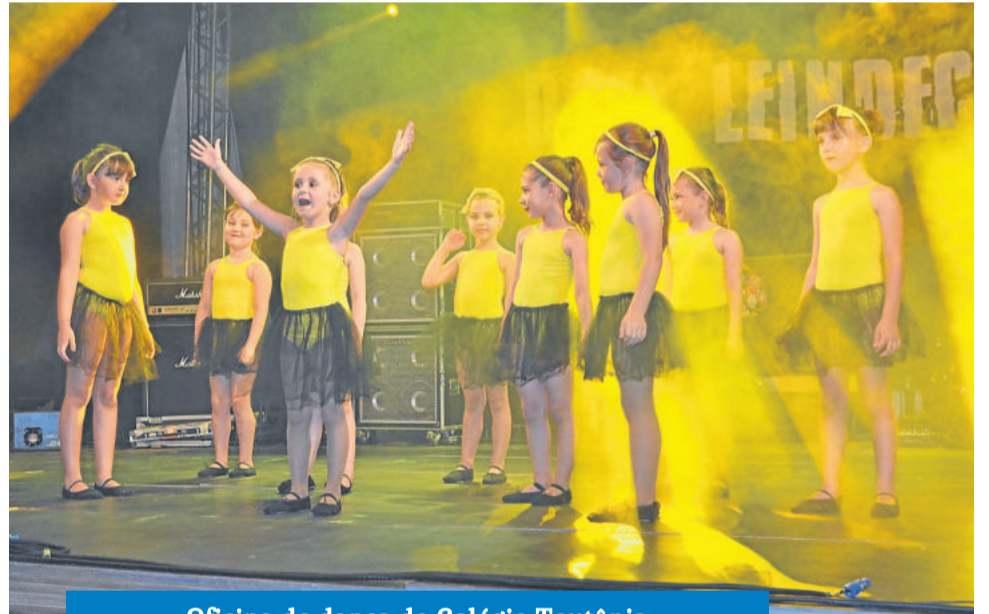
Oficina de dança do Colégio Teutônia