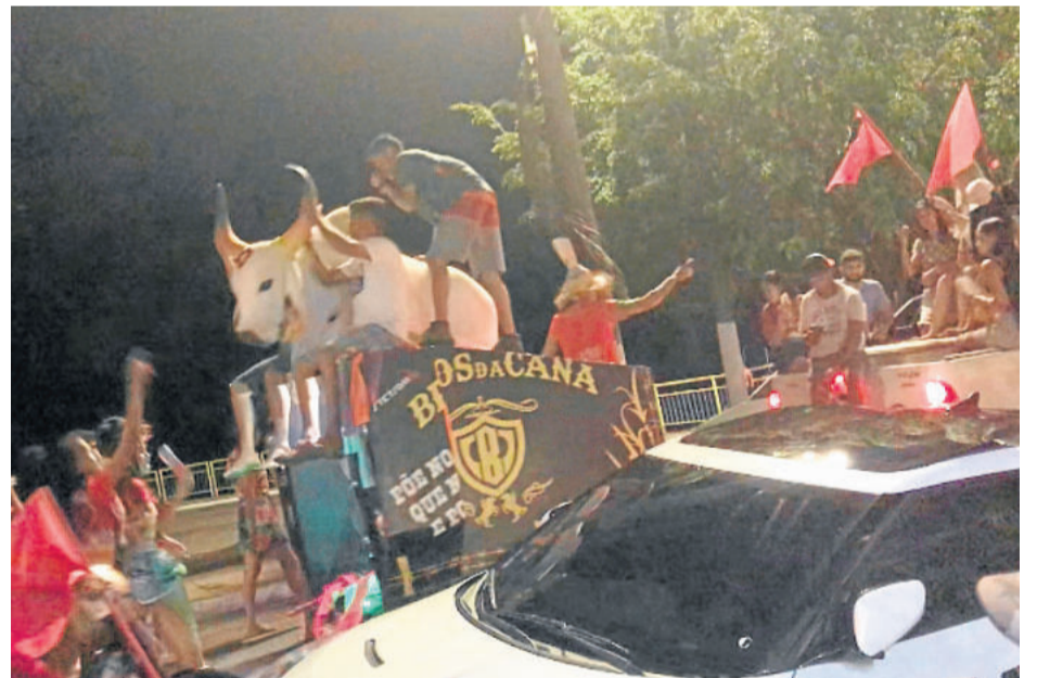
Festejo popular em Humaitá

Por lá, nós chegando de fusca, é mais ou menos como aqui na cidade quando chega um Ford 29. Momento único. E o povo vinha nos questionar sobre as mais diversas coisas.