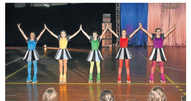
A magia do circo foi o tema central da apresentação