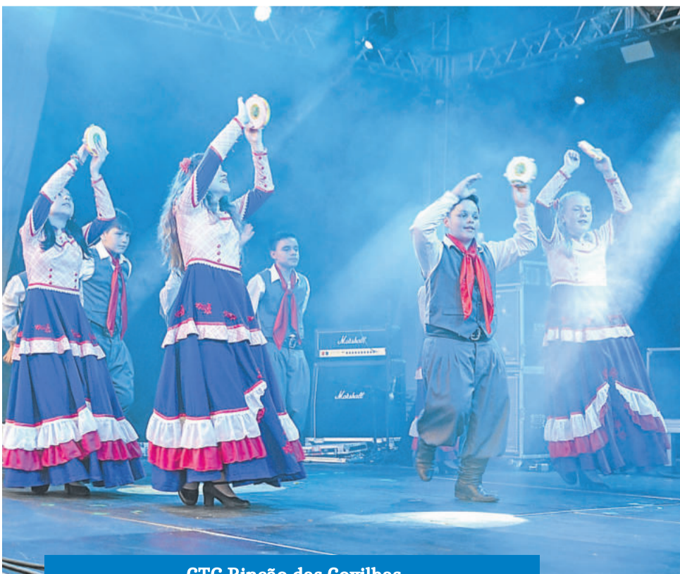
CTG Rincão das Coxilhas