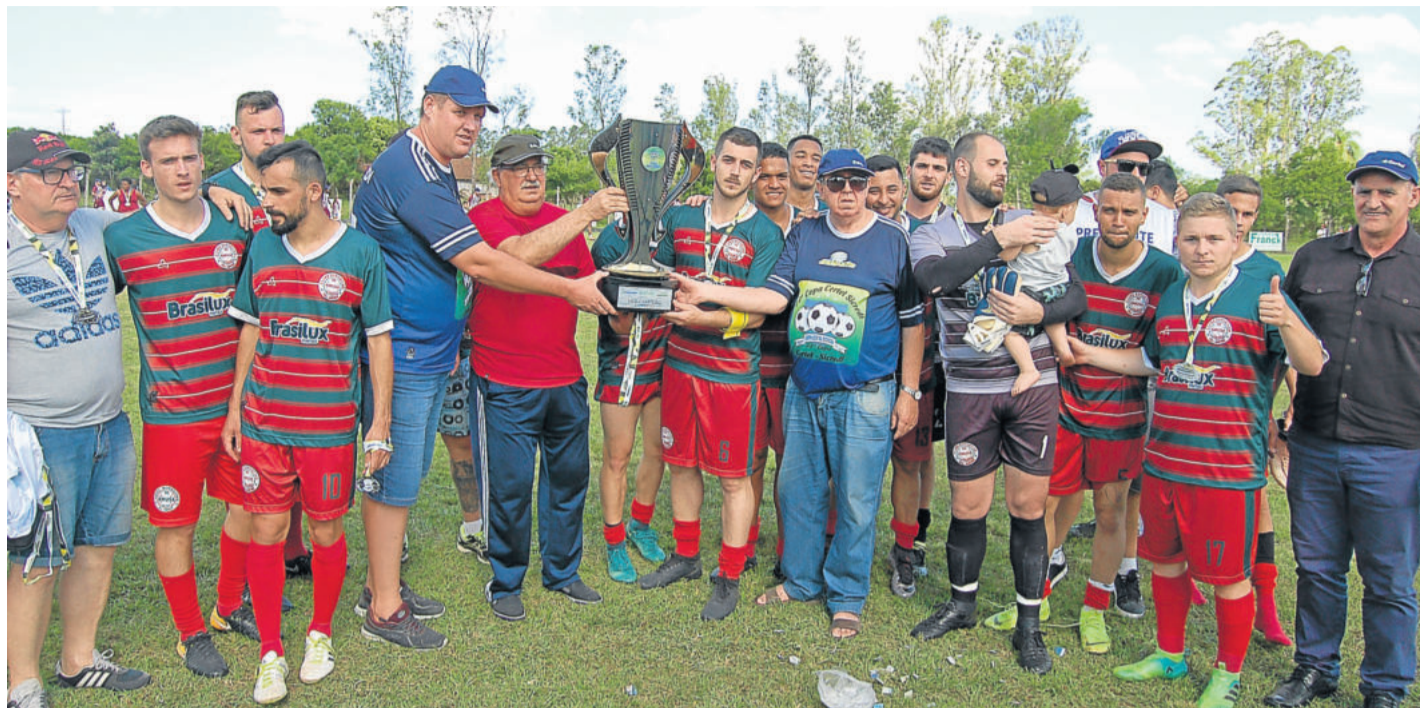
Santo André, vice-campeão dos Aspirantes