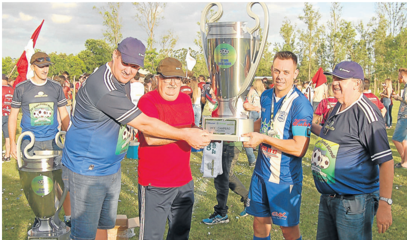
Assespe, vice-campeã regional da Série A - Titulares