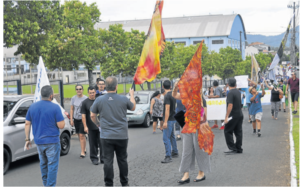
Com bandeiras e cartazes, público levou sua mensagem