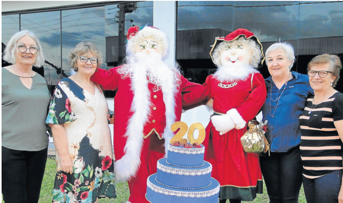
Voluntárias reuniram-se semanalmente para confecção da “Família Noel”