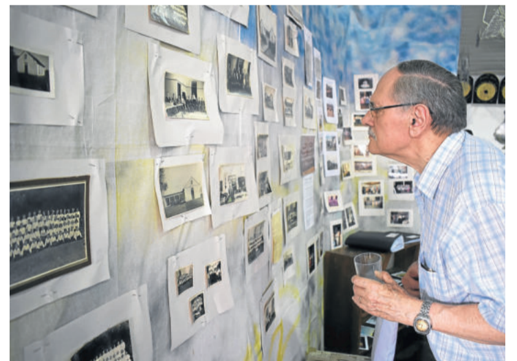
No ginásio da comunidade, havia exposição de fotos

O prédio da instituição passou por melhorias ao longo dos anos. Conforme a diretora, houve repintura das paredes e reforma do assoalho. Contudo, a estética antiga permaneceu enquanto a escola se adequa aos tempos modernos. Em 1966, foi feita a parte do meio do prédio, e em 1969, a segunda parte. Em 2012, conforme a diretora, também foram feitos banheiros novos.