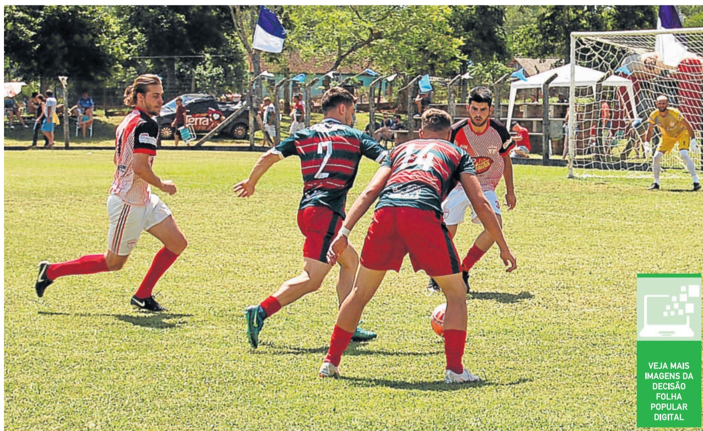
Santo André precisava vencer, mas foi o Estudantes que saiu em vantagem e com o empate foi campeão