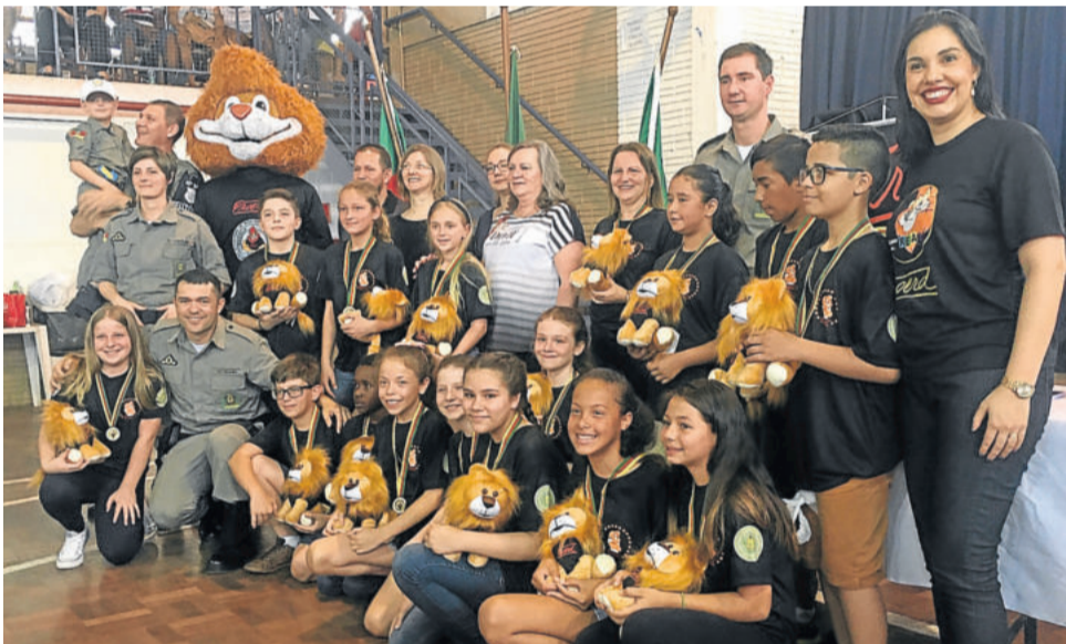
Alunos com as melhores redações receberam medalhas