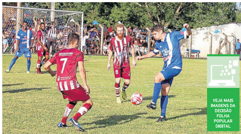
Assespe tomou a iniciativa, mas o empate garantiu o título ao Boavistense