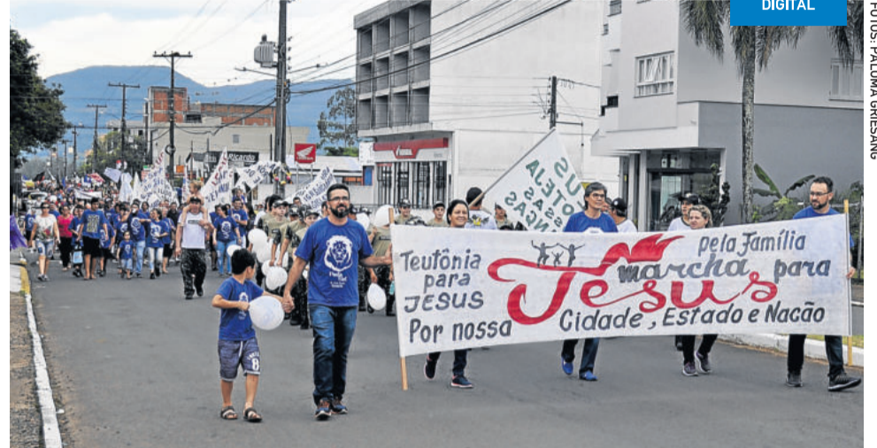
Marcha se concentrou na Avenida 1 Leste até a Prefeitura