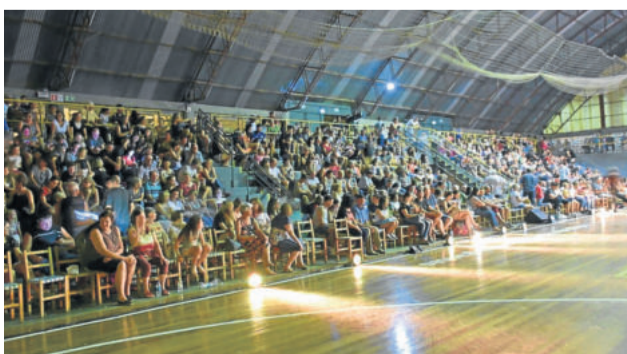
Centenas de espectadores que prestigiaram o show