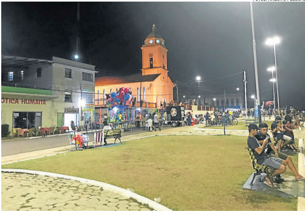
Noite em Humaitá