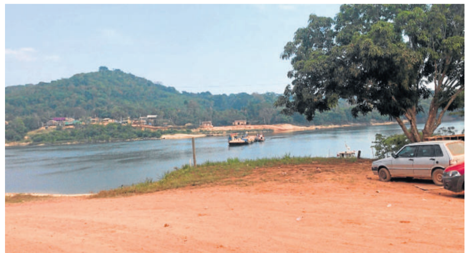
Balsa sobre o rio Aripuanã