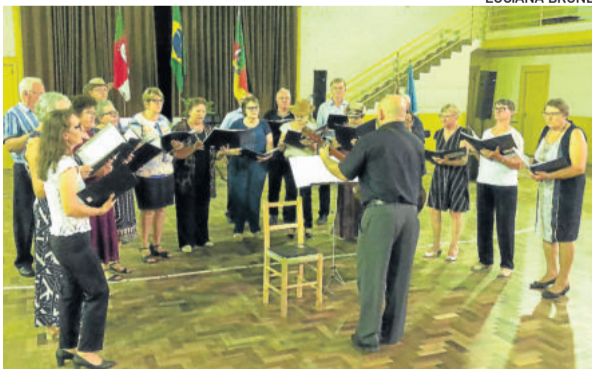
Coro Misto Alegria apresentou duas músicas