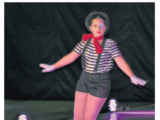
Figurinos completaram a beleza do show