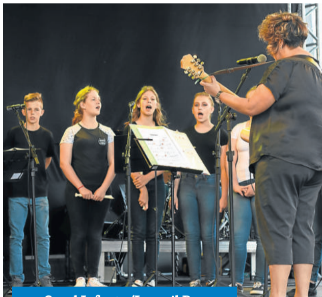
Coral Infante/Juvenil Paz