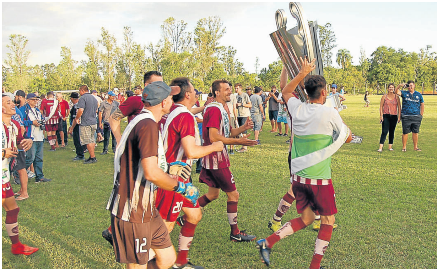
Boavistense iniciou as comemorações em Venâncio Aires