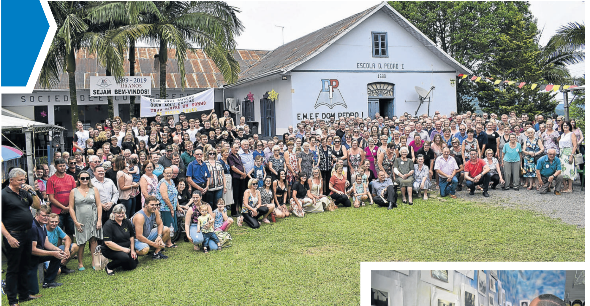
A ex-comunidade escolar teve a oportunidade de diversos reencontros durante evento de celebração