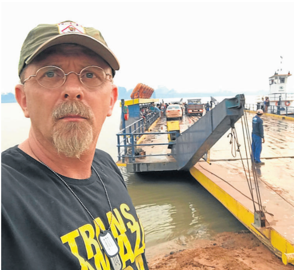
O alemão e a balsa