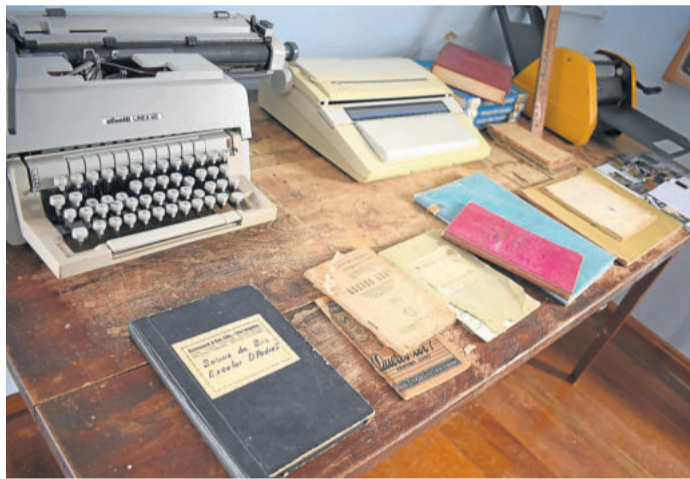
Materiais escolares de outrora foram expostos nas dependências do prédio