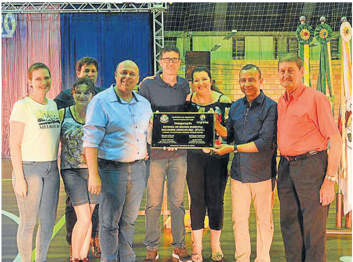
Primeira etapa foi oficialmente entregue