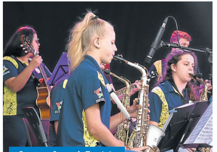
Orquestra Jovem de Teutônia