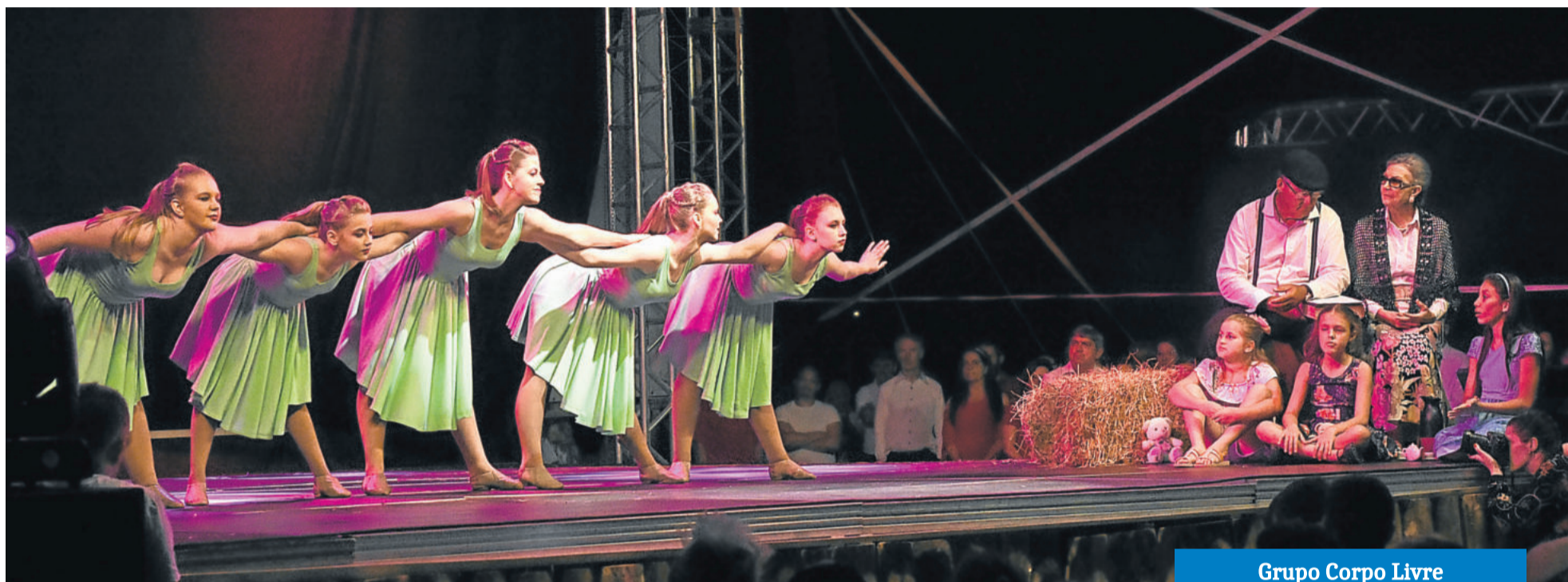
Grupo Corpo Livre